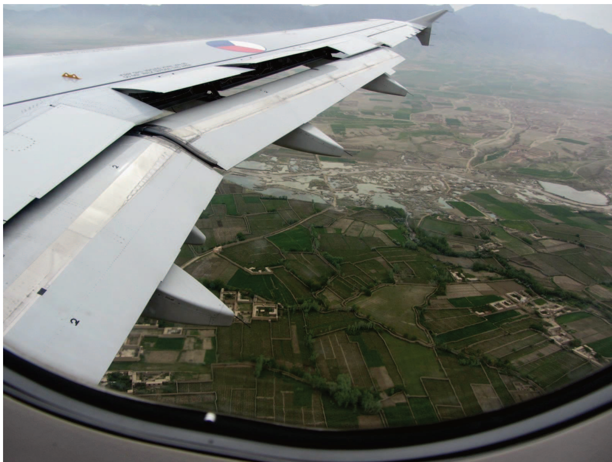
Příloha č. 4: Pohled z dopravního airbusu A319 AČR těsně před přistáním na základnu Bagram v provincii Parwán. Na fotce jsou vidět obydlí místních obyvatel tzv. kaláty a polička k nim přiléhající.