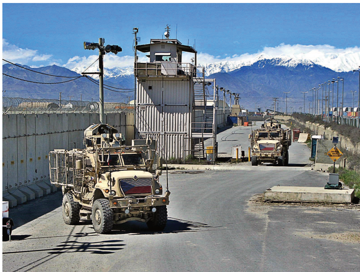
Příloha č. 3: Vozidla MRAP 2. strážní čety přijíždějící před zahájením patroly k bráně základny Bagram tzv. ECP-10 v pozadí strážní věž a pohoří pokryté ještě začátkem dubna sněhovou čepicí.