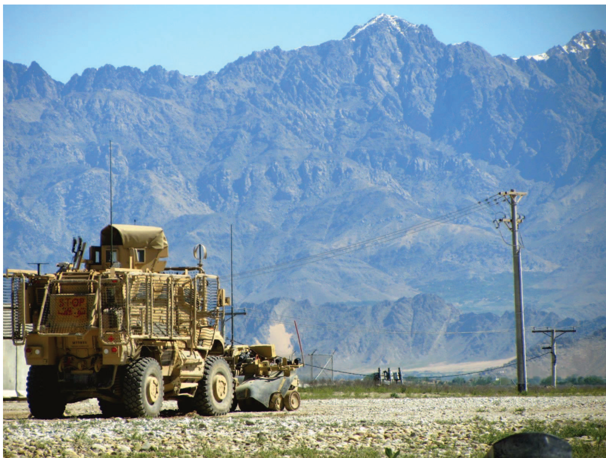
Příloha č. 2: Pohled na pohoří Hindúkuš, tyčící se nedaleko jižní strany základny Bagram. V popředí vozidlo MRAP (Mine Resistant Ambush Protected) s připojeným rollerem vpředu pro ochranu proti IED (Improvised Explosive Device).