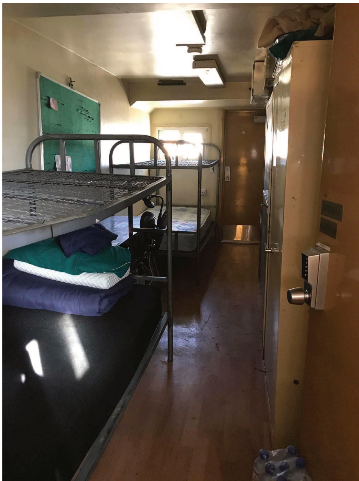
Příloha č. 7: Ubytování na základně Bagram pro vojáky, kteří zde tráví šest měsíců bez svých rodin a přátel. Pro někoho i tak pětihvězdičkový hotel...