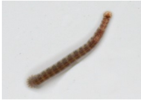
CHOBOTNATKA (rod Piscicola )

Jedná se o rod vodních pijavic živících se rybí krví.