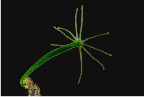
NEZMAR (rod Hydra )

Typická skupina řádu nezmarů, kteří vynikají schopností regenerace a na rozdíl od jiných žahavců nevytvářejí pohyblivé stádium – medúzu.