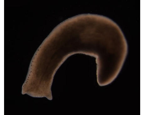
PLOŠTĚNKA (rod Polycelis )

Tento rod ploštěnek je charakteristický větším počtem očí. Při bližším zkoumání obrázku jich zahlédnete mnoho v řadě.