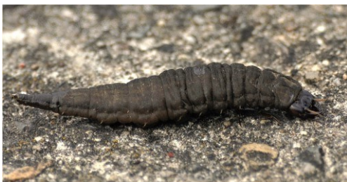
VODOMIL (řád brouci)

Řada zástupců hmyzu vytváří ve vodě žijící larvy, které se značně liší vzhledem i způsobem života od dospělců: