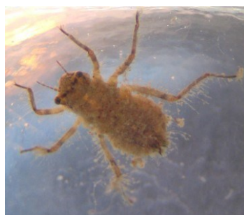
VÁŽKA (řád vážky)