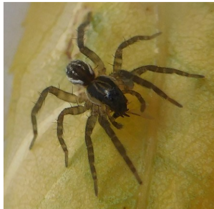
SLÍDÁK (rod Pirata )

Rod Pirata zahrnuje pavouky schopné se potápět a plavat. Některé druhy dokonce dokáží běhat po vodní hladině.