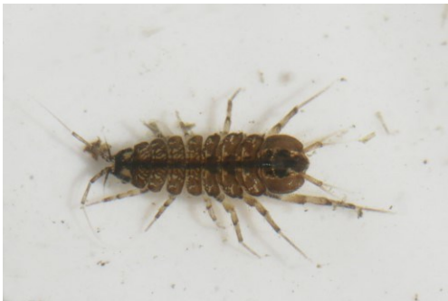
BERUŠKA VODNÍ ( Asellus aquaticus )

Navzdory jménu se jedná o vodního koryše, který má blíže k rakům než broukům. Živí se organickými zbytky.