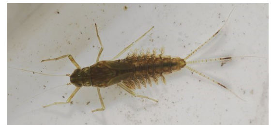
JEPICE (řád jepice)