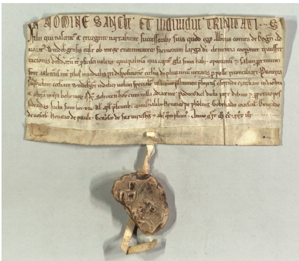
Listina z roku 1233 - první zmínka o Sušici