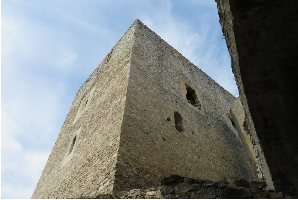
Čtverhranná věž hradu Rabí – nejstarší část hradu (spodní patra jsou datována před rok 1200)