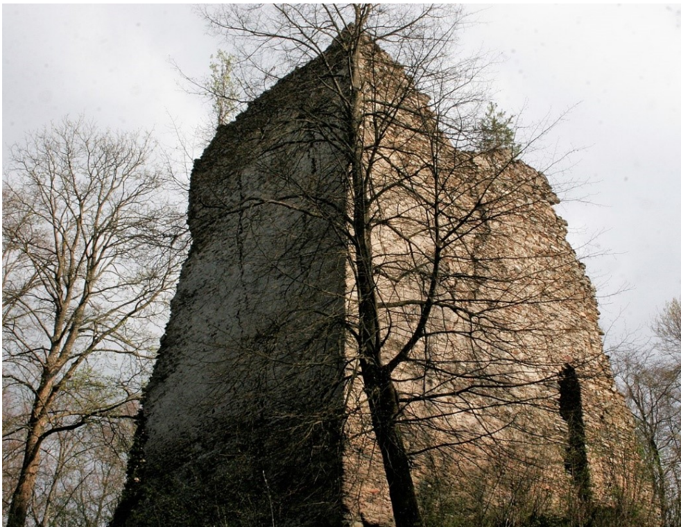
Hrad Pajrek (německy Bayreck) - donjon