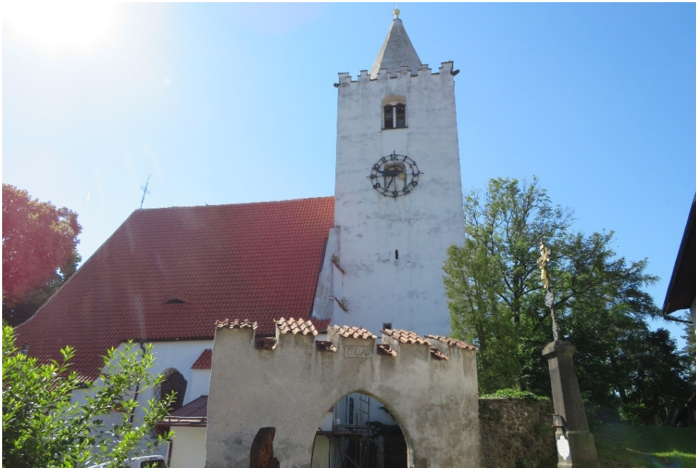
Kostel sv. Petra a Pavla v Petrovčích u Sušice (datován přibližně do roku 1240)