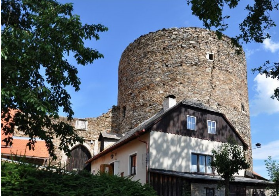
Hrad Vimperk – bateriová věž a brána v hlavní hradbě