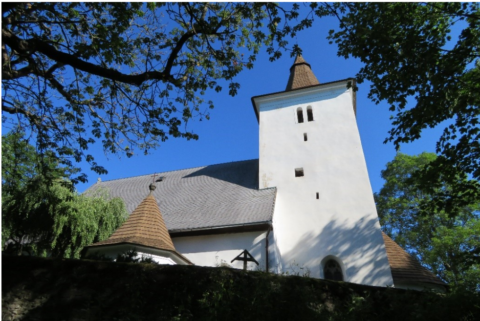
Kostel sv. Mořice na kopci Mouřenec u Annína (datován do rozmezí let 1220-1230)