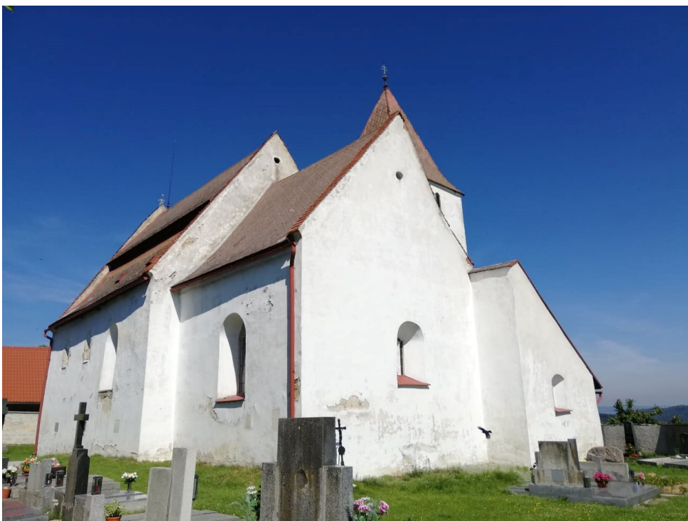
Kostel sv. Petra a Pavla v Albrechticích u Sušice (datován přibližně do roku 1240)