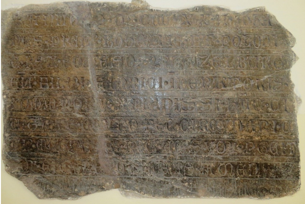
Deska z roku 1322 , která byla původně umístěna u jedné z městských bran města Sušice. Po zániku městského opevnění byla přemístěna do vstupního prostoru radnice