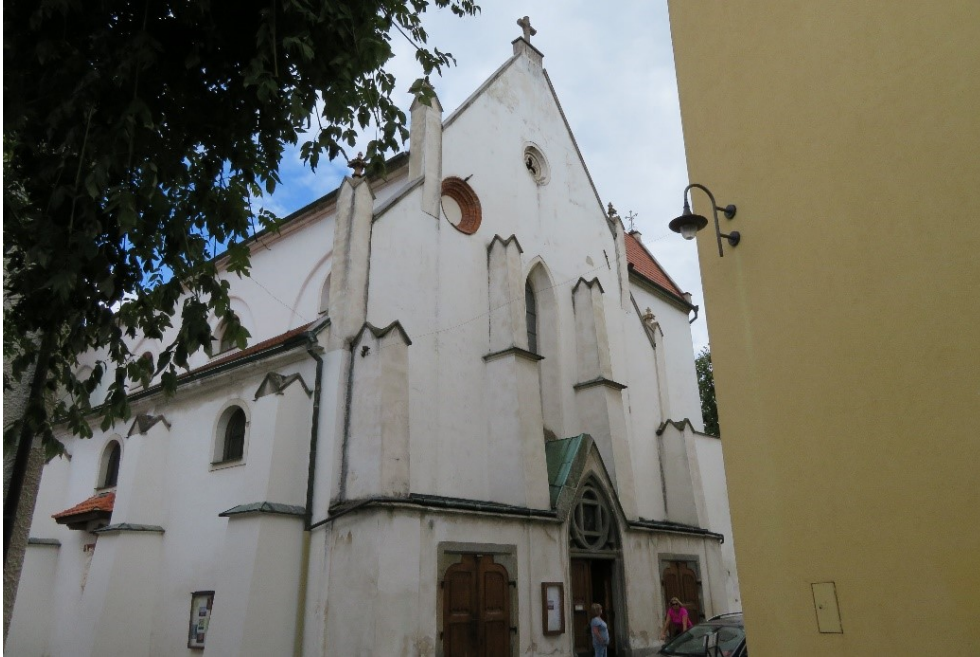
Trojandřová bazilika svatého Václava ze 14. století na jejímž místě původně stál románský kostelík, který je uveden v první zmínce o Sušici