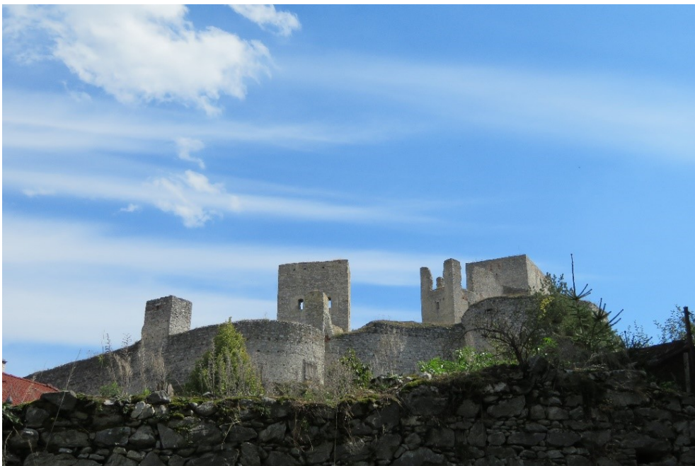
Hrad Rabí – současná pozdně gotická podoba s masivní fortifikací pochází z doby Půty Švihovského z Rýzmburka († 1504)