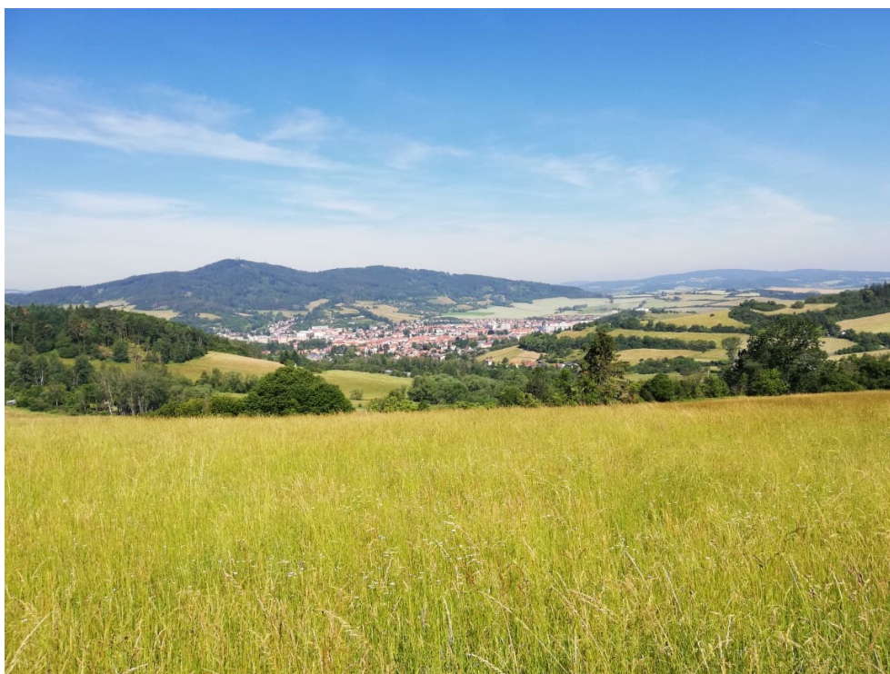
Pohled na město Sušice ze silnice ve směru na Záluží