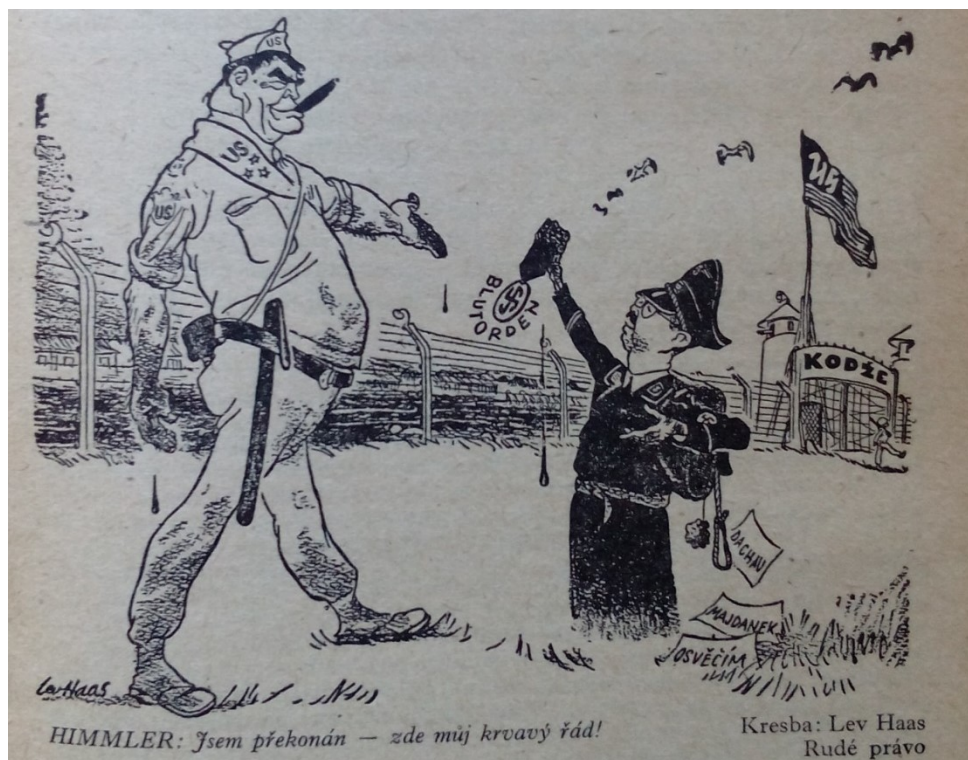
Obrázek 12: (Hořec, 1953, str. 70)