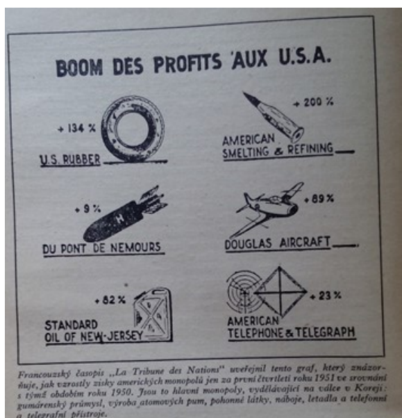
Obrázek 9: (Hořec, 1953, str. 20)

nacistického průmyslu, ředitelem Spojené tichooceánské železnice (Union Pacific Railroad), ředitelem Morganovy společnosti pro životní pojištění i řady dalších bank a pojišťoven“ (Hořec, 1953, str. 18). Za jednu z klíčových propagandistických vlastností této publikace ale považují především její grafický materiál. K dokreslení zisků korporací zde Hořec používá mj. graf z francouzského časopisu La Tribune des Nations (viz obrázek 8) nebo kresbu Borise Jefimova Wall Street počítá zisky (viz obrázek 9).