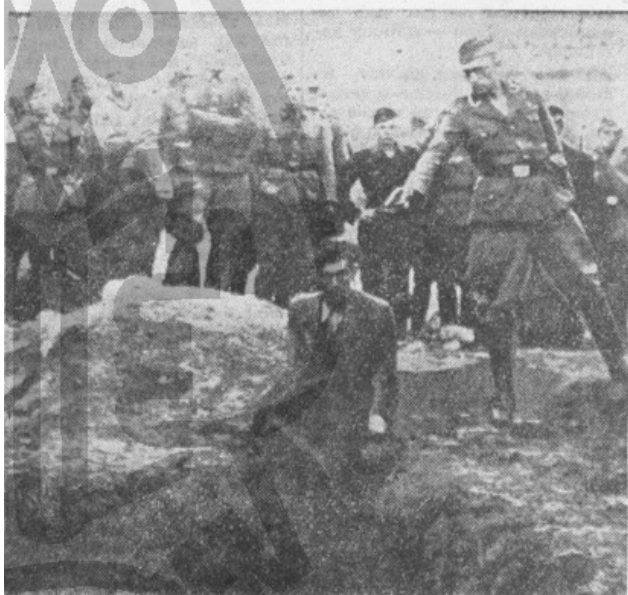
Tak v území okupovaném nacisty (obrázek z archivu gestapa)

Rudé právo ve sledovaných patnácti dnech rozprostírajících se napříč přibližně dvěma měsíci především definitivně potvrdilo trend sledovatelnosti vývoje válečného dění na základě implicitních hodnot jednotlivých částí obsahu periodika. Na