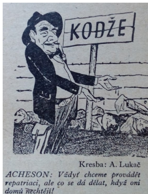
Obrázek 10: (Hořec, 1953, str. 79)