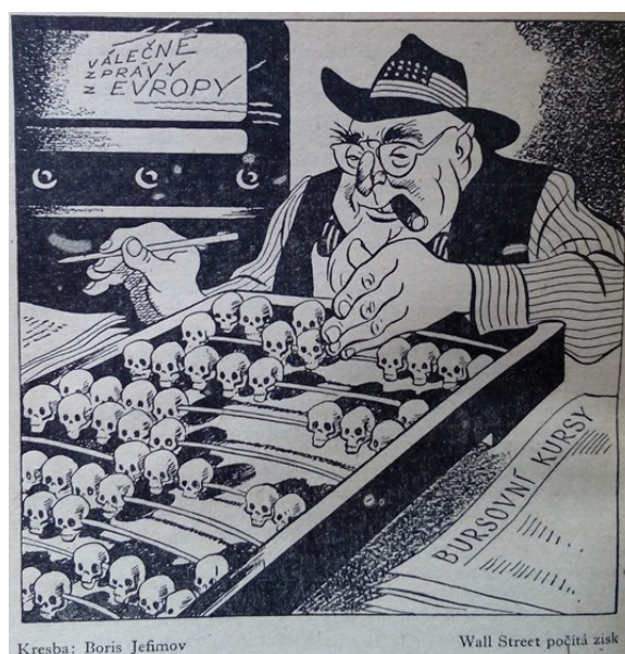
Obrázek 8: (Hořec, 1953, str. 38)

Mezi další témata tohoto komunikátu patří obviňování Spojených států z používání bakteriologických zbraní, které mají být dle knihy vyráběny ve městě Detrick ve státě Maryland, což je opět těžké rozporovat, neboť laboratoř na vývoj biologických válečných prostředků zde na přelomu 40. a 50. let 20. století skutečně existovala. Autor ovšem dále uvádí údajné prohlášení generála E. F. Bullena: „Chemické oddíly jsou v Koreji od 4. července 1950. Naše taktické operace v Koreji jsou ovšem tajné. Tato chemická vojska jsou připravena plnit jakékoliv rozhodnutí, které určí naše vláda. Vojska vycházejí z předpokladu, že otravné zbraně se budou používat i v budoucí válce bez jakýchkoliv omezení“ (Hořec, 1953, str. 55). Vzhledem k tomu, s jakými potížemi se americké jednotky v Koreji na začátku července 1950 potýkaly, si lze jen stěží představit, že by zde již od 4. července měly chemické oddíly, naprosto vyloučit tuto možnost ale pochopitelně nelze. V sekundární literatuře se nicméně nevyskytují. Téma bakteriologických zbraní doplňoval obrázek J. Novaka Ridgeway – vrchní velitel morových cizopasníků (viz obrázek 10). Jedním ze stěžejních rétorických směrů knihy byly ovšem, jak již napovídá její název,