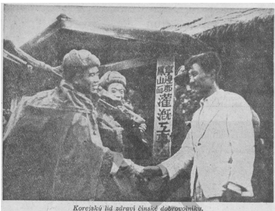
Korejský lid zdraví čínské dobrovolníky.

K průkaznosti účelové manipulace můžeme použít fotografii s titulkem Korejský lid zdraví čínské dobrovolníky (viz obrázek 6), 166 na níž jsou dva čelně zobrazeni Asiati podávající si