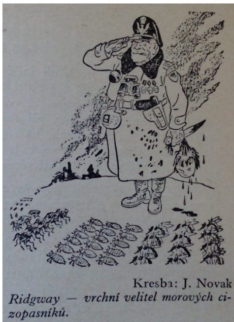
Obrázek 11: (Hořec, 1953, str. 61)

fašistické až nacistické praktiky Američanů přirovnávaných k Hitlerovi a dalším představitelům nacistického Německa, počítaje k těmto praktikám například hromadné vyvražďování a zavírání lidí do vybudovaných koncentračních táborů. Zde stojí za uvedení karikatury A. Lukače ACHESON: Vždyť chceme provádět repatriaci, ale co se dá dělat, když oni domů nechtějí! (viz obrázek 11) a Lea Haase HIMMLER: Jsem překonán – zde můj krvavý řád! (viz obrázek 12).