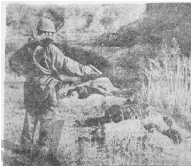
Tak v území okupovaném Američany (obrázek americká agentura Pix Incorporated)

ruce. Nelze samozřejmě dokázat, že jeden z nich je Číňan a druhý Severní Korejec, stejně jako nelze dokázat jejich setkání na bojišti, v porovnání s předchozími snímky údajných Američanů ovšem působí tato fotografie výrazně validněji i uvěřitelněji. Patrně nejtransparentnější důkaz abstraktnosti snímků kompromitujících Američany ale dodalo pravděpodobně nevědomky samo periodikum, když 1. prosince 1950 otisklo článek Svědectví o zvěrstvech Američanů v Koreji doplněný o dvě fotografie (viz obrázek 7). Na jedné z nich se nacházel zády stojící voják, z něhož ani nejde poznat, že je to Američan, s pistolí v ruce nad zastřelenými těly (text: „ Tak v území okupovaném Američany “; zdroj fotografie: americká agentura Pix Incorporated), na druhé je potom čelní snímek člena gestapa či jiné nacistické organizace s pistolí v ruce namířenou na hlavu klečícího člověka (text: „ Tak v území okupovaném nacisty “; zdroj: archiv gestapa). 167