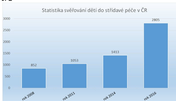
Graf č. 2