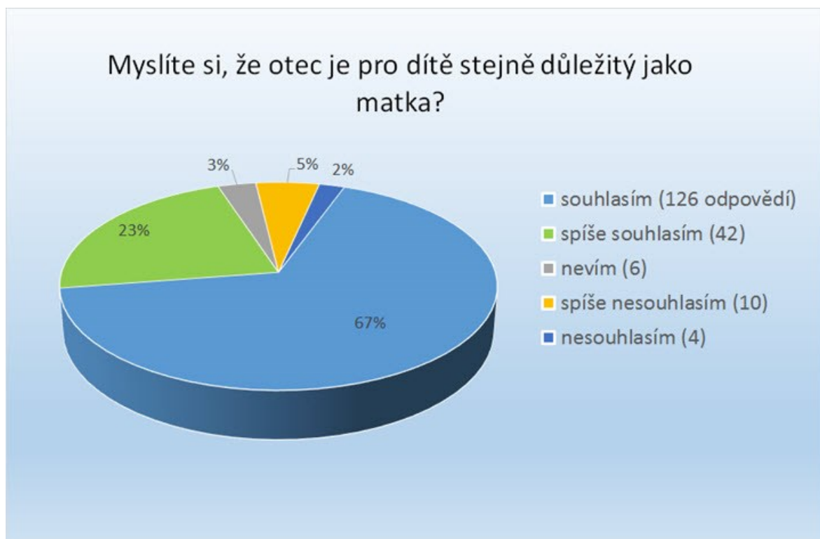
Graf č. 3