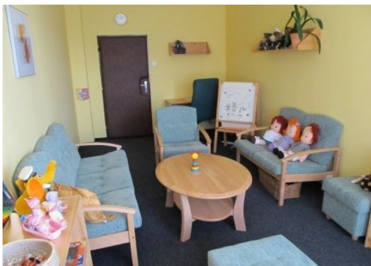
Obrázek č. 1 Fotografie výsledkové místnosti pro děti