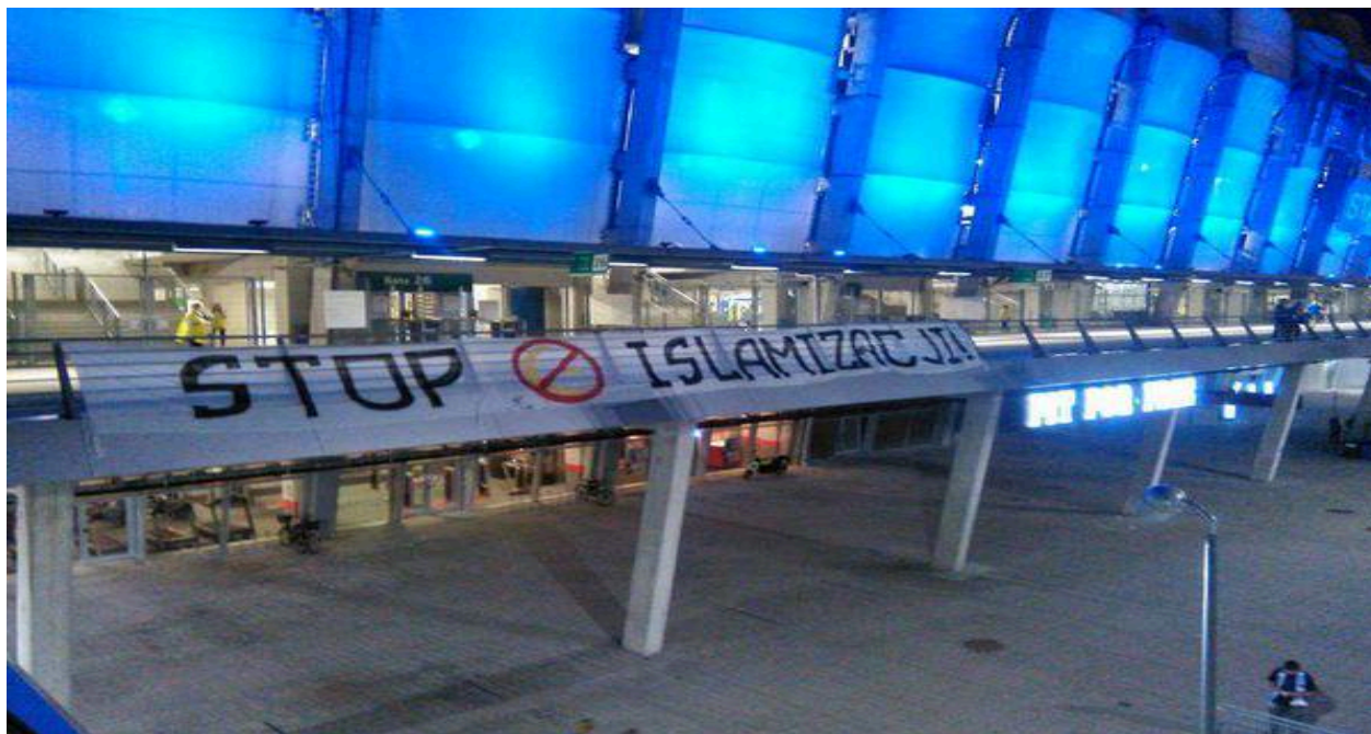
Obr. 16. – Jasný názor radikálních fanoušků Lechu Poznaň na migraci spojenou s možným šířením islámu.