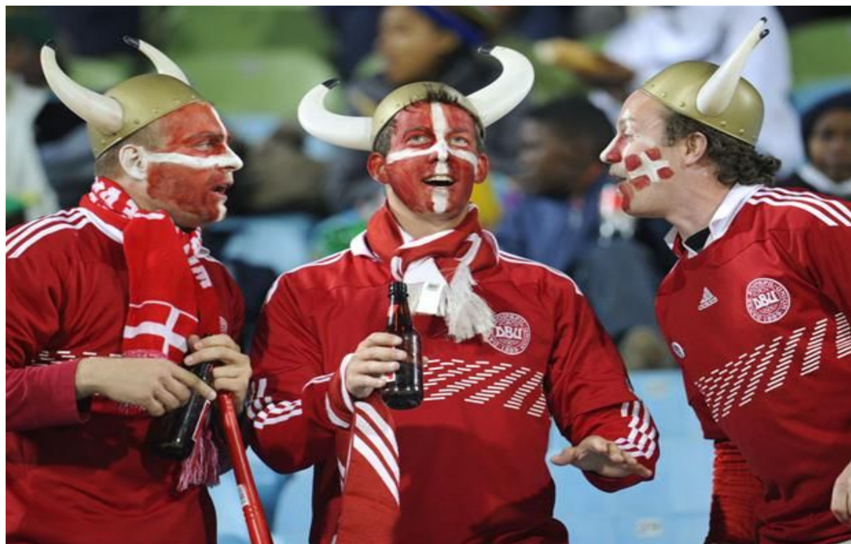
Obr. 2 – Dánští rooligans na utkání národního týmu.