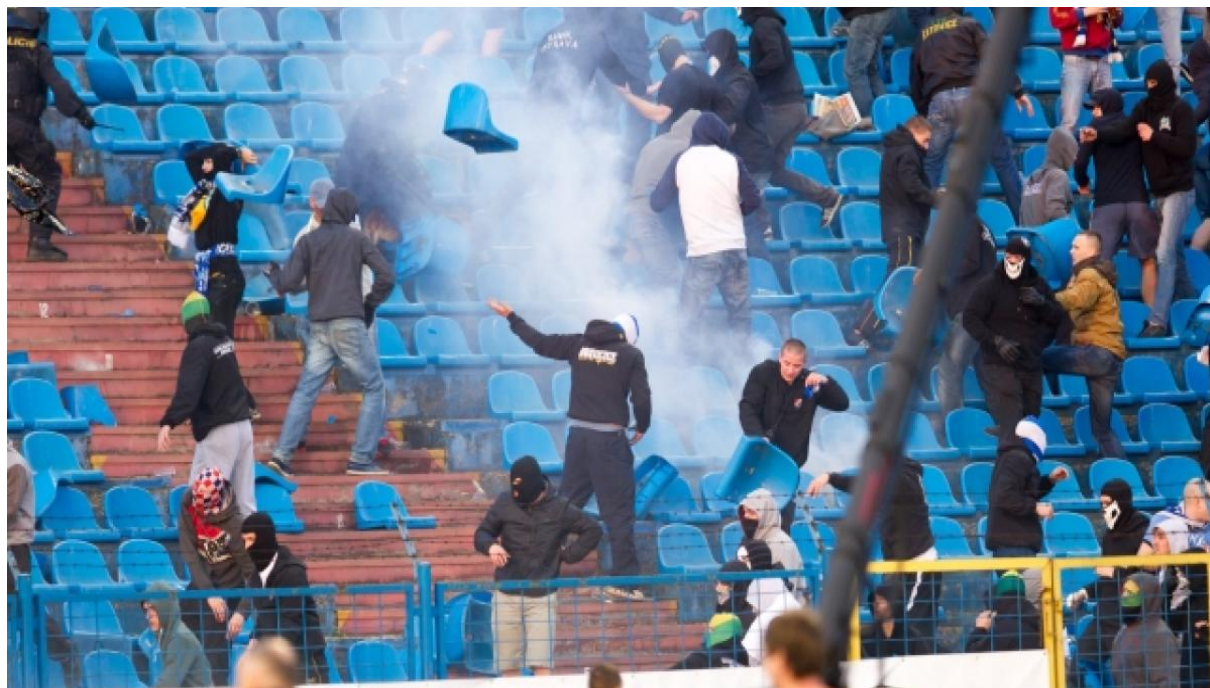
Obr. 3 – Hooligans FC Baník Ostrava na výjezdu v Brně