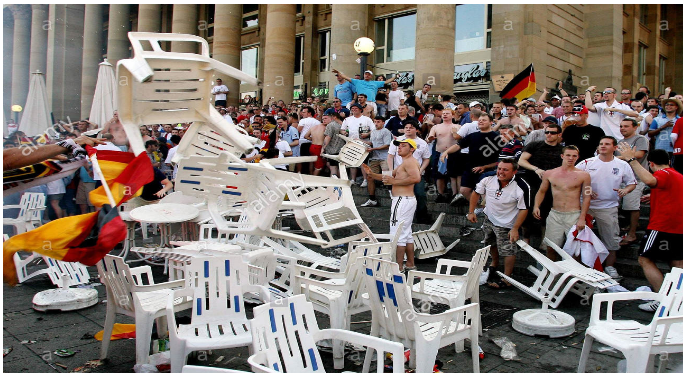
Obr. 12 – Řádění fanoušků Anglie a Německa na EURU 2016 ve Francii.