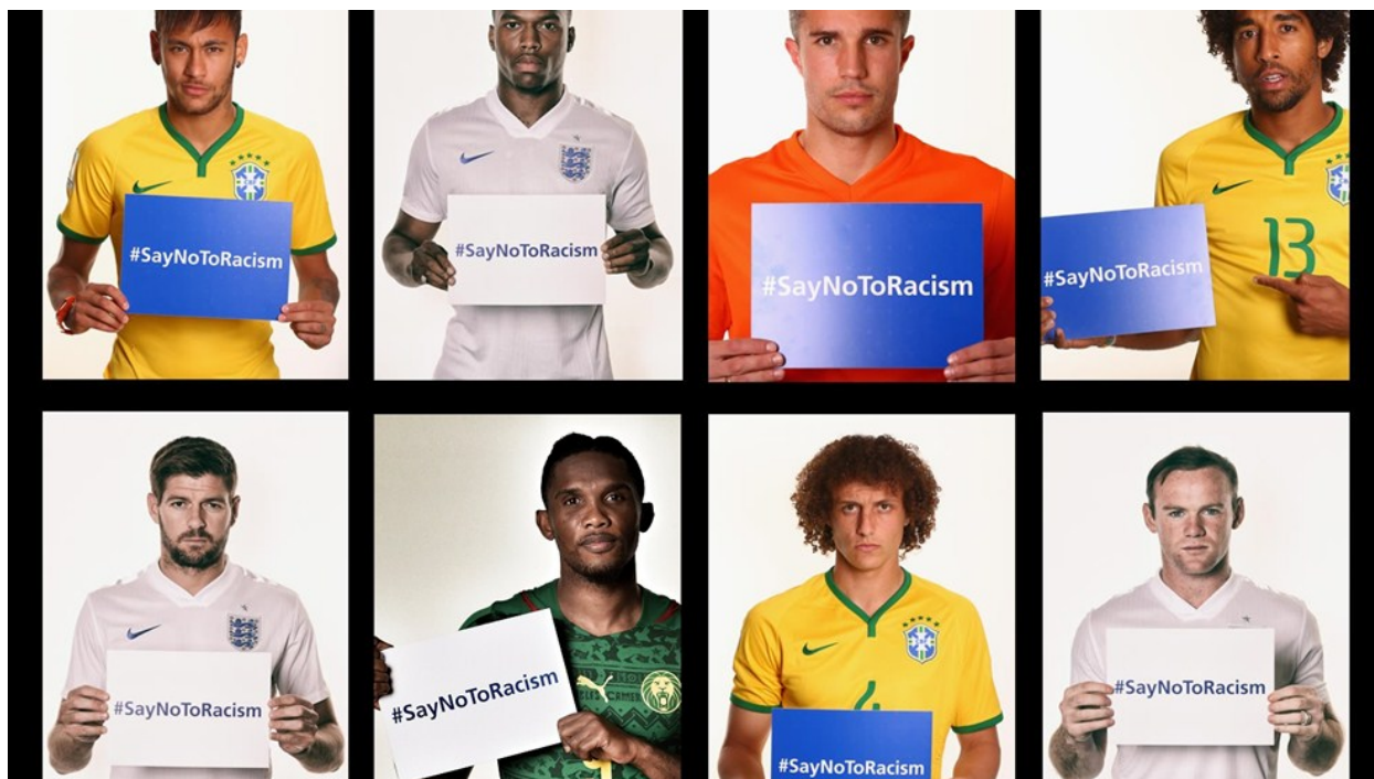
Obr. 8 – Kampaň UEFA SAY NO RACISM