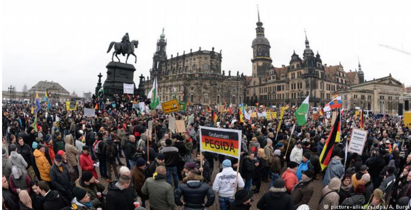
Obr. 13 - Demonstrace proti islamizaci Německa v Drážďanech (květen 2015)