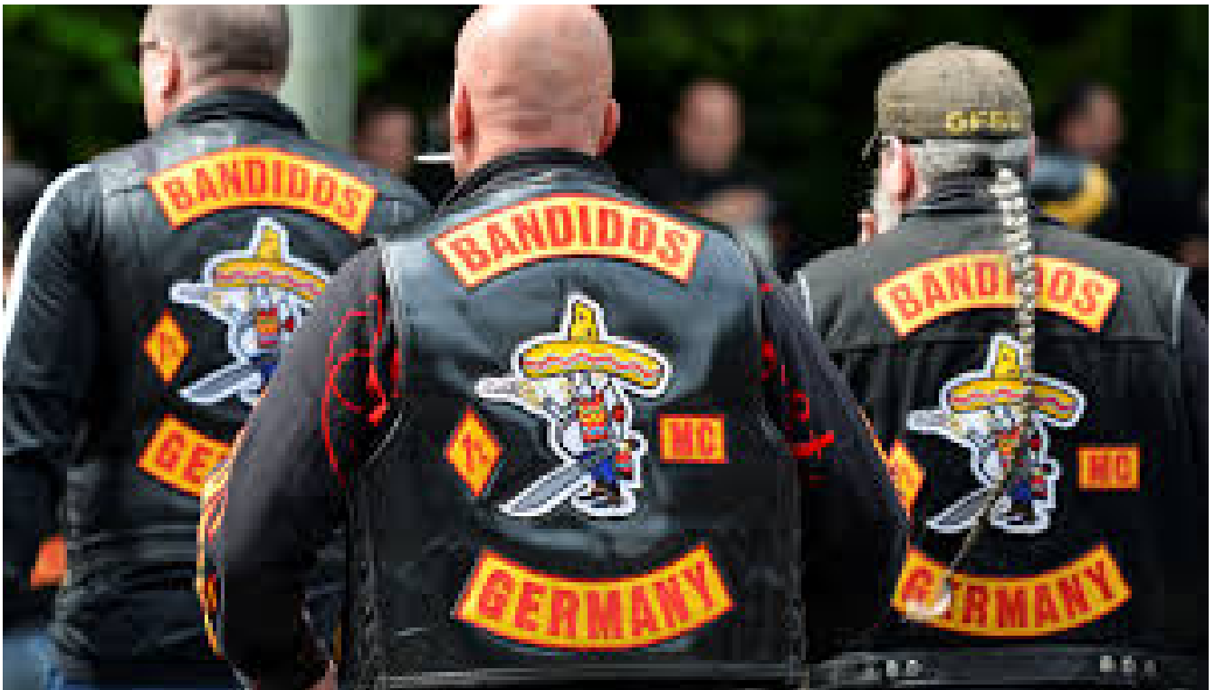
Obr. 10 - Představitelé „kütten“ – typickým znakem je masivní bunda či vesta, ozdobená nášivkami