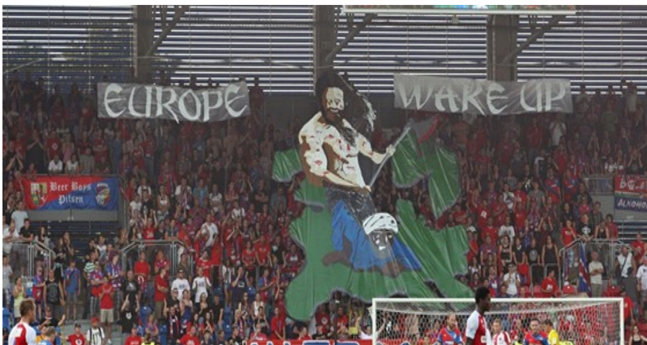
Obr. 14 - Plzeňské „choreo“ aneb názor na migraci. Transparent stál Viktorii Plzeň 100 000 Kč.