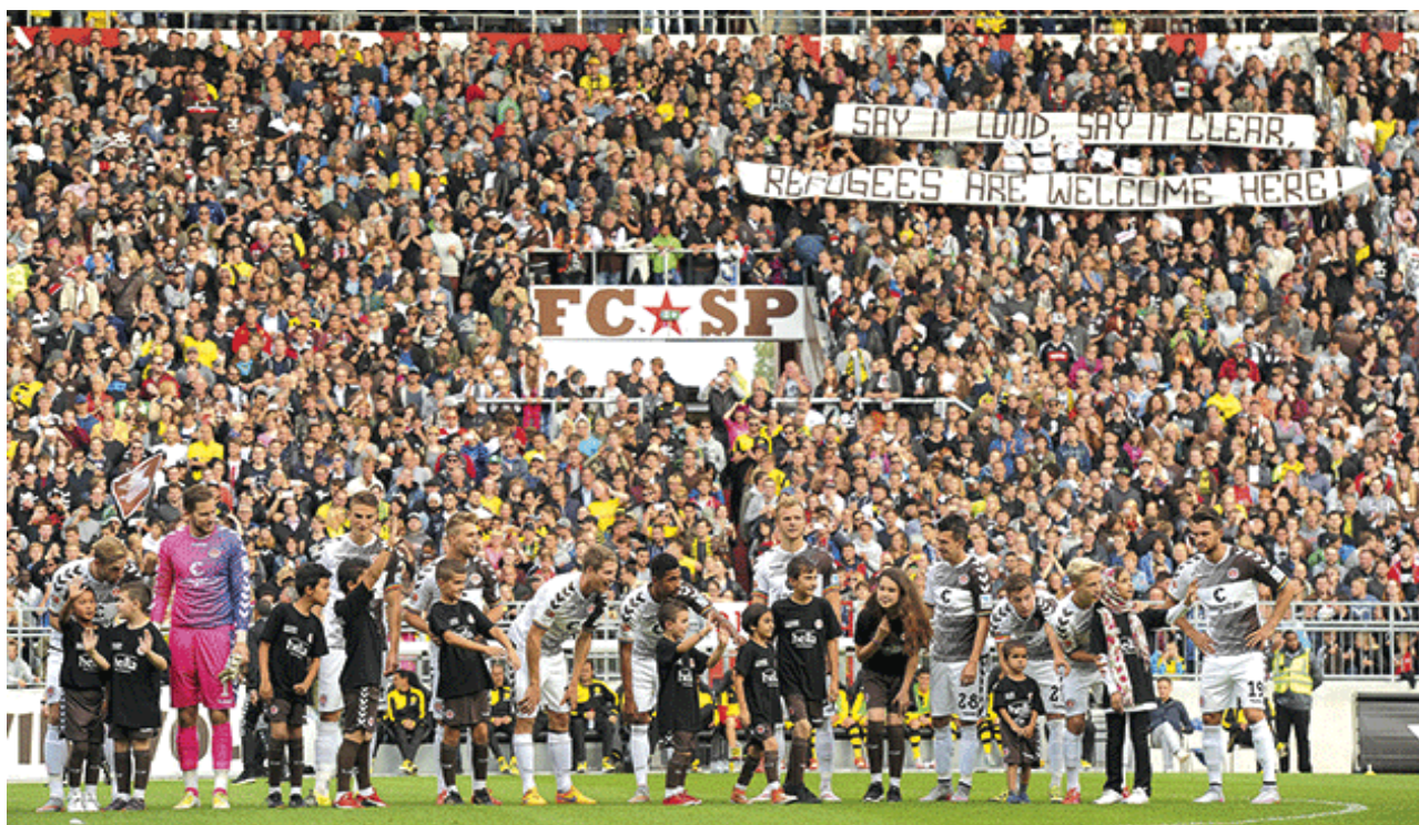
Obr. 15 – Přátelský zápas ST. Pauli a Borussia Dortmund. Děti z rodin migrantů doprovázely hráče na hřiště a i v hledišti se migrantům dostalo jasného vyjádření podpory.