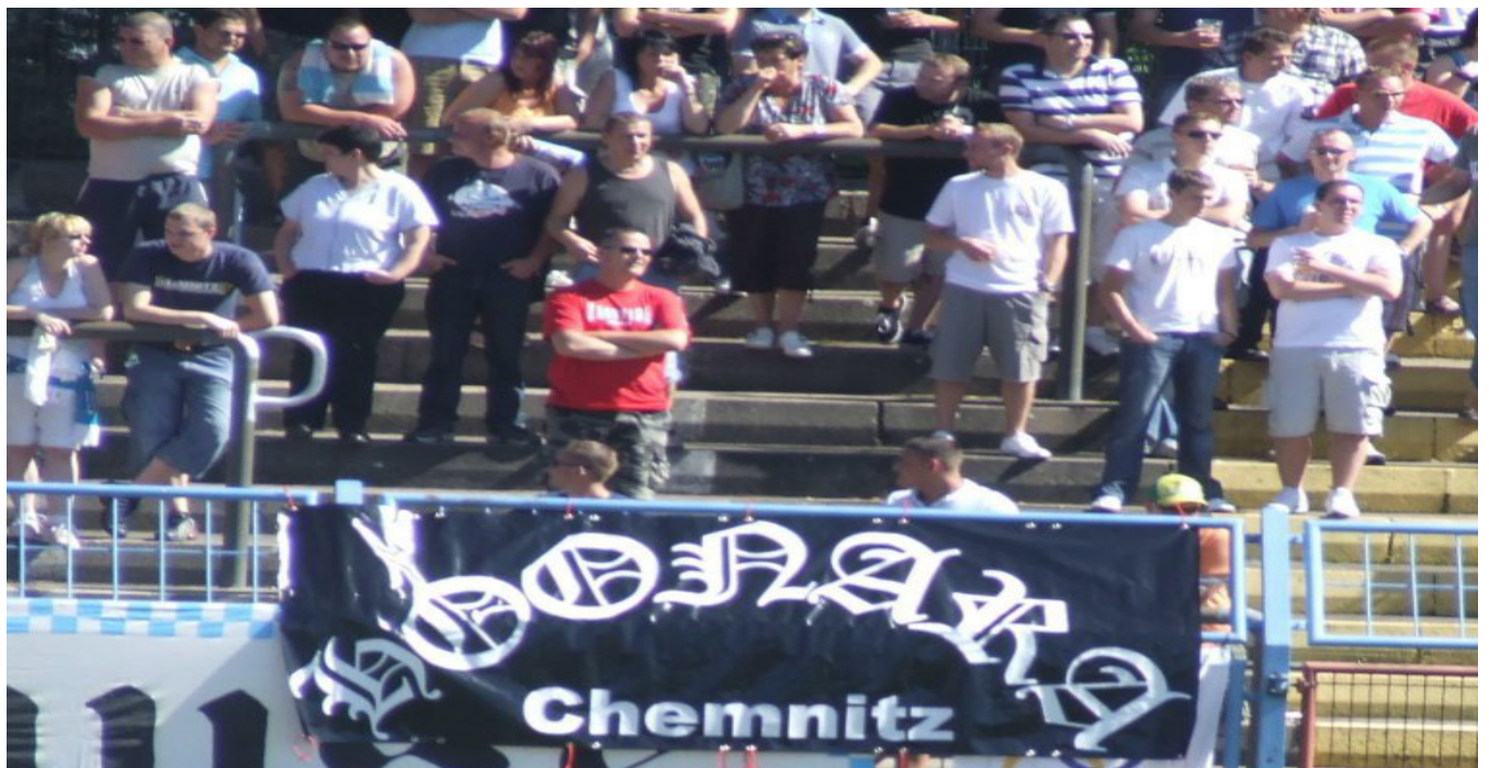
Obr. 11 - Podporovatelé hnutí HOONARA a zároveň podporovatelů klubu Chemnitzer FC.