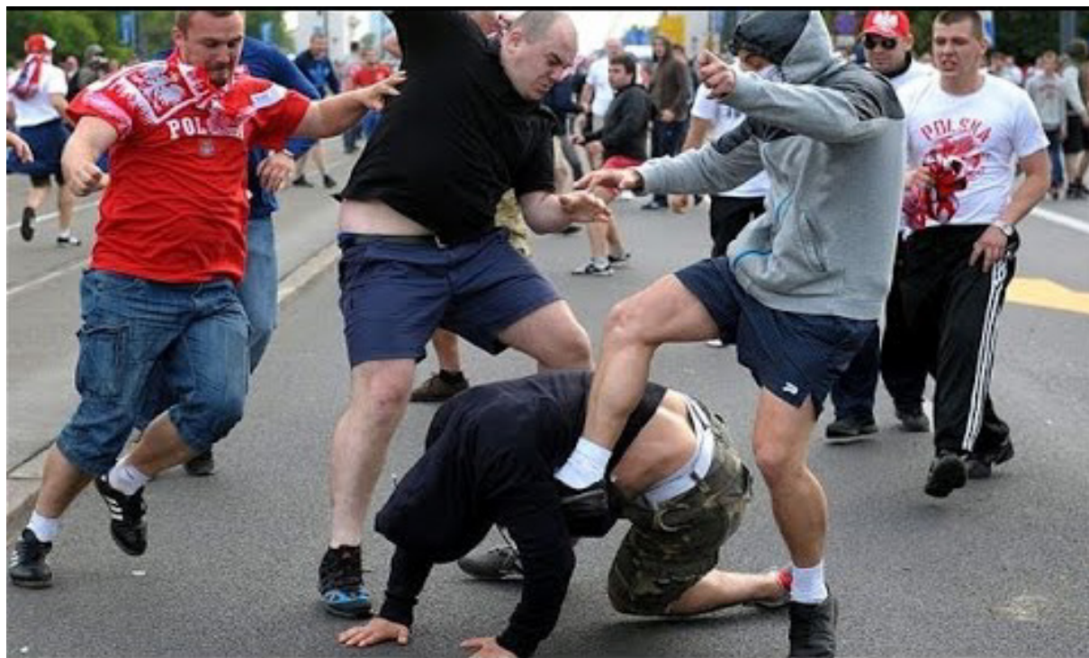
Obr. 4 - Bitka mezi chuligány Ruska a Polska na EURU 2012, které hostilo právě Polsko společně s Ukrajinou.