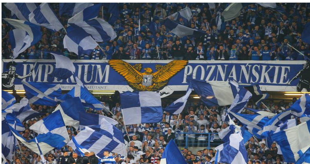
Obr. 1 – Ultras z Polska, konkrétně vlajkonoši Lechu Poznaň.