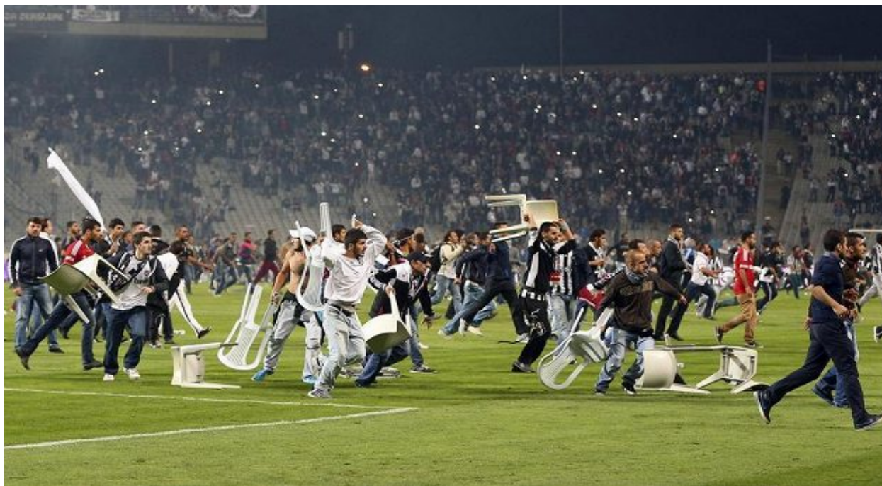
Obr. 7 – Utkání Besiktas Istanbul X Fenerbahce Istanbul. Derby v Turecku mají k poklidnému utkání daleko.