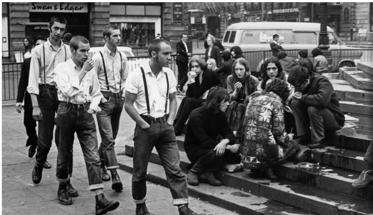
Obr. 5 – Typičtí představitelé počátků subkultury skinheads (Anglie, 60. léta 20. století)