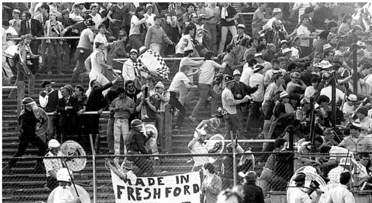
Obr. 6 - Obrázek z Heysel stadionu v Bruselu během PMEZ 1985