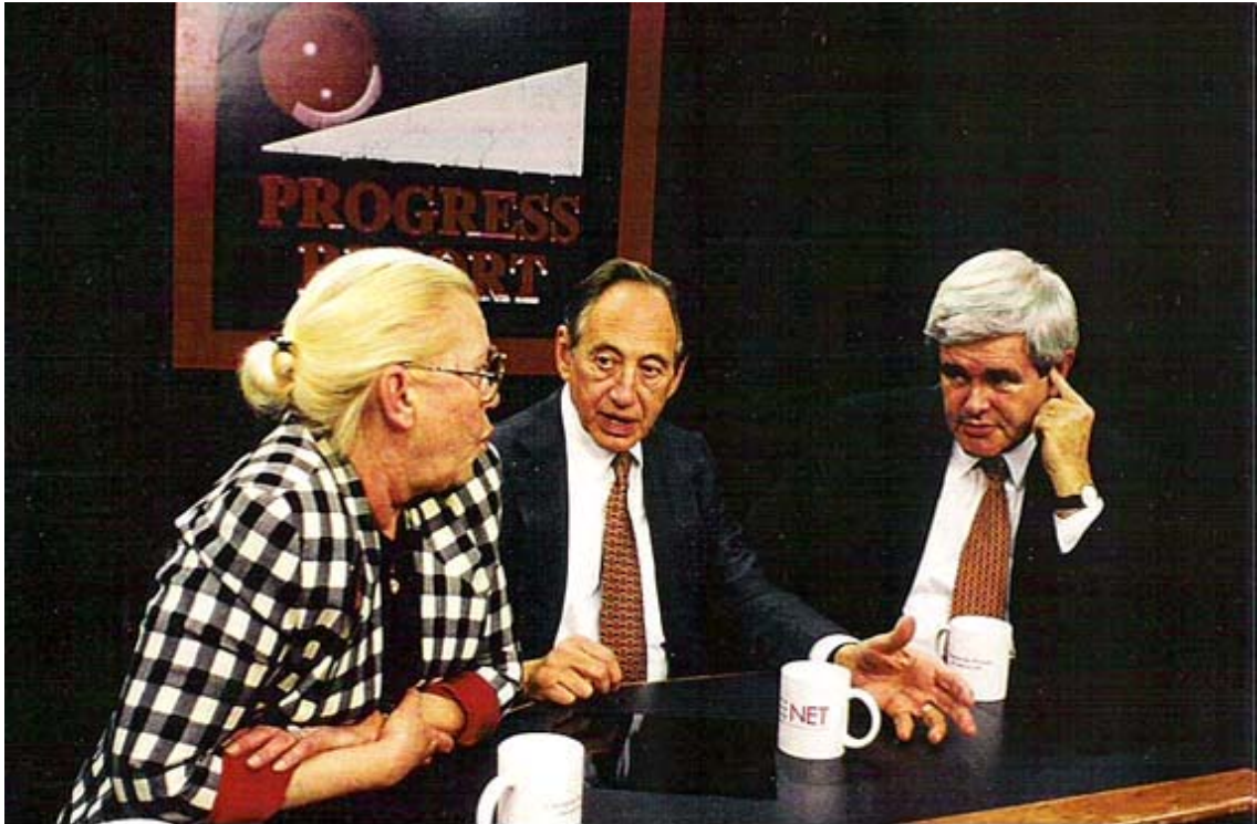
Tofflerovi s Newtem Gingrichem