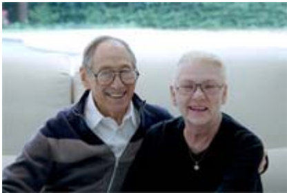
Alvin a Heidi Tofflerovi, r. 2006