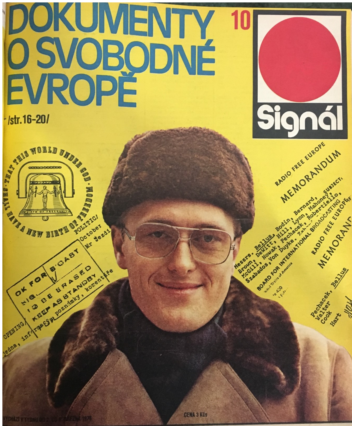
Příloha č. 4: Titulní strana týdeníku Signál (fotografie) 4