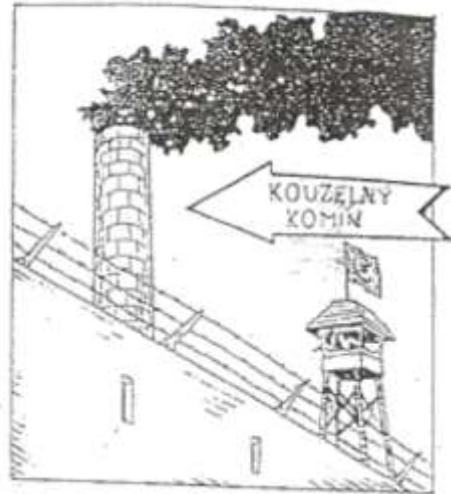
Příloha č. 3: Obrázek z komiksu švindlkaust (Zázraky švindlkaustu, komiks)

VE FILMECH I VE SVĚDECTVÍCH TĚCH CO PŘEŽILI ŠVINDLKAUST SE VYSKYTUJÍ KREMAČNÍ KOMÍNY, KTERÉ CHRlí OHROMNÉ MRÁKY ČERNEHO, NEPROPUSTNÉHO KOUŘE, VZNIKLEHO SPALOVÁNÍM ŽIDŮ. VE FILMECH JE TENTO ZÁZRAK ZOBRAZOVÁN SE ZBOŽNOU ÚCTOU... KOMÍNY PRO KREMATORIA JSOU VŠAK BUDOVÁNY TAK, ABY VYPOUŠTĚLY DO OVZDUŠÍ JEN MINIMÁLNÍ MNOŽSTVÍ EMISÍ. Z TOHO VYPLÝVÁ, ŽE KOUŘÍČI KOMÍNY Z AUSCHWITZU BYLY ZÁZRAČNÉ. (4)