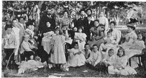
Grupo de concurrentes

UNA parte importante de la colectividad alemana ha celebrado el domingo último, con un animado pic-nic en el bosque de Palermo, el 43° aniversario de la fundación del «Gesangverein Germania», institución social que realiza cumplidamente su misión principal de proporcionar ratos de solaz y entretenimiento á sus numerosos asociados.