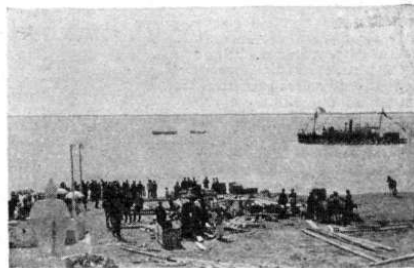
EL «NAMUNCURÁ» NAVEGANDO EN EL RÍO SANTA CRUZ

En Puerto Madryn se hallaba el reverendo Prichard, comisionado por el gobierno inglés para estudiar la situación de los colonos galenses y arbitrar los medios de obtener el traslado de los descontentos á las posesio-