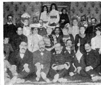
INVITADOS Á BORDO DEL «NAMUNCURÁ»

Ilustrace 3: Článek o návštěvě velšských přistěhovalců v Puerto Madryn, Patagonii.