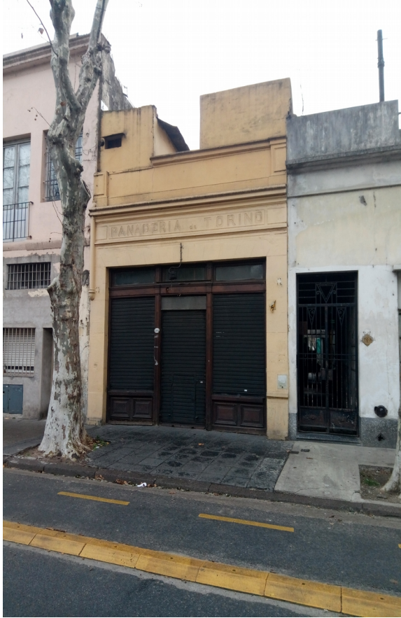
Ilustrace 6: Italská pekárna poblíž Kongresu, Buenos Aires.