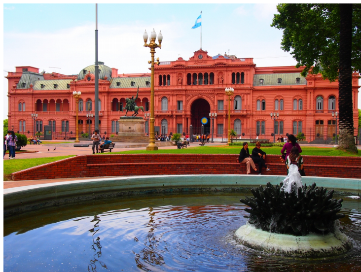
Ilustrace 7: Casa Rosada, prezidentský palác, Buenos Aires.