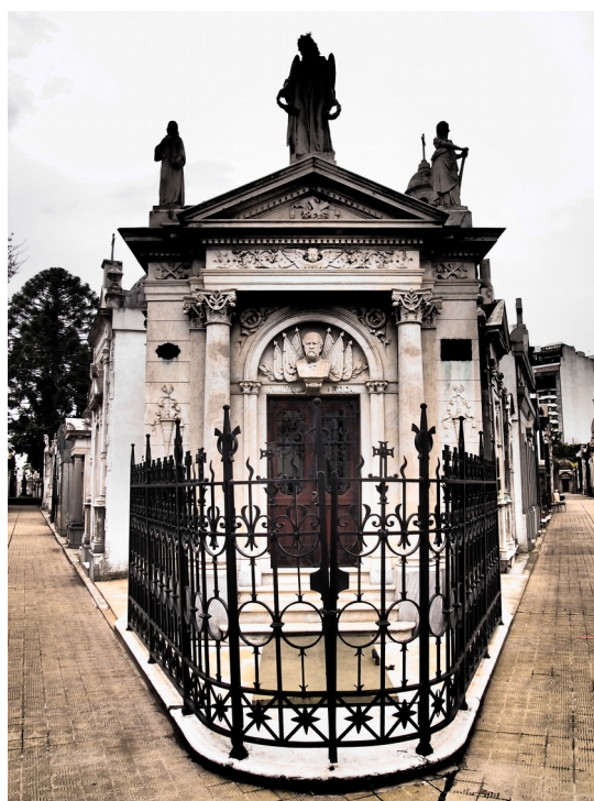
Ilustrace 9: Hřbitov Recoleta v Buenos Aires, Julio A. Roca, rodinná hrobka.