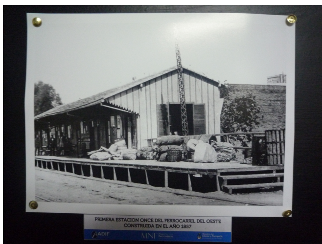
Ilustrace 2: Původní zastávka Once v Buenos Aires, foto z roku 1857.