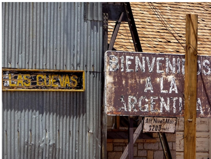
Ilustrace 8: Nápis v železniční stanici Las Cuevas, Trasandino, hranice mezi Argentinou a Chile.