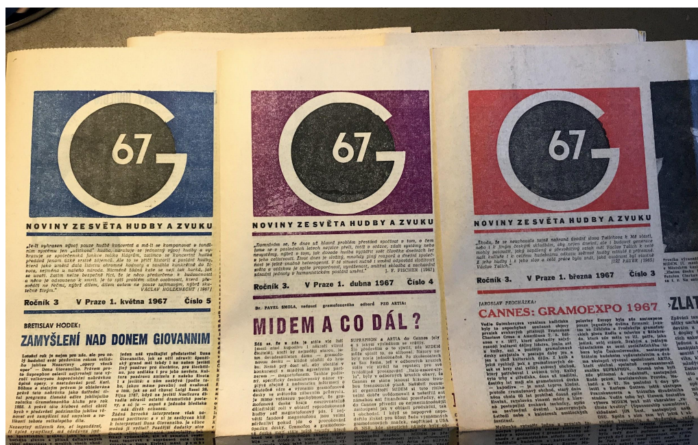
Příklad užití barvy v číslech 3, 4 a 5 třetího ročníku G 67

Svým větším formátem časopis noviny i připomíná. Rada dodává: „Papíru bylo dost v Kolínských tiskárnách, papír byl žlutý, chlupatý a vyráběl se ze dřeva. Barvy vycházely šedivé a z toho jsme byli zklamaní, když jsme udělali dobrý návrh a dopadlo to tak. Ono to bylo tištěno ofsetem, vytáhlo to tři barvy, červenou, žlutou, modrou, a černá je použitá jako tvrdící.“ 156 Rozsah stran byl během roku 1965 různorodý. 157 V průměru se však rozsah pohyboval okolo 5 stran.