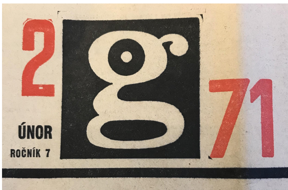
Logo č.2 r.7 G 71 - autor neznámý

Sedmý ročník G 71 se představuje v novém. Redakce se k oznámeným změnám v prvním čísle G 71 ještě vyjadřuje: „Bylo nás pět: G 70, Gramofonový klub, Hudba pro radost, Hudba a škola. Vycházeli jsme, jak pánbůh, spíše vlastně tiskárny, dopustily, což se nelíbilo ani vám, ani nám. [...] Na vaše dopisy a dotazy chceme proto rovnou odpovědět, že nechceme pomíjet ani jednu z oblastí, jimž byly dřívější bulletiny věnovány, že jim – byť v časopise jediném - chceme věnovat stejné, ne-li větší místo, jak vás o tom chceme přesvědčit už v prvním čísle nového ročníku G 71.“ 208 Logo Ladislava Rady již chybí a je nahrazeno logem novým. 209