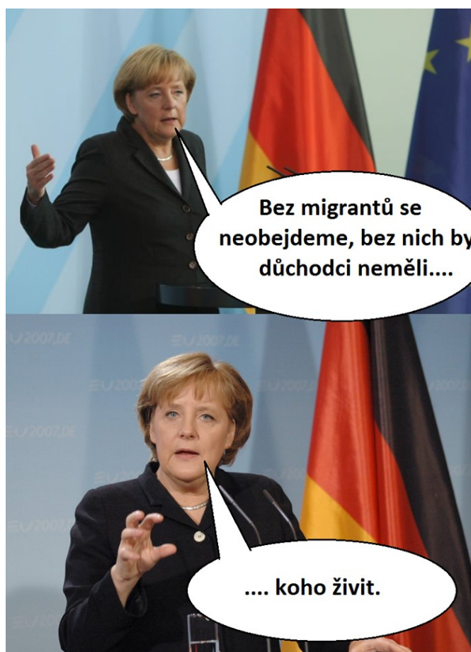
Příloha č. 8: Koláž s anti-migrační tematikou (obrázek) 8