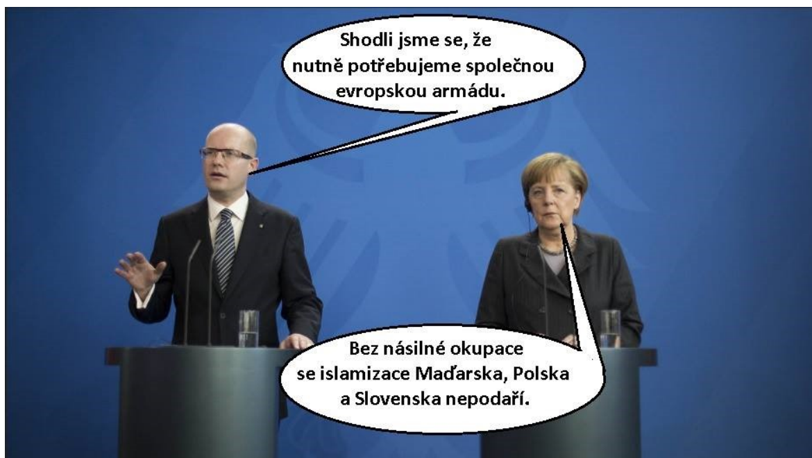
Příloha č. 9: Koláž s anti-evropskou tematikou (obrázek) 9