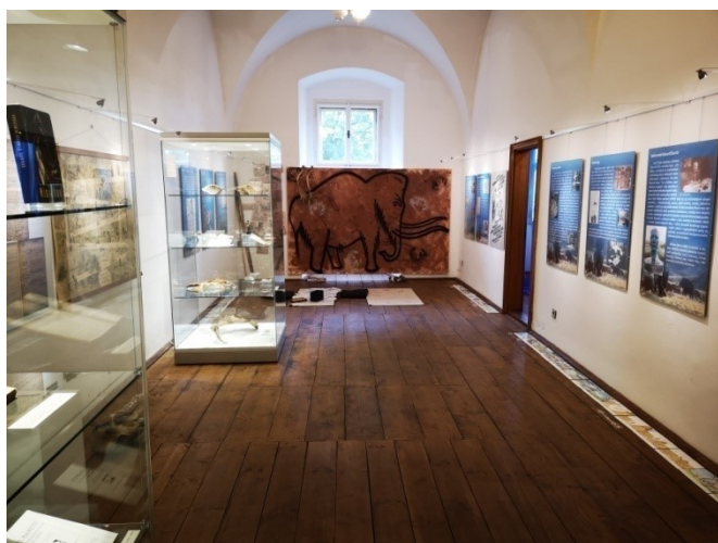
Obr. 12. Výstava Eduard Štorch, Bělá pod Bezdězem. Výstava představila významnou osobnost regionu.