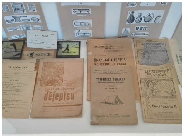
Obr. 4. Exponáty vystavené v muzeu E. Štorcha a K. Zemana, Ostroměř.

Muzeum představuje i další exponáty například: Dotazník na lyžařský kurz, Legitimaci pro lyžařský kurz, Pracovní učebnice dějepisu, Školní dějepis v theorii a praxi, Tábornickou příručku, Ilustrované přednášky (obr. 4). Tyto vystavené předměty dokazují Štorchovu velkou šíři jeho pedagogické činnosti.