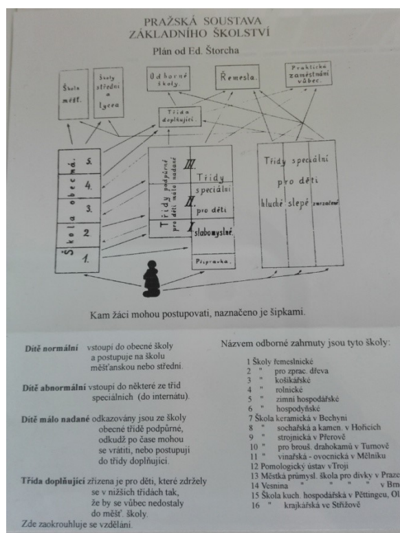
Obr. 3. Pražská soustava základního školství, Ostroměř. Eduard Štorch byl pokrokový i v tom, že neváhal navrhovat například i systém vzdělávání tehdejšího školství. Děti dělil na normální, abnormální, málo nadané. Nezapomínal ani na děti s handicapem (autor: I. Duspivová).

Dále Štorch načrtl i Pražskou soustavu základního školství v plánu (obr. 3). Zde je vyobrazen jeho navrhovaný systém a pojmenované typy školských zařízení. Členil žáky na dítě normální, abnormální, málo nadané . V jeho soustavě je škola obecná, Přípravka, Třídy podpůrné pro děti málo nadané, Třídy speciální pro děti slabomyslné, Třídy speciální pro děti hluché, slepé, zmrzačené. Žáci pak mohou v systému pokračovat Školy měšťanské, Školy střední a lycea, Třída doplňující, Odborné školy, Řemesla, Praktická zaměstnání vůbec. Prostupnost označil šipkami.