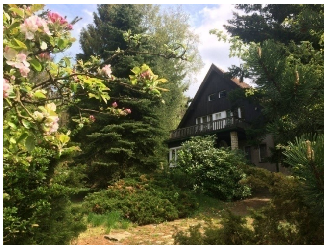
Obr. 9. Letní sídlo manželů Štorchových, Lobeč č. p. 4. V dřevěném domku napsal spisovatel Eduard Štorch jeden z jeho románů – Minehava. Veřejnosti je chata v současnosti nepřístupná.

Minehava, který napsal právě zde v Lobči. Popisuje v ní příběh ženy z lobečského okolí – Pustého vrchu, kde vlastnil svůj domek. Informační tabule se zmiňuje i o historii získaného domku: místní rodina Šimonkova věnovala manželům Štorchovým pozemek, na kterém si postavili tento dřevěný domek, nyní s číslem popisným 4 (obr. 9). Toto letní sídlo není zpřístupněno veřejnosti. Z toho domku jsou zapůjčeny rodinou Šimonkovou osobní věci do muzea. Štorchova žena pocházela z blízkých Libovic a domek obývali v letních měsících. Eduard Štorch se zde věnoval sběru pazourků, byl i součástí kulturního života – navštěvoval místní sokol a obecnou školu. Po zdravotních problémech prý rád vysedával v prosklené verandě u stolu s teplým čajem, dýmal svoji fajfku a pozoroval okolí Pustého vrchu, kde skotačily místní děti. Ti se stali inspirací jeho posledního románu Minehava, který vyšel v roce 1950, osm let před spisovatelovou smrtí.