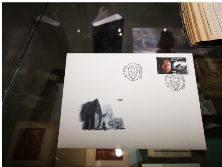
Obr. 10. Obálka s poštovní známkou znázorňující osobnost Eduarda Štorcha vydaná dne 4. dubna 2018, Bělá pod Bezdězem (autor: I. Duspivová).

byla vydána i obálka prvního dne vydání v nákladu 3 200 kusů. (zdroj: http://newsphila.blogspot.com/2018/04/cesko-nove-postovni-znamky-cz-0976.html ).