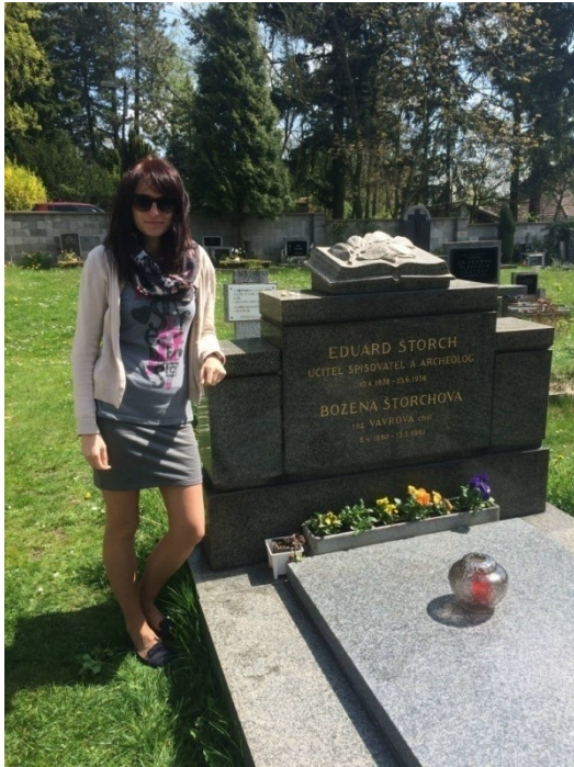
Obr. 11. Hrob manželů Štorchových, Lobeč. Fotografie pořízená na místním hřbitově v Lobeči. Nápis u Eduarda Štorcha je výstižný – učitel, spisovatel a archeolog. Na památečním snímku v terénu autorka této bakalářské práce.