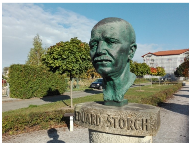
Obr. 1. Busta Eduarda Štorcha, Ostroměř ( autor: I. Duspivová).

První navštívenou lokalitou bylo dne 3. 8. 2018 rodné město Eduarda Štorcha - Ostroměř. Významný rodák je zde připomínán nepřehlédnutelnou bustou. Podle informací místní průvodkyně muzea byla původně bronzová busta od akademického sochaře Josefa Bílka vytvořena v roce 1978 a umístěna u bytových domů blíže hlavní silnici protínající Ostroměř. V roce 2008 došlo k jejímu přemístění do parčíku před základní školou nesoucí název po Eduardu Štorchovi (znakem školy je mamut). V roce 2011 však byla odtud odcizena. Podle původního sádrového modelu je vyrobena současná busta z laminátu (obr. 1).