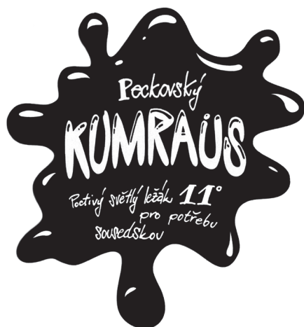
OBR. 2 Pivní etiketa 11° světlého ležáku Peckovský Kumraus.