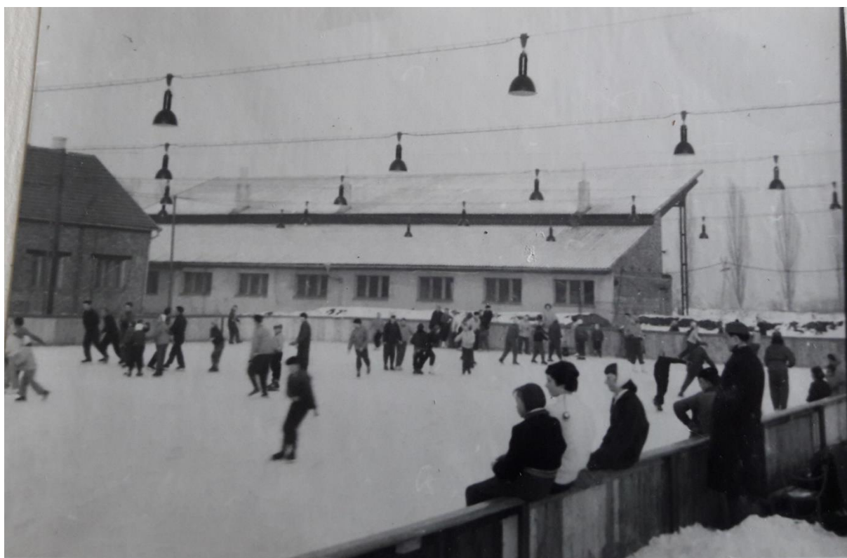
Lyžování „Pod Obecňákem“ 1965