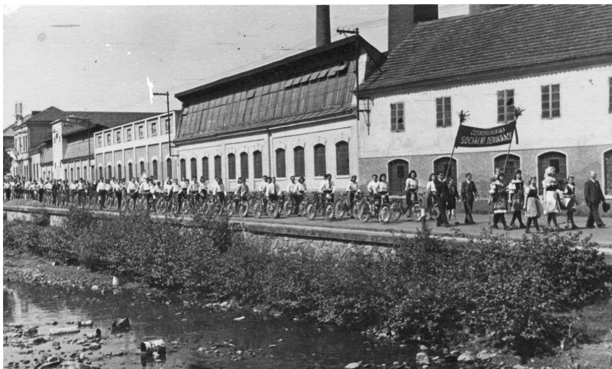
Oslavy 1. máje 1955 (v popředí stavba hotelu)