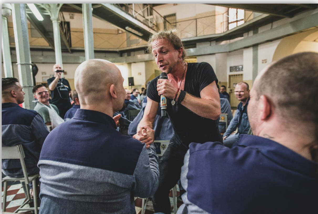
Příloha 4: Koncert Tomáše Kluse ve Věznici Plzeň.