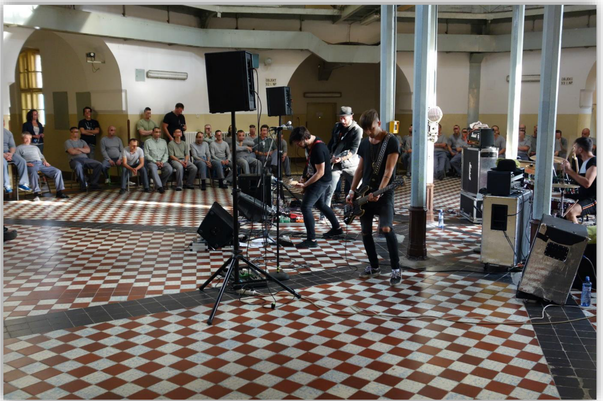
Příloha 3: Koncert kapely „Imodium“ ve Věznici Plzeň.