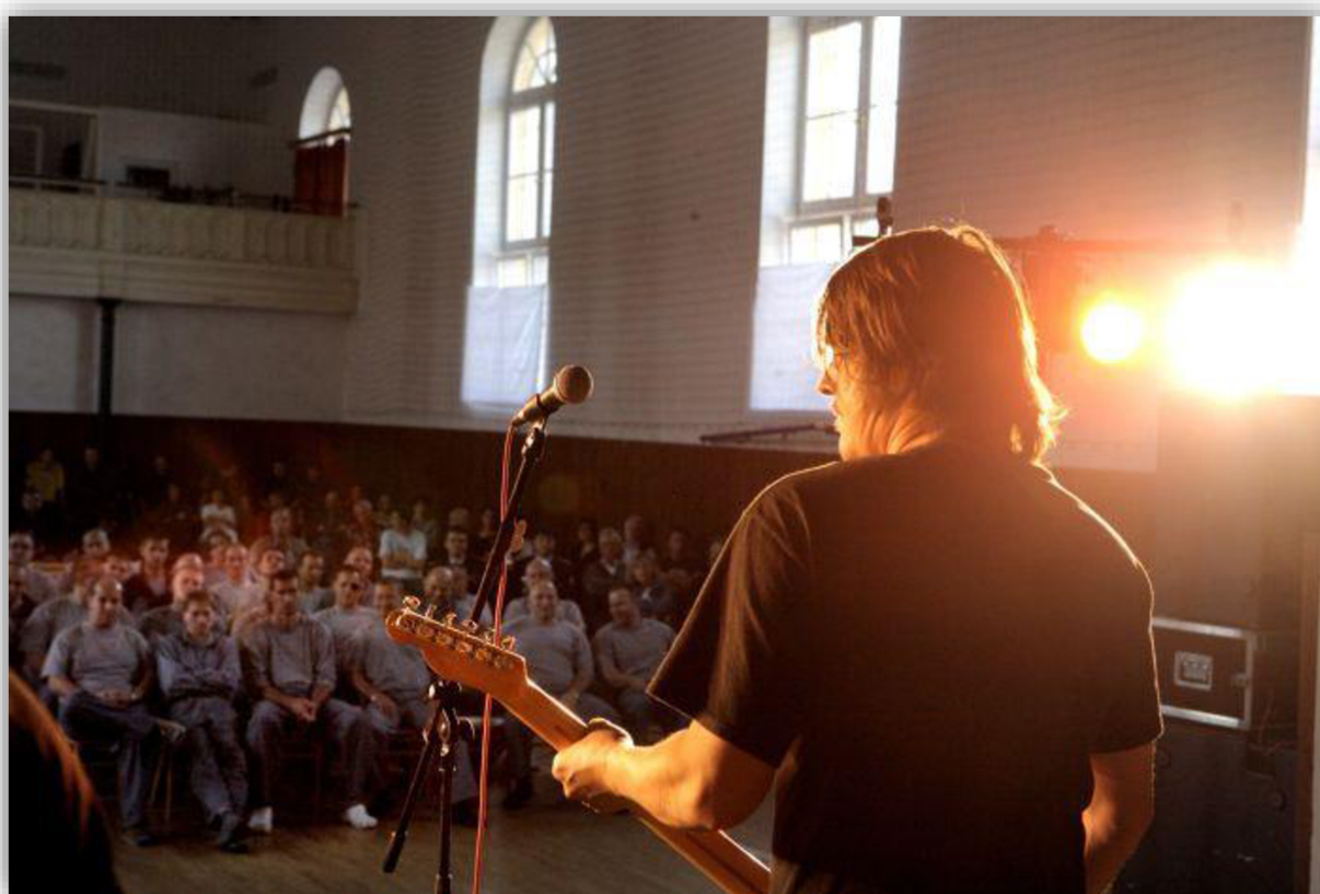
Příloha 1: Koncert kapely „Chinaski“ ve vazební věznici Praha Pankrác.