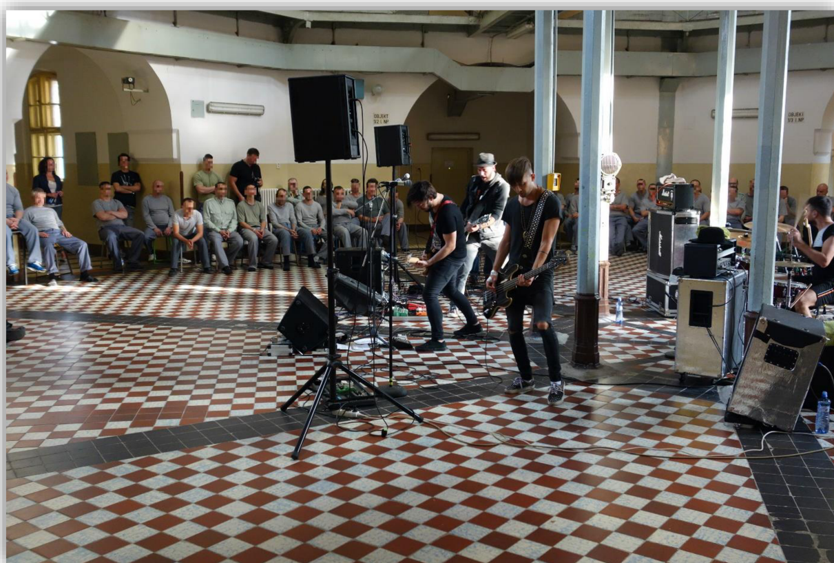
Příloha 3: Koncert kapely „Imodium“ ve Věznici Plzeň.