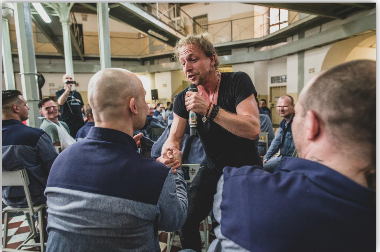
Příloha 4: Koncert Tomáše Kluse ve Věznici Plzeň.