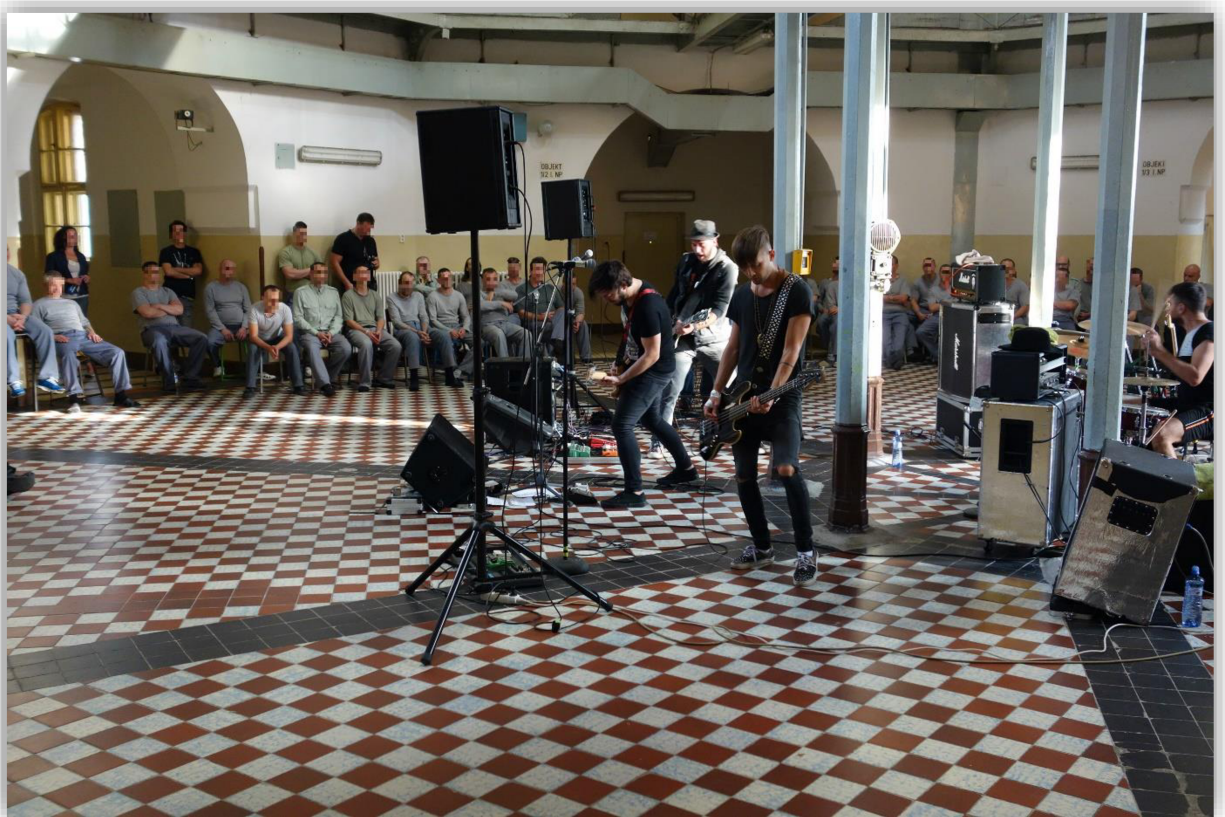
Příloha 3: Koncert kapely „Imodium“ ve Věznici Plzeň.