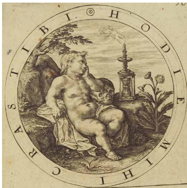
Hodie Mihi, Cras Tibi.

Emblém a dvojverší Gabriela Rollenhagena. Selectorum emblematum centuria .