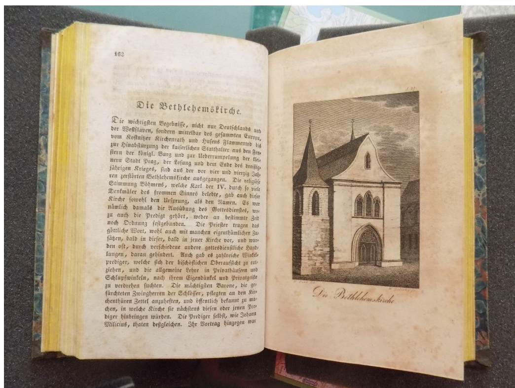
Obrázek 8: Ukázka úvodní strany pojednávající o Betlémské kapli (Diplomatische Geschichte der aufgehobenen Klöster, Kirchen und Kapellen in der königl. Hauptstadt Prag)