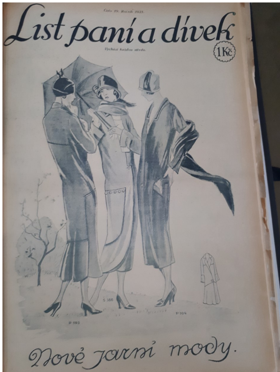
Příloha č. 4 - List 19/1925