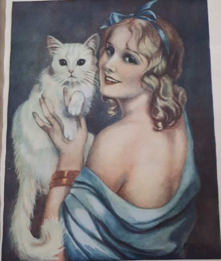
E. Horáková: Obrázek Cynthie z našeho nového románu.

Věrna až do smrti, až do strádání v africké pustině, až do odpuštění nevěry, až do krve, do krve, která je v tropech jako proklátá. Taková byla Pet, hrdinka našeho románu „KLETBA TROPŮ“, který právě dnes začíná. Tento nový román bude čtenářskou sensací všech československých rodin.