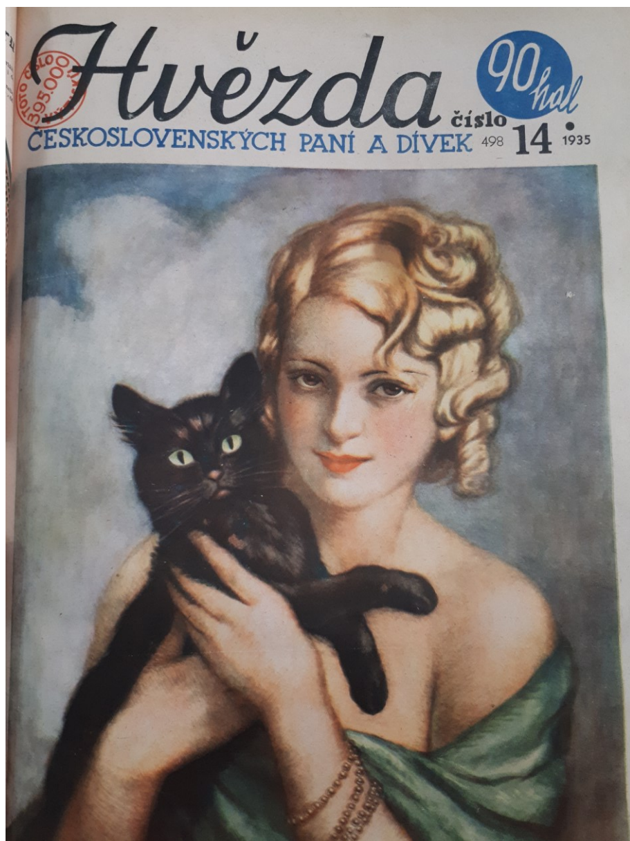
Příloha č. 8 - Hvězda 14/1935