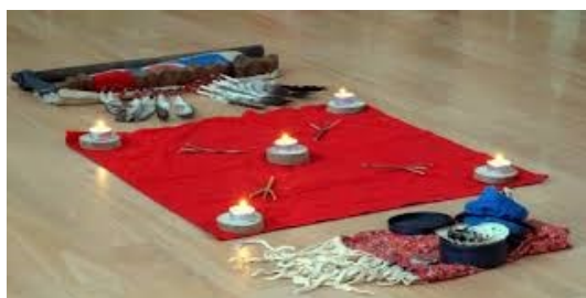
Obrázek 5: obřadní plátno