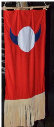
Obrázek 2: vlajka woodcraftu