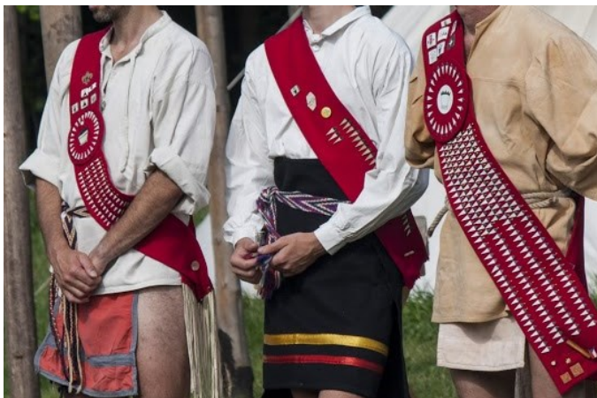
Obrázek 3: šerpa poct