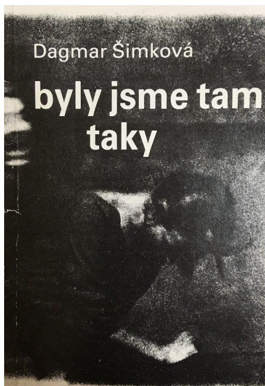
b) 1. vydání knihy Byly jsme tam taky .