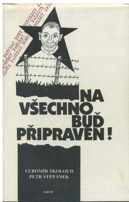
f) 1. vydání knihy Na všechno buď připraven . Foto: