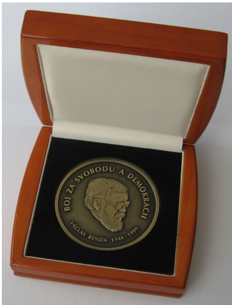
Obrázek 6 Cena Václava Benda