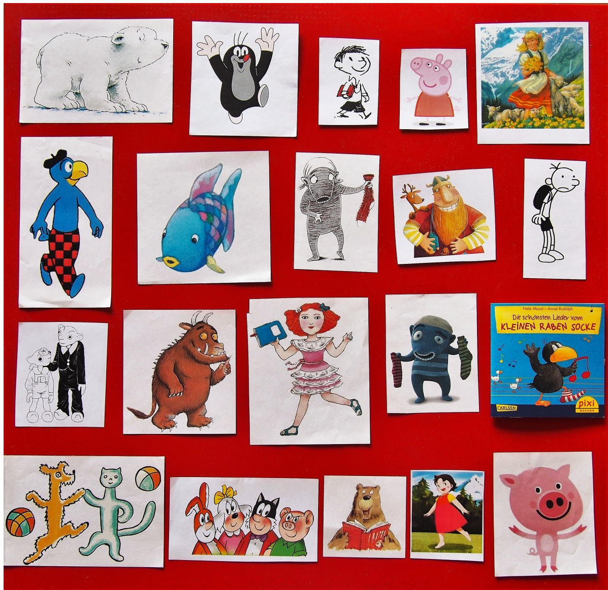
Příloha č. 5: Karty s postavami diskutovaných postav využívané při hloubkových rozhovorech (obrázek).