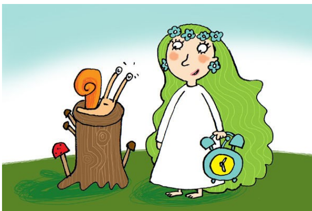
2 Vila Budínka