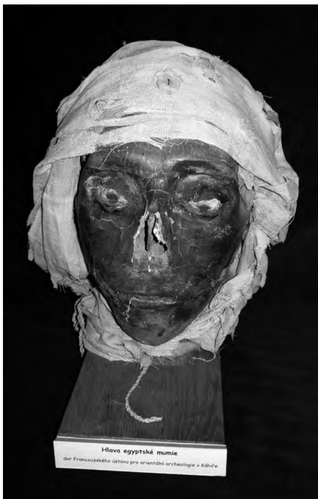
Obr. 4 Mumifikovaná hlava – Dér el-Medína (Egyptologická sbírka HMČ PřF UK)

(Fetter 1953: 24). Hrdlička s Matiegkou úzce spolupracoval nejen při budování Muzea člověka, ale rovněž při činnosti Anthropologického ústavu. Hrdlička věnoval ústavu velkou část své knihovny a velmi cenné sbírky. Ke sbírkám, které si vyměnili Hrdlička s Matiegkou, patřily rovněž ostatky starověkých Egypťanů. Hrdličkův zájem o antropologii Slovanů Matiegka na oplátku uspokojil kosterním materiálem pocházejícím z asanace Starého a Nového Města pražského na přelomu 19. a 20. století, kterým rozšířil sbírky oddělení fyzické antropologie Národního muzea ve Washingtonu při Smithsonianovém institutu.