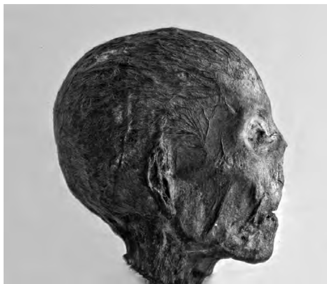
Obr. 5 Mumifikovaná hlava – Dér el-Medína (Egyptologická sbírka HMČ PFF UK, foto D. Špinková)

kosterním materiálu však bohužel nejsou žádné záznamy v inventární knize Anthropologického ústavu ani Hrdličkova muzea člověka a rekonstrukce cesty tohoto materiálu do egyptologické sbírky muzea, jakožto i dalších předmětů, si žádá podrobnější výzkum.