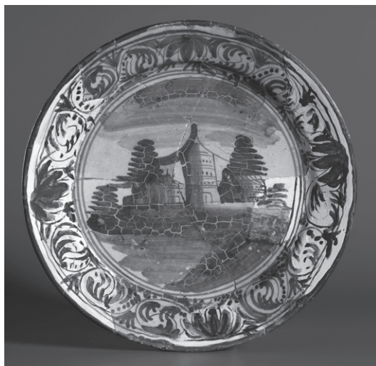
OBR. 8: Pražský hrad, odpadní jímka C, talíř, fajáns — inv. č. 316.

Nálezy skla z valné části náležejí k průměrnému renesančnímu sortimentu, ale i zde se vyskytly jednotlivosti patrně zahraniční proveniencie. Jedná se především o nález fragmentu tzv. chalcedonového skla, které se vyrábělo poprvé kolem roku 1500. 26 S ohledem na datování nálezového celku je pravděpodobné, že by se mohlo jednat o výrobek benátských dílen. Mezi vzácně dochovávané tvary náležejí hygienické sklo, v tomto případě reprezentované urinalem.