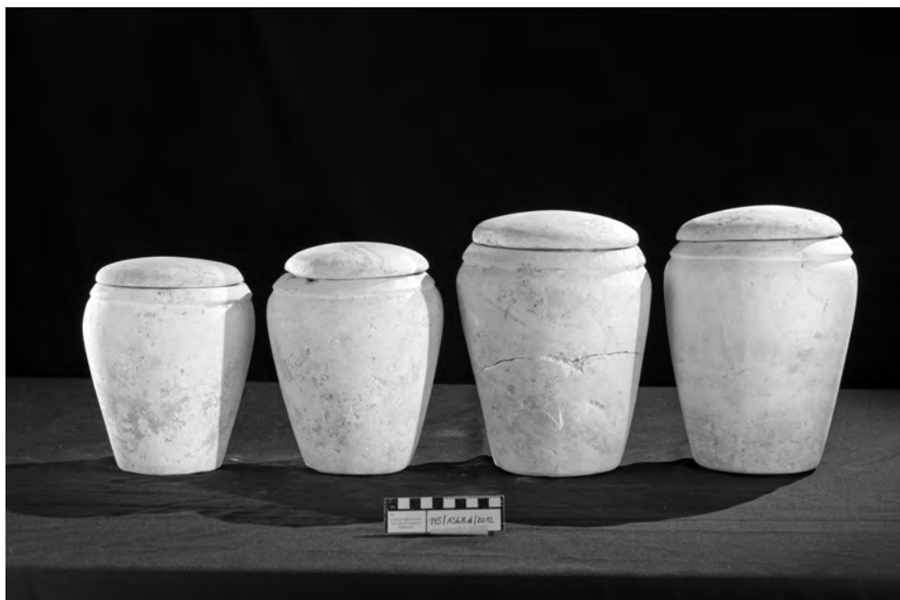
Obr. 3 Kanopy nalezené v pohřební komoře Neferhathor, která se nachází ve skalní hrobce AS 68d v Abúsiru (foto M. Frouz)

zvolen. Mezi kamennými nádobami z doby před 4. dynastií, kdy se kanopy objevují poprvé, je možné nalézt takové, které se pozdějším kanopám poměrně dost podobají. Jedná se o konvexně tvarované nádoby s výraznějšími plecemi (Reisnerův typ V, srov. Reisner 1931: 145; El-Khouliho třída III, srov. El-Khouli 1978: 231–324, Pl. 63–82). Někdy mívají připojená i vrtaná ouška, která v Raně dynastické době už spíše jen napodobují dřívější prvek umožňující přenášení nádob pomocí zavěšení na provázky.