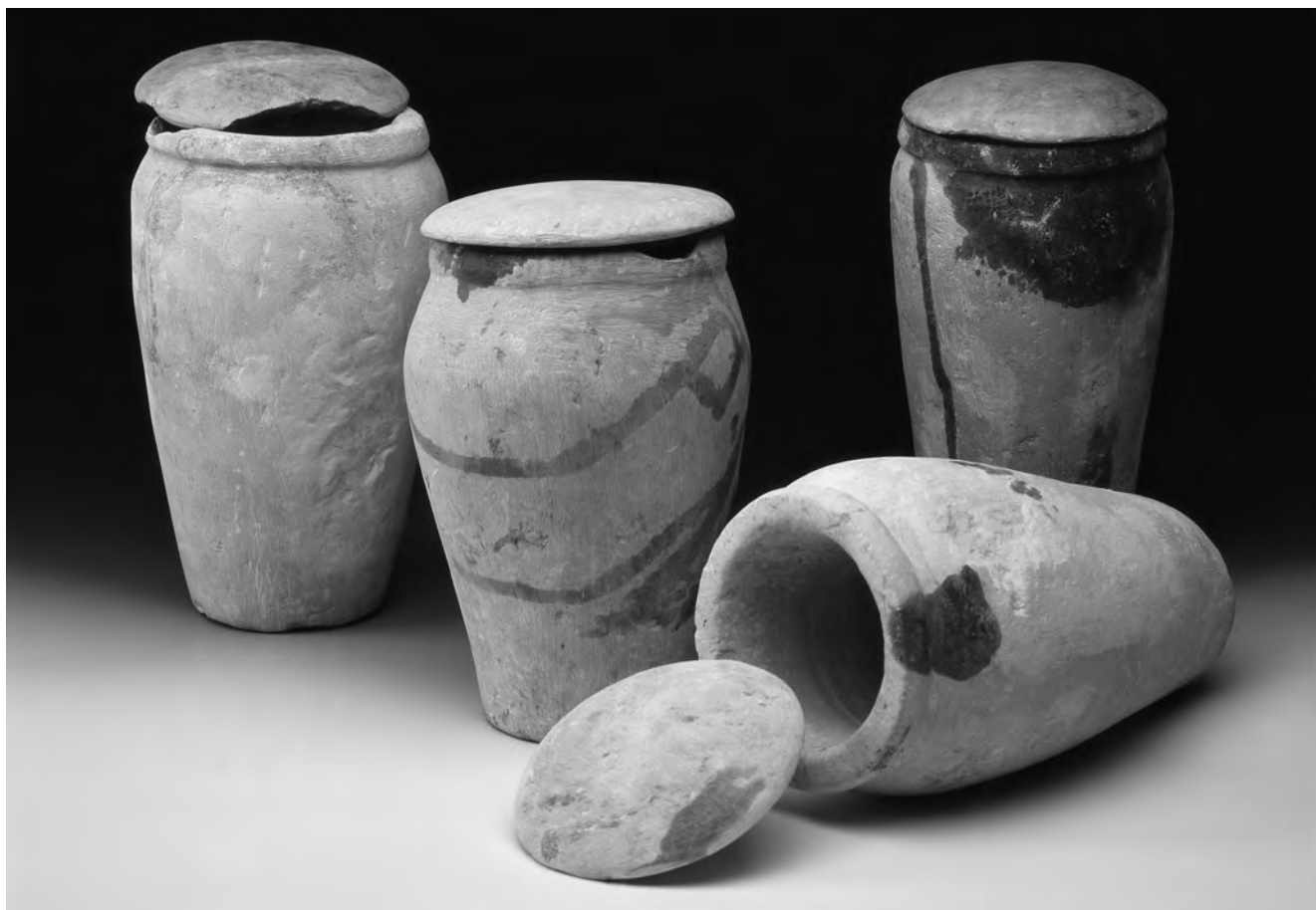
Obr. 1 Kanopy princezny Chekeretnebtet, objevené v její hrobce v Abúsíru, nesou částečně vně i uvnitř hnědé skvrny