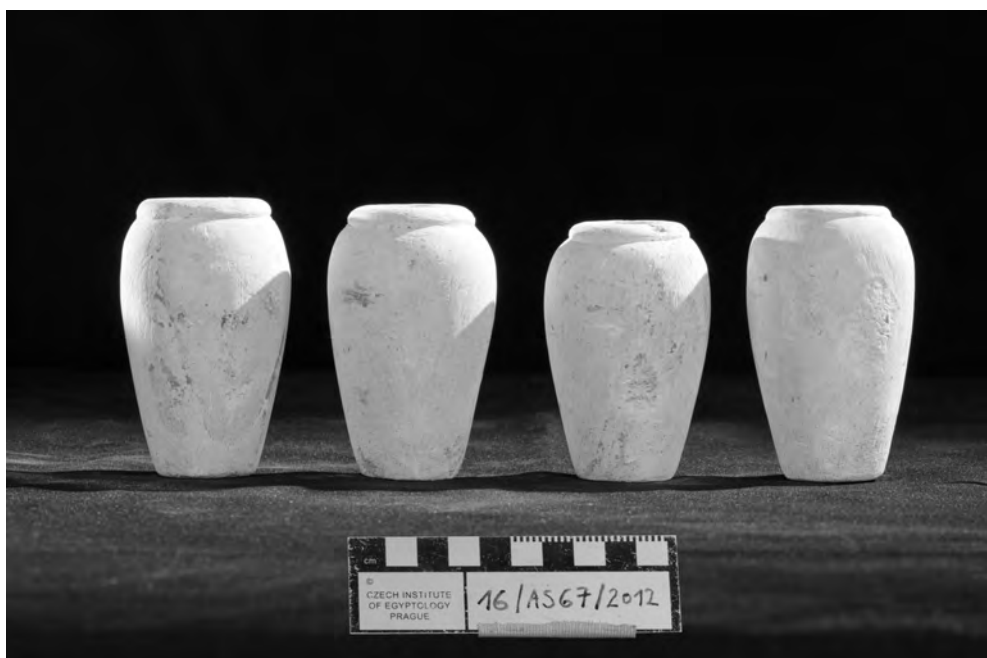
Obr. 4 Modely nádobek tvarem podobné kanopám z pohřební komory šachty 1 mastaby AS 67

(Firth – Gunn 1926: Pl. 6). V těchto případech však šlo spíše o nádoby na oleje a masti, někdy doplněné menšími uchy.