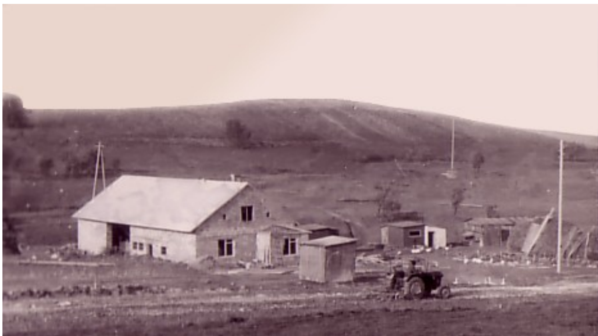
Stavba prvních domů.