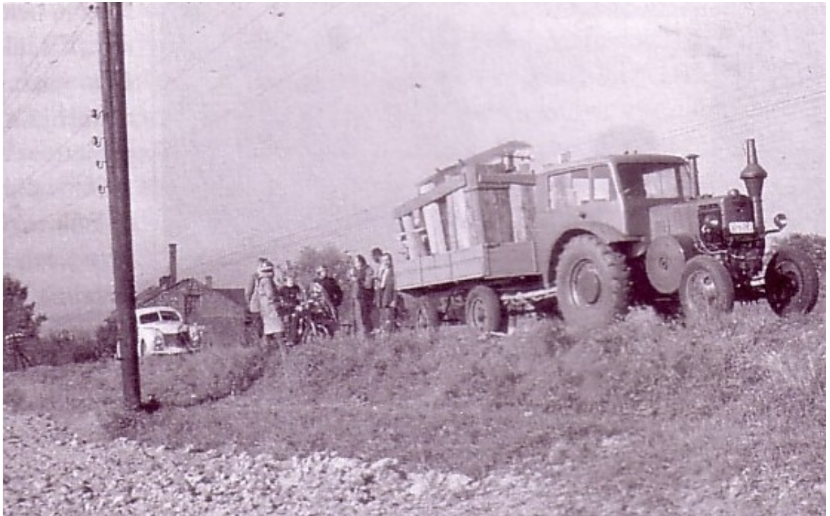
Stěhování osadníků do Bieszczad.