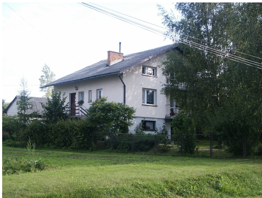
Již zmodernizovaný dům ve Woli Piotrowej.