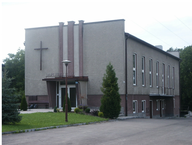
Dům modlitby ve Woli Piotrowej.