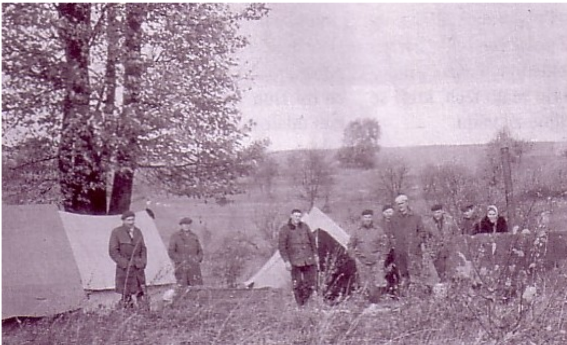
Na počátku mnozí bydleli ve stanech.