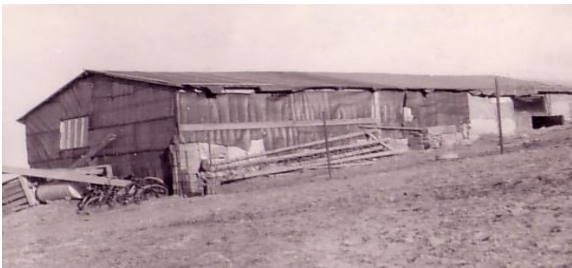
Jeden z prvních baráčků.