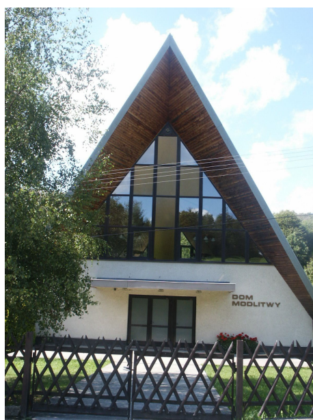
Dům modlitby w Puławach.