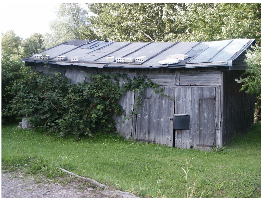
Jeden z původních baráčků stojí dodnes ve Woli Piotrowej.