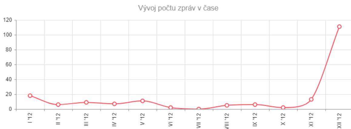
Příloha č. 1: Vývoj počtu zpráv během roku 2012 (graf)