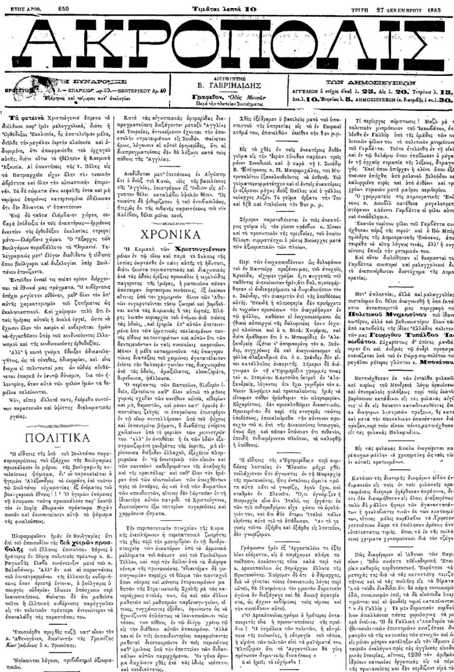
Akropolis. In: Ethniki Vivliothiki tis Ellados [online]. [cit. 2018-01-02]. Dostupné z: http://efimeris.nlg.gr/ns/pdfwin.asp?c=126&dc=27&db=12&da=1883 .