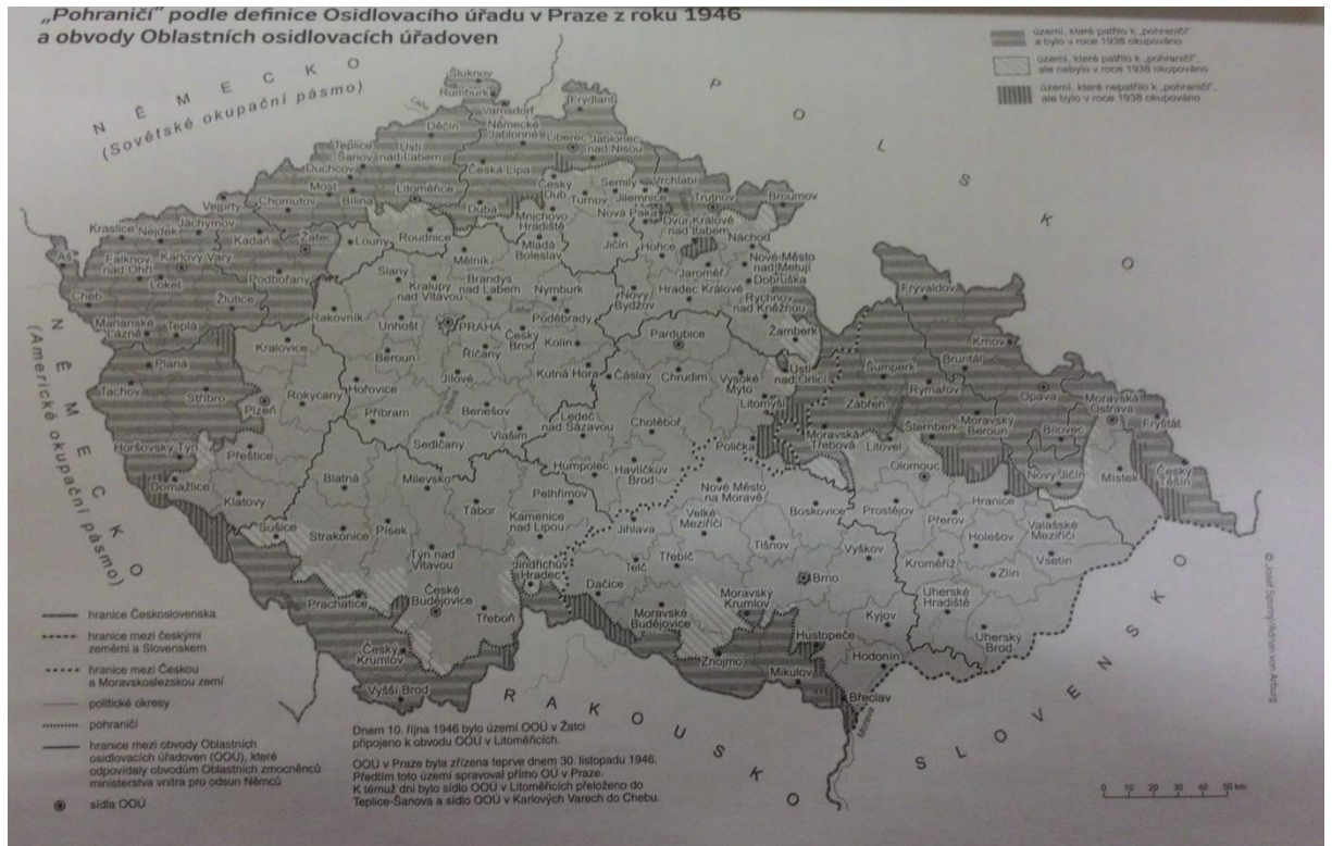
Obrázek č. 3: Pohraničí podle definice Osidlovacího úřadu v Praze z roku 1946 a obvody Oblastních osidlovacích úřadoven