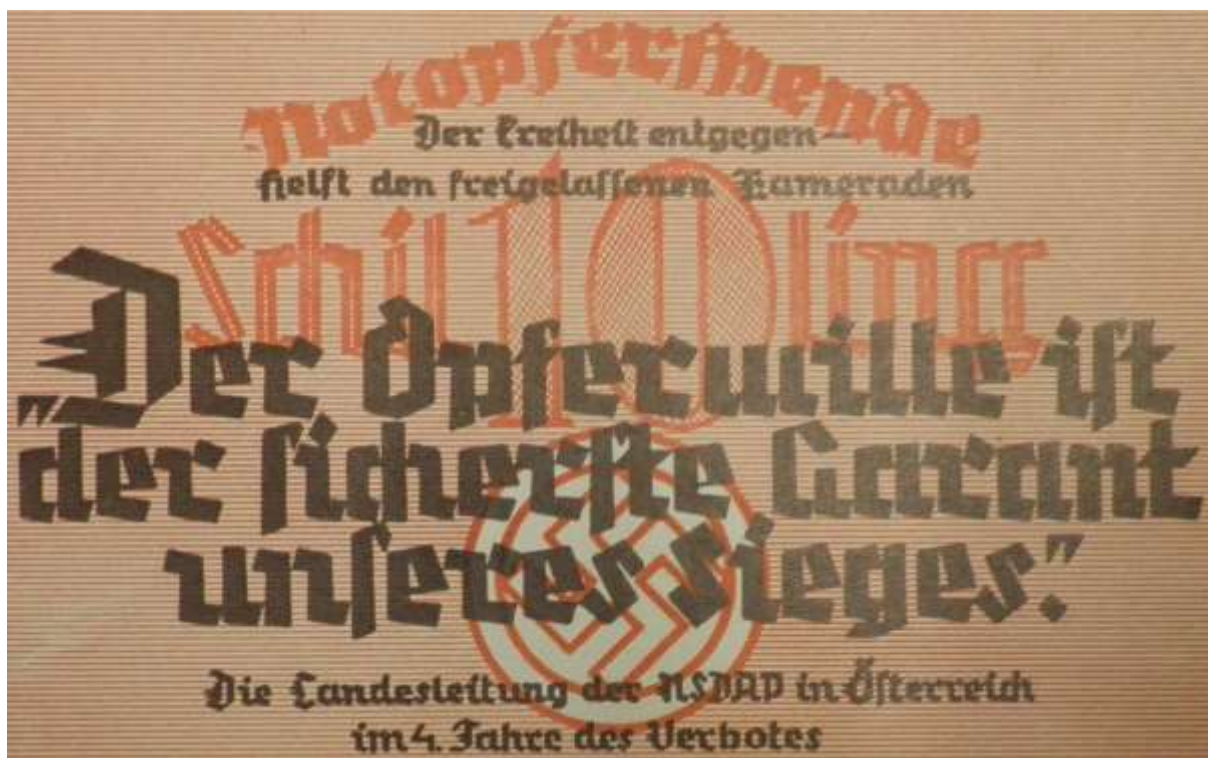
Obrázek č. 1: Notopferspendeschein ve výši 10 Šilinků, WStLA, 1936

Šlo bezpochyby o reakci na amnestii spojenou s červencovou dohodou, která měla finančně pomoci propuštěným příslušníkům SS. Celá akce měla být koordinována s Hilfswerk NSDAP, jejímž krajským vedoucím měly být předávány jmenné seznamy. Kupř. koncem října obdržel Sturbann I od vedoucího okresu č. 302 ( Kreisleiter Nr. 302 ) částku 70 Šilinků na pomoc bývalým vězňům. 1082 Finanční pomoc měla propuštěným nacistům plynout také prostřednictvím dalších Notopferspendescheine vydávaných v různých hodnotách. 1083