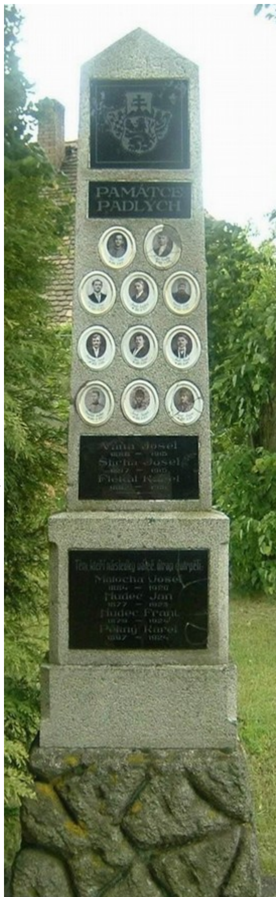
23. Chaběrice, pomník padlých →