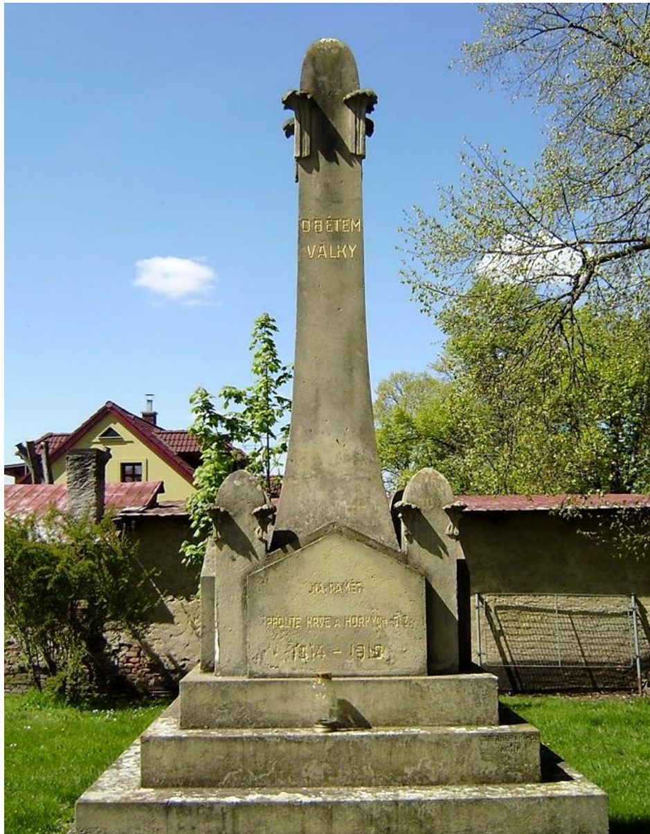
68. Hlízov, pomník padlých