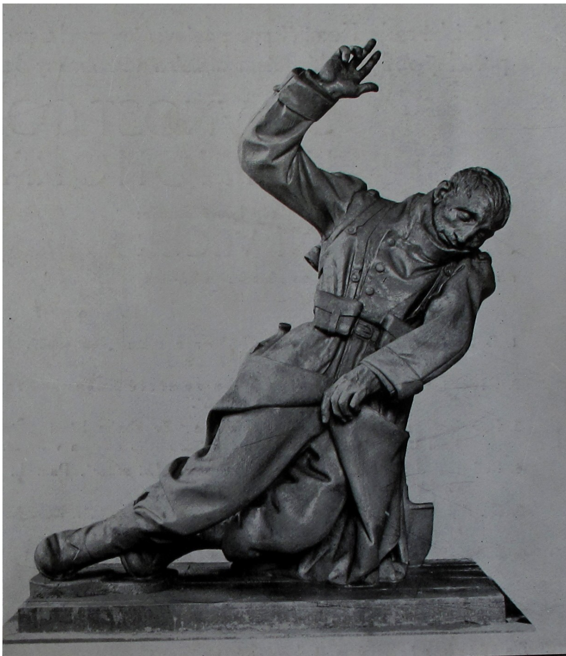
55. Kutná Hora , model tamějšího pomníku padlých