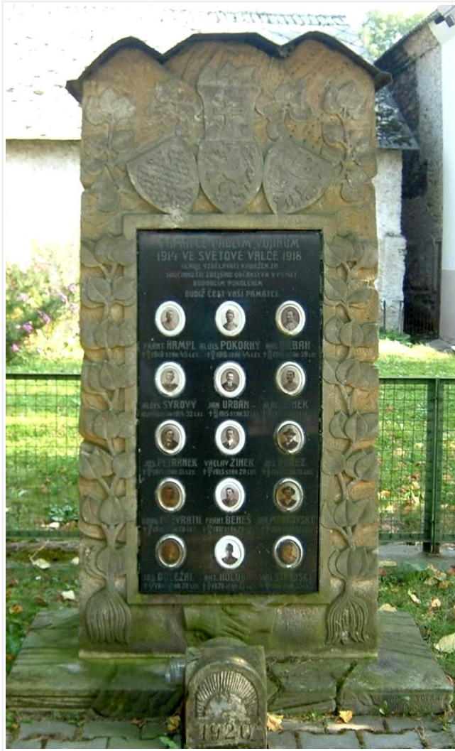
← 38. Dobřeň, pomník padlých