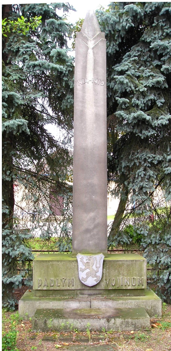
↑ 97. Žehušice , pomník padlých