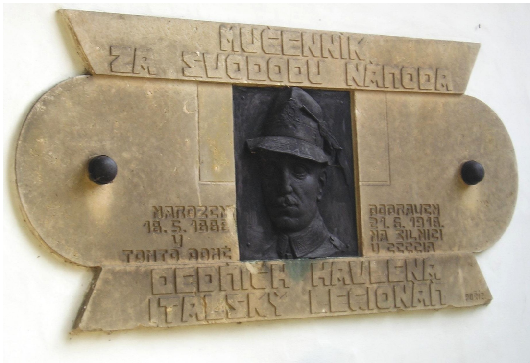
↑ 72. Nová Lhota , pamětní deska legionáře Havleny, na domu čp. 2