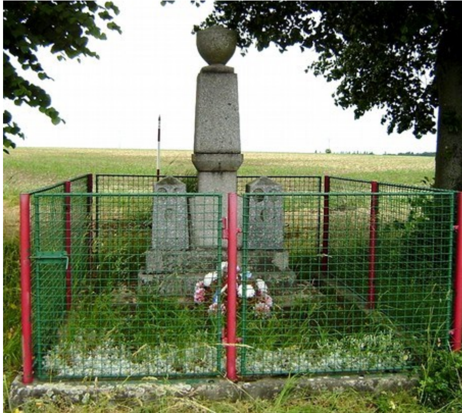
↑ 7. Nechyba, pomník