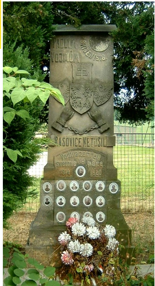
31. Rašovice, pomník padlých →