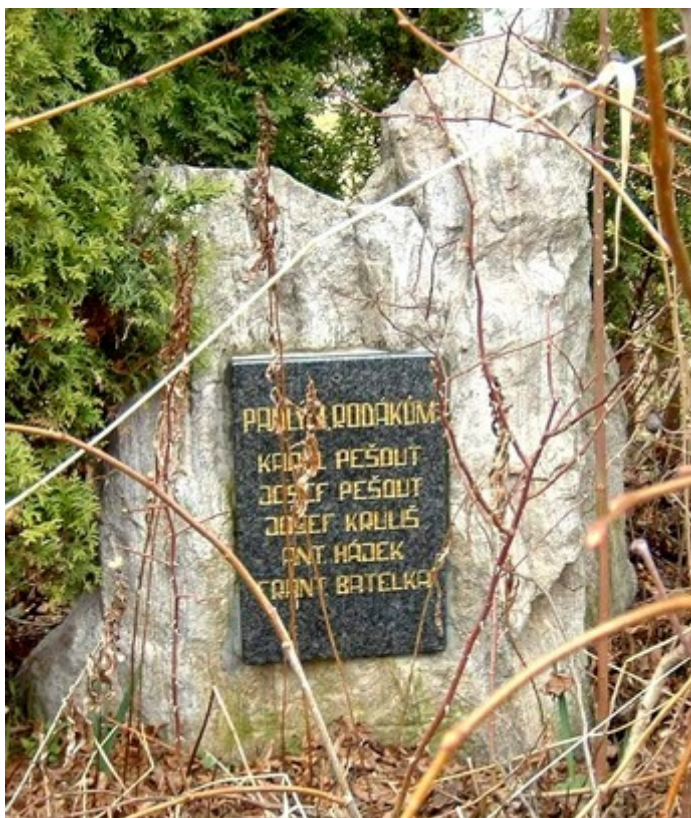
← 52. Hetlín , pomník padlých