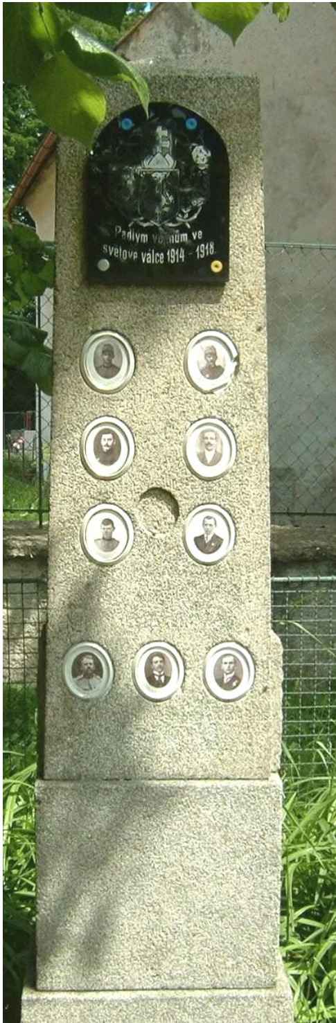
64. Třebetín, pomník padlých