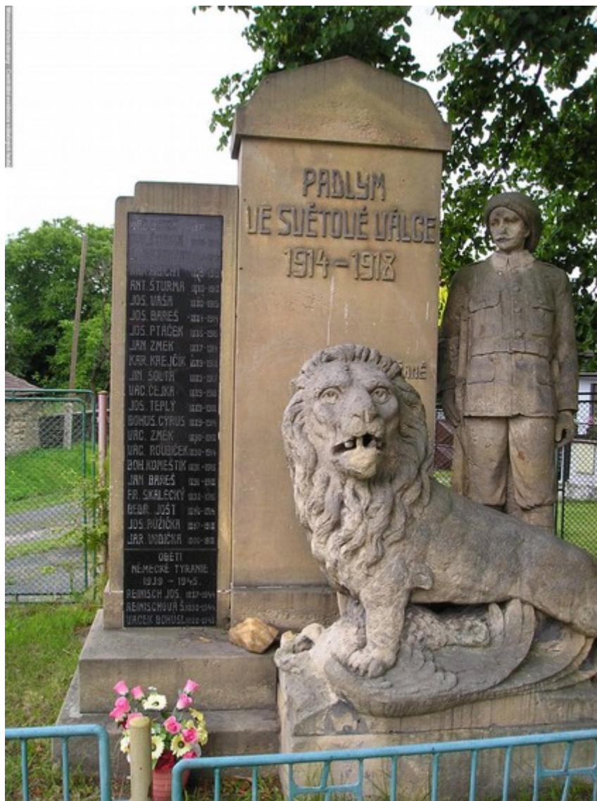
108. Semtěš, pomník padlých