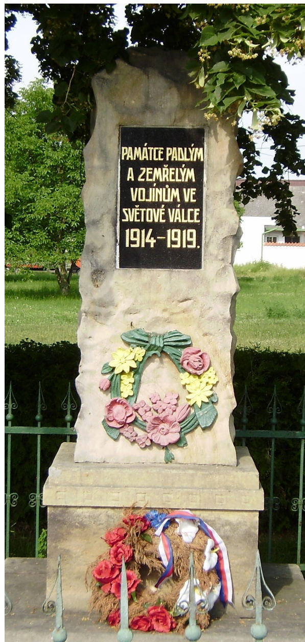
83. Jakub, pomník padlých