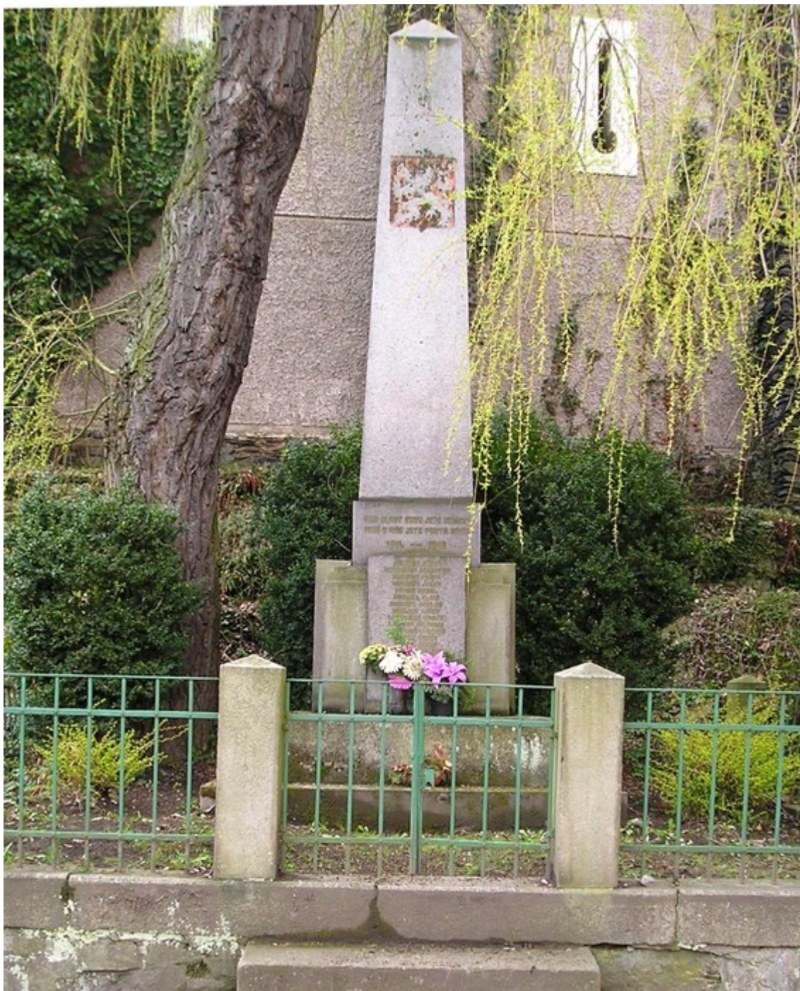
107. Žleby, pomník padlých, u vchodu do zámeckého areálu