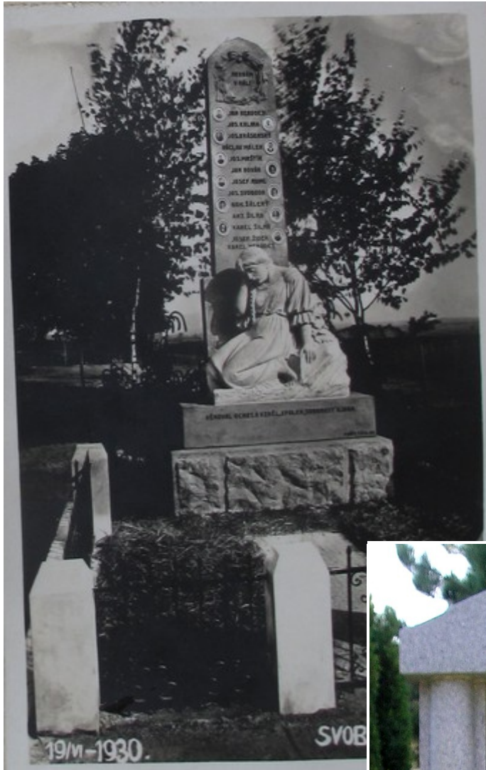
↑ 101. Svobodná Ves, pomník padlých 102. Horka I, pomník padlých →