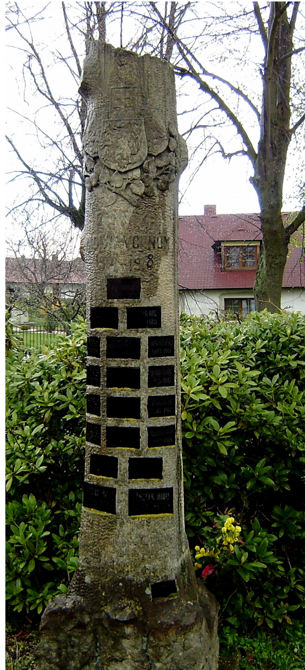
65. Paběnice, pomník padlých