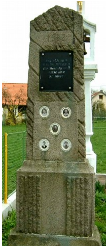
↑ 8. Radvanice, pomník