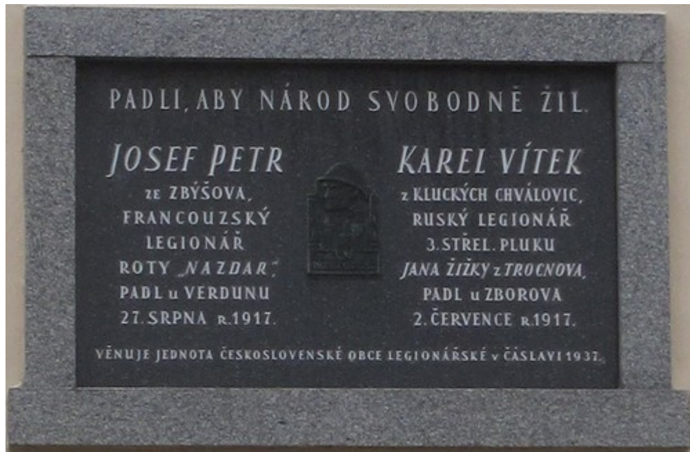
77. Zbýšov, pamětní deska legionářů, na budově základní školy