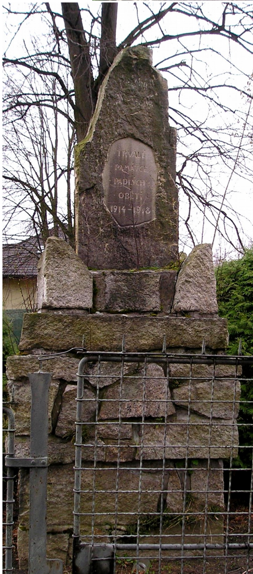
↑ 91. Štrampouch, pomník padlých