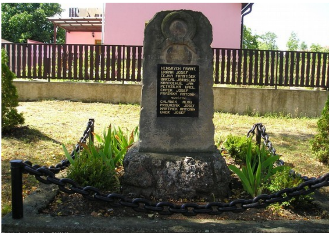
76. Hraběšín, pomník padlých