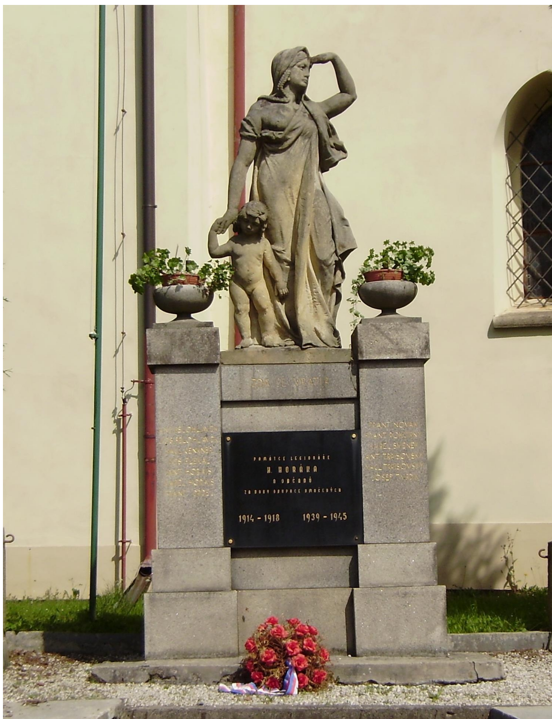
54. Bohdaneč, pomník padlých, před kostelem