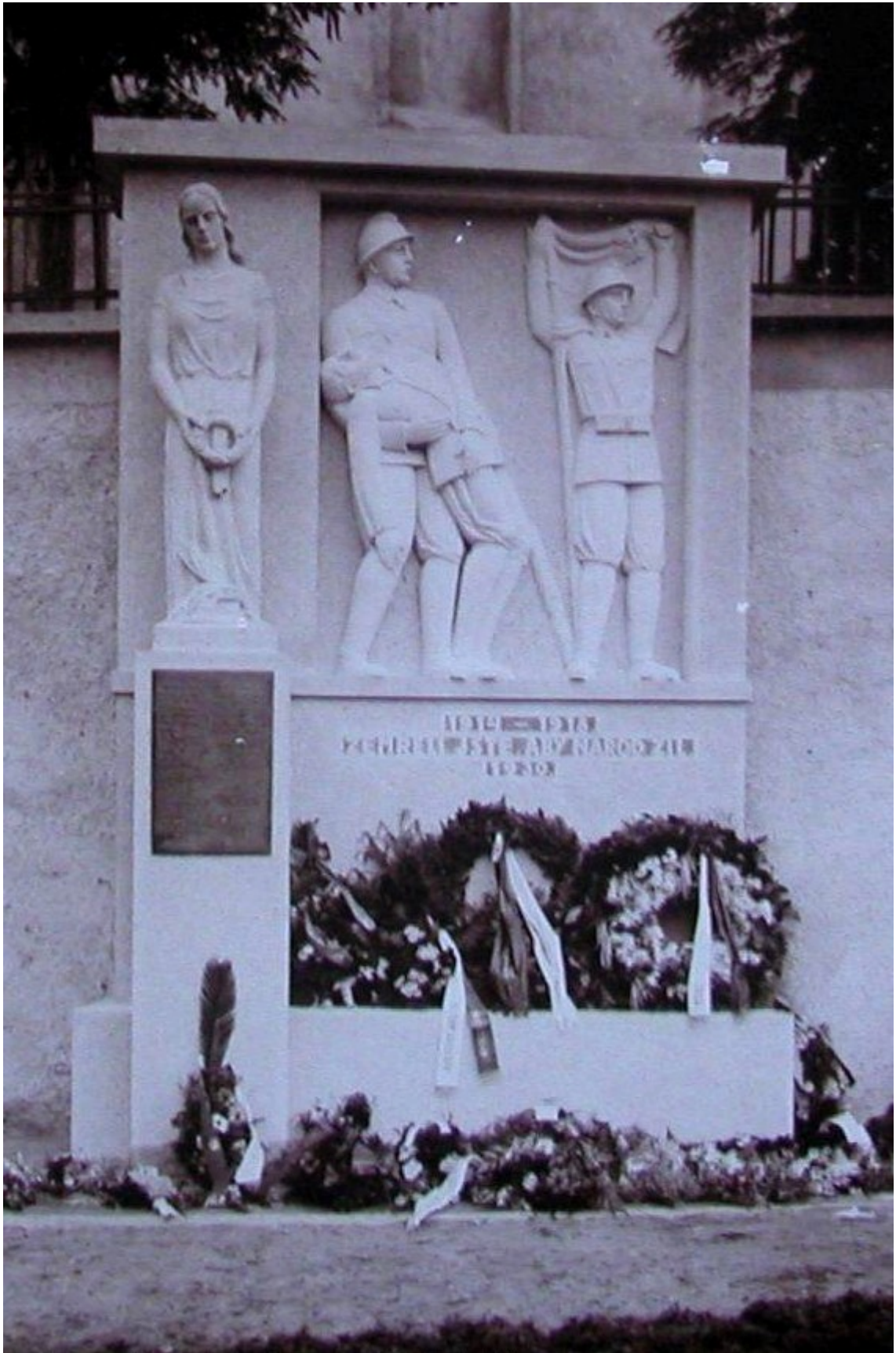
11. Kácov, pomník padlých, na náměstí vedle zámku