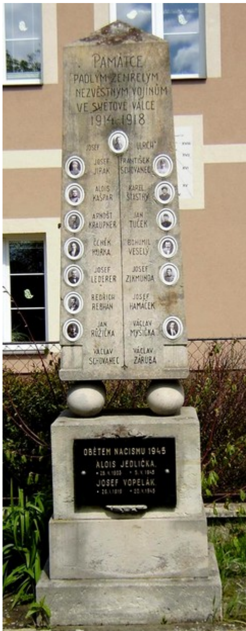
82. Církvice, pomník padlých