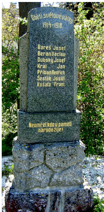
2. Samopše, pomník