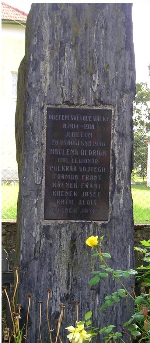
← 73. Nová Lhota , pomník padlých