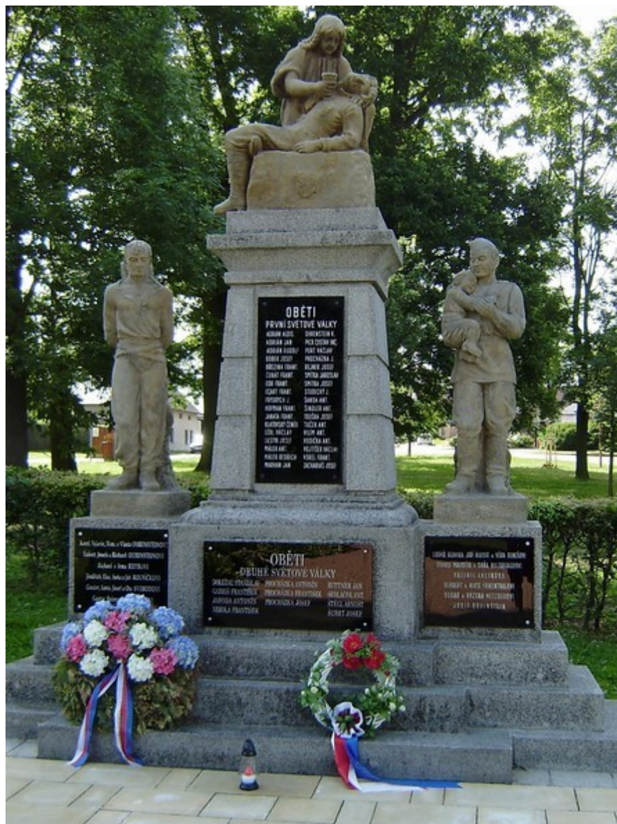
25. Zruč nad Sázavou, pomník obětem 1. a 2. světové války, Malostranské náměstí