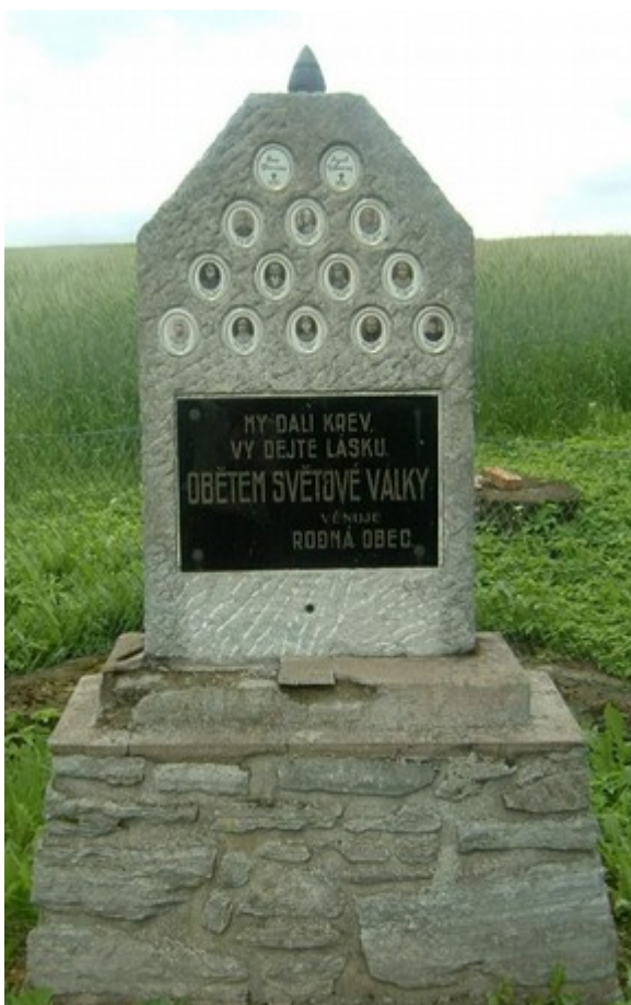
↑ 22. Řendějov - Nový Samechov, pomník obětem světové války