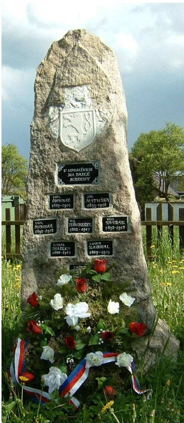
62. Senetín, pomník padlých