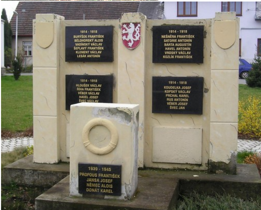
↓ 94. Tupadly, pomník padlých