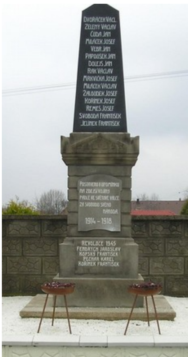
105. Okřesaneč , pomník padlých