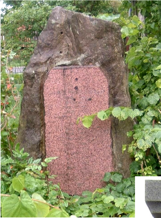
← 44. Kralice , pomník padlých