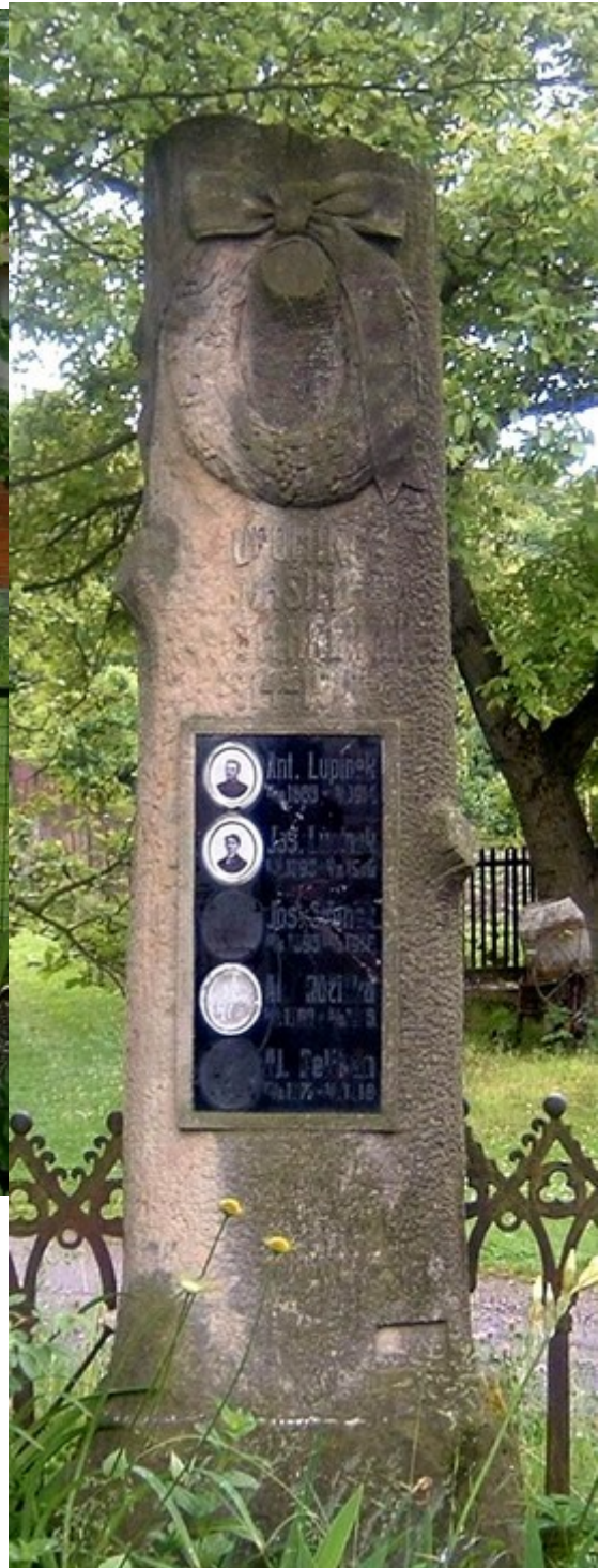
43 Chroustkov, pomník padlých →