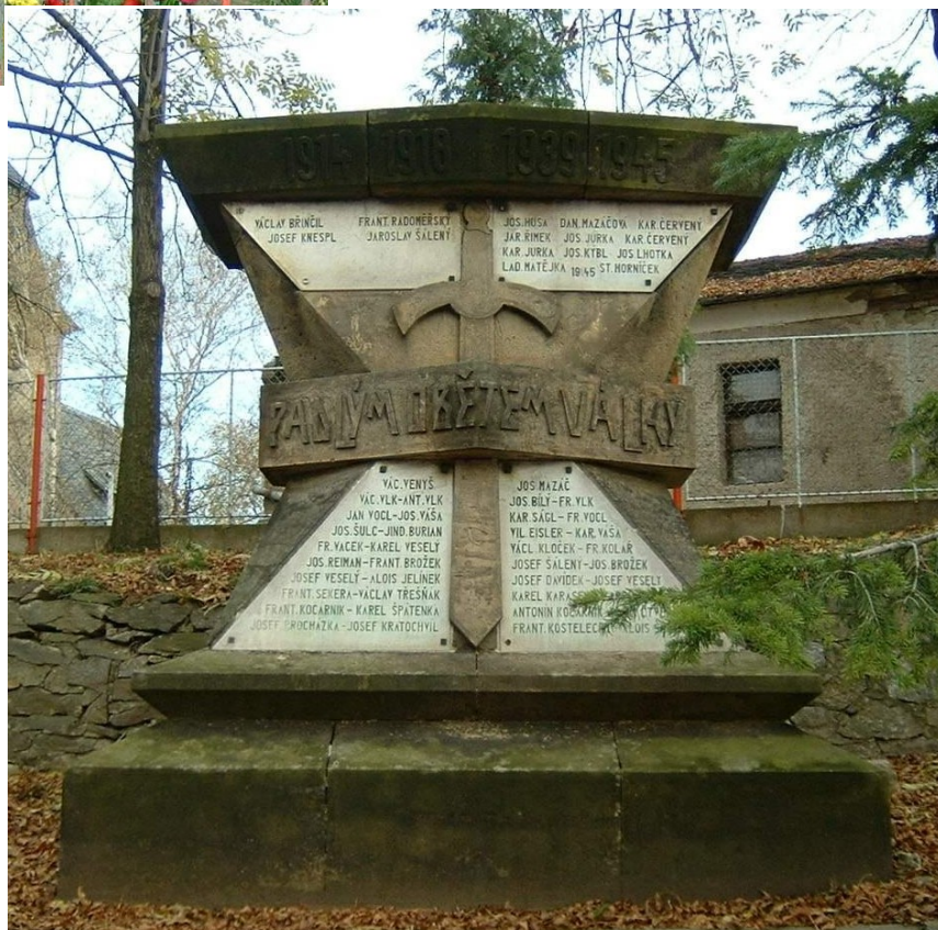
↓ 57. Malín , pomník padlých