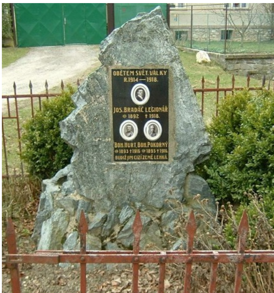
↓ 53. Černíny – Zdeslavice , pomník padlých