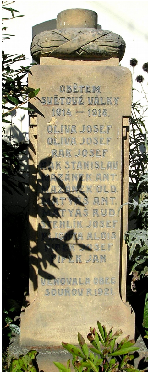
← 66. Souňov , pomník padlých