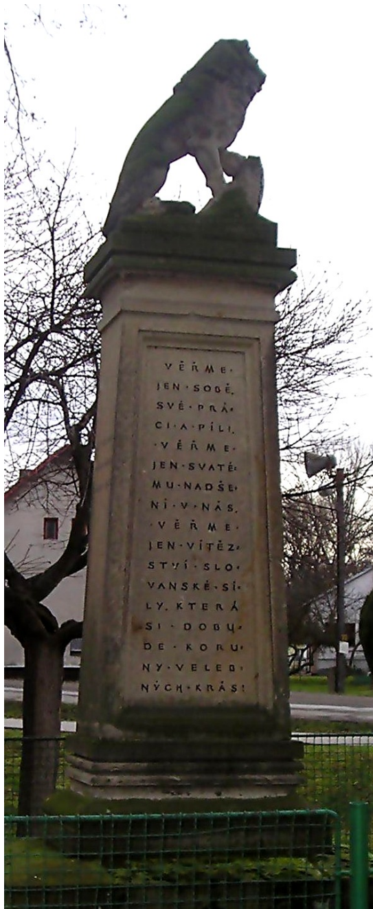
84. Močovice, pomník padlých