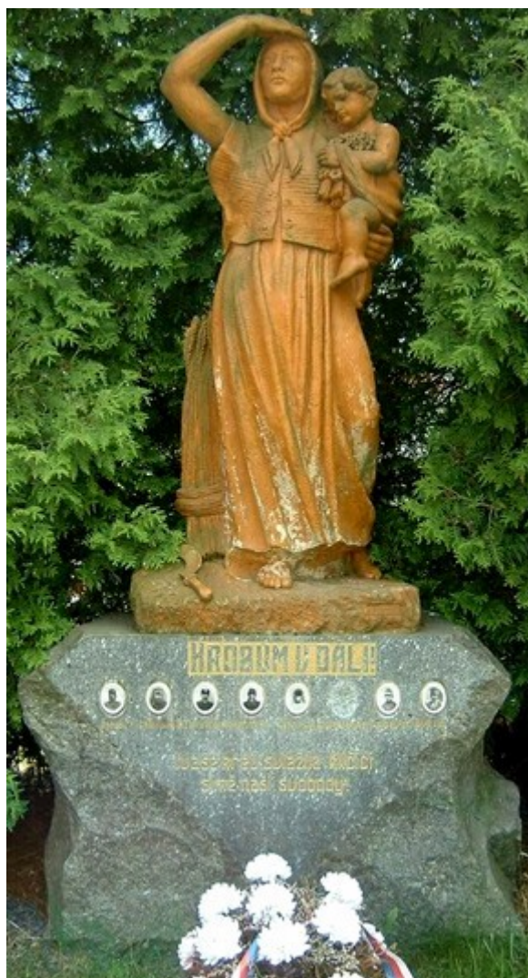
17. Staňkovice – Chlum, pomník, na návsi