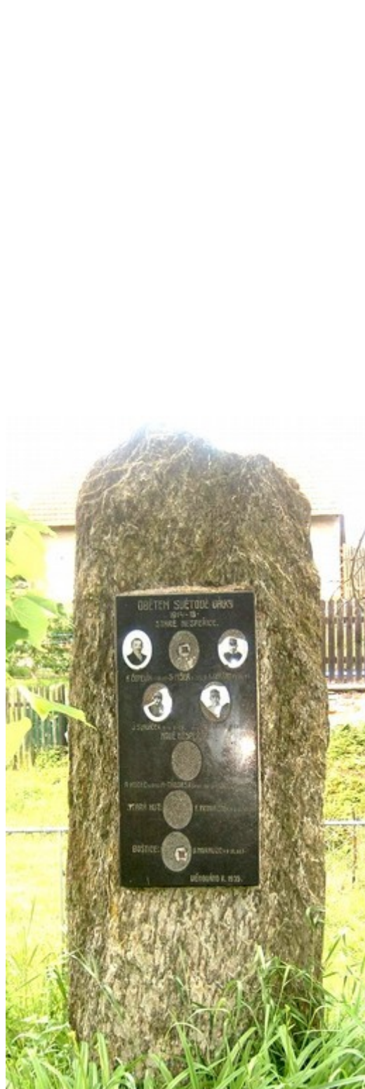
21. Staré Nespeřice, pomník padlých