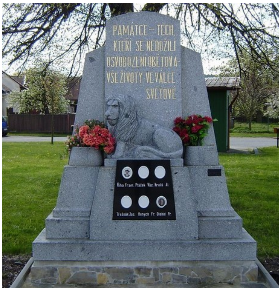
↑ 40. Solopysky, pomník padlých