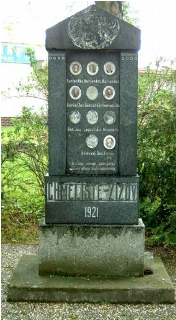
14. Chmeliště, pomník padlých