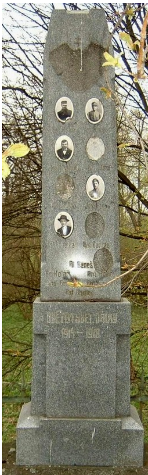
6. Chrastná, pomník padlých