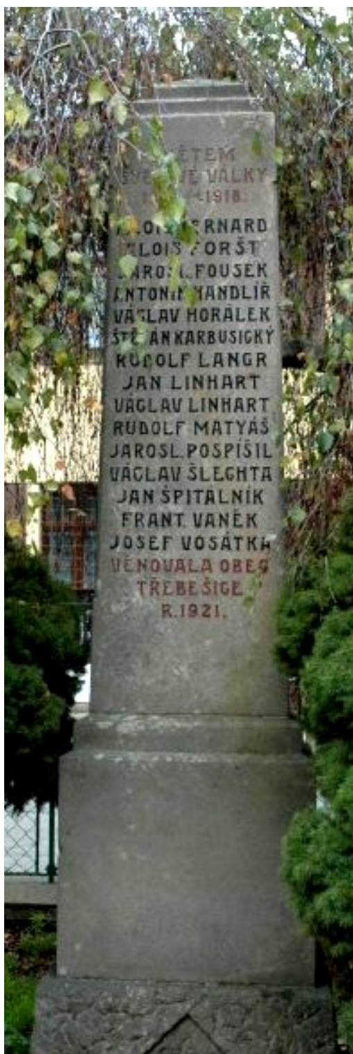
70. Třebešice, pomník padlých