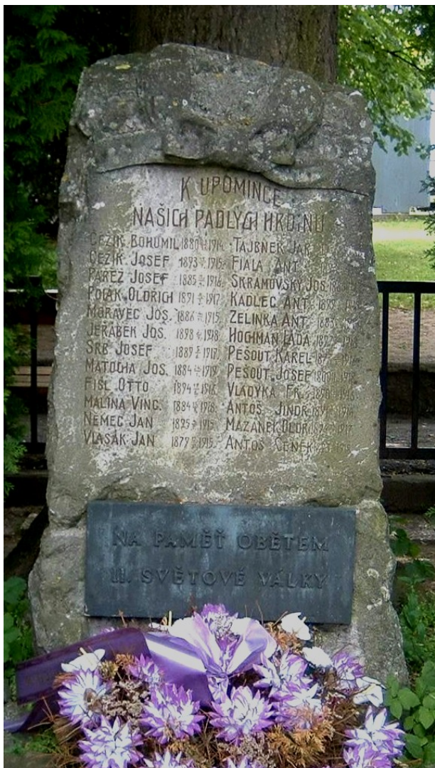
← 36. Zbraslavice, pomník padlých