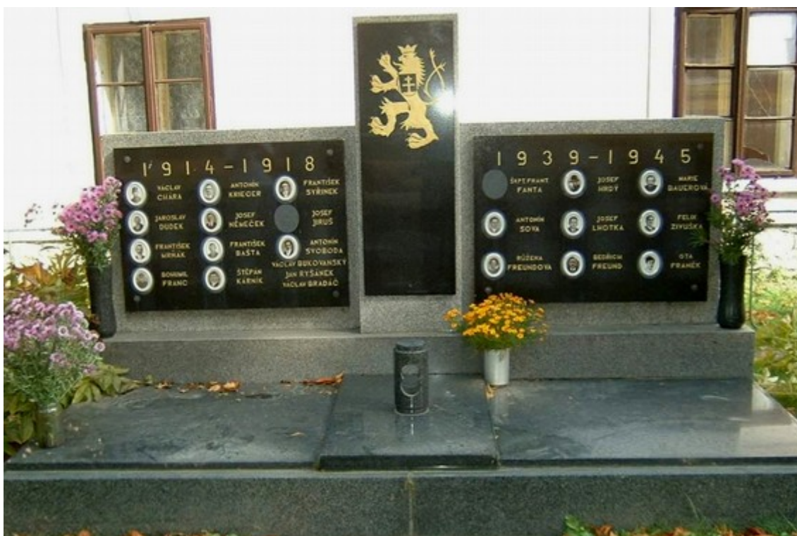
↓ 37. Suchdol, pomník padlých