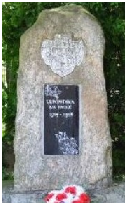
63. Újezdec, pomník padlých