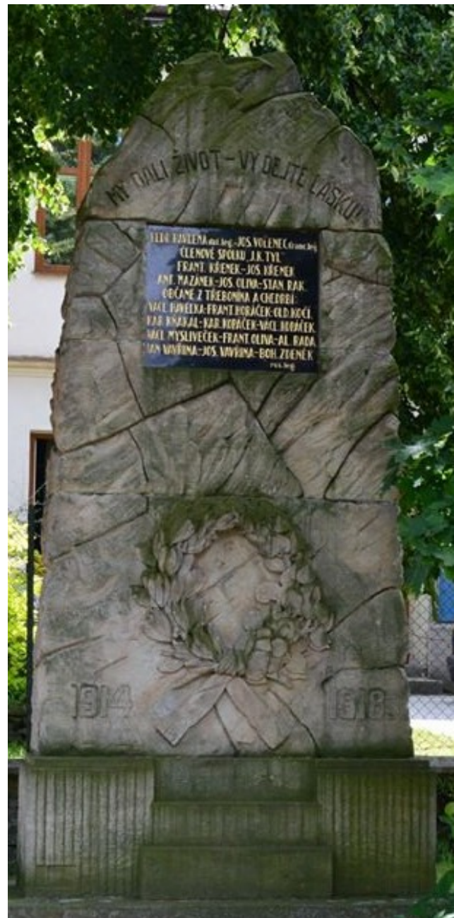
↓ 67. Třebonín , pomník padlých