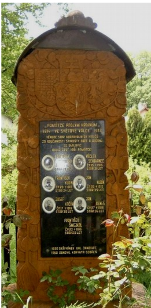
16. Smilovice, pomník padlých