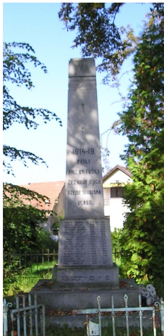
106. Starkoč , pomník padlých