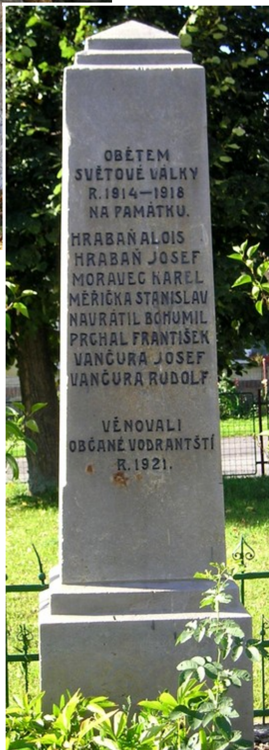
75. Vodranty, pomník padlých →