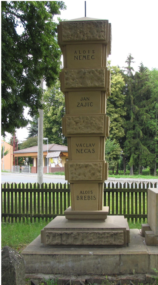
↑ 95. Drobovice, pomník padlých