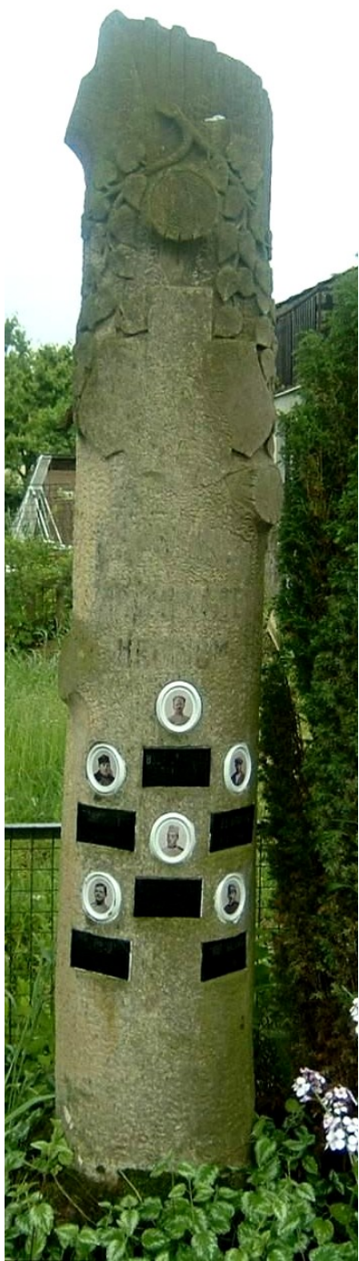
↓ 47. Miskovice, pomník padlých