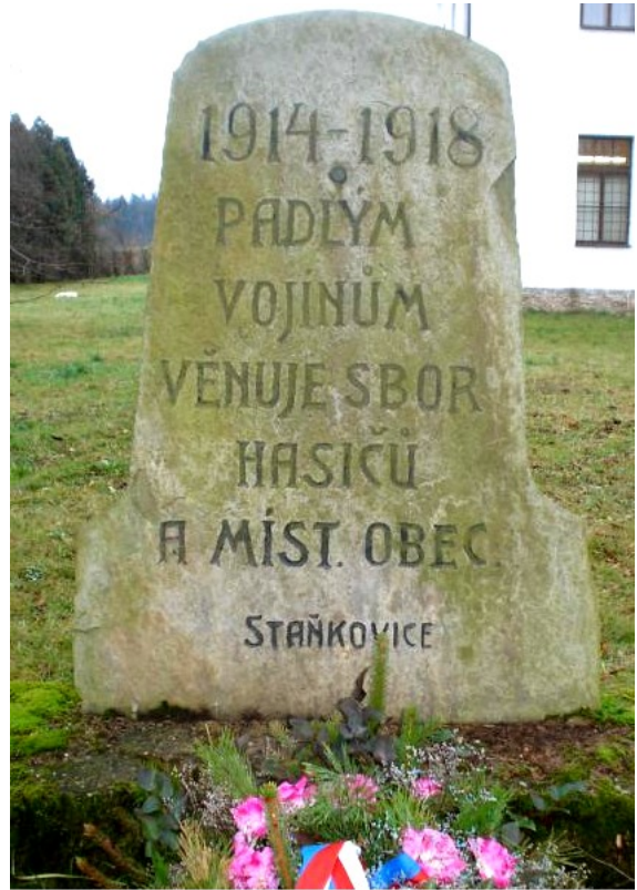
15. Staňkovice, pomník padlých, před OÚ