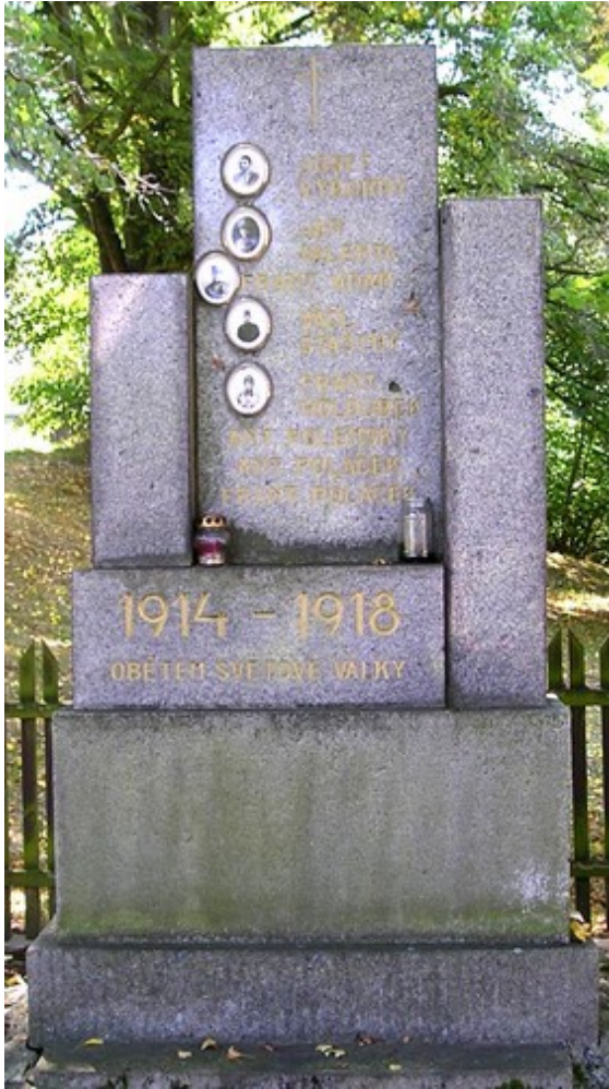
← 80. Krchlebská Lhota, pomník padlých