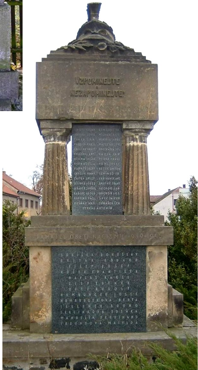
↓ 81. Nové Dvory, pomník padlých