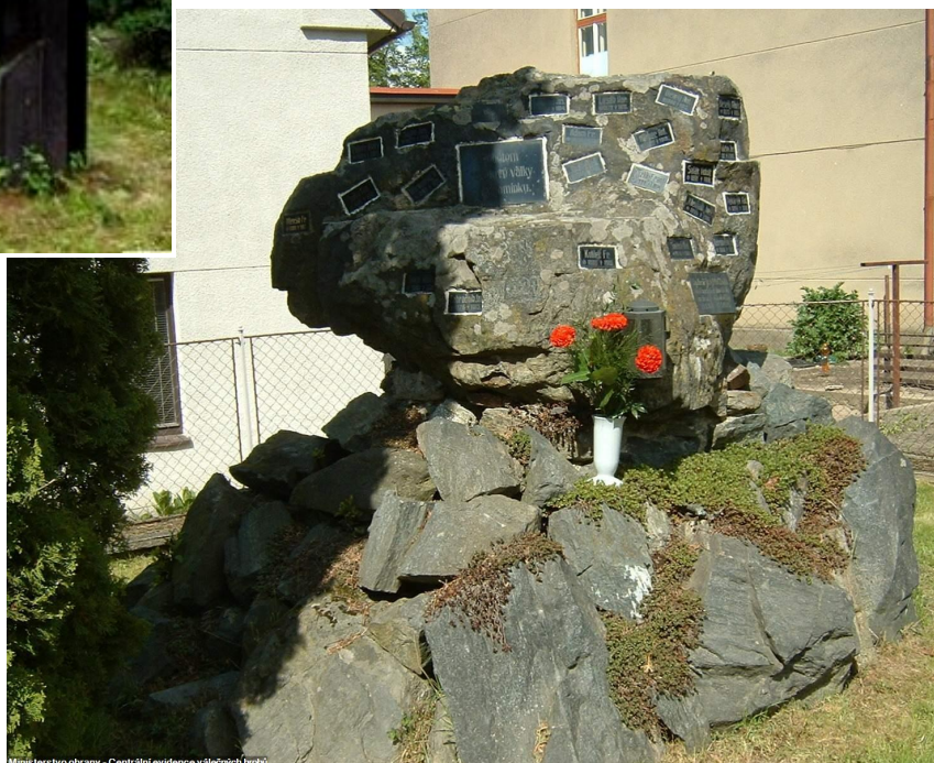
↓ 59. Červené Janovice , pomník padlých