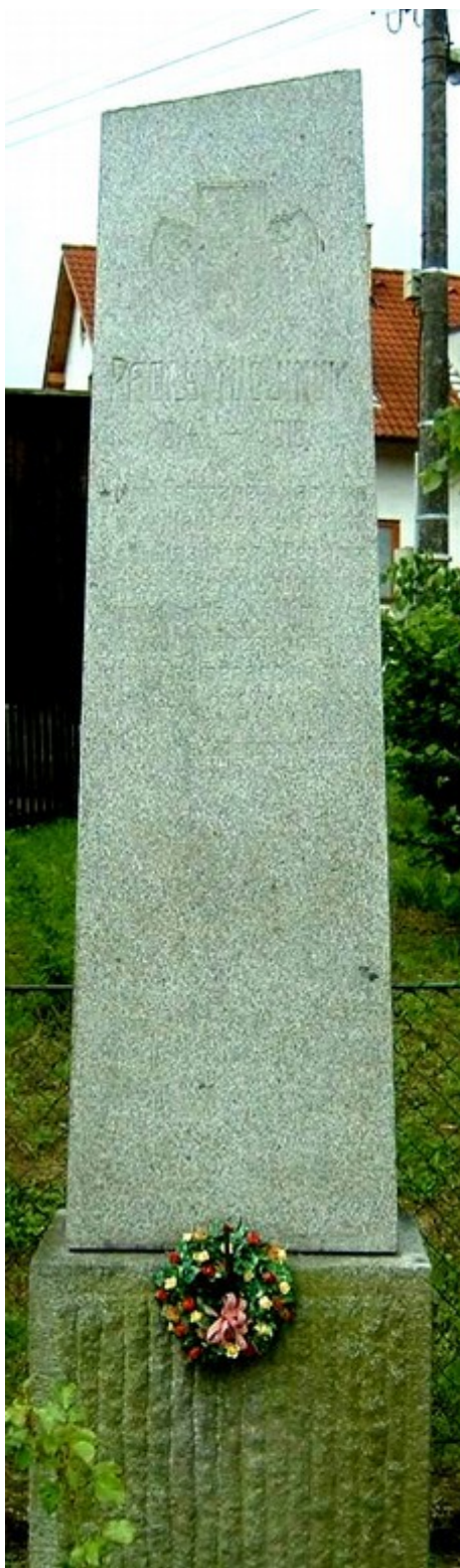
9. Malovice, pomník