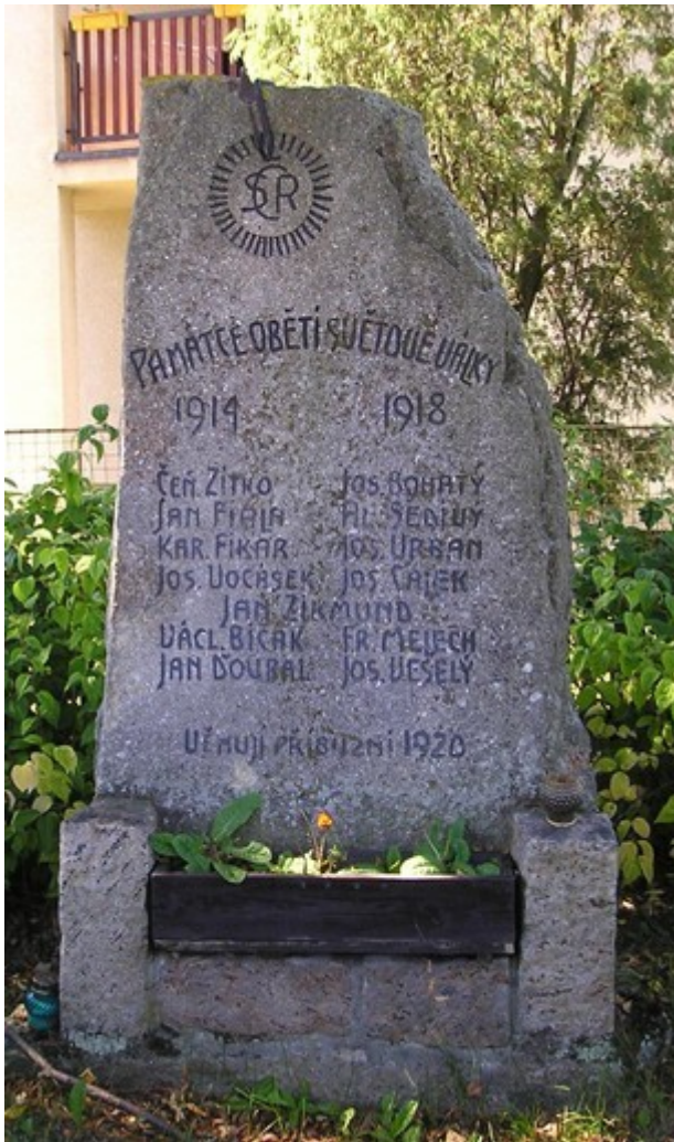
← 93. Šebestěnice, pomník padlých