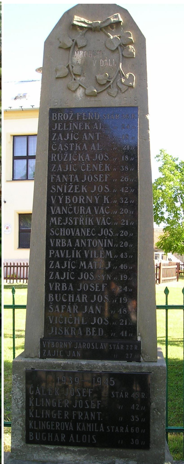
71. Kluky, pomník padlých