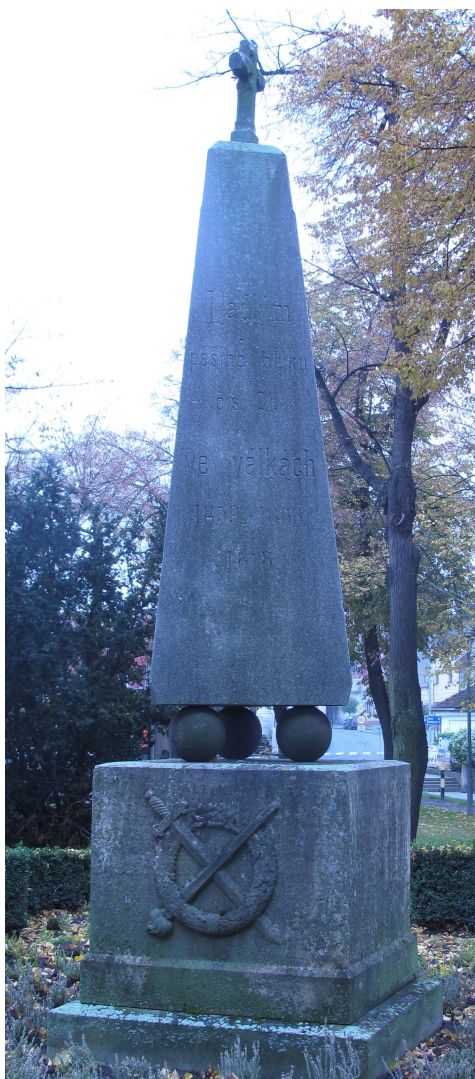
← 90. Čáslav , pomník padlých, před kostelem sv. Alžběty