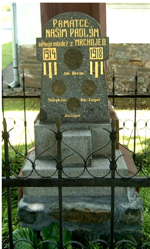
1. Mrchojedy, pomník, u čp. 7