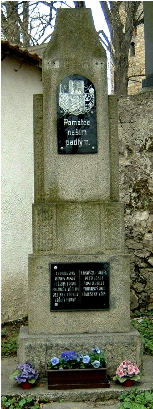
4. Úžice, pomník padlých