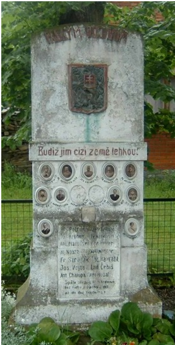
↑42. Žandov, pomník padlých