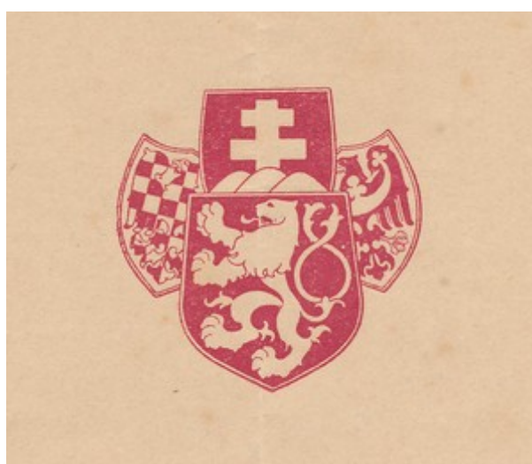
109. Znak legionářský