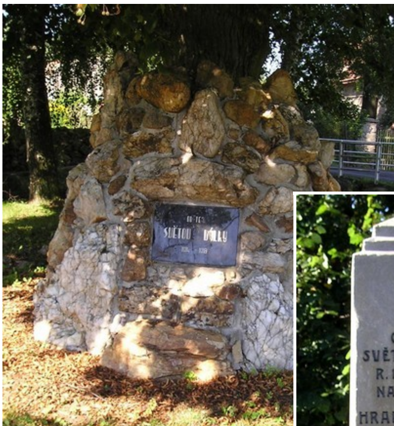
↑ 74. Olšany, pomník padlých