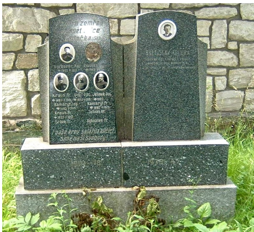
3. Leděčko, pomníky obětem 1. a 2. světové války.