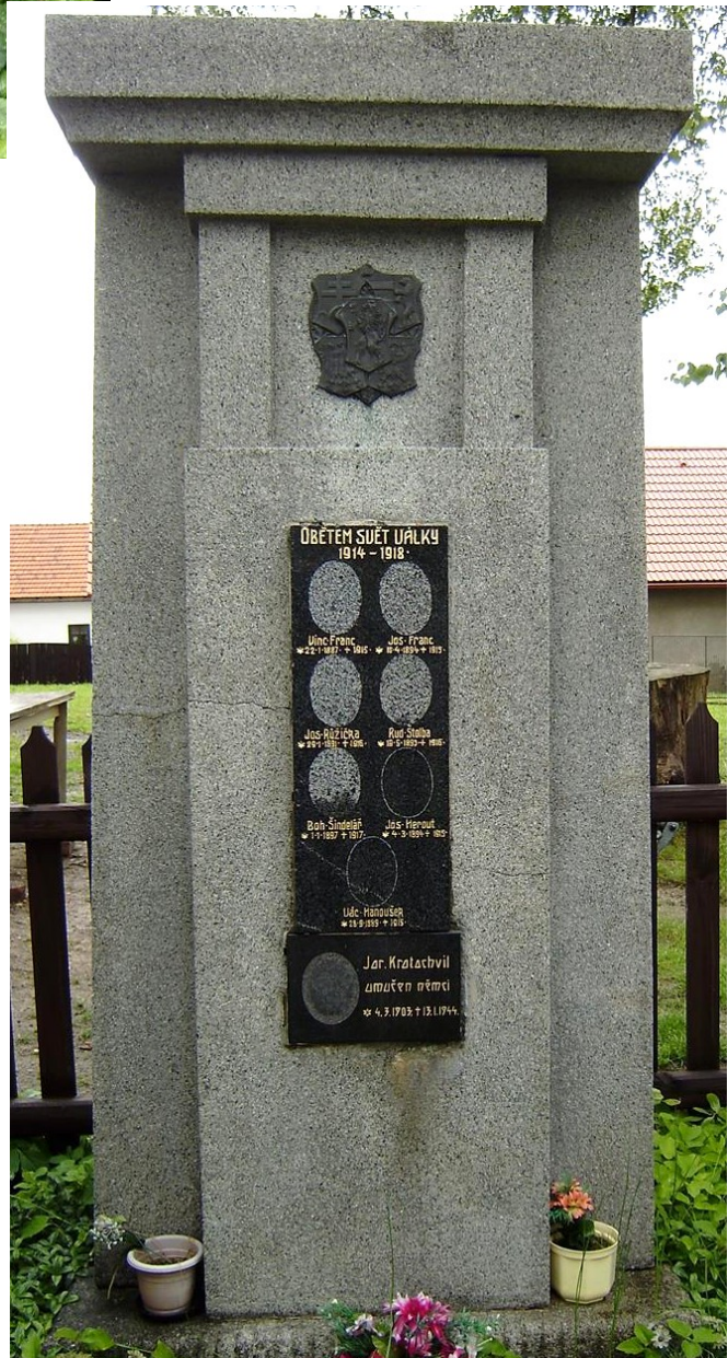
↓ 45. Vernýřov , pomník padlých