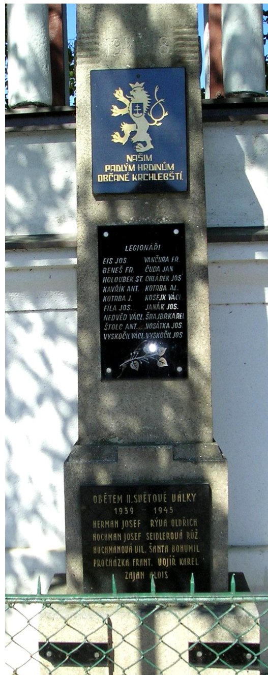
85. Krchleby, pomník padlých