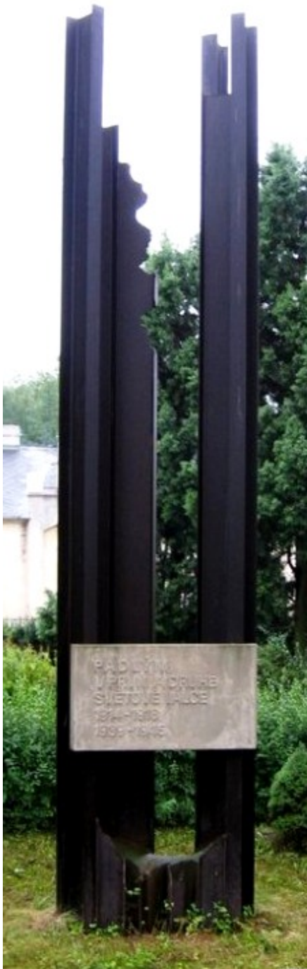
← 58. Křesetice , pomník padlých