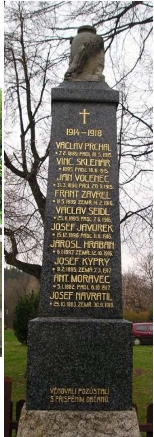
96. Adamov, pomník padlých →