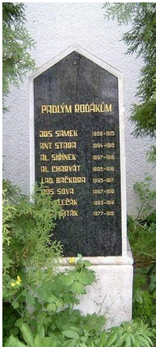
↓ 51. Bahno, pomník padlých