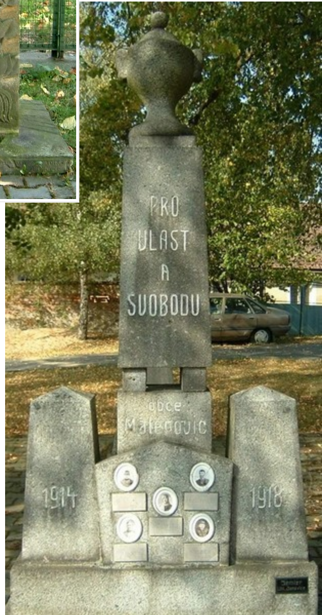
↓ 39. Malenovice, pomník padlých