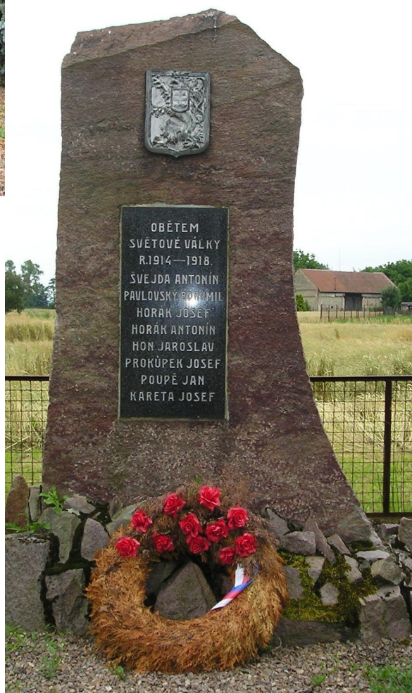
98. Bojmany , pomník padlých →