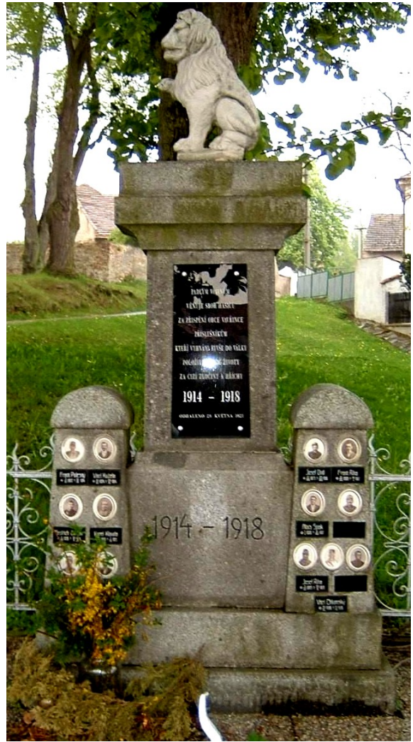
13. Vavřinec, pomník padlých