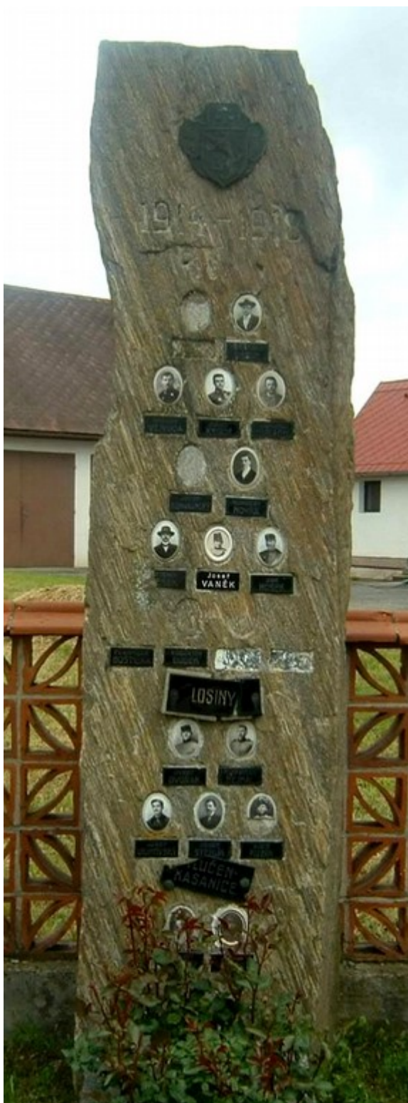
20. Petrovice II, pomník padlých