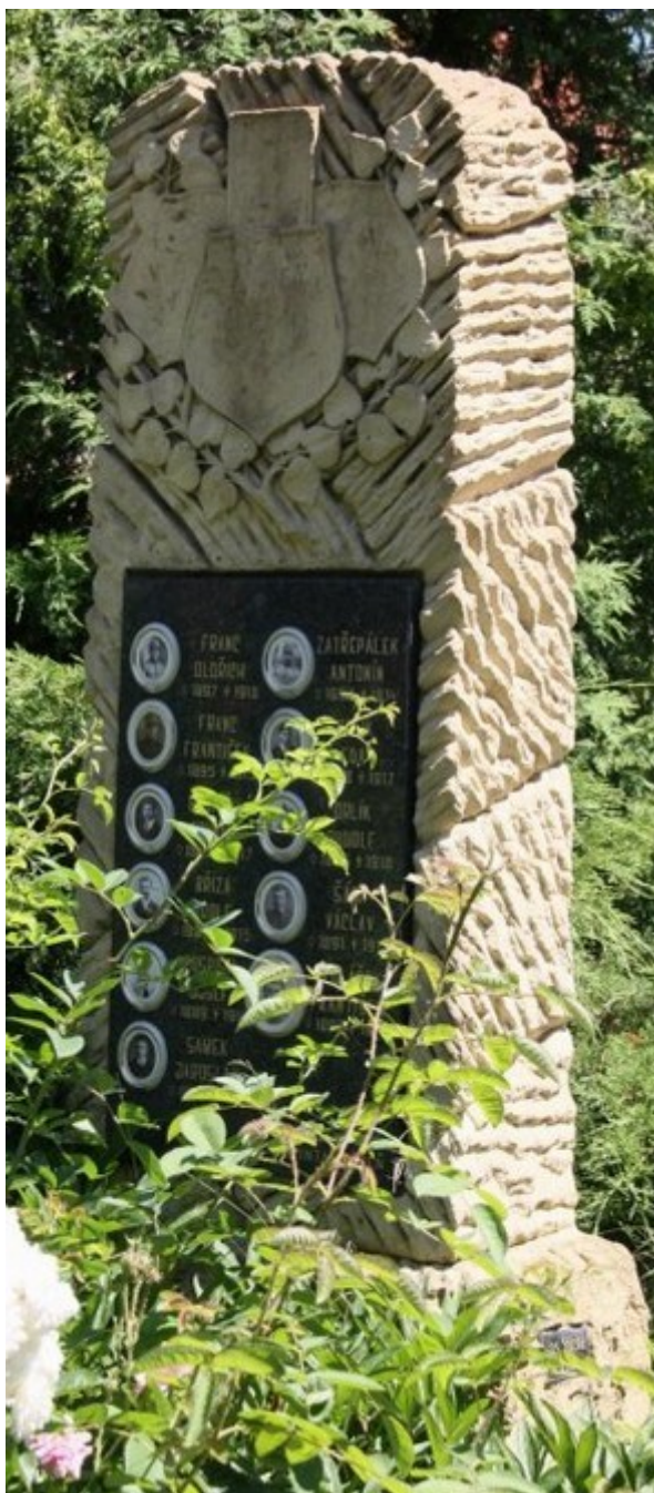
← 50. Černíny, pomník padlých