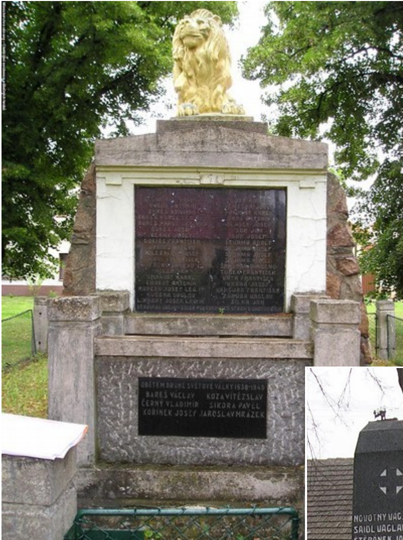
↑ 99. Chotusice, pomník padlých 100. Bratčice, pomník padlých →