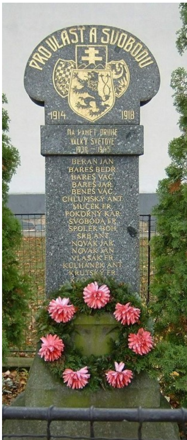
10. Podveky, pomník padlých