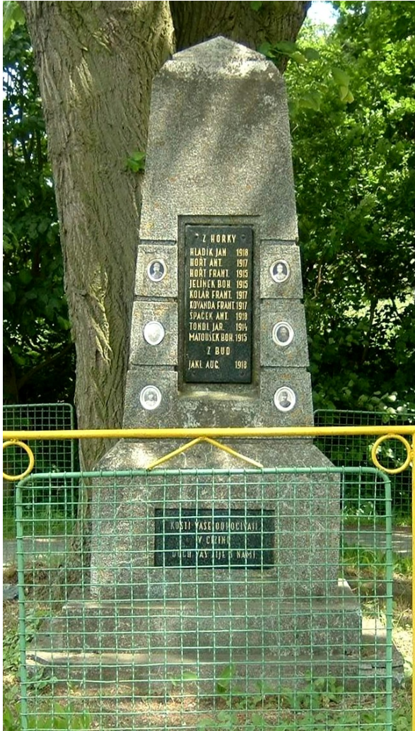
← 30. Horka II, pomník padlých