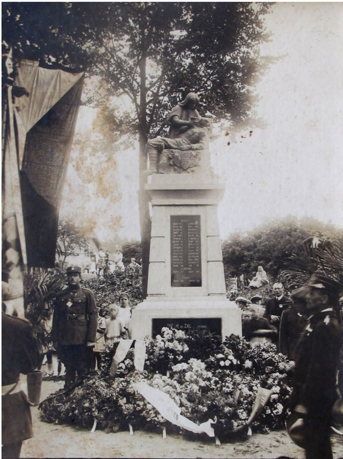
24. Zruč nad Sázavou, slavnost odhalení pomníku