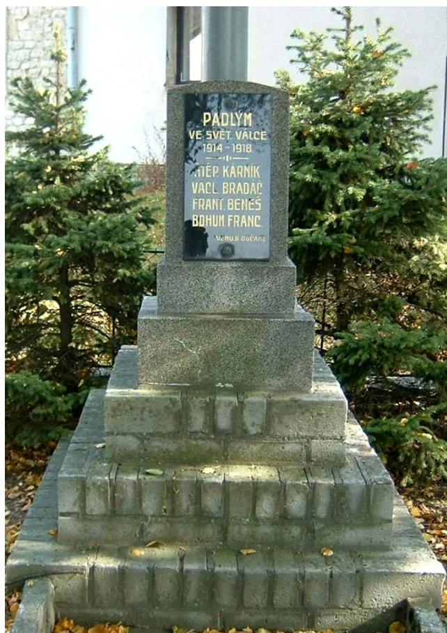
41. Vysoká, pomník padlých →