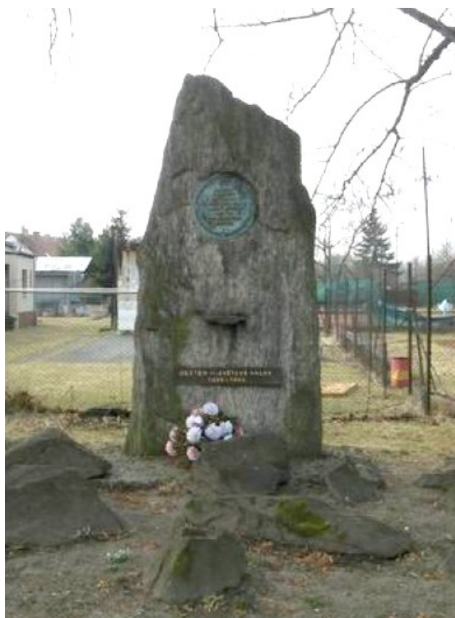
18. Uhlířské Janovice, pomník padlých, u Sokolovny