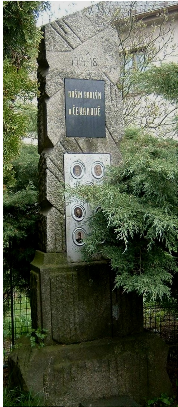
5. Čekanov, pomník padlých