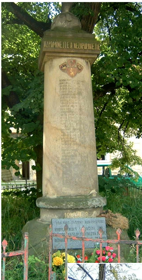
← 56. Kaňk , pomník padlých