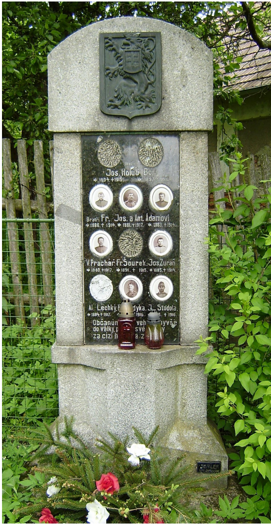
12. Zderadiny, pomník padlých