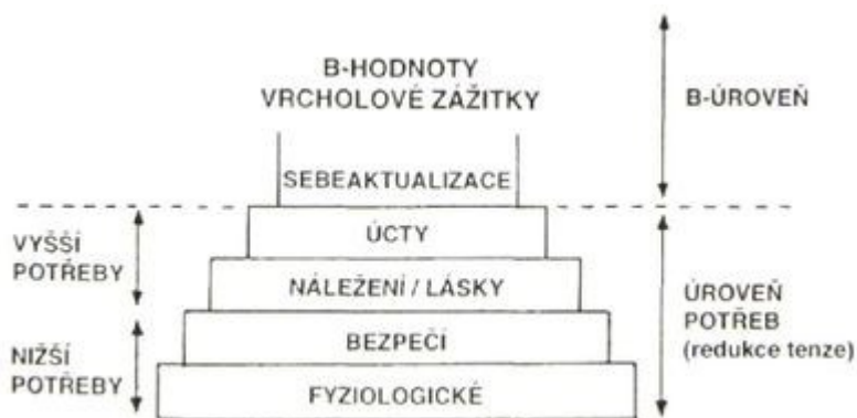
Obr. 2 Maslowova pyramida potřeb 8

Člověka považuje za tvora tvořivého a zastává názor, že nejobecnějším rysem lidské povahy je tvůrčí potenciál. V mnohém je humanistická teorie propojena s fenomenologickou koncepcí zmíněnou výše, protože opět zaměřuje podstatu svého zkoumání k individuální zkušenosti každého člověka a jeho subjektivnímu vědomému prožívání.