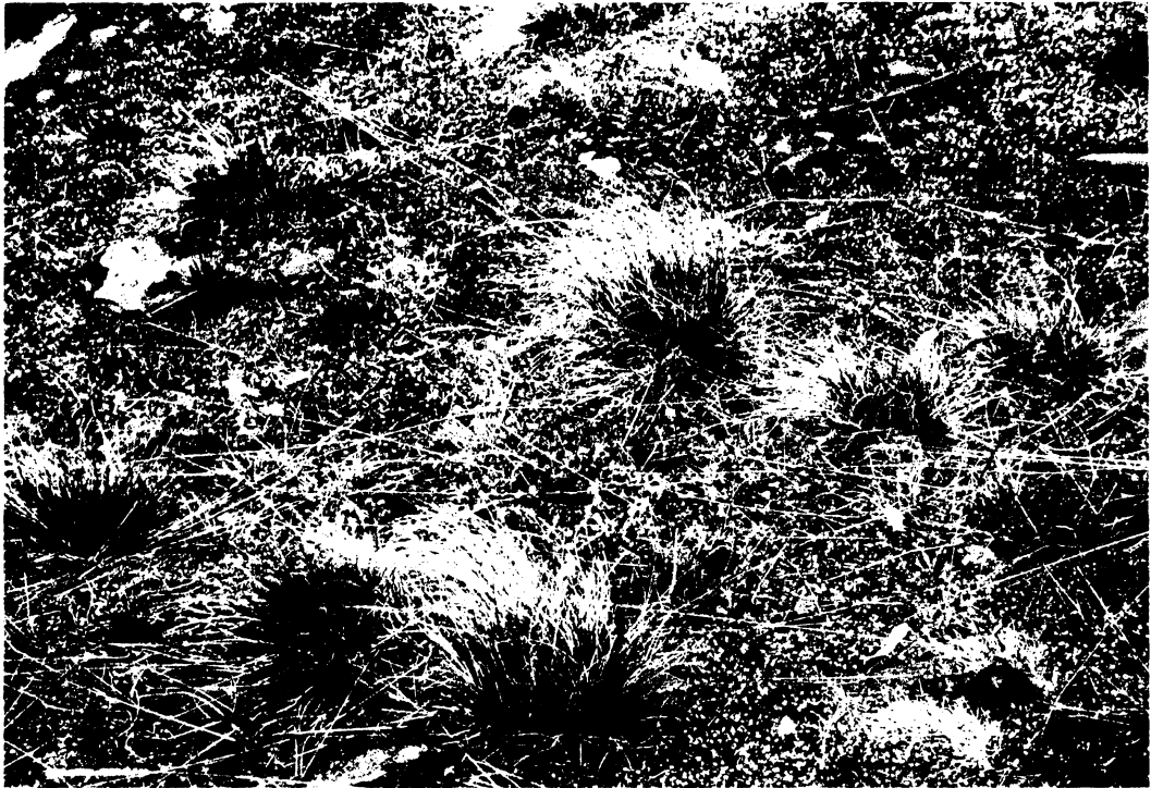
Obr. 2 Vytyčená trvalá plocha.