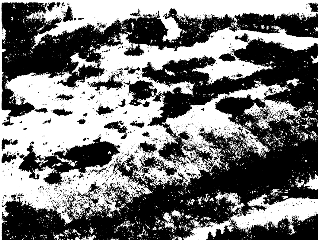
Obr. 1 Hradiště na kopci sv. Vavřince, pohled na jižní svahy s trvalými plochami