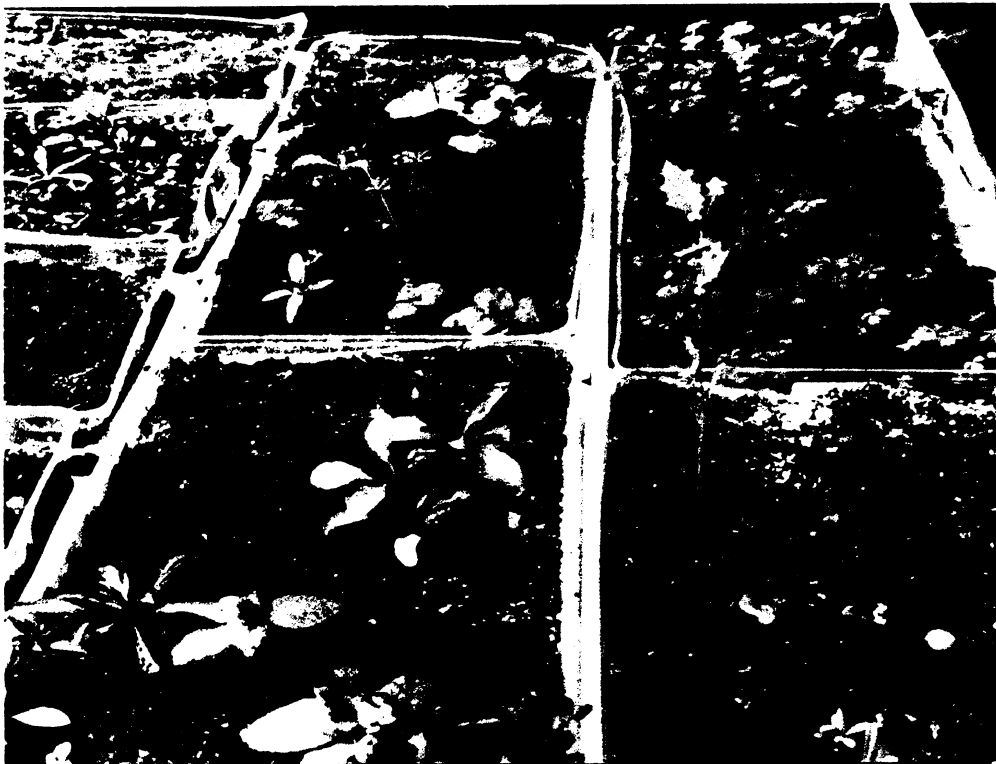
Obr. 3 Misky se vzrostlými semenáčky.