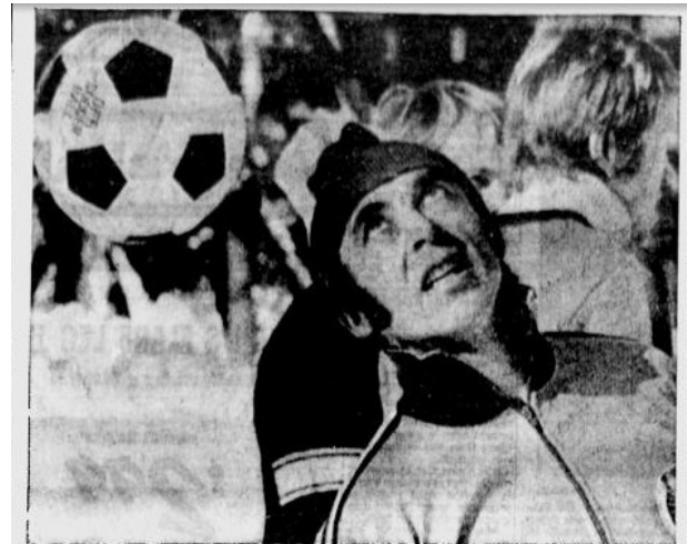
KNOCK YOUR HEAD — Instead of beating his head against a stone wall, disqualified Olympic Skier Karl Schranz knecks his head against a volleyball Tuesday in Sapporo, Japan.

28 No age limit for competitors in the Olympic Games, is stipulated by the International Olympic Committee.