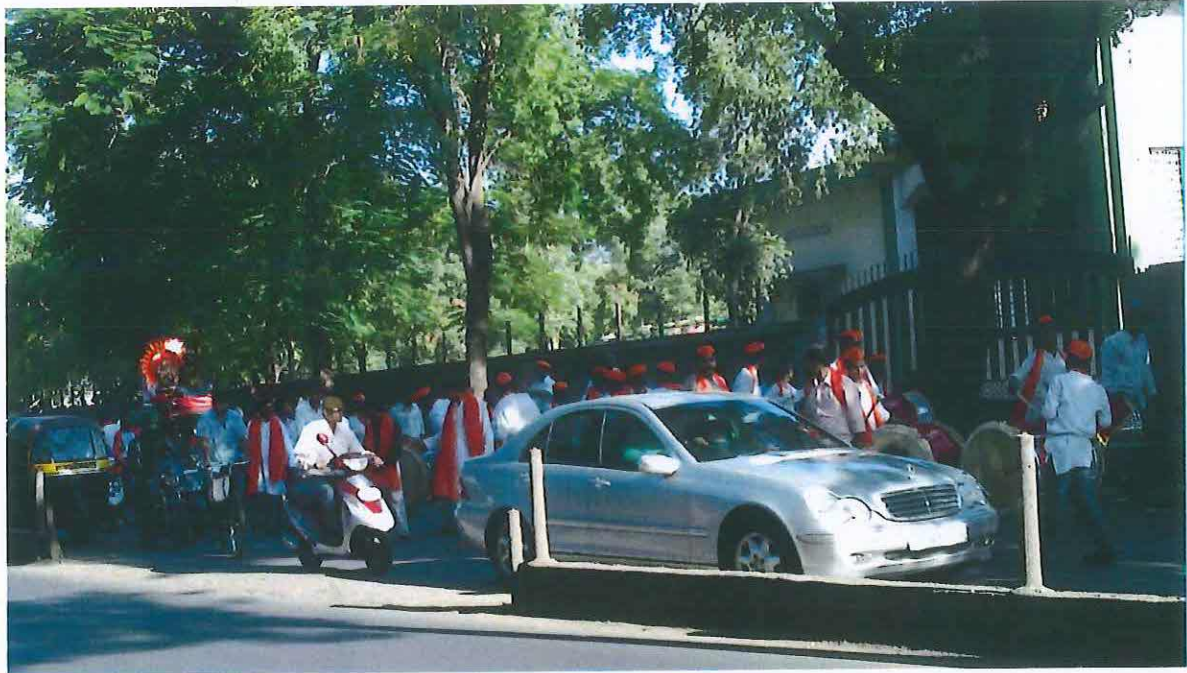
Obr. 17 : Poslední den svátku. Ganéša spolu s průvodem míří k řece. Ganěš čaturthí v Púně 2012.