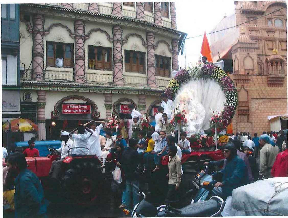
Obr. 7: Múrti Ganéši na cestě do pandálu. Ganéš čaturthí v Púně 2011.