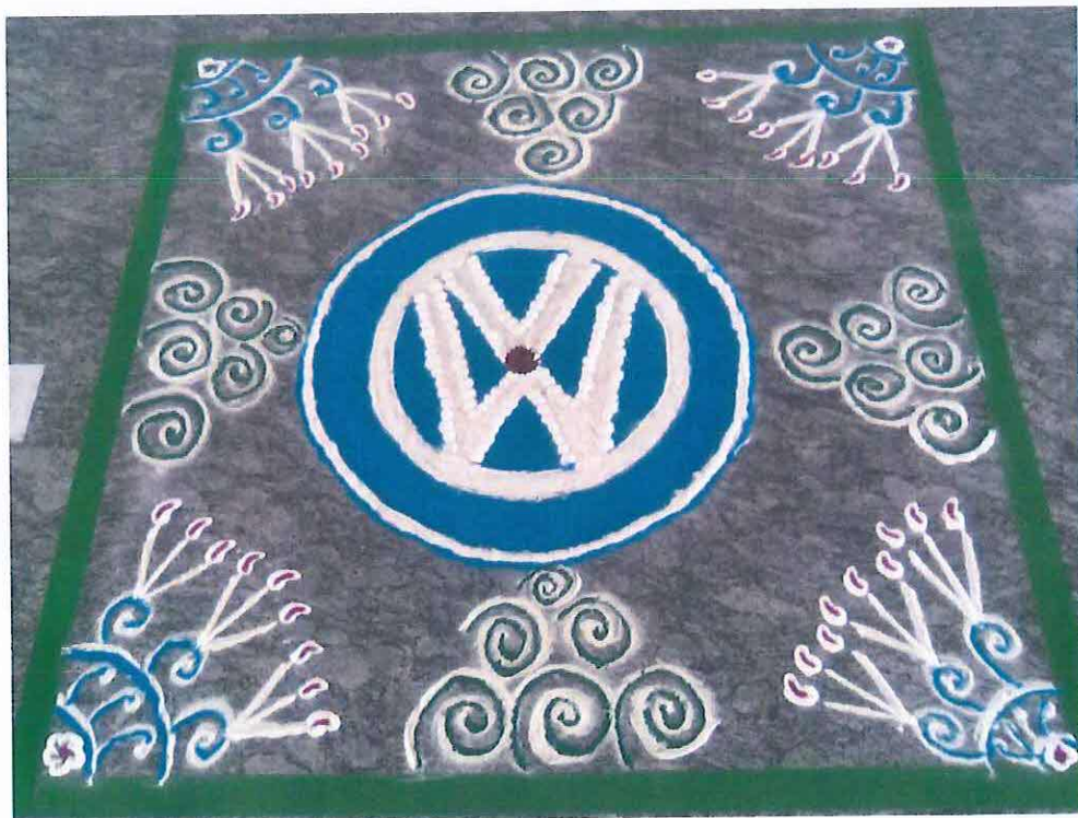
Obr. 3: Rangolí v továrně Volkswagenu v Púně.