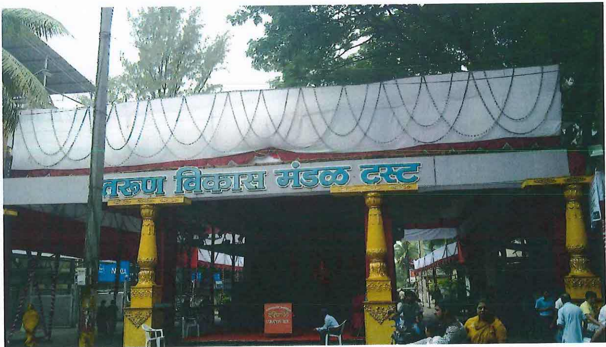
Obr. 11 : Vstup do bohatšího pandálu spravovaného trustem. Ganěš čaturthí v Púně 2012.