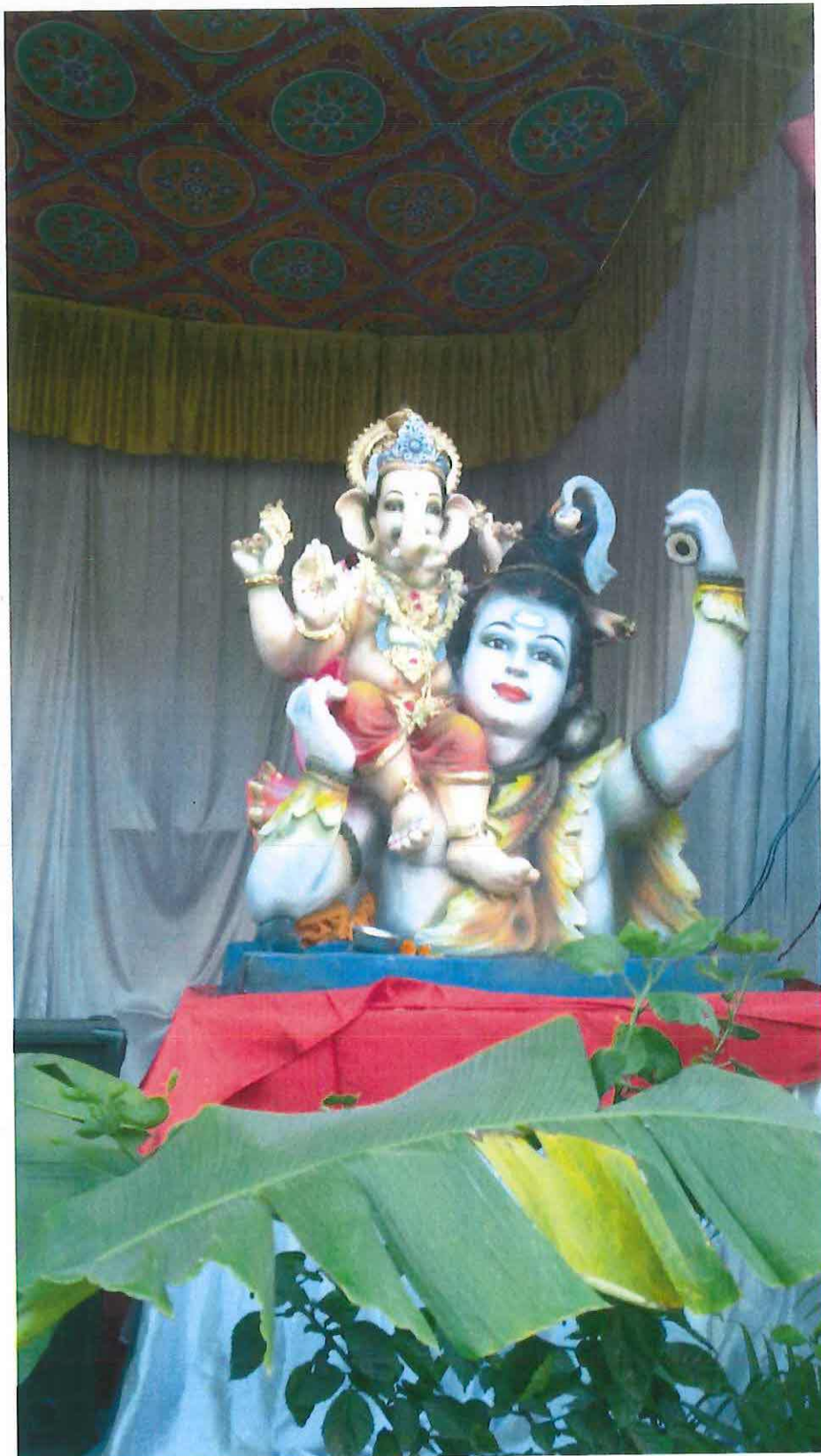
Obr. 16 : Ganéša v pandálu se Šivou. Ganěš čaturthí v Púně 2012.