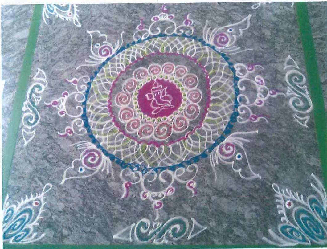
Obr. 2: Rangolí na oslavu Ganéši v továrně Volkswagenu v Púne.