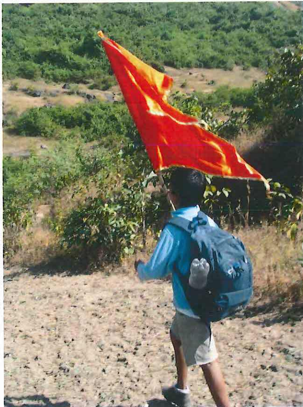
Obr. 18 : Tradice Šivádžího, který Ganéšu ctí, je v Maháráštre dodnes živá. Na obrázku poutník na jednu z Šivádžího pevností v okolí Púny.