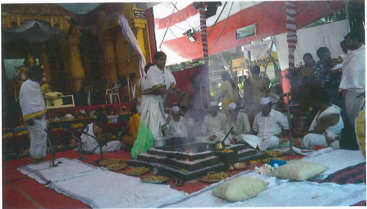
Obr. 8: Rozdělávání ohně před púdžou. Ganěš čaturthí v Púně 2012.