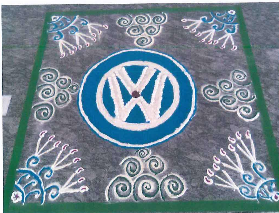
Obr. 3: Rangolí v továrně Volkswagenu v Púně.