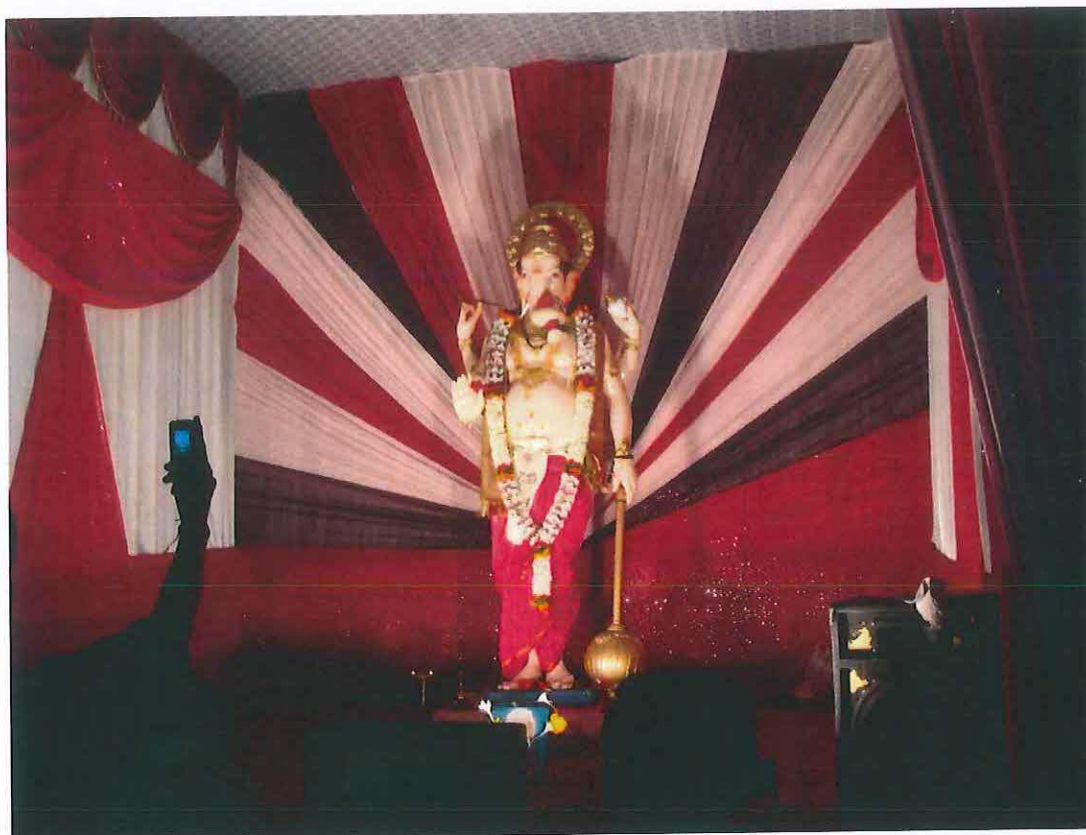
Obr. 14 : Ganéša jako hrdina. Ganéš čaturthí v Púně 2009.