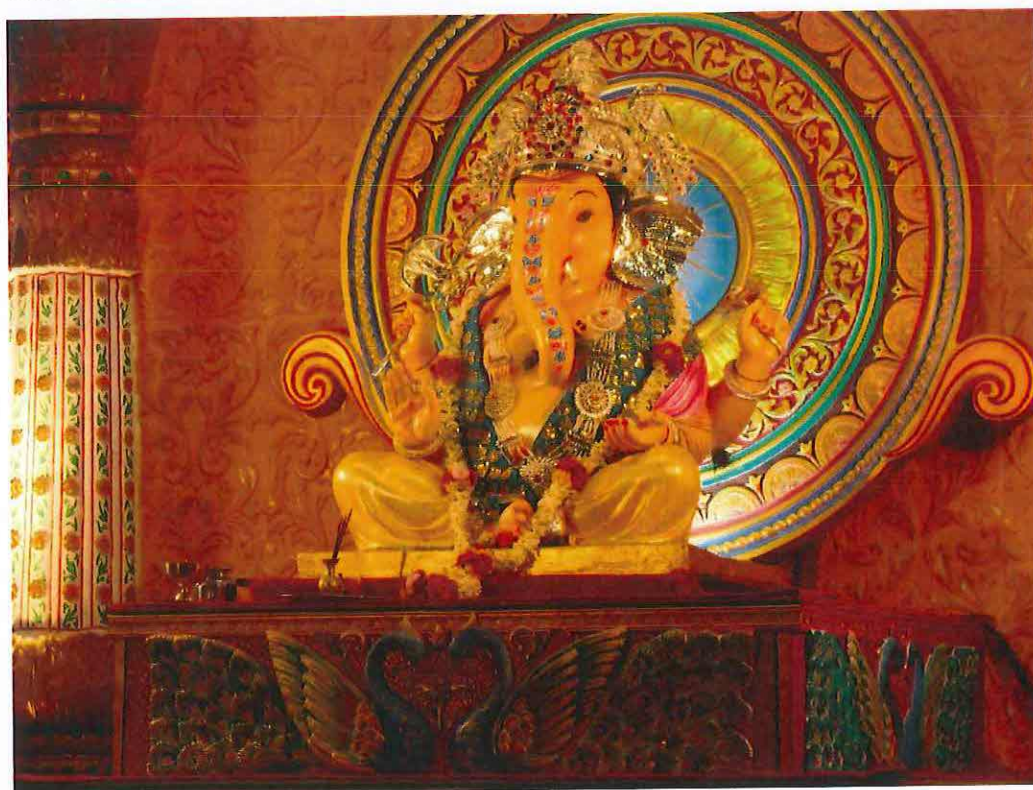
Obr. 13 : Ganěš čaturthí v Púně 2009.