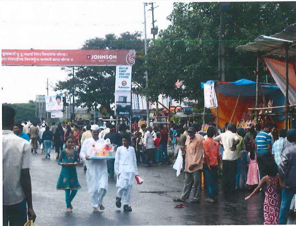
Obr. 5: Zakoupení sošky Ganěši před začátkem svátku Ganěš čaturthí v Púně 2011.