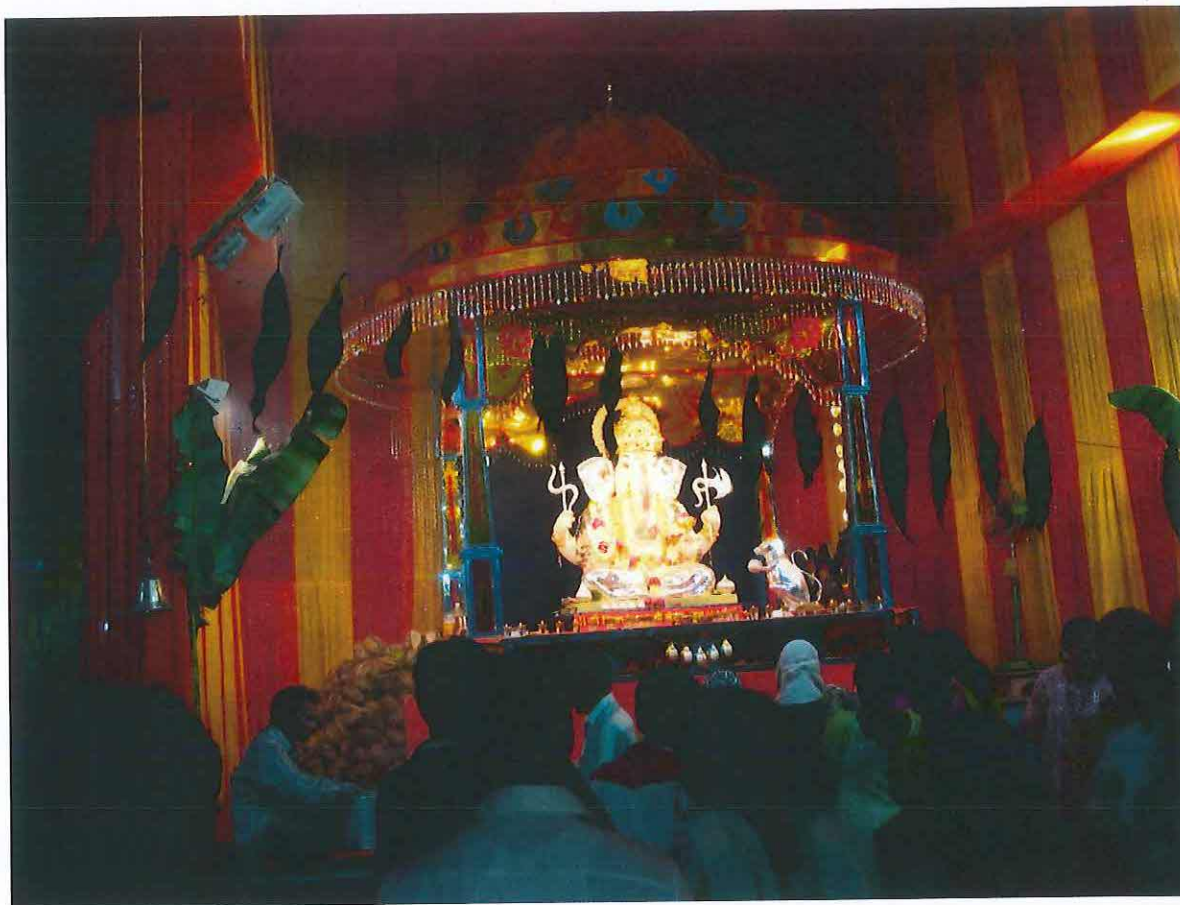
Obr. 12 : Ganěš čaturthí v Púně 2009.