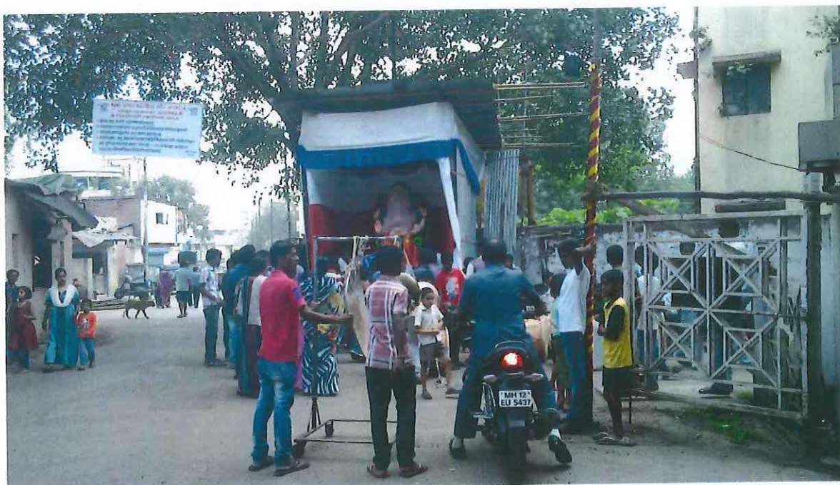
Obr. 6: Múrti Ganéši usazená do pandálu čekající na „oživení“. Ganéš čaturthí v Púně 2012.