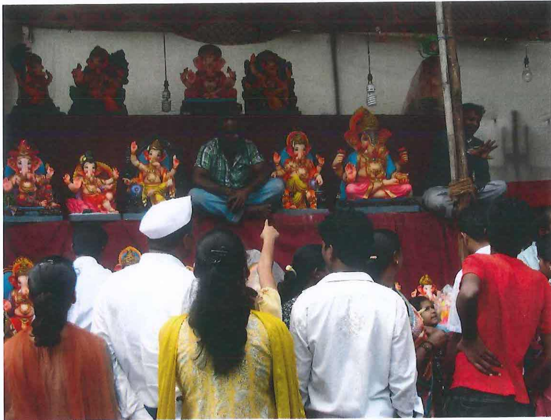
Obr. 4: Prodej sošek Ganěši před začátkem svátku Ganěš čaturthí v Púně 2011.