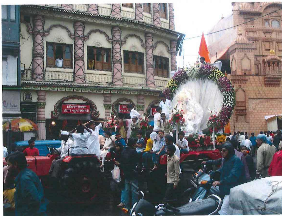
Obr. 7: Múrti Ganéši na cestě do pandálu. Ganéš čaturthí v Púně 2011.