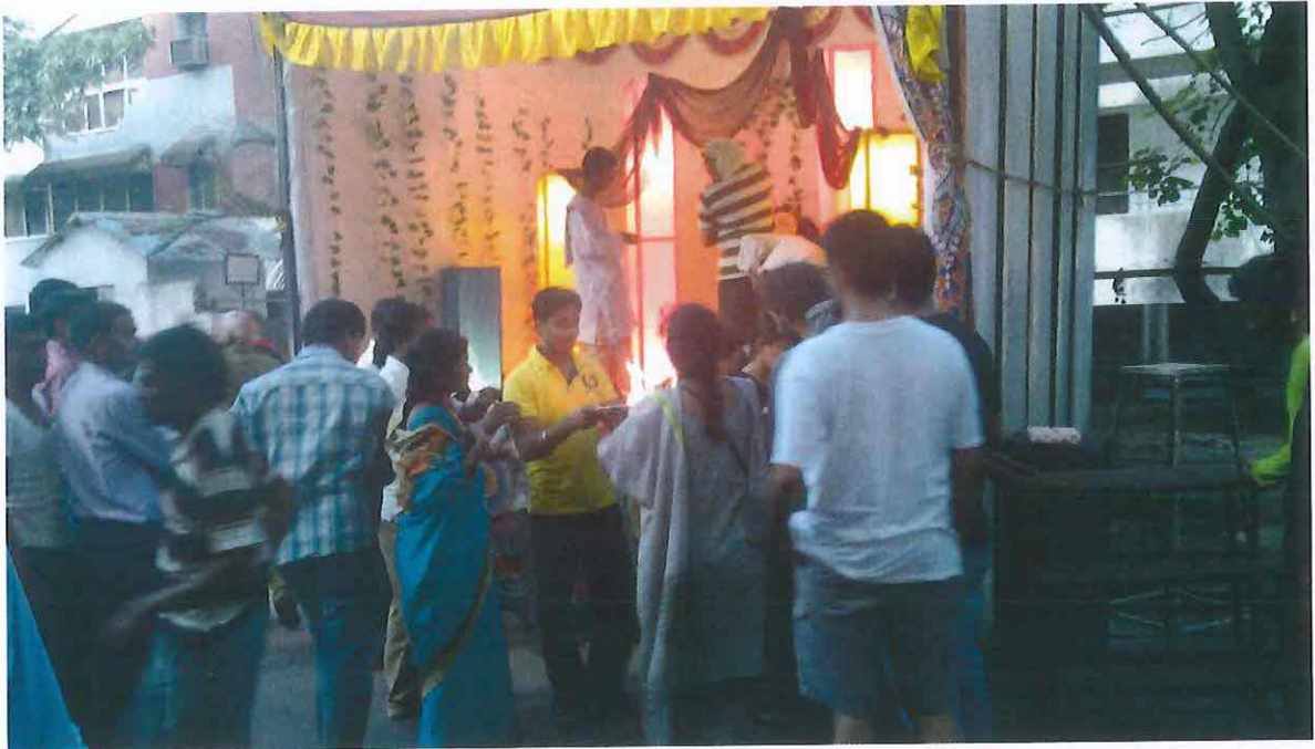
Obr. 10 : Árti s rozdáváním darů. Ganěš čaturthí v Púně 2012.