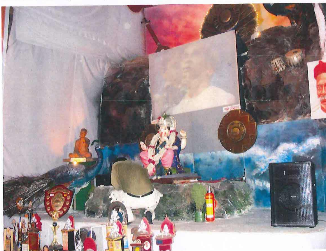
Obr. 15 : Pandál vyzdobený suvenýry. Vpravo podobizna Tilaka. Ganéš čaturthí v Púně 2009.