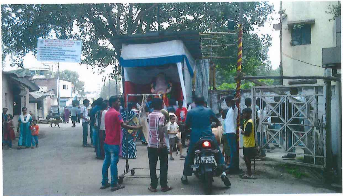
Obr. 6: Múrti Ganéši usazená do pandálu čekající na „oživení“. Ganéš čaturthí v Púně 2012.