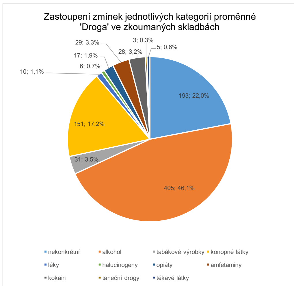
Graf 3 - Zastoupení zmínek jednotlivých kategorií proměnné 'Droga' ve zkoumaných skladbách

Nejčastěji byl zmiňován alkohol, a to ve 46,1 %, tedy celkem 405krát ve 195 skladbách. Jednalo se o obecná označení i konkrétní druhy alkoholu, tato kategorie bude podrobněji popsána později. U 22 % (193krát ve 133 skladbách) všech zmínek se jednalo o obecná označení návykových látek, které nebylo možné zařadit do specifitějších kategorií, jako např. termíny 'droga' či 'fet'. Cigarety a další tabákové výrobky byly ve 25 skladbách 31krát, ve 3,5 % ze všech zmínek. Jednalo se o cigarety či doutníky, samotnou látku nikotin či v jednom případě o elektronickou cigaretu. Konopné látky se vyskytovaly ve 106 skladbách 151krát, z celkového počtu zmínek tedy 17,2 %. Ačkoliv se kategorie zaměřuje na všechny konopné látky, u naprosté většiny zmínek se jednalo o marihuanu, pouze jedenkrát byl zmíněn hašiš. Zmínky spadající do kategorie léky se v 9 skladbách objevily 10krát (1,1 %). V 6 případech se jednalo o konkrétní názvy. Těmi byly Neurolog, Prozac, Hypnogen, Aspirin, Antabus a Promethazin. Halucinogeny byly zmíněny v 6 skladbách, vždy jednou, celkově zaujímaly 0,6 % všech zmínek. Ve 4 případech se jednalo o LSD, jednou o lysohlávky. Kategorie opiáty se objevila v 16 skladbách 17krát. Většina zmínek byla o heroinu (12), tři pak o opiu a dva o substituční látce Metadon. V kategorii amfetaminů, zmíněné ve 27 skladbách 29krát (3,3 %), byl nejčastějším