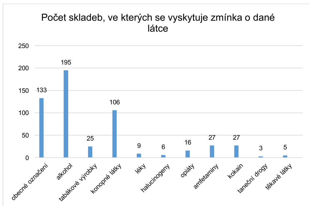
Graf 2 - Počet skladeb, ve kterých se vyskytuje daná látka

Ve 334 skladbách se zmínky o návykových látkách či jejich užívání nacházely a v každé z těchto skladeb se mohla objevit více než jedna zmínka stejných i rozdílných látek. Nejnižší počet zmínek návykových látek či jejich užívání ve skladbě byl 1, nejvyšší 14. Celkem bylo zaznamenáno 886 zmínek témat návykových látek. V průměru se tedy v těchto skladbách vyskytovaly zmínky 2,65krát. Při přepočtu na všech 590 zkoumaných skladeb by návykové látky v každé z nich byly zmiňovány v průměru 1,5krát.