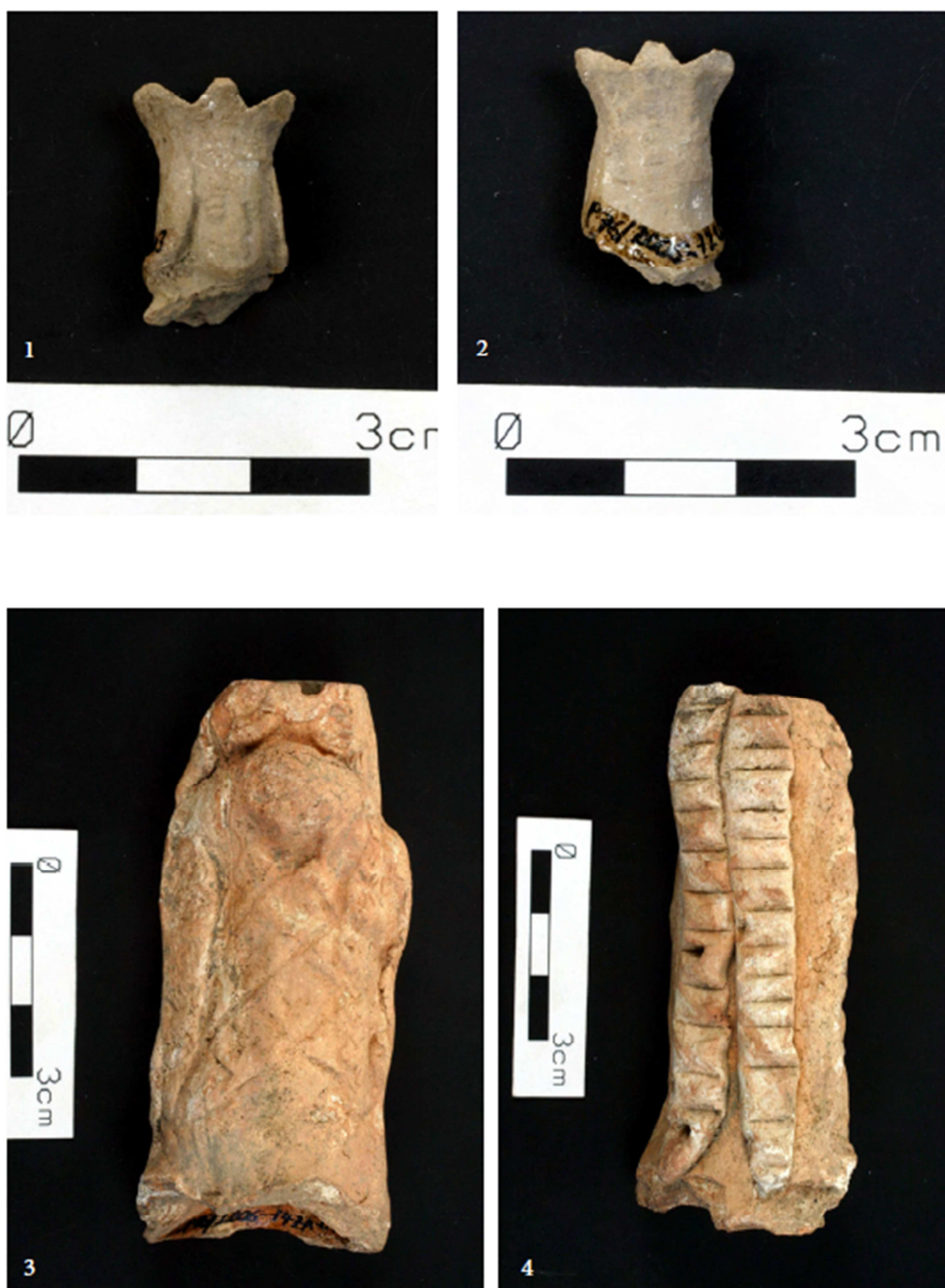
Tabulka 36. Hlava ženy s korunou – 1, 2. Praha 1 – Nové Město, Truhlářská ulice 16; žena v šatech – 3, 4. Praha 1 – Nové Město, Truhlářská ulice 16. (Převzato z: Juřinová 2015, 146; tab. 25).