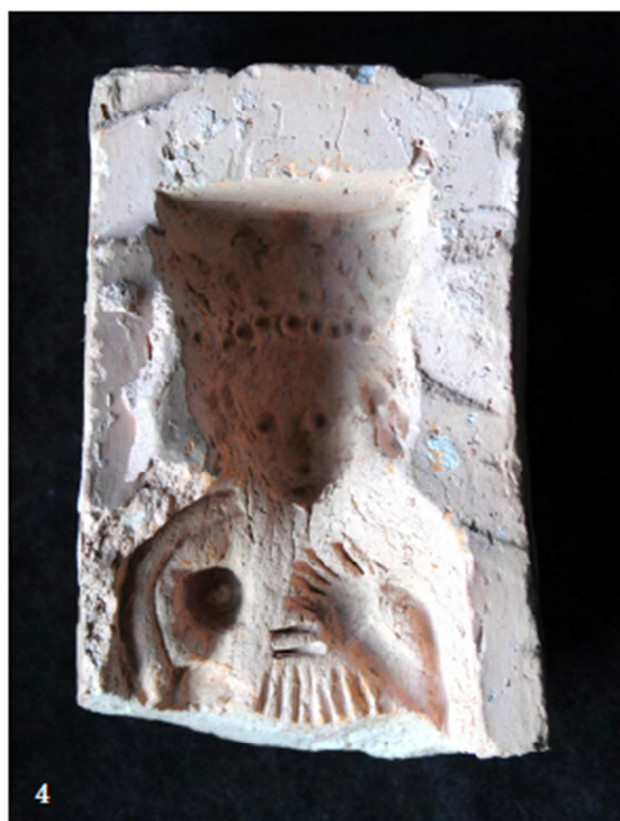
Tabulka 28. Nálezy z výzkumu na Praze 1 – Nové Město, náměstí Republiky. Plastika Madony s dítětem bez hlavy – 1; hlava Madony – 2; výrobní forma – 4. (Převzato z: Juřinová 2015, 133, tab. 12).