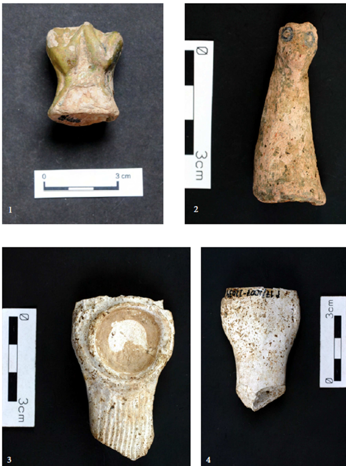
Tabulka 35. Torzo postavy se sepjatýma rukama – 1. Praha 1 – Staré Město, Dům u Sixtů, Celetná ulice; blíže nespecifikovatelná figurka – 2. Praha 1 – Nové Město, Klimentská; panenka kruseler – 3, 4. Praha 1 – Nové Město, Petrské náměstí. (Převzato z: Juřinová 2015, 144; tab. 23).