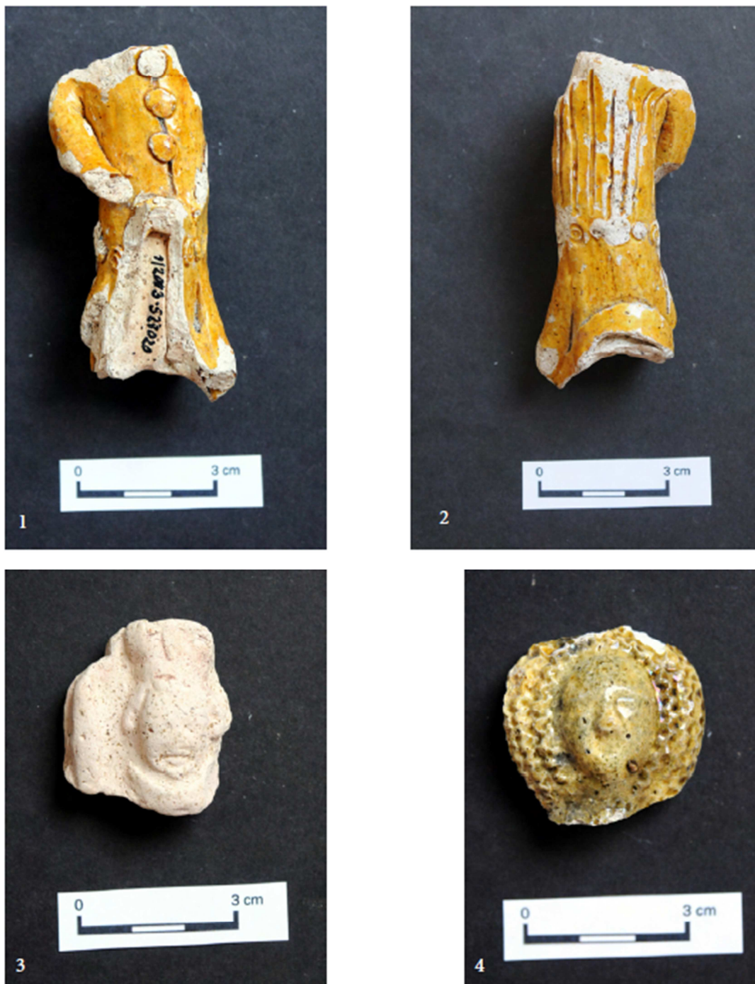
Tabulka 27. Nálezy z výzkumu na Praze 1 – Nové Město, náměstí Republiky. Žlutě glazovaná figurka postavy s knoflíky – 1, 2; hlava madony (?) – 3; glazovaná hlava panenky kruseler – 4. (Převzato z: Juřinová 2015, 132, tab. 11).