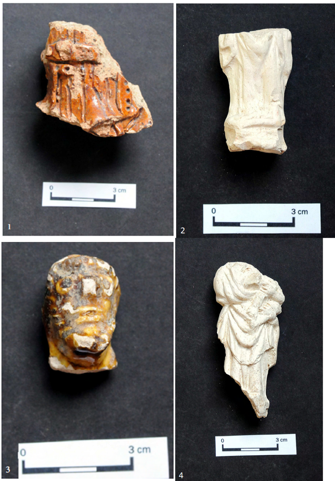
Tabulka 32. Torzo plastiky – 1. Praha 1 – Nové Město, Petrská ulice/ XVIII; spodní část postavy – 2. Praha 1 – Nové Město, Na Poříčí 1076; glazovaná hlava muže – 3. Praha 1 – Nové Město, Na Poříčí 1076; plastika Madony – 4. Praha 1 – Nové Město, Na Poříčí 1076. (Převzato z: Juřinová 2015, 139, 140; tab. 18, 19).