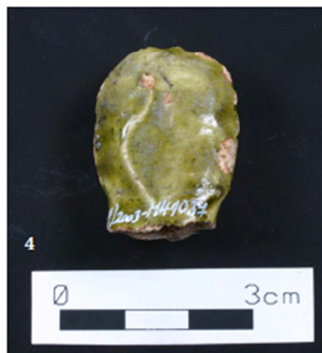
Tabulka 24. Nálezy z výzkumu na Praze 1 – Nové Město, náměstí Republiky. Hlava muže s baretem (?) – 1, 2; zeleně glazovaná hlava mnicha (?) – 3, 4. (Převzato z: Juřinová 2015, 129, tab. 8).