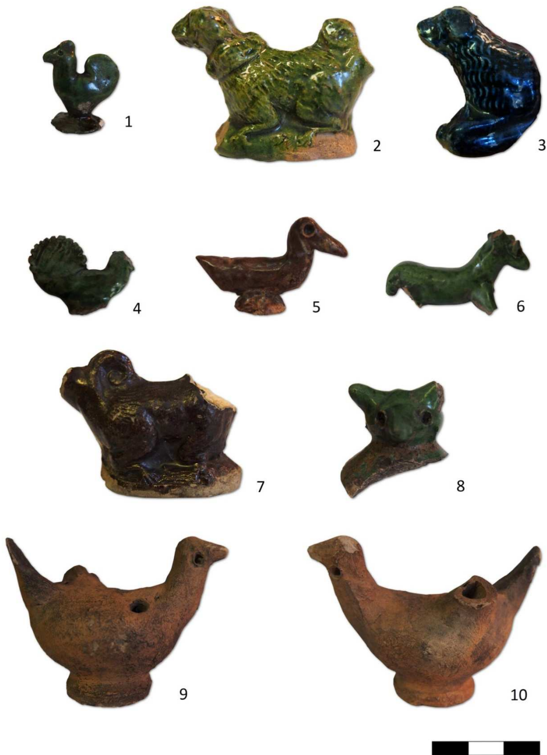
Tabulka 5. Glazovaný kohout – 1. Místo nálezů neznámé; glazovaný pes s obojkem – 2. Místo nálezů neznámé; glazovaný pes – 3. Místo nálezů neznámé; zlomek pravděpodobně kohouta – 4. Místo nálezů neznámé; glazurovaná kachna – 5. Místo nálezů neznámé; glazovaný jelen – 6. Místo nálezů neznámé; zvíře s ulomenou hlavou – 7. Místo nálezů neznámé; zlomek plastiky – 8. Místo nálezů neznámé; píšťalka ve tvaru ptáka – 9, 10. Praha 1 – Nové Město, Ostrovní ulice čp. 125/II.