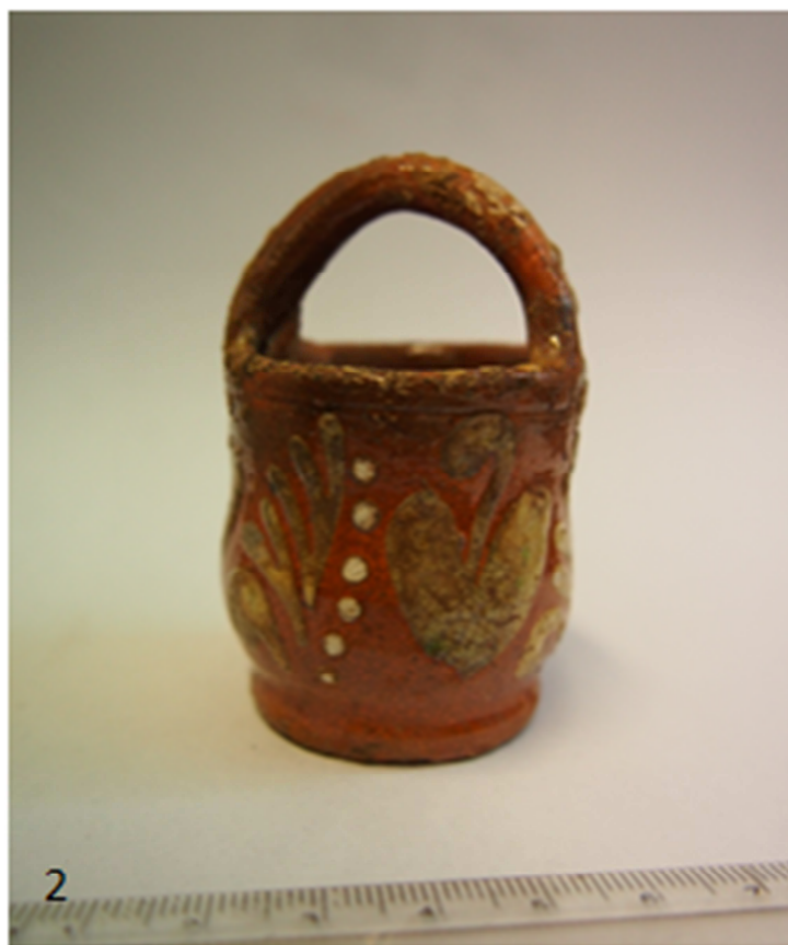
Tabulka 42. Plastika pravděpodobně světce - 1. Praha 1 – Nové Město, Mikulandská čp. 135.; Miniatura s držadlem – 2. Praha 1 – Malá Strana, Thunovská ulice čp. 192. (Převzato: Cymbalak – Hladíková-Trachtová 2016, 42, obr. 21).