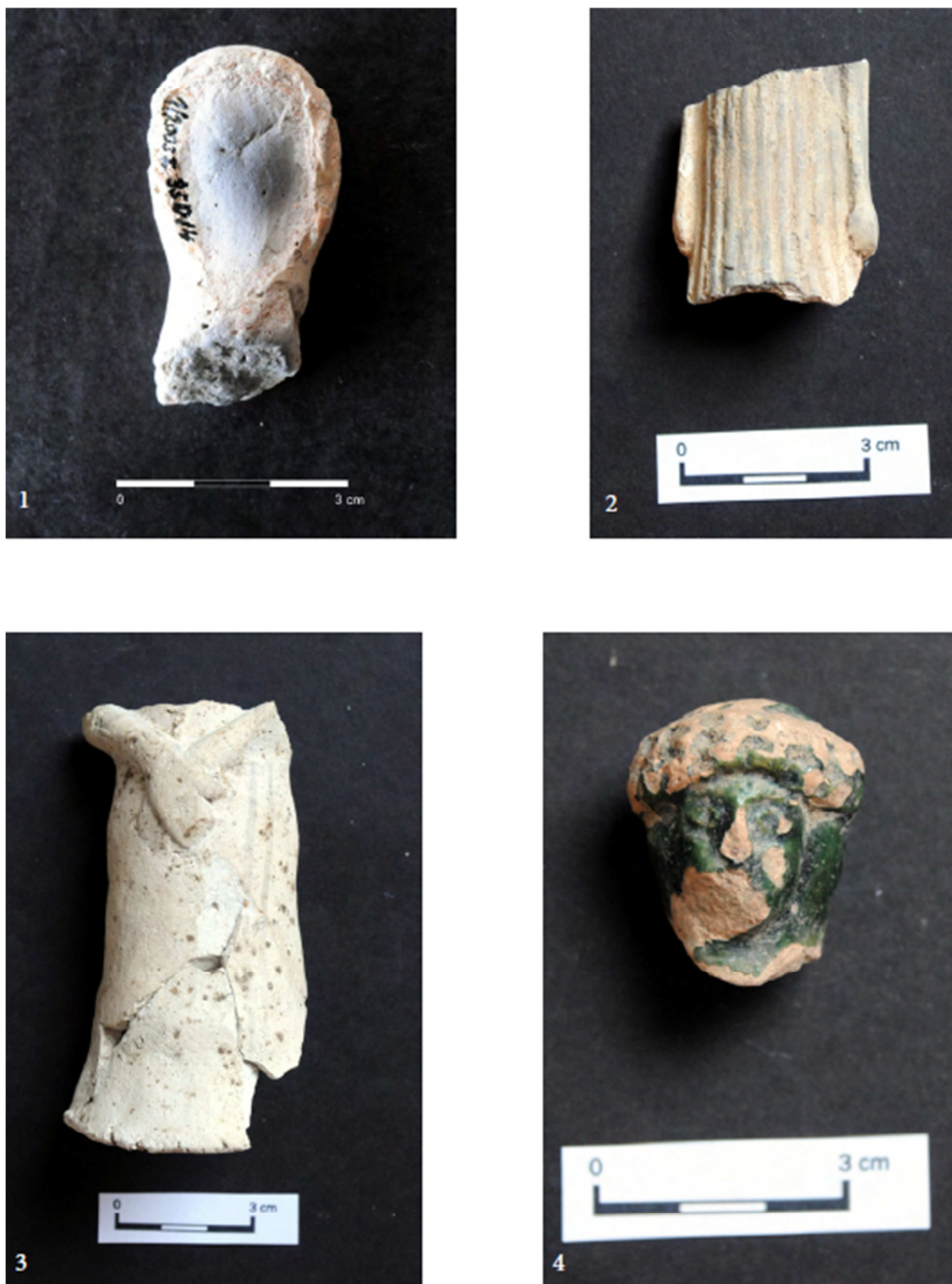
Tabulka 29. Nález z výzkumu na Praze 1 – Nové Město, náměstí Republiky. Hlava s odlomeným obličejem – 1; torzo těla plastiky – 2; ženská postava – 3; zeleně glazovaná hlava s čelenkou (?) – 4. (Převzato z: Juřinová 2015, 134, tab. 13).