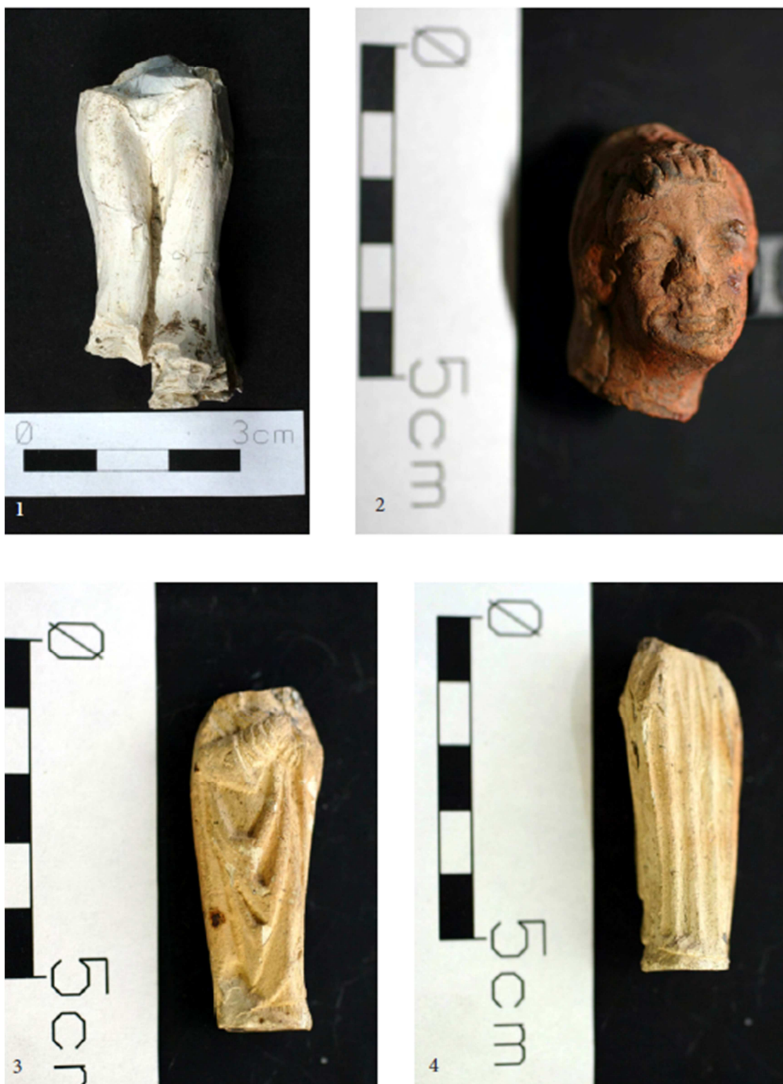
Tabulka 23. Nálezy z výzkumu na Praze 1 – Nové Město, náměstí Republiky. Spodní část mužské postavy – 1; hlava s detailně propracovaným obličejem – 2; postava světce (?) – 3, 4. (Převzato z: Juřinová 2015, 128, tab. 7).