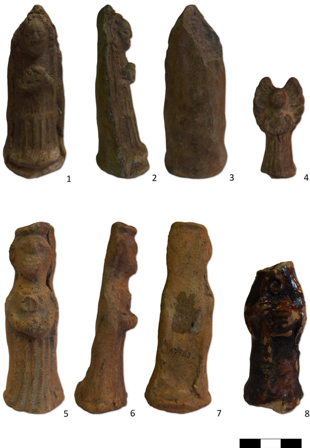
Tabulka 7. Postava ženy – 1, 2, 3. Místo nálezu neznámé; postava anděla – 4. Místo nálezu neznámé; postava ženy – 5, 6, 7. Místo nálezu neznámé; glazovaná postava světce s berlou – 8. Praha 1 – Staré Město, Staroměstské náměstí.