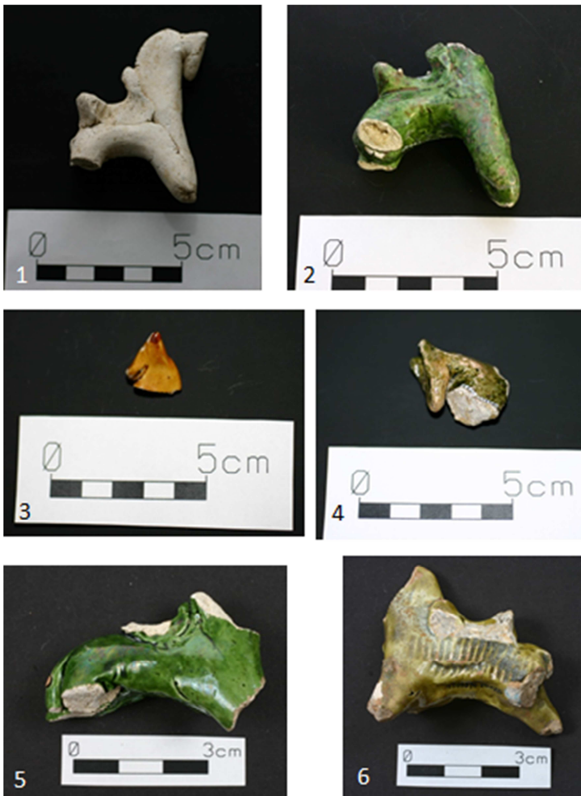
Tabulka 39. Nálezy z Prahy 1 – Nové Město, náměstí Republiky. Kaolinový koníček se sedlem – 1; torzo zeleně glazovaného koníčka se sedlem – 2; fragment hlavy žlutě glazovaného koníčka – 3; fragment hlavy zeleně glazovaného koníčka – 4; torzo zeleně glazovaného koníčka s naznačeným sedlem – 5; žlutozeleně glazovaný koníček zdobený pod sedlem radélkem – 6.