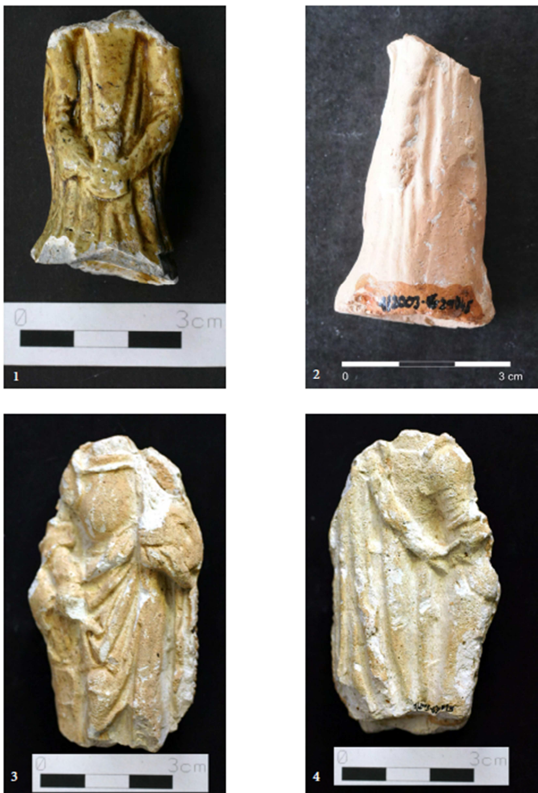
Tabulka 20. Nálezy z výzkumu na Praze 1 – Nové Město, náměstí Republiky. Plastika sv. Barbory – 1; postava s copem – 2; postava muže – 3, 4. (Převzato z: Juřinová 2015, 123, tab. 2).