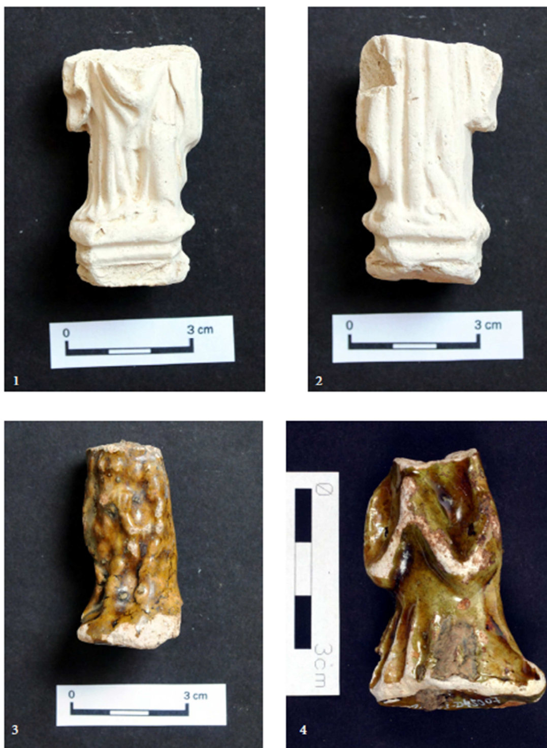
Tabulka 19. Nález z výzkumu na Praze 1 – Nové Město, náměstí Republiky. Spodní část postavy (Madona) – 1, 2; spodní polovina postavy – 3; modlící postava – 4. (Převzato z: Juřinová 2015, 122, tab. 1.).