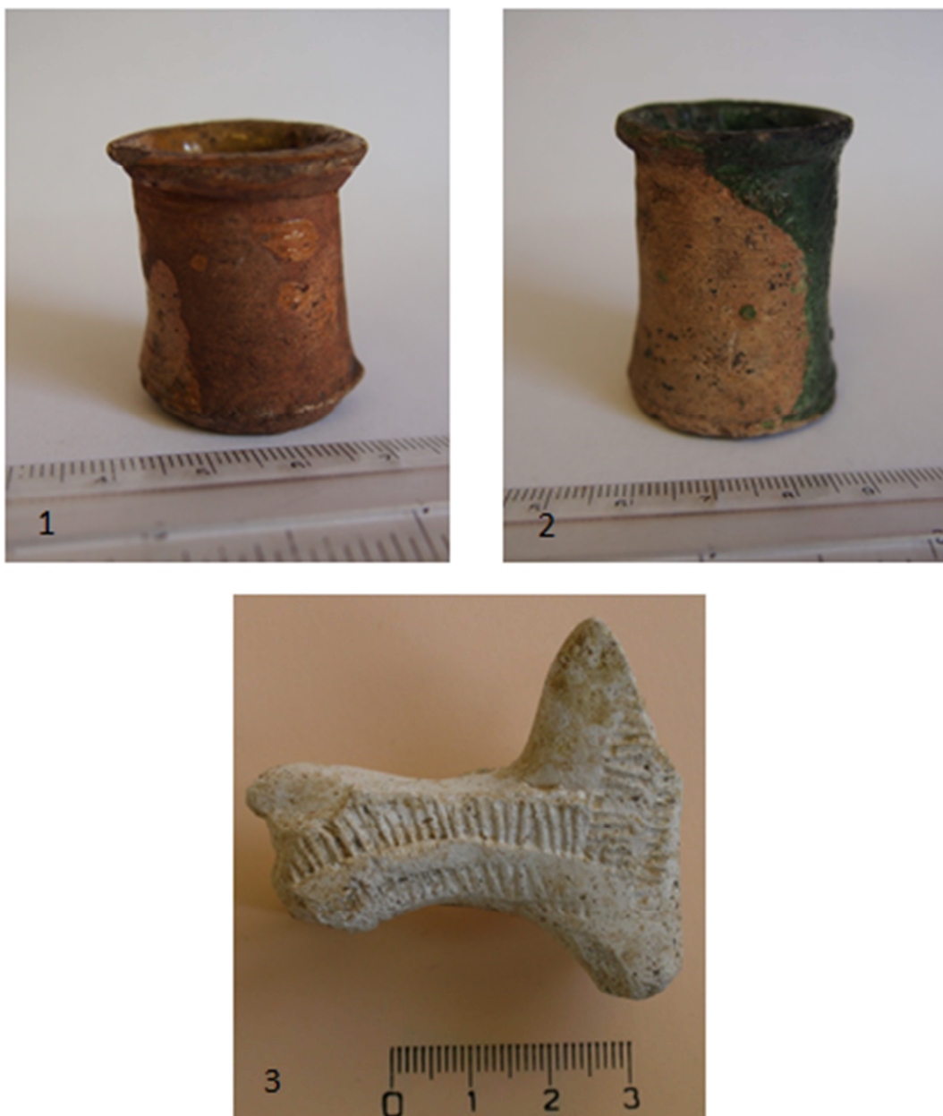
Tabulka 41. Uvnitř žlutě glazovaná miniaturní nádoba – 1. Místo nalezení neznámé; Miniatura politá zelenou glazurou – 2. Místo nalezení neznámé; plastika neglazovaného koníčka ozdobeného radélkem – 3. Praha 1 – Staré Město, Dům u Sixtů.