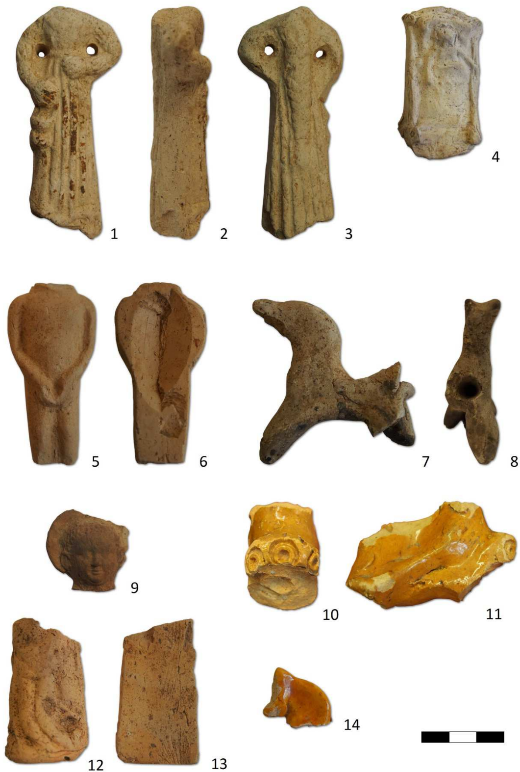
Tabulka 13. Plastiky z výzkumu na Praze 1 – Nové Město, Mikulandská čp. 135. Plastika ženy s copem na zádech a konví – 1, 2, 3; plastika Ježíška v kolébce – 4; plastika mladého Ježíše – 5, 6; plastika koníčka s otvorem v hrudi – 7, 8; hlava mladého Ježíše se svatozáří – 9; glazované torzo jezdecké plastiky – 10, 11; torzo pravděpodobně Madony – 12, 13; hlava glazovaného koníčka – 14.