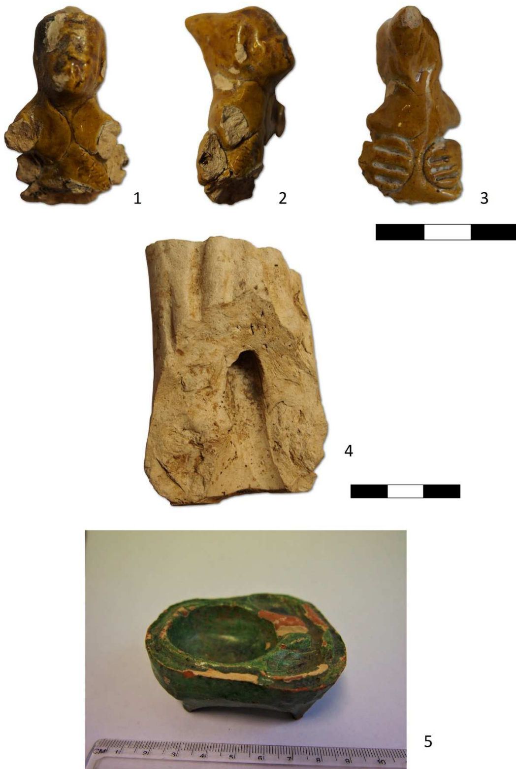
Tabulka 16. Nálezy z výzkumu na Praze 1 – Staré Město, Ovocný trh čp. 1096/I. Torzo plastiky v kápi – 1, 2, 3; torzo plastiky – 4, miniatura – 5.