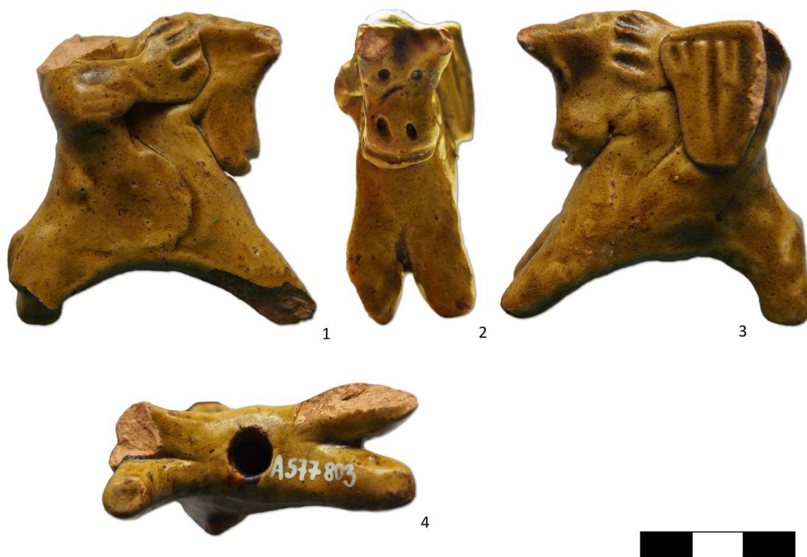
Tabulka 1. Rytíř se štítem na koni – 1, 2, 3, 4. Praha 1 – Staré Město, Pařížská ulice čp. 3.