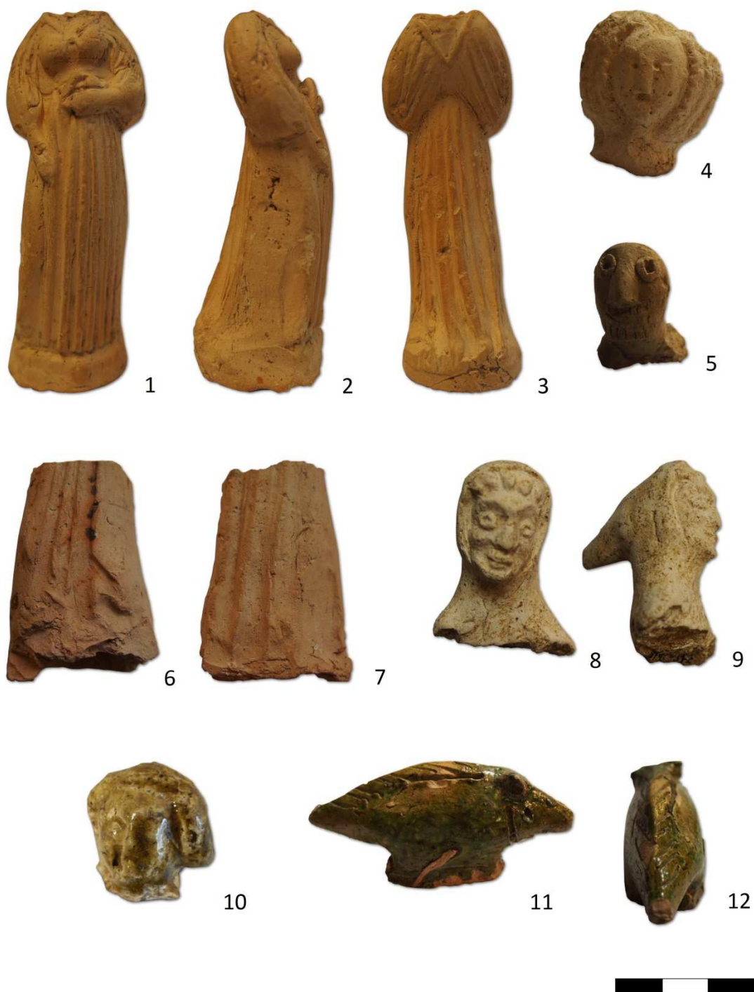
Tabulka 15. Postava ženy držící podkasaný šat – 1, 2, 3. Praha 1 – Hradčany, Valdštejnské náměstí čp. 162/III.; hlava panenky typu Kruseler – 4. Praha 1 – Malá Strana, Saská ulice ppč. 1045; hlava vousatého muže. Praha 1 – Malá Strana, Malostranské náměstí čp. 258/III.; torzo ženské postavy – 6, 7. Praha 1 – Malá Strana, Thunovská ulice čp. 192; Muž v kápi – 8, 9. Praha 1 – Staré Město, Halštatské náměstí čp. 752/I.; hlava andělíčka – 10. Praha 1 – Staré Město, Uhelný trh; plastika zvířete – 11, 12. Praha 1 – Malá Strana, restaurace Petřínské terasy.