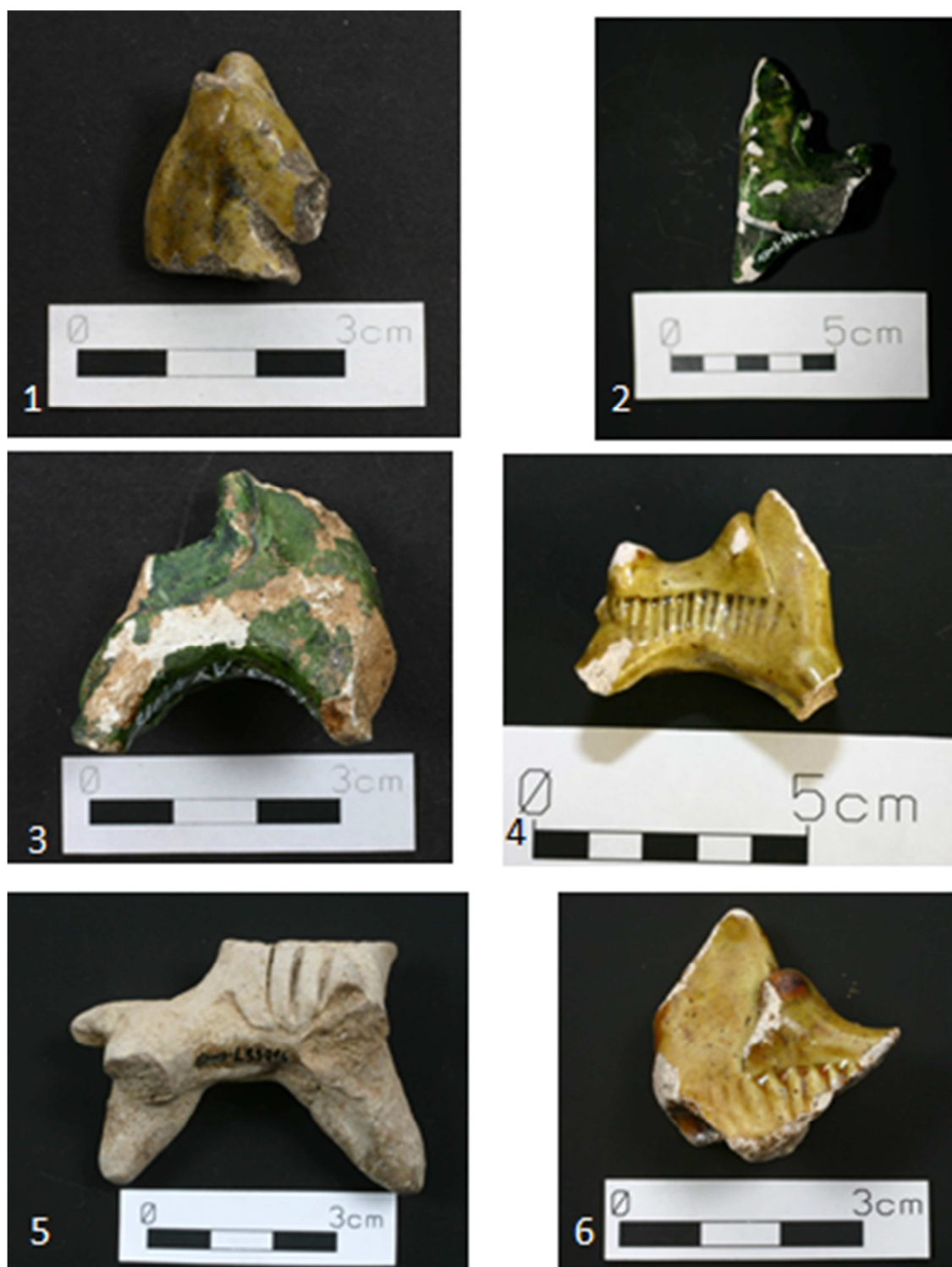
Tabulka 38. Nálezy z Prahy 1 – Nové Město, náměstí Republiky. Žlutozeleně glazovaná hlava koníčka – 1; zeleně glazovaný fragment koníčka – 2; zeleně glazované torzo koníčka – 3; žlutozeleně glazovaný fragment koníčka zdobeným radélkem – 4; neglazovaný koníček – 5; žlutozeleně glazovaný koníček zdobený radélkem – 6.