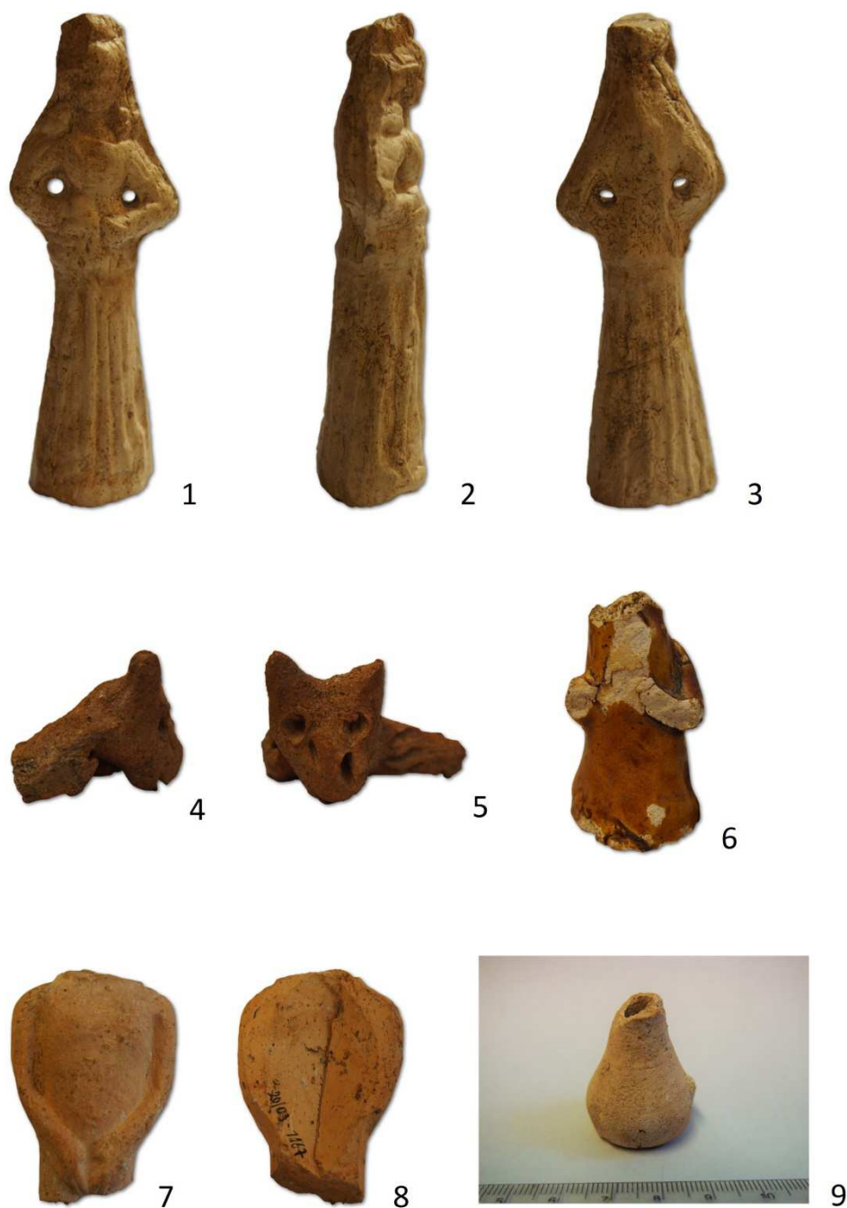
Tabulka 11. Plastiky z výzkumu na Praze 1 – Malá Strana, Karmelitská ulice čp. 387/III. a Nebovidská ulice čp. 459/III. Plastika ženy s provrtaným podpažím – 1, 2, 3; plastika zvířete – 4, 5; zlomek postavy – 6; fragment postavy – 7, 8; miniatura nádoby – 9.