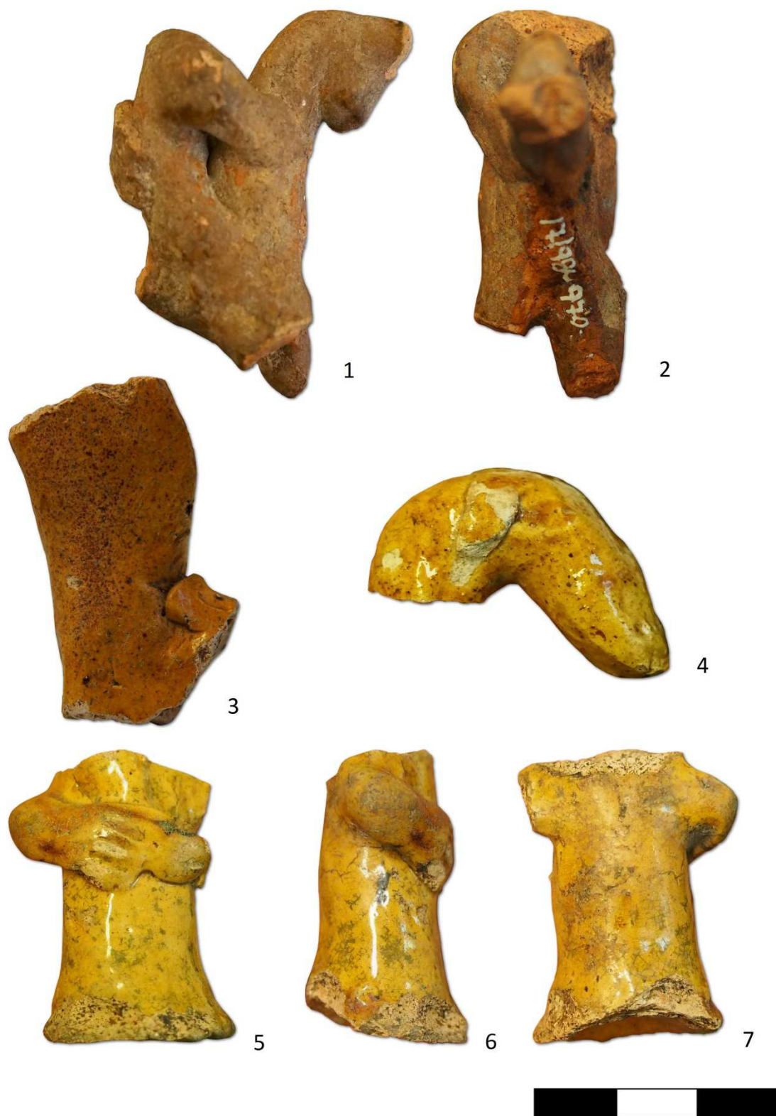
Tabulka 9. Nálezy z Prahy 1 – Staré Město, Bílova ulice čp. 855/I. Jezdecká plastika – 1, 2; zlomek glazovaného koníčka – 3; zlomek glazovaného zvířete – 4; fragment glazované postavy – 5, 6, 7.