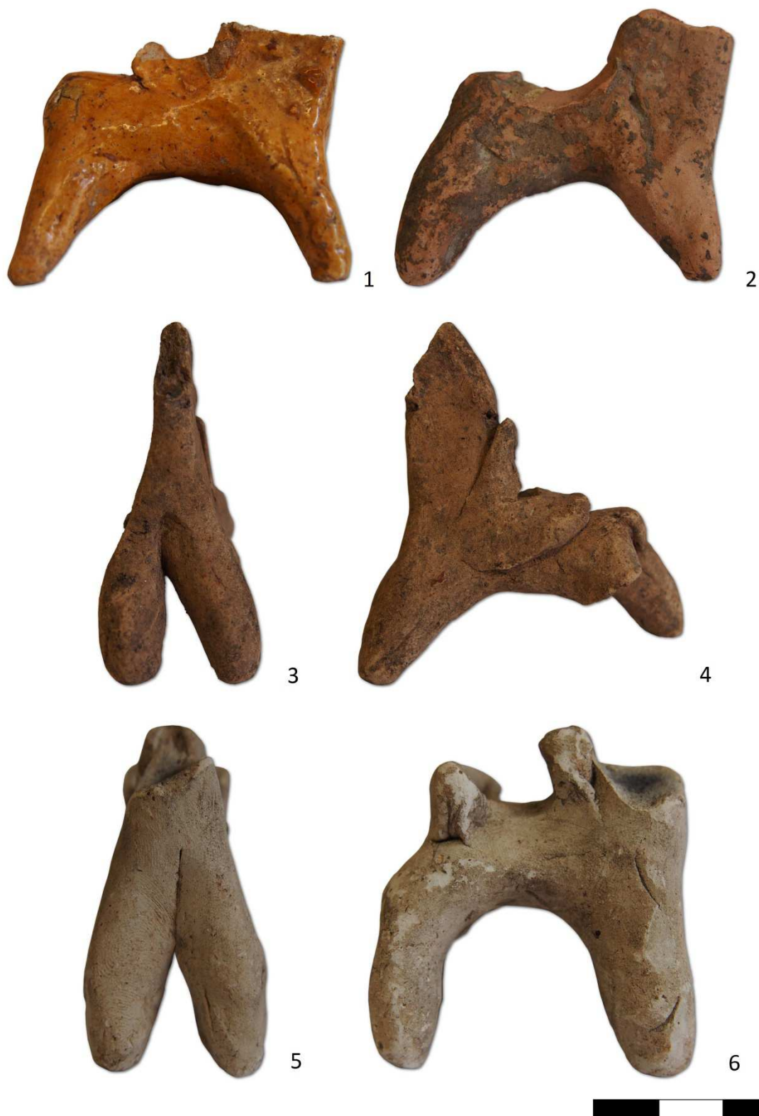
Tabulka 4. Glazovaný kůň se sedlem – 1. Místo nálezu neznámé; neglazovaný kůň – 2. Místo nálezu neznámé; neglazovaný kůň se sedlem – 3, 4. Místo nálezu neznámé; Kůň se sedlem z kaolinové hlíny – 5, 6. Místo nálezu neznámé.