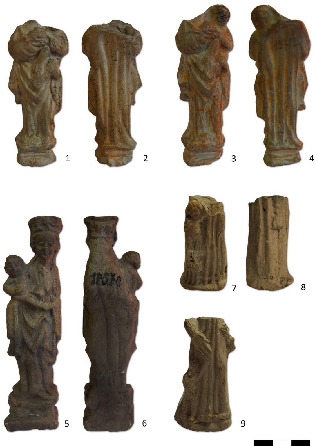
Tabulka 6. Torzo Madony s dítětem – 1, 2. Praha 1 – Nové Město, na křižovatce Václavského náměstí s Vodičkovou a Jindřišskou ulicí; torzo Madony s dítětem – 3, 4. Praha – blíže neuvedeno; Madona s dítětem – 5, 6. Praha – blíže neuvedeno; žena s copem a dítětem na stoličce – 7, 8. Místo nálezu neznámé; Žena držící dítě za ruku – 9. Místo nálezu neznámé.