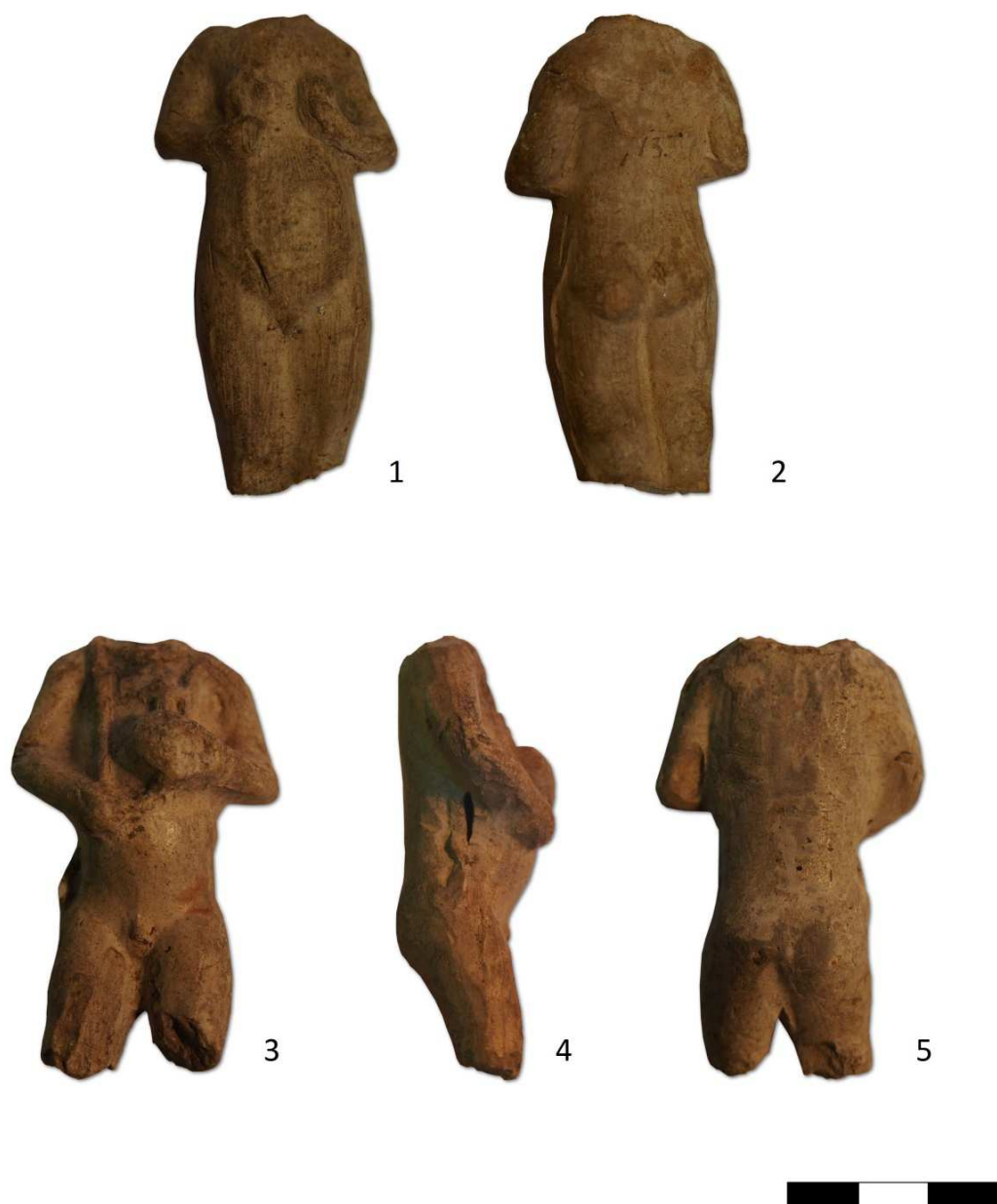
Tabulka 2. Postava bez hlavy – 1, 2. Místo nálezů neznámé; chlapec držící žezlo a vladařské jablko – 3, 4, 5. Místo nálezů neznámé.