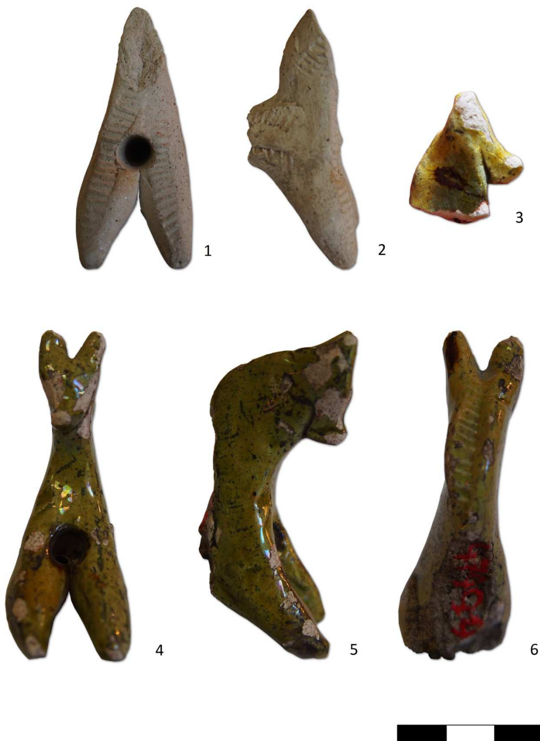
Tabulka 3. Kůň z kaolinové hlíny – 1, 2. Praha 1 – Staroměstské náměstí; zlomek koňské hlavy - 3. Praha 1 – Staroměstské náměstí; glazovaný kůň s otvorem v hrudi – 4, 5, 6. Praha 1 – Staroměstské náměstí.