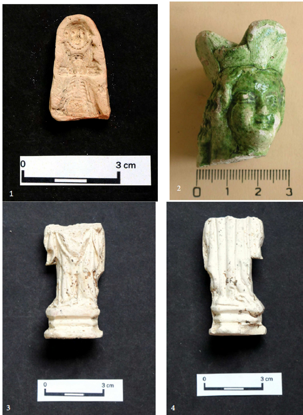
Tabulka 34. Výrobní forma – 1. Praha 1 – Nové Město, Na Poříčí 1076; Madona s korunou – 2. Praha 1 – Nové Město, Truhlářská 27; Spodní část Madony – 3, 4. Praha 1 – Nové Město, Palackého 716. (Převzato z: Juřinová 2015, 141, 143, 145; tab. 20, 22, 24).