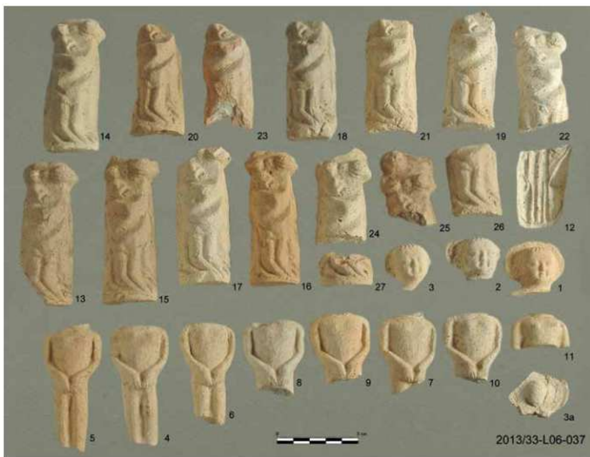
Tabulka 14. Plastiky z výzkumu na Praze 1 – Nové Město, Mikulandská čp. 135. Depot drobných figurálních plastik s náboženskou tematikou (převzato z Cymbalak – Hladíková 2016, 37, obr. 10).