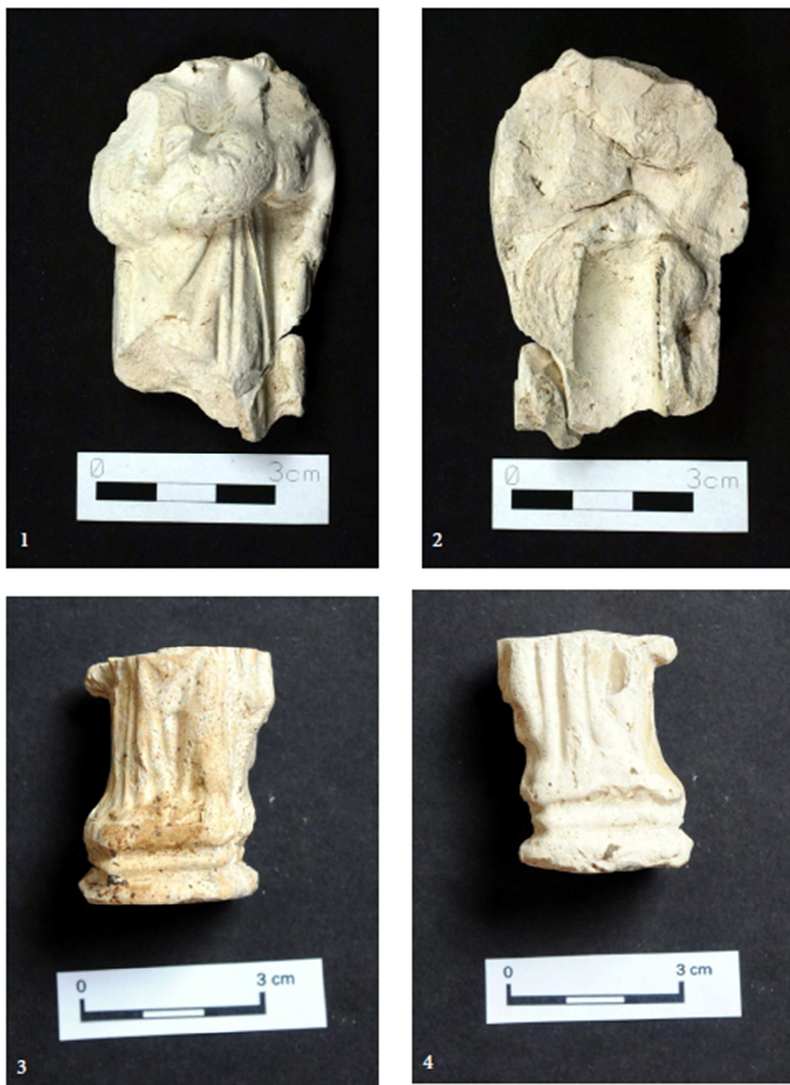
Tabulka 21. Nálezy z výzkumu na Praze 1 – Nové Město, náměstí Republiky. Fragment Madony s dítětem – 1, 2; spodní polovina postavy (Madona) – 3, 4. (Převzato z: Juřinová 2015, 124, tab. 3).