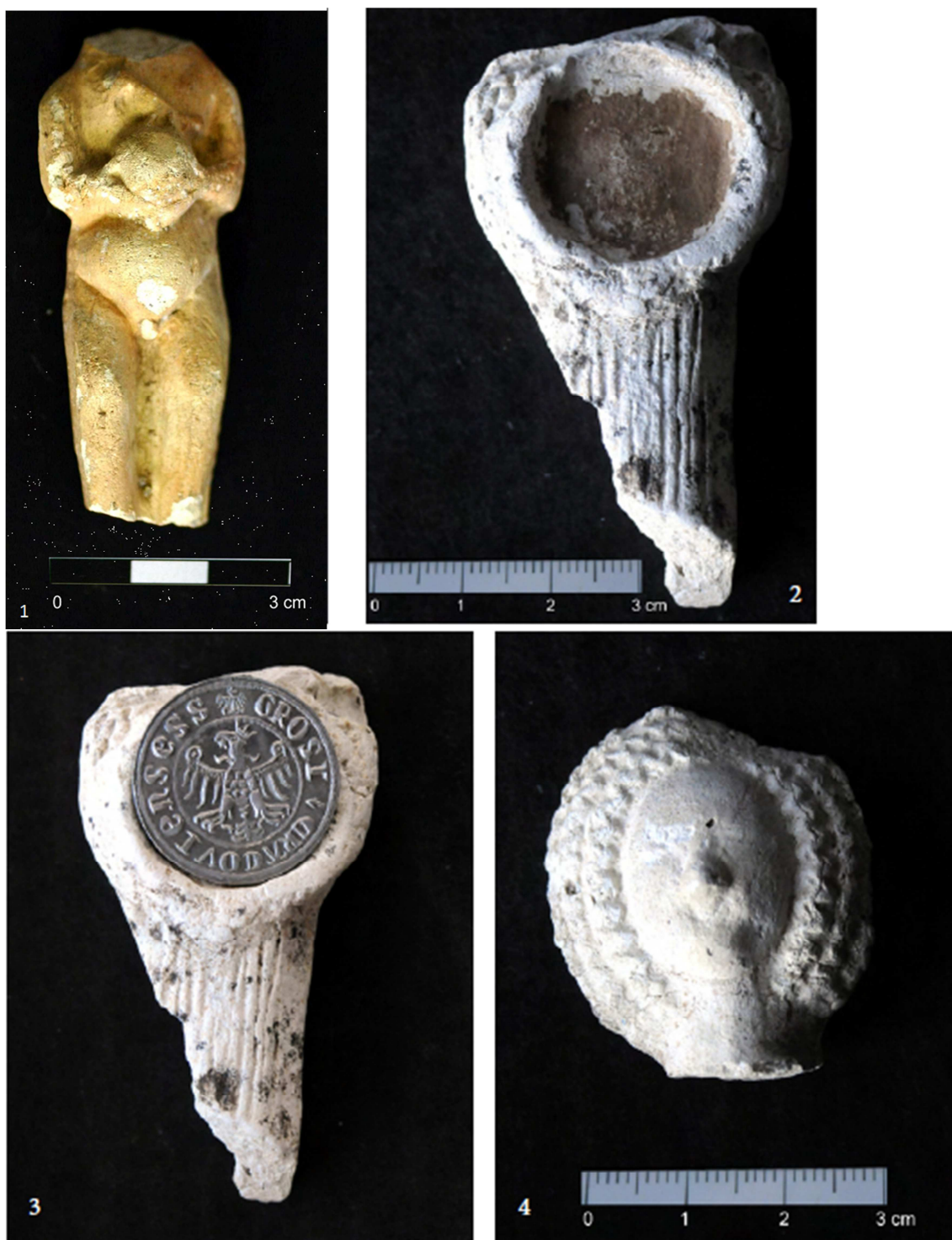
Tabulka 30. Nález z výzkumu na Praze 1 – Nové Město, náměstí Republiky. Ježíšek – 1; panenka kruseler (?) – 2, 3; hlava panenky kruseler – 4. (Převzato z: Juřinová 2015, 126, 137; tab. 5, 16).