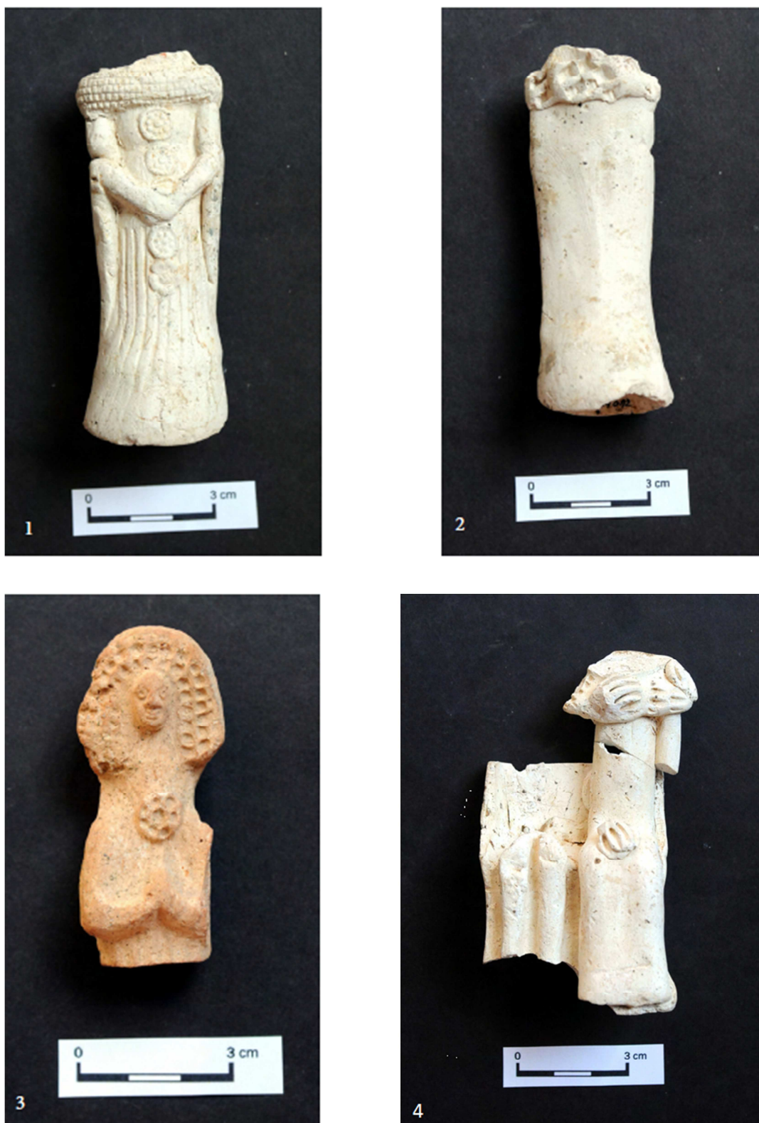
Tabulka 29. Nálezy z výzkumu na Praze 1 – Nové Město, náměstí Republiky. Panenka kruseler – 1, 2; Panenka kruseler – 3; sedící postava na lavičce (?) – 4. (Převzato z: Juřinová 2015, 135, 136; tab. 14, 15).