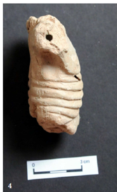
Tabulka 26. Nálezy z výzkumu na Praze 1 – Nové Město, náměstí Republiky. Postava se založenýma rukama – 1; torzo těla Ukřižovaného – 2, 3, 4. (Převzato z: Juřinová 2015, 131, tab. 10).