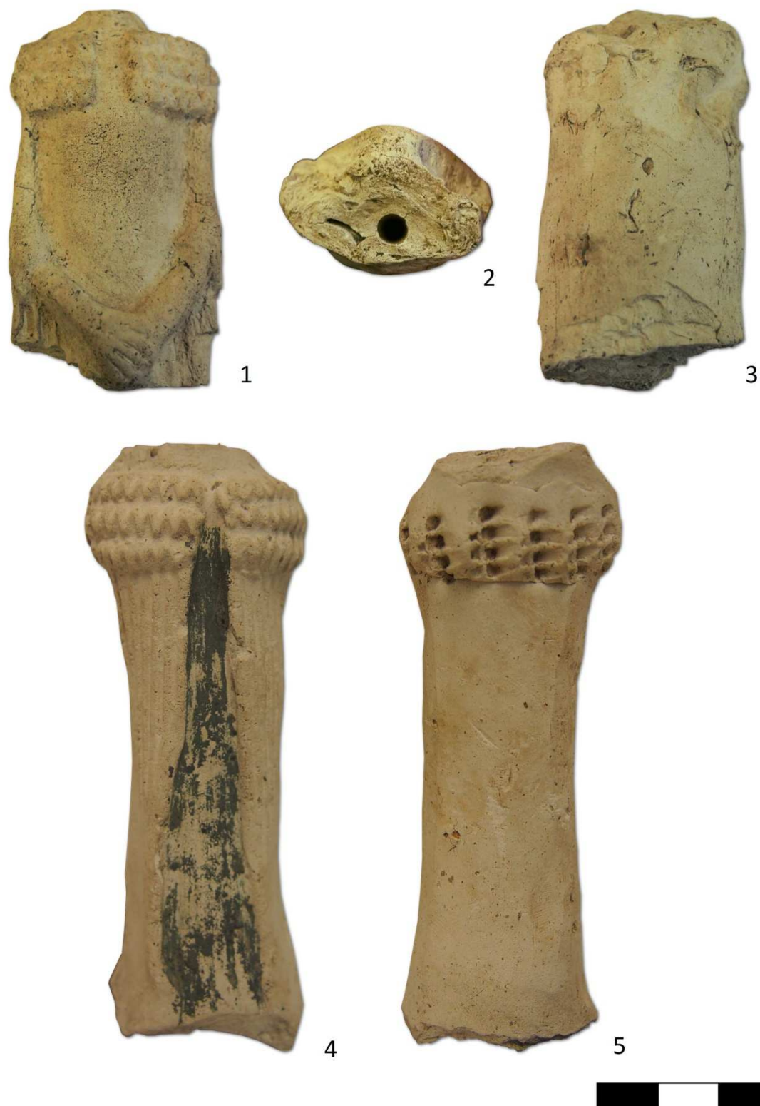
Tabulka 10. Plastiky z výzkumu na Praze 1 – Nové Město, Vodičkova – Jungmannova ulice ppč. 2379 + 2381. Torzo ženské postavy – 1, 2, 3; Zlomek ženské plastiky – 4, 5.