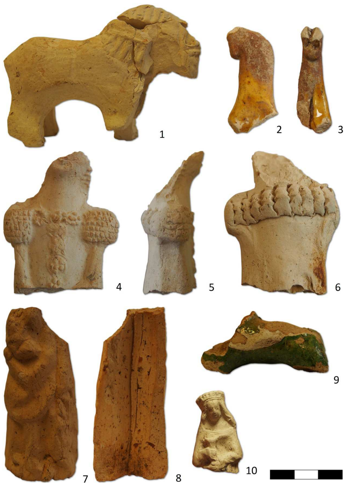
Tabulka 17. Nálezy z výzkumu na Praze 1 – Nové Město, Spálená- Purkyňova- Vladislavova- Charvátova ulice. Plastika koníčka – 1; zlomek glazovaného koníčka – 2, 3; panenka kruseler – 4, 5, 6; plastika ženy – 7, 8; torzo figurky zeleně glazovaného koně – 9; plastika ženy s kalichem – 10.