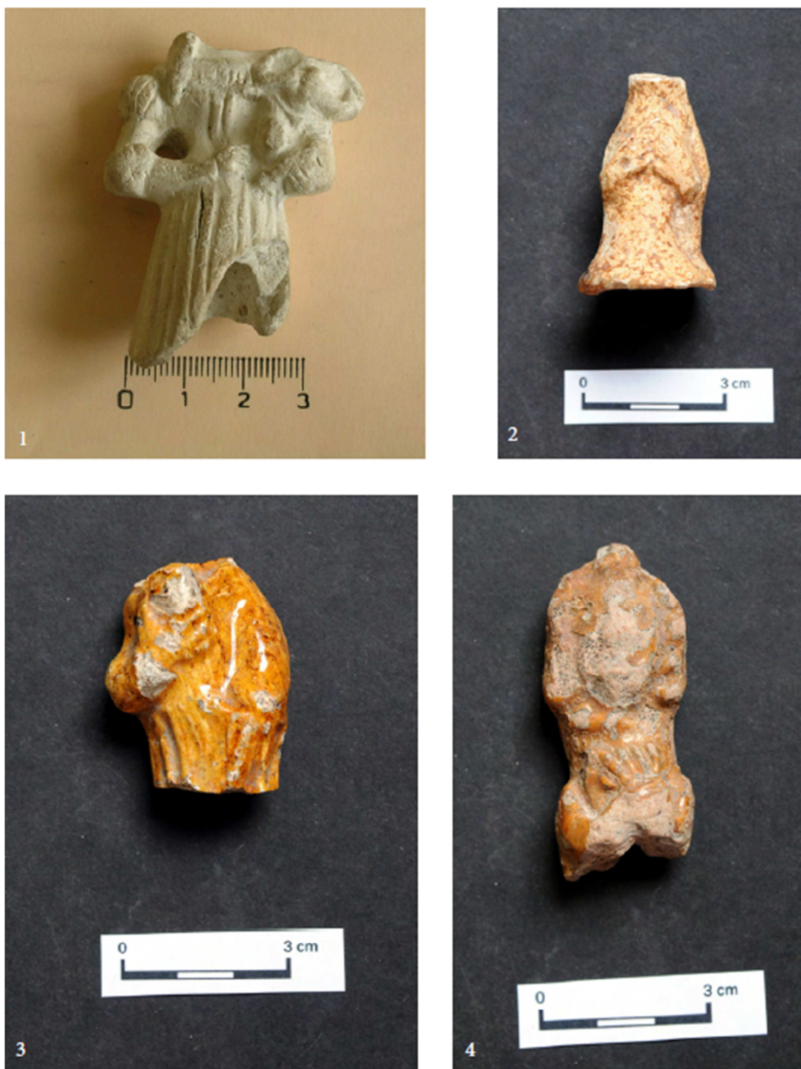
Tabulka 31. Plastika Madony s Ježíškem – 1. Praha 1 – Nové Město, náměstí Republiky; torzo modlící se postavy – 2. Praha 1 – Nové Město, Petrská ulice/ XVIII; žlutě glazovaná postava – 3. Praha 1 – Nové Město, Petrská ulice/ XVIII; panenka kruseler – 4. Praha 1 – Nové Město, Petrská ulice/ XVIII. (Převzato z: Juřinová 2015, 138; tab. 17).