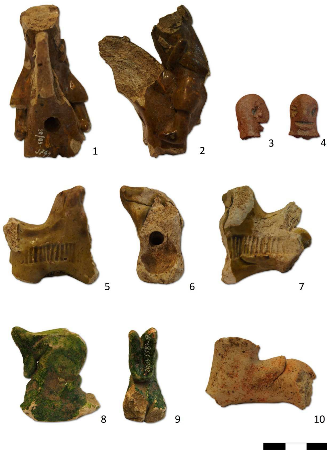
Tabulka 12. Plastiky z výzkumu na Praze 1 – Malá Strana, Karmelitská ulice čp. 387/III. a Nebovidská ulice čp. 459/III. Torzo jezdecké plastiky – 1, 2; hlava rytíře – 3, 4; zlomek glazovaného koníčka – 5, 6, 7; fragment glazovaného koníčka – 8, 9; zlomek červeně malovaného koníčka – 10.