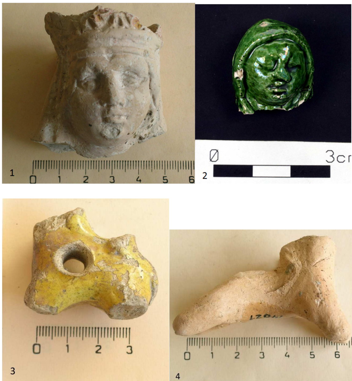
Tabulka 37. Hlava Madony s korunou – 1. Praha 1 – Nové Město, Truhlářská ulice 16; hlava ženy se zavřenýma očima – 2. Praha 1 – Nové Město, Truhlářská ulice 16; koníček s provrtanou dírou v šíji – 3. Praha 1 – Nové Město, Petrská-Mlynářská ulice 290; plastika koníčka – 4. Praha 1 – Nové Město, Truhlářská 1103. (Převzato z: Juřinová 2015, 145; tab. 24; 3-4: foto Archaia Praha o.p.s.).