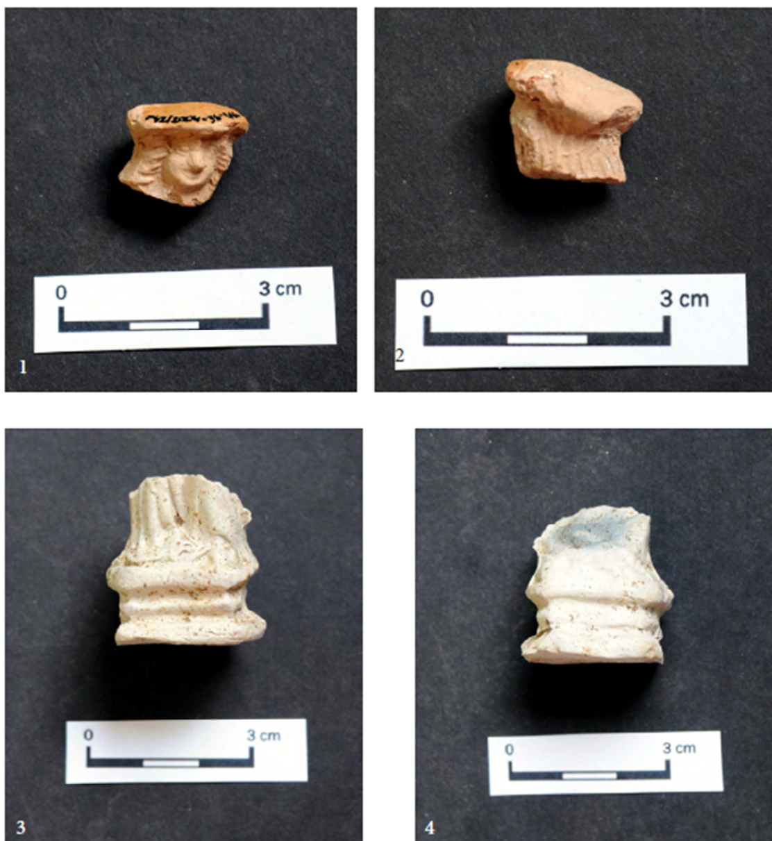
Tabulka 33. Nálezy z výzkumu na Praze 1 – Nové Město, Na Poříčí 1076; muž v baretu – 1, 2; podstava Madony – 3, 4. (Převzato z: Juřinová 2015, 142; tab. 21).