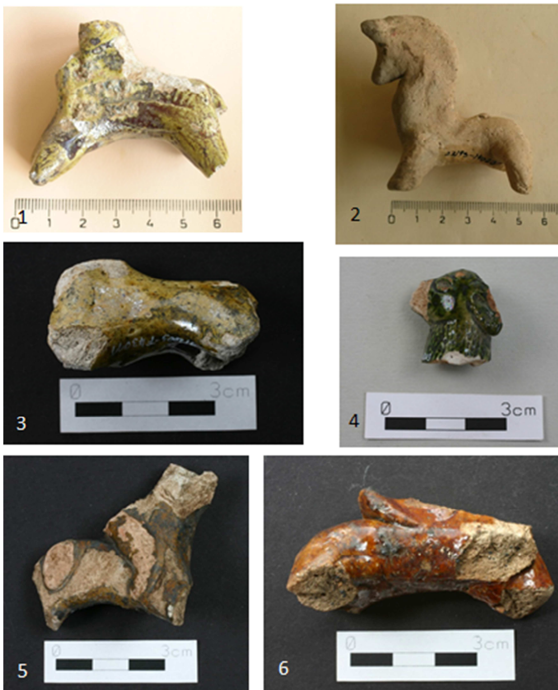
Tabulka 40. Žlutozeleně glazovaný koníček ozdobený radélkem – 1. Praha 1 – Staré Město, Dům u Sixtů; koníček s masivním krkem – 2. Praha 1 – Nové Město, Truhlářská 1103; torzo žlutozeleně glazovaného koníčka – 3. Praha 1 – Nové Město, náměstí Republiky; zeleně glazovaná hlava zajíce – 4. Praha 1 – Nové Město, náměstí Republiky; glazované torzo koníčka – 5. Praha 1 – Nové Město, náměstí Republiky; hnědě glazovaný koníček se sedlem – 6. Praha 1 – Nové Město, náměstí Republiky.