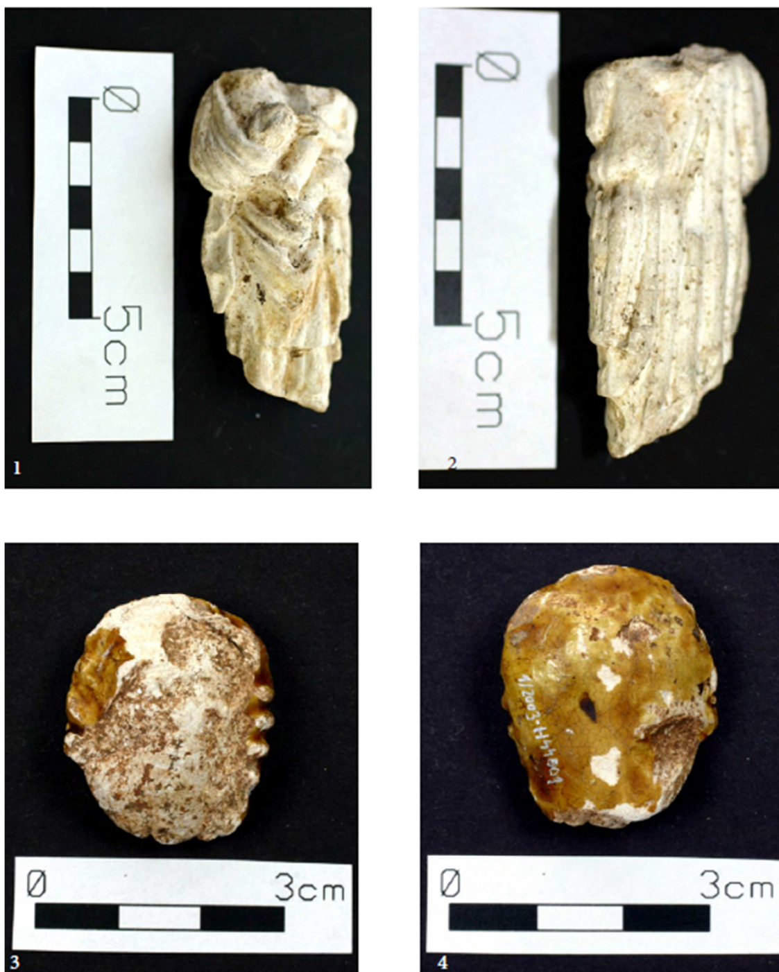
Tabulka 22. Nálezy z výzkumu na Praze 1 – Nové Město, náměstí Republiky. Torzo madony – 1, 2; glazovaná hlava panenky kruseler (?) – 3, 4. (Převzato z: Juřinová 2015, 127, tab. 6).