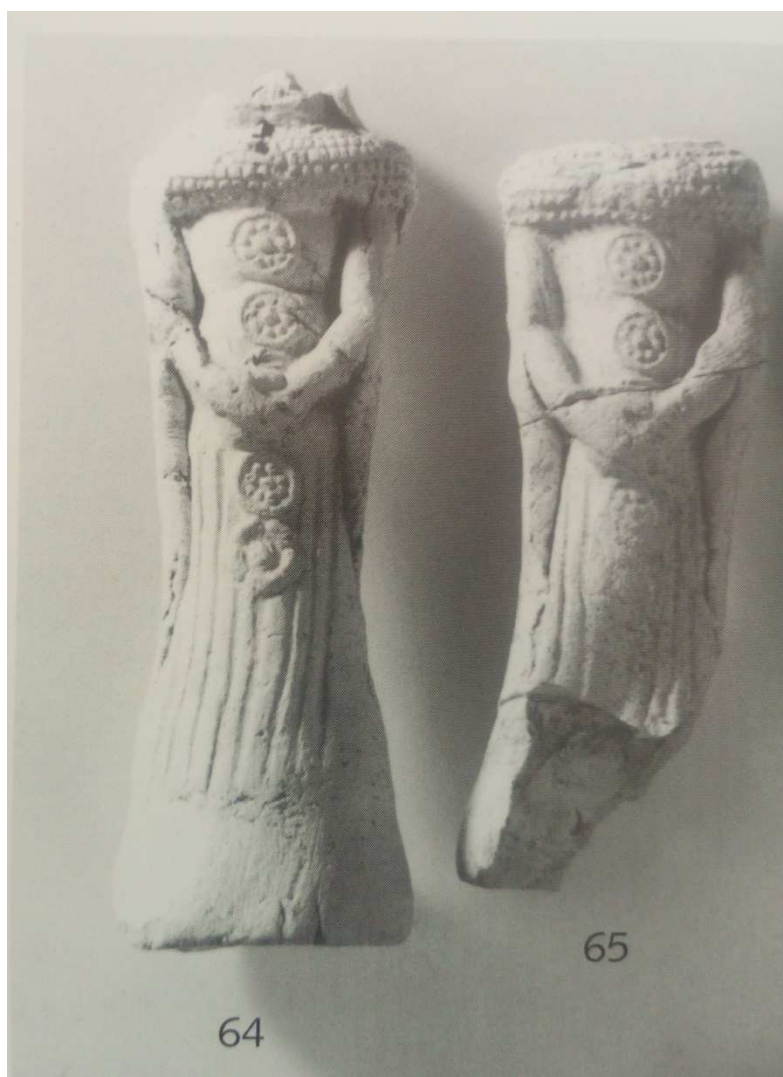
Obr. 1: Plastika panenky kruseler z Norimberku, která je totožná s panenkou z výzkumu na náměstí Republiky (Kat. 105.).