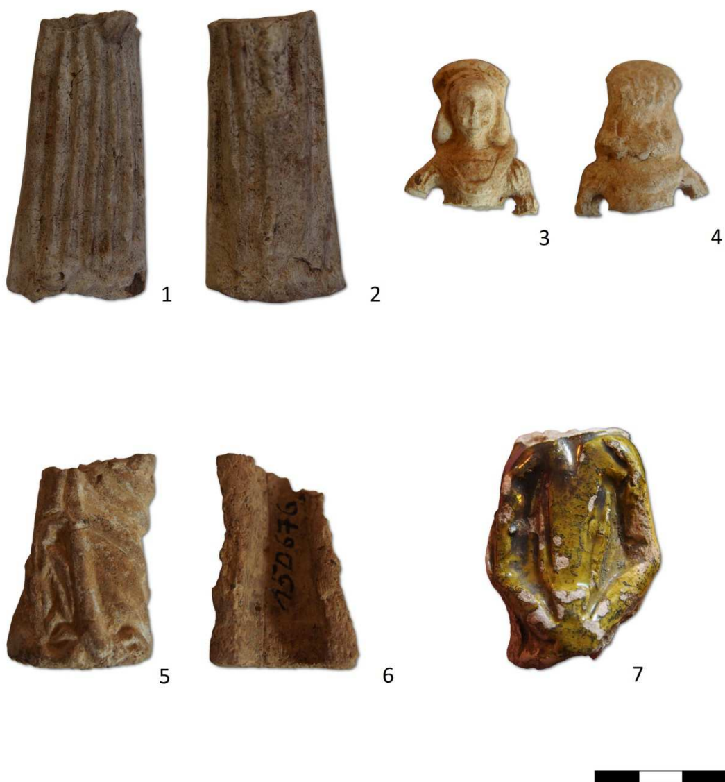
Tabulka 8. Postava ženy s copem – 1, 2. Místo nálezů neznámé; zlomek postavy ženy s provrtaným podpažím – 3, 4. Místo nálezů neznámé; zlomek postavy ženy – 5, 6. Praha 1 – Staré Město, Týnská 630/6; zlomek postavy – 7. Praha 1 – Staré Město, Staroměstské náměstí.