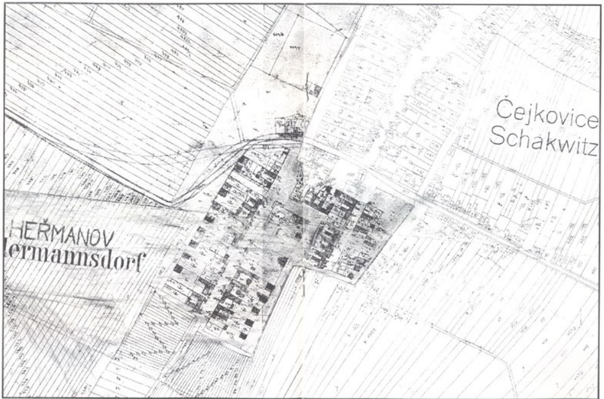
Příloha č. 9