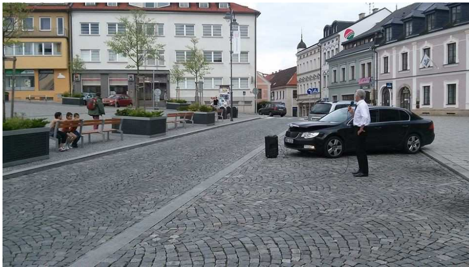
Obrázek 3: Proslov předsedy SPR-RSČ Miroslava Sládka