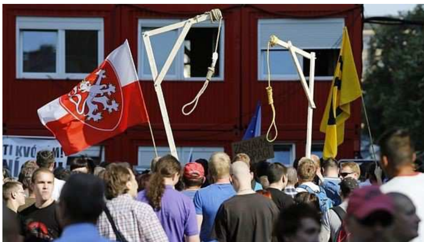
Obrázek 1: Maketa šibenice na demonstraci Národní demokracie