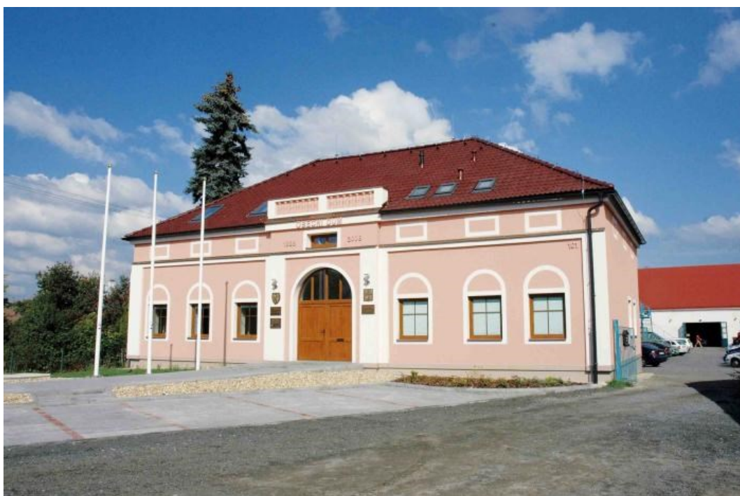
Obrázek č. 9: Multifunkční Obecní dům Klešice [Obecní dům, 2016]

Multifunkční Obecní dům (Obrázek č. 9) byl otevřen 5. října 2008 v obci Klešice v Pardubickém kraji. Statek z roku 1898 se podařilo zrekonstruovat díky podpoře z Programu rozvoje venkova 2007-2013 [Politika rozvoje venkova 2007-2013, 2008]. Obecní dům je víceúčelové zařízení pro obyvatele všech věkových kategorií. V objektu je umístěna obecní knihovna, klubovna, víceúčelový sál a kancelář obecního úřadu [Rekonstrukce obytné budovy, 2009-2016]. Projekt „Rekonstrukce obytné budovy na multifunkční dům“ zaštitila starostka paní Marie Stará. V současné době též vykonává i funkci knihovnickou. Knihovna má otevřeno pro uživatele 2x týdně v odpoledních hodinách. V knihovně je k dispozici 1 160 svazků knih a osm titulů časopisů. Výměnný soubor je zapůjčen z Městské knihovny Chrudim, pověřené regionálními funkcemi pro okres Chrudim. V Obecním domě probíhají výtvarné dílny, sportovní aktivity, hudební produkce i výstavy výtvarných děl [Obecní dům, 2016].