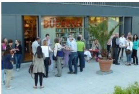
Obrázek č. 5: Knihovna ve VD Mallersdorf-Pfaffenberg [Mark Mallersdorf-Pfaffenberg, 2016]

Obecně-farní knihovna se nachází v suterénu budovy (Obrázek č. 5). Disponuje svým vlastním vchodem, otevřeno má 3x týdně a její nabídka se neomezuje jen na klasické výpůjční služby. Nachází se v ní srdce VD, tzv. „Der Offene Treff“. Jde o prostor, který je vlastní všem VD a zde ho provozuje knihovna. Je zde možno si vypít kávu, diskutovat nebo si jen tak posedět nad knihou či časopisem. Knihovna jako jeden ze subjektů VD využívá ke svým akcím prostory sálů v horním patře domu. Plánuje a organizuje literární pořady s předčítáním. Do knihovny si přicházejí lidé vyměňovat zkušenosti, hledat potřebné informace a navazovat nové kontakty s lidmi z místní komunity. Samozřejmostí je volně přístupný internet [Mark Mallersdorf-Pfaffenberg, 2016].