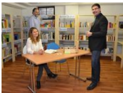
Obrázek č. 3: Knihovna vícegeneračního domu Landau in der Pfalz [Stadt Landau in der Pfalz, 2016]