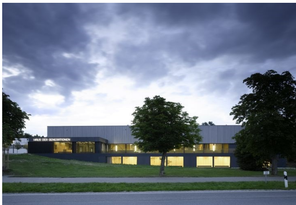
Obrázek č. 4: Vícegenerační dům Mallersdorf – Pfaffenberg [Mark Mallersdorf-Pfaffenberg, 2016]

Městys Mallersdorf-Pfaffenberg se nachází ve Svobodném státě Bavorsko. Obec je zřizovatelem místního VD. Obecní rada měla zájem pořádat společné akce pro veřejnost a hledala vhodné místo pro budovu. V roce 2002 bylo rozhodnuto, že budou odkoupeny pozemky po zaniklé továrně, které ležely dlouhý čas ladem. Pozemky továrny měly výhodnou centrální polohu v rámci katastru. Projekt přestavby výrobní haly byl finančně podpořen z Evropských fondů a nesl název Dům generací. Městys Mallersdorf-Pfaffenberg měl zájem o další rozšíření nabídky aktivit pro obyvatele a přihlásil se do akčního projektu Spolkového ministerstva pro rodinu, seniory, děti a mládež „Vícegenerační domy“. Uspěl a oficiální název zařízení je od 1. 6. 2016 Vícegenerační dům Mallersdorf-Pfaffenberg (Mehrgenerationenhaus Mallersdorf-Pfaffenberg). Budova má 2 podlaží (Obrázek č. 4). V suterénu jsou umístěny klubovny, kde se schází mládež