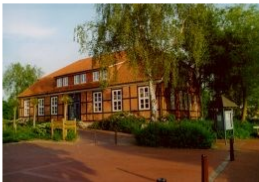
Obrázek č. 2: Vícegenerační dům Horneburg [Bücherei, 2016]

Obec Horneburg leží ve spolkové zemi Dolní Sasko. Zřizovatelem VD je obec. Vícegenerační dům (Mehrgenerationenhaus Horneburg) je umístěn v budově historického statku Burgmannshof. Zastupitelstvo obce získalo finanční podporu ze spolkového projektu „Vícegenerační domy I“ (2006-2011), a tak mohla být v roce 2011 dokončena i přístavba historického statku (Obrázek č. 2). V roce 2012 byl objekt plně zprovozněn. Ve VD je umístěno Dobrovolnické centrum (Freiwilligenzentrum), v kterém má sídlo zmocněnec pro rovné postavení žen a mužů 3 (Gleichstellungsbeauftragte). Jedním ze subjektů domu je poradna pro rodinu (Familienservicebüro). Poradna je kontaktním bodem jak pro rodiče, kteří hledají hlídání pro své děti, tak i pro subjekty, které hlídání, jako placenou službu, nabízejí [Programm, 2016].