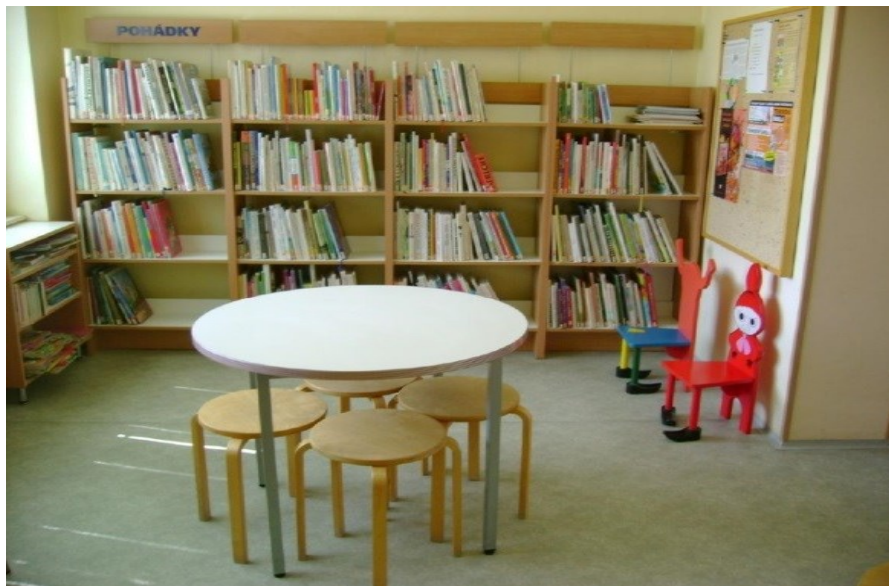
Obrázek č. 16: Oddělení pro dětské čtenáře [Moravcová, 2012]

připravovaných pro tuto věkovou kategorii (Obrázek č. 17). V roce 2003 prošlo toto oddělení rekonstrukcí. Zakázku se zhostil Ateliér Biblio zastoupený Ing. Arch. Kateřinou Hořavovou.