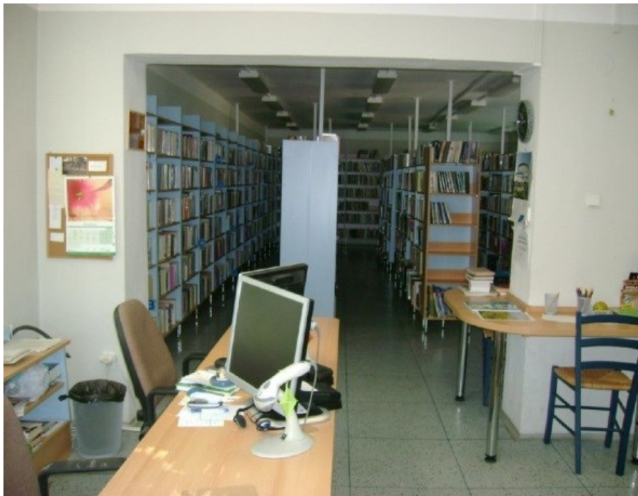
Obrázek č. 15: Oddělení pro dospělé čtenáře [Moravcová, 2012]

Z venkovní chodby se vstupovalo do malé předsíně, ve které měli návštěvníci věšák na kabáty. Naproti vstupním dveřím byl umístěn výpůjční pult pro dvě pracovnice. Vlevo od výpůjčního pultu byla dvě místa s počítačem, zde bylo možno využít připojení na veřejný internet. Vpravo byl umístěn volný výběr se studijními místy. Police byly vyrobeny z dřevotřísky a ukotveny ke stropu (Obrázek č. 15). V tomto oddělení byly i kanceláře katalogizátorů a ředitelky knihovny, za nimi se nacházela kuchyňka pro zaměstnance.