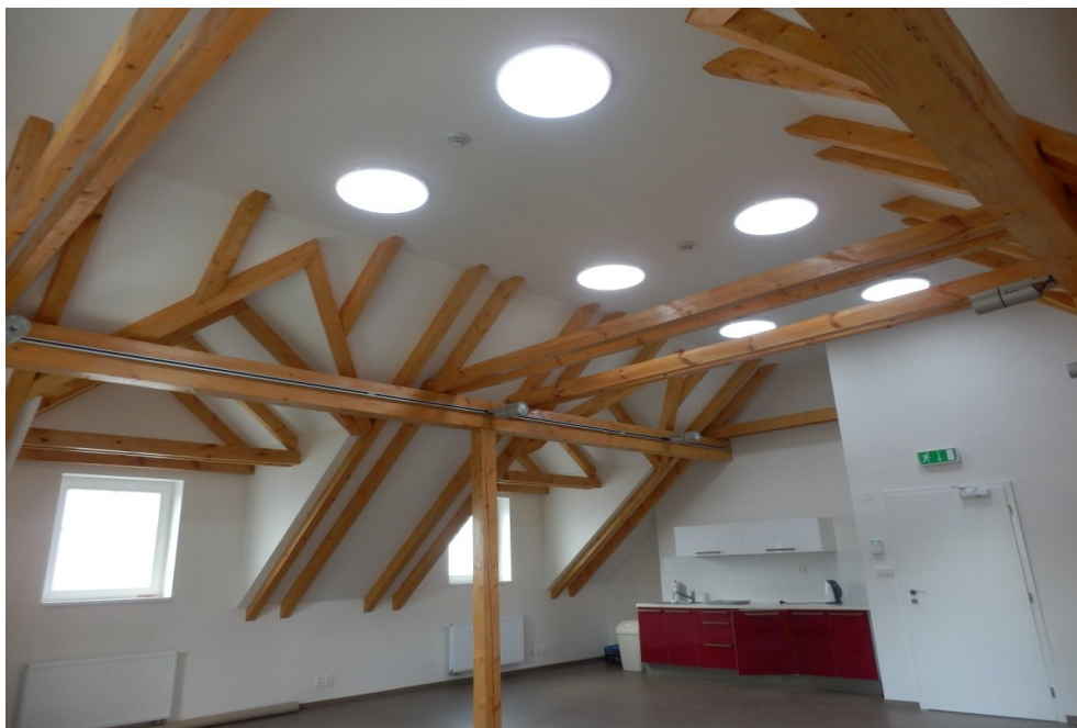
Obrázek č. 11: Polyfunkční dům Zvole, malý sál — knihovna [Obec Zvole, 2016]

Obec Zvole, ležící ve Středočeském kraji, slavnostně otevřela v únoru 2014 nový obecní polyfunkční dům. Polyfunkční dům má dvě podlaží. V přízemí je umístěno zdravotní středisko, školní družina a velký společenský sál. V prvním patře najdeme v malém sále knihovnu (Obrázek č. 11). V těchto prostorách bylo vybudováno kombinované osvětlení. K dosažení české technické normy pro knihovny bylo do střechy domu osazeno šest světlovodů. Hodnoty denního osvětlení jsou tak vyhovující pro činnost knihovny i její akce. Plocha sálu určená knihovně má rozlohu 77,5 m 2 .