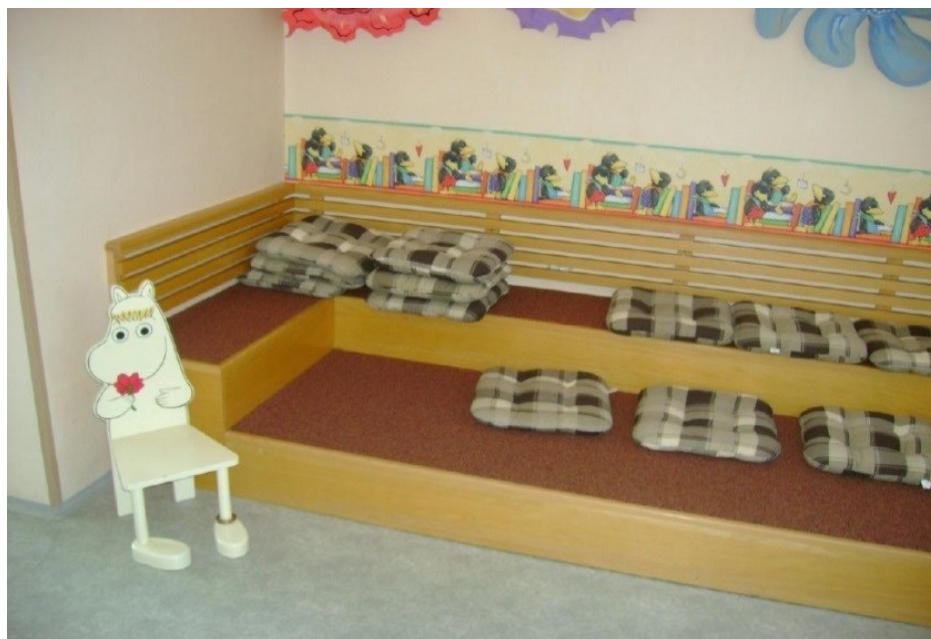
Obrázek č. 17: Čítárna dětského oddělení [Moravcová, 2012]