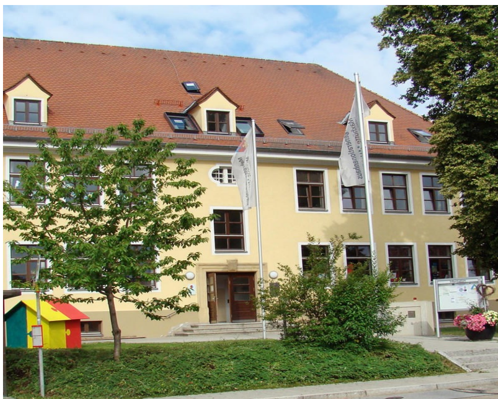
Obrázek č. 6: Vícegenerační dům Maxhütte-Haidhof [MehrGenerationenHaus, 2016]

Město Maxhütte-Haidhof leží ve Svobodném státě Bavorsko. Zřizovatelem VD je město. Vícegenerační dům Maxhütte-Haidhof (Mehrgenerationenhaus Maxhütte-Haidhof) je situován do středu města (Obrázek č. 6). Sídlí v něm mimo knihovny i Volkshochschule. V objektu jsou klubovny, které jsou využívány pro činnost s dětmi a mládeží, své zázemí zde našli i senioři. Na programu domu se podílejí všechny subjekty v domě.