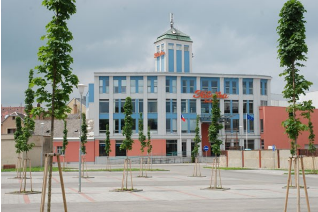
Obrázek č. 8: Multifunkční centrum fabrika [Junek, 2010]

Multifunkční centrum Fabrika bylo otevřeno 29. května 2008 ve Svitavách – Pardubický kraj (Obrázek č. 8). Vzniklo přestavbou původního průmyslového objektu z roku 1925 na novodobé kulturní centrum. Město Svitavy tímto projektem vyřešilo chybějící společenské centrum. Fabrika byla oceněna v soutěži Stavba roku 2009 Cenou předsedy senátu Parlamentu ČR [Junek, 2010]. Hlavním investorem je město Svitavy, projekt byl dále finančně podpořen ze strukturálních fondů EU. Fabrika je označována jako objekt postindustriální, citlivou přestavbou však v sobě nadále ponese informaci o historii místa. Její přerod v informační a vzdělávací centrum s sebou nese novou roli, a to komunikační. Tuto roli umocňuje i její architektonické provedení. Propojovací pasáž zpřístupňuje prostory města, které nebyly dříve využívány a pasáž slouží také jako výstavní prostor. Srdcem Fabriky se stala Městská knihovna ve Svitavách [Vařeka, 2008].