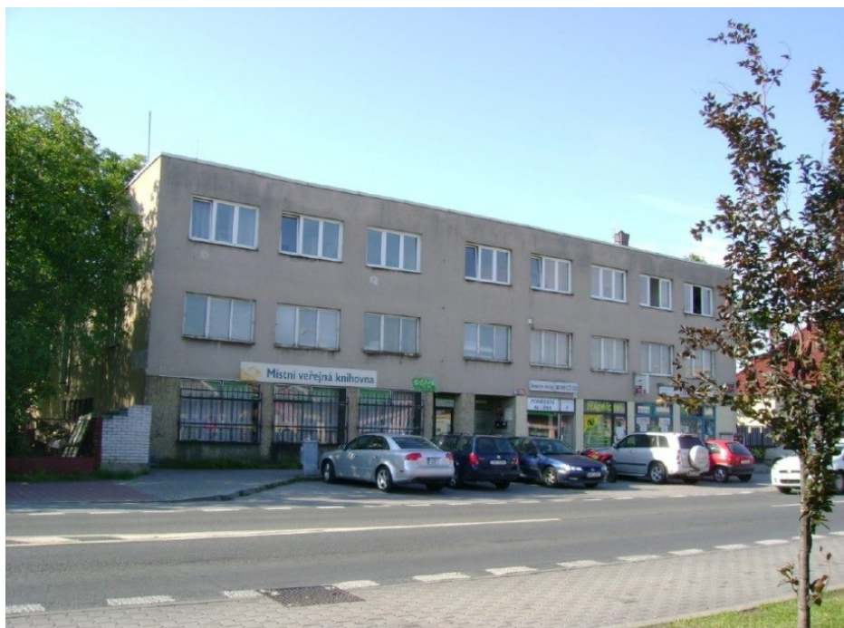
Obrázek č. 13: Knihovna před rekonstrukcí [Moravcová, 2012]