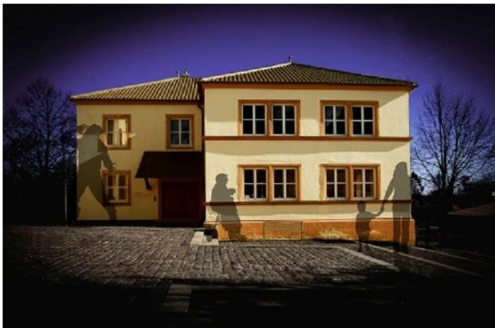
Obrázek č. 7: Vícegenerační dům Johannesberg „Lebens (t) räume" [Mehrgenerationenhaus, 2016]

Obec Johannesberg leží ve Svobodném státě Bavorsko. Vícegenerační dům Johannesberg „Lebens(t)räume“ (Mehrgenerationenhaus Johannesberg „Lebens(t)räume“) je dobře dostupný pro všechny generace (Obrázek č. 7). Leží uprostřed původní zástavby obce u hlavní silnice. VD byl otevřen v bývalém objektu místní fary. Je podporován místním spolkem sponzorů „Lebens(t)räume e.V. Johannesberg“. V listopadu 2015 byl znovu slavnostně otevřen po realizované přestavbě, v rámci přestavby byl navýšen počet místností objektu a byl přistavěn výtah. Hlavním motem tohoto VD je: „Být prostorem, ve kterém se scházejí lidé všech věkových kategorií a rozdílných kultur, lidé hledající podporu s lidmi zprostředkujícími pomoc“ [Mehrgenerationenhaus, 2016]. V objektu je organizován klub vaření, společné snídaně a obědy. 1x týdně je, v rámci služeb pro seniory, vypravován autobus do blízkého města za nákupy. V domě je kontaktní místo pro zájemce o hlídání dětí. Rodiče, chůvy či hlídači prarodiče se zapíší do seznamu žadatelů a je jim předáno spojení. Každý čtvrtek odpoledne je vyhrazený pro lidi s demencí nebo lidi vyžadující trvalou péči.