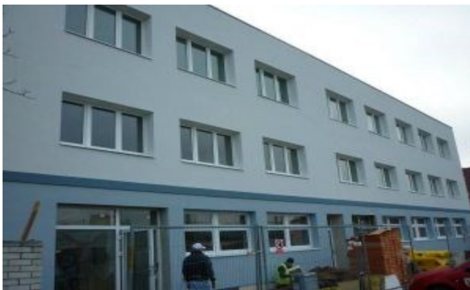
Obrázek č. 18: Rekonstrukce objektu [Místní veřejná knihovna Horní Počernice, 2016]

jednání s Úřadem pro zastupování státu ve věcech majetkových, bezúplatný převod objektu Náchodská 754 od státu do majetku MČ Praha 20. Ještě v témže roce v létě byla zahájena rekonstrukce tohoto objektu Náchodská 754. Dle harmonogramu stavebních prací měla být rekonstrukce dokončena v září 2016. Na jaře 2016 bylo dokončeno zateplení budovy (Obrázek č. 18). Na něj navázaly další práce uvnitř budovy. Harmonogram stavebních prací však nebyl stavební firmou dodržen, termín dokončení rekonstrukce byl posunut na jaro roku 2017. Otevření knihovny pro veřejnost je naplánováno na červen roku 2017. Knihovna má dle plánu obsadit původní druhé nadzemní podlaží, do kterého bude umístěno oddělení pro dospělé, čítárna a studovna. Oproti původnímu rozmístění (před rekonstrukcí) bude knihovna expandovat ještě do třetího nadzemního podlaží, vzniknou tak prostory pro nové dětské oddělení. V tomto podlaží se počítá i s umístěním méně frekventovaných knih.