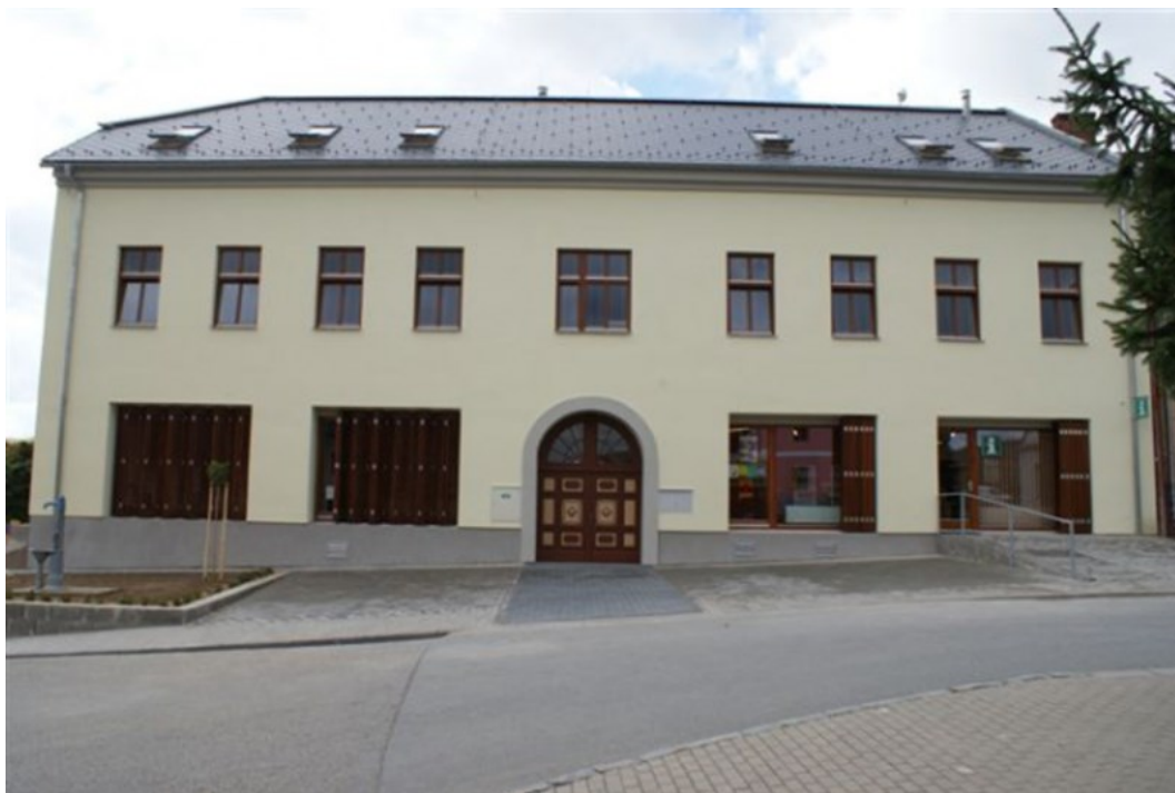
Obrázek č. 10: MD-kulturní a společenské centrum, Město Bystré [Multifunkční dům-kulturní a společenské centrum, 2015]

Město Bystré v Pardubickém kraji otevřelo Multifunkční dům-kulturní a společenské centrum (Obrázek č. 10) v roce 2010. MD vznikl regenerací a revitalizací objektu typu brownfield 7 v městské památkové zóně. Projekt byl realizován za finanční podpory ze strukturálních fondů EU, Regionální operační program Severovýchod [Multifunkční dům-kulturní a společenské centrum, 2009]. V MD se nabízejí služby knihovny, informačního centra, komunitního sálu a centra pro výuku žáků s postižením [Multifunkční dům-kulturní a společenské centrum, 2015]. Městská knihovna v Bystrém má otevřeno tři dny v týdnu a jednu sobotu v měsíci. Je pověřena ve spolupráci s Městskou knihovnou ve Svitavách výkonem regionálních funkcí knihoven pro obecní knihovny v obvodu Bystré [Městská knihovna v Bystrém, © 2009]. V obvodu Bystré je šest obecních knihoven. Knihovna využívá ve velké míře pro své akce prostory komunitního sálu. Pořádá v něm výstavy, divadelní představení, besedy a workshopy. Z akcí na podporu dětského čtenářství připravila sérii společných čtení s názvem