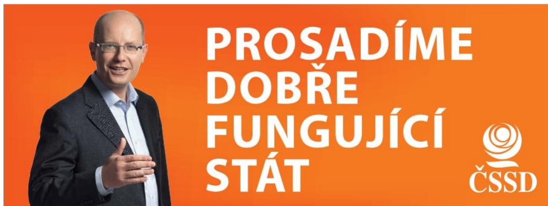
Příloha č. 7: Reklamní předměty ČSSD (http://www.cil-praha.cz)