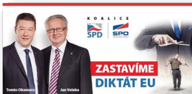
Obrázek 4 Billboard koalice SPD-SPO