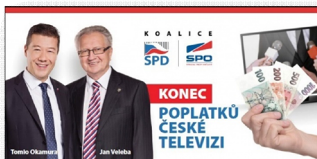
Obrázek 5 Billboard koalice SPD-SPO