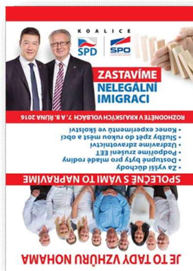
Obrázek 10 Karlovarský kraj 94