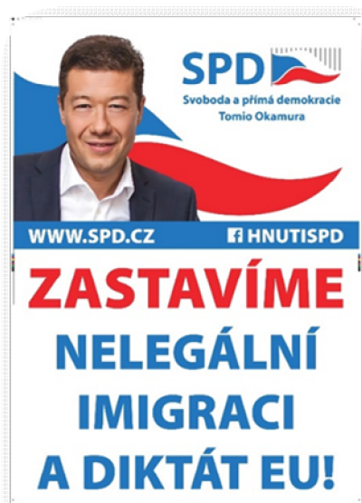
Obrázek 1 Leták SPD