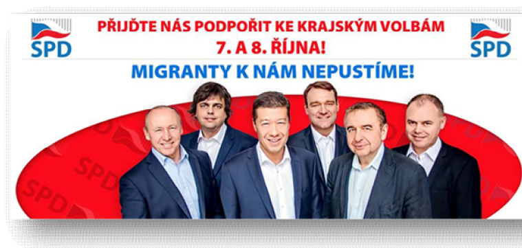
Obrázek 8 Pozvánka koalice SPD-SPO ke krajským volbám 56