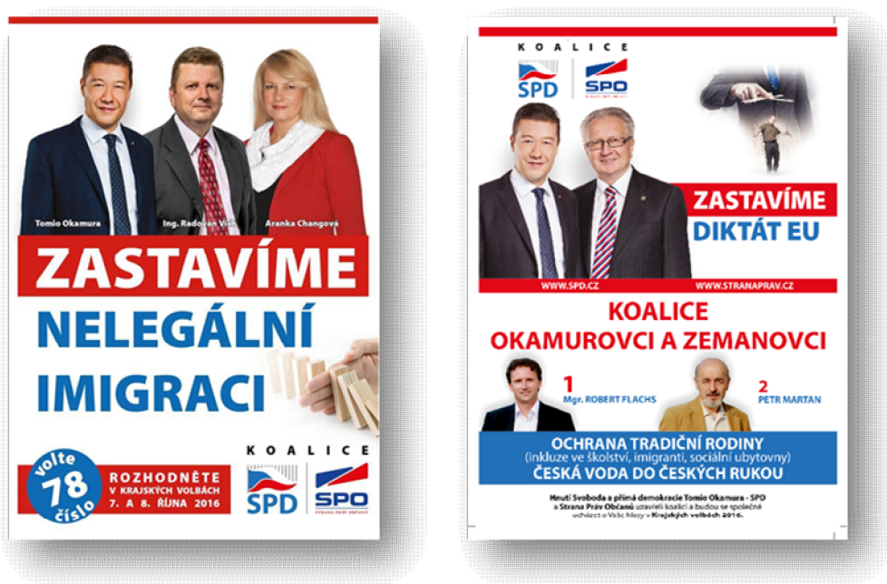
Obrázek 11 Jihočeský kraj 95