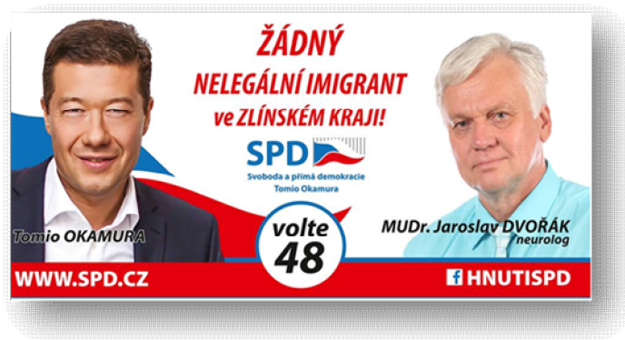
Obrázek 13 Zlínský kraj 97