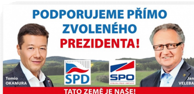
Obrázek 6 Billboard koalice SPD-SPO

Billboardy či plakáty hnutí SPD, resp. koalice SPD-SPO, které jsme mohli vidět po České republice před krajskými volbami, byly zaměřené na celostátní témata. Další příklady propagačních materiálů budou v další části kapitoly.