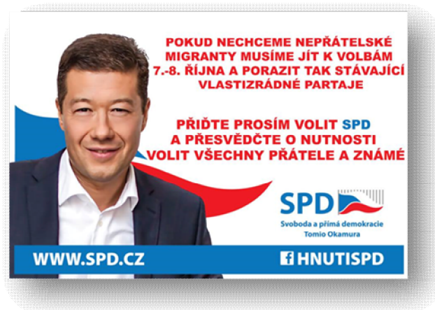
Obrázek 7 Pozvánka SPD ke krajským volbám 55