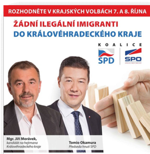
Obrázek 9 Královéhradecký kraj 93

Nyní přikládám několik propagačních materiálů vyskytujících se v jednotlivých krajích, na kterých si můžeme všimnout zdůrazňování celostátních témat.