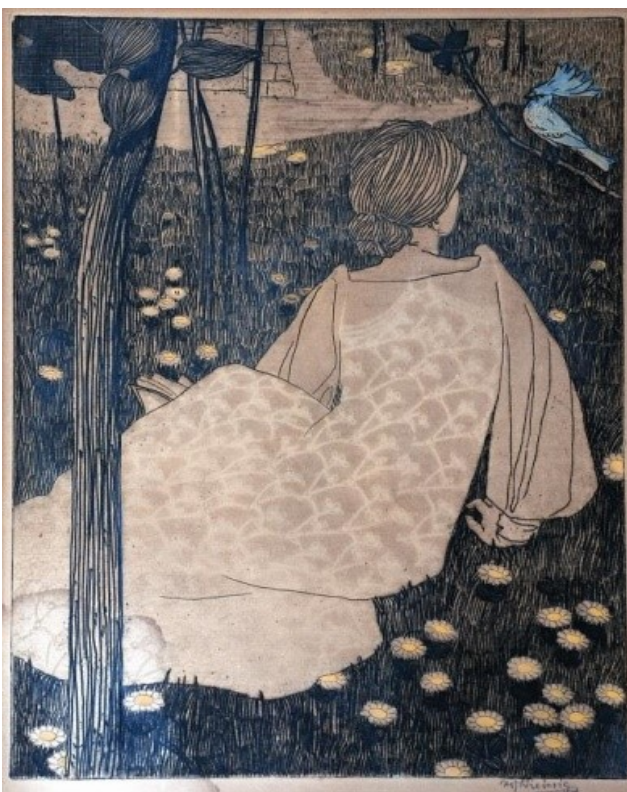
4. Vojtěch Preissig, Modráček, 1903, Východočeská galerie v Pardubicích