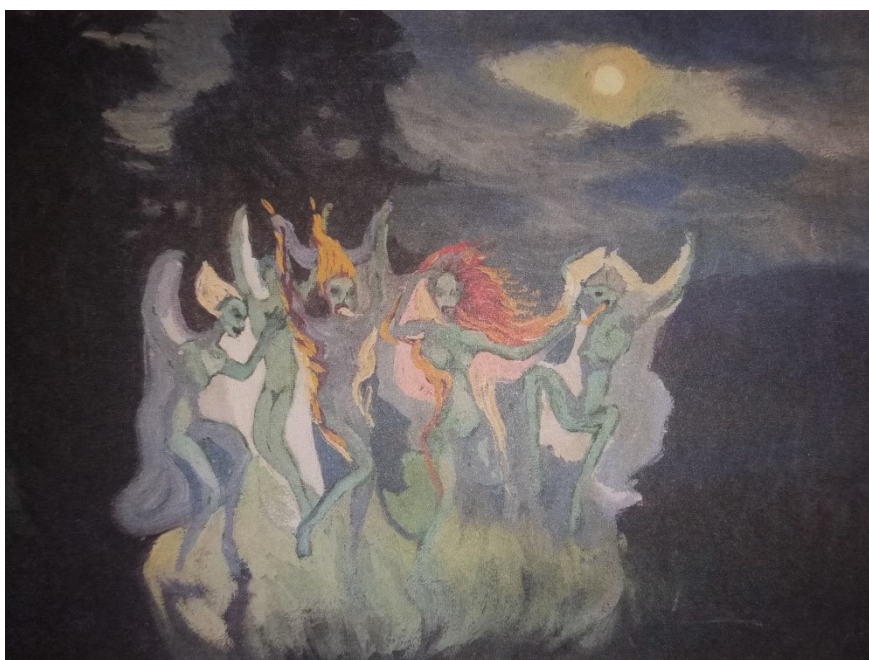
12. Josef Váchal, Divé ženy (lesní žínky) , 1912, US PNP Praha

knihách. Například vytvořil jakousi encyklopedii strašidel pod názvem V Ďáblově zahrádce aneb přírodopis strašidel (1924), která obsahuje neuvěřitelných 390 strašidel, k nimž přidává i latinská pojmenování. Váchal se věnoval nejen obrazům a knižní a grafické tvorbě, ale svou fantazii uplatňoval i na dřevě, ryl a řezal nebo dokonce i maloval po stěnách. V dřevorytu například ilustroval knihu Putování malého Elfa od Josefa Šimánka. Můžeme říct, že si vytvářel těmito procesy svůj magický kruh bezpečí, jakoby se schovával za svá díla, která měla duchovní a symbolistní významy. Stejně tak jako experimentoval s materiály a technikami výtvarné tvorby, tak i se svými psychickými stavy. Tvůrčí činnost prokázal ve stavech úzkosti či strachu. V jeho pracích můžeme vidět zakódované symboly, a ač je jeho tvorba zjevně symbolistní, vyjadřuje se Váchal dost expresivně. Což můžeme pozorovat například u výrazné barevnosti. Z jeho maleb můžeme zmínit např.: Divé ženy /lesní žínky/ (1912) nebo Hrady Korzárů (1915).