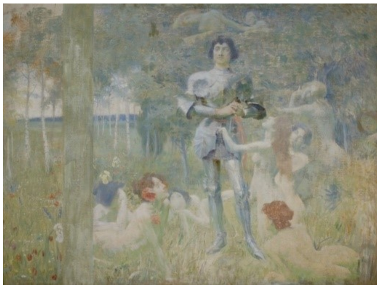
5. Jan Preisler, Dobrodružný rytíř, 1898, Západočeská galerie v Plzni

postavám. Za ním se zjevuje obrys hradu, rytíř jakoby naslouchal hlasu oné bílé víly, která se skrývá za šípovým trním. Původní cyklus je šestidílnou řadou, v níž vidíme zrod rytíře z chlapce a následující strastiplné motivy. Má to být rytíř hledající svůj ideál, který se na cestě potkává s falší a výsměchem. 23