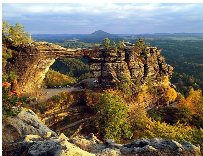
18. České Švýcarsko, Pravčická brána