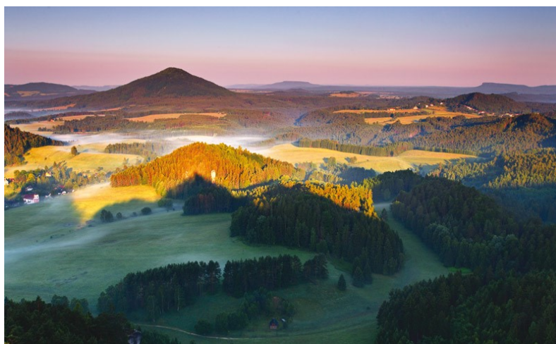
16. Krajina České Kanady