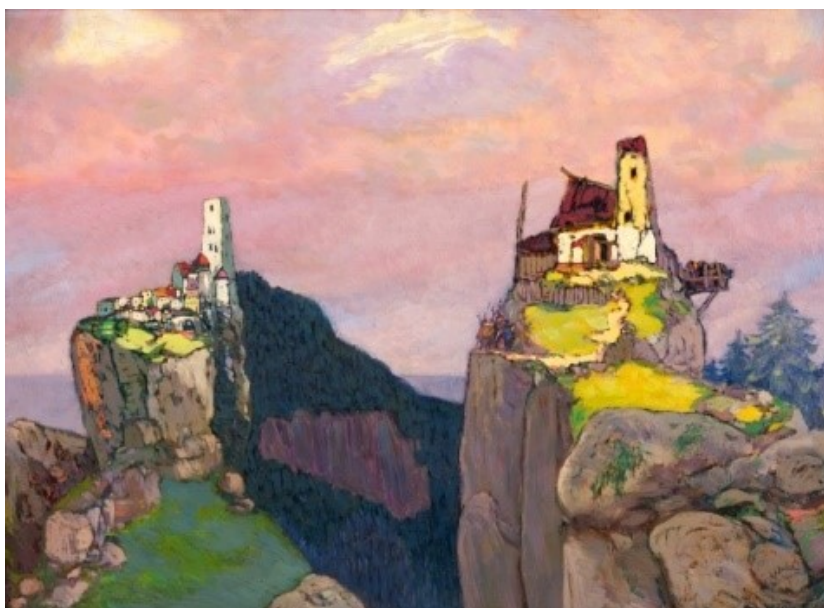
13. Josef Váchal, Hrady korzárů, 1915, Galerie hl. m. Prahy