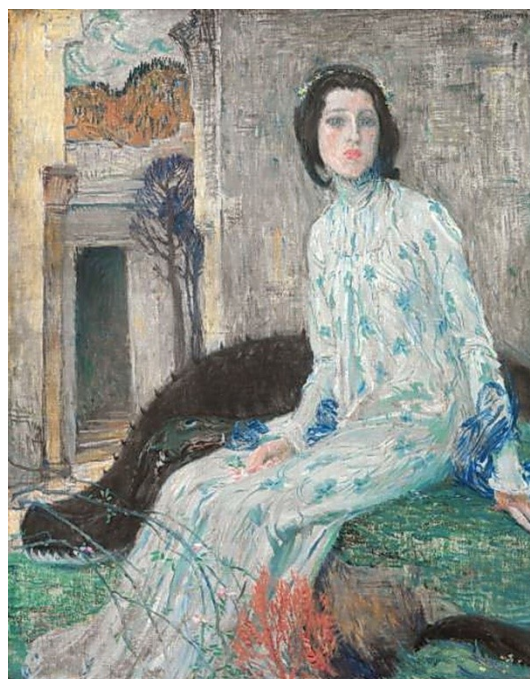
6. Jan Preisler, Pohádka /s rusovlasou princeznou/, 1904, Galerie výtvarného umění v Ostravě