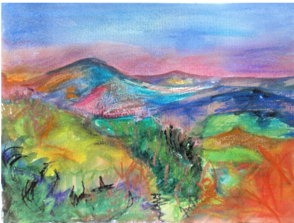
2. Bylo, nebylo, akvarel, pastel, papír A4