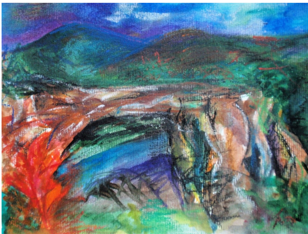
3. Brána do kouzelného světa, akvarel, pastel, papír A4