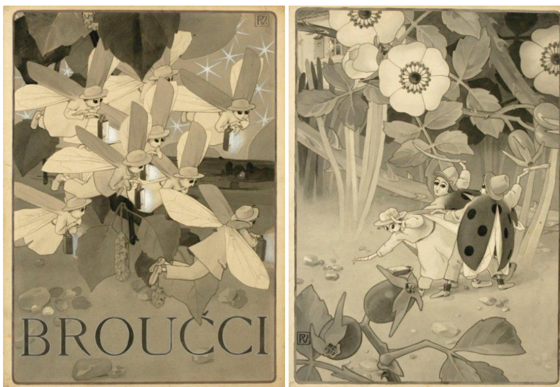
1., 2. Vojtěch Preissig, ilustrace ke Karafiátovým Broučkům, 1902

Ptáci jsou pro secesní umělce mystickými, symbolickými tvory. Charakteristickými zobrazovanými ptáky byli především labuť a páv. Vábili především svou exkluzivností a vznešeností, která se hodila pro secesní dekorativitu. Jejich barvy např. modrá a zelená barva pávů vítězily jakožto oblíbené barvy secese. Proto není divu, že i V. Preissig použil náměty z ptačí říše ve své volné tvorbě, a to především v díle Modráček z roku 1903, kde uplatňuje dobově oblíbený motiv sedící dívky v krajině, avšak laděné v pohádkovém pojetí. Dále toto téma můžeme vidět v barevném leptu Sedm havranů z roku 1903. Jakousi pohádkovou snovost mají, ale i jeho díla zaměřující se na krajinu, zmiňme alespoň barevný lept s pohledem na zasněžené Hradčany z roku 1907. Toto panoráma způsobuje poetickou náladu, působí na člověka zvláště, kouzelně. Tomáš Vlček k tomuto leptu uvádí: „ Praha zde opět vystupuje jako magické místo představitosti a snu. Autor jej rozvíjí s intimní důvěrností plnou touhy po nalezení smyslu tohoto tajemného, v imaginaci pohádky se zjevujícího světa. “ 22