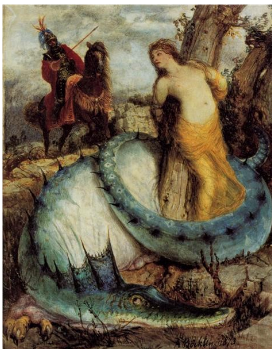
8. Arnold Böcklin, Ruggiero a Angelika, 1873, Nationalgalerie, Berlín

Zjevně díky těmto inspiracím se dostává obraz Pohádka do souvislosti s jeho předcházejícím obrazem Jaro , z kterého navázal představou dívky, vedle které se teď navíc objevuje postava draka, který by měl chránit zobrazenou dívku jako strážce. Není to symbol ohrožení, ale spíše zamilovanosti, jakoby drak obdivoval dívku, která se nachází ve stavu melancholie. Děvče je namalováno v zelených tyrkysových šatech, které obsahují větší škálu odstínů. Oproti tomu jsou v působení červené zemité odstíny. Zobrazená černošlá dívka má šaty bílé s květinovým modrozeleným vzorkem. K tomu se vyjímá korálová červeň ve větvích, které jí rostou u nohou. I vztah komplementárních barev v obraze přináší nádech nadpřirozena a melancholie. Kromě draka se objevuje i tajemný vchod do zříceniny zámku a holý strom, který stojí hned vedle. Atributy jsou záměrně tmavé, černé. Znázornění architektury s antickými prvky může být inspirováno Preislerovou cestou do Itálie, kterou podnikl v roce 1902. 25 Wittlich uvádí, že souvislost těchto dvou obrazů není náhodná. „ Zase se tu objevuje