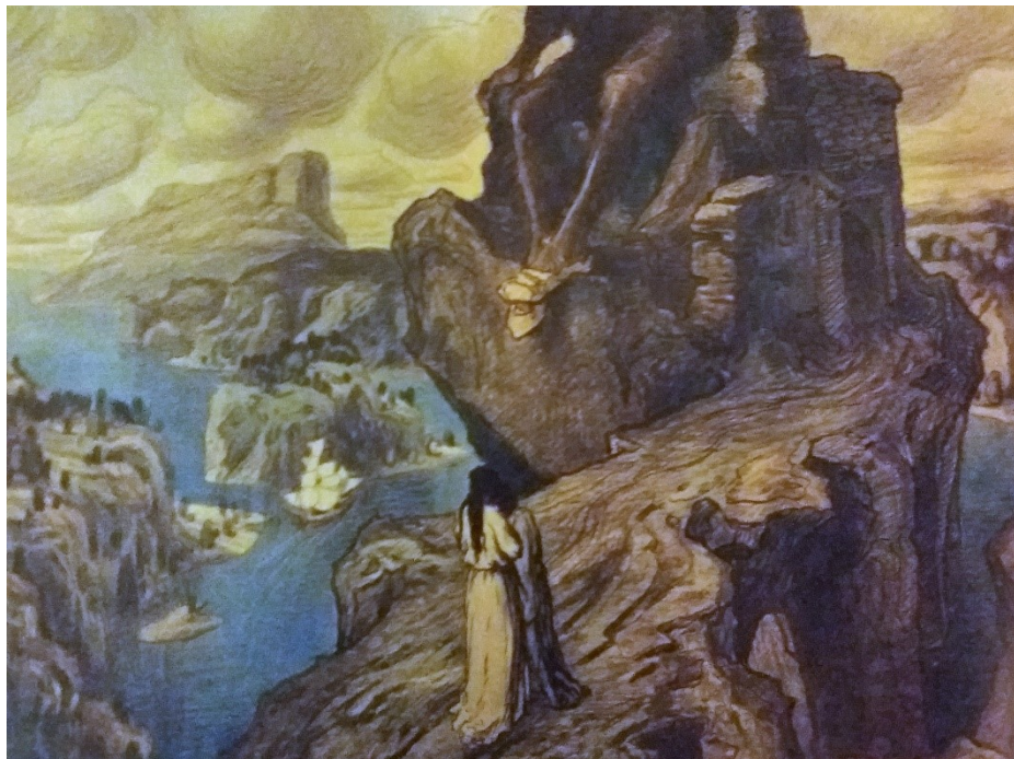
10. Jaroslav Panuška, Pohádka o obrovi, 1903, Východočeská galerie v Pardubicích