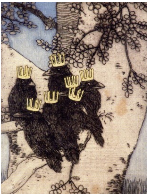
3. Vojtěch Preissig, Sedm havranů, 1903, Sbíрка Patrika Šimona