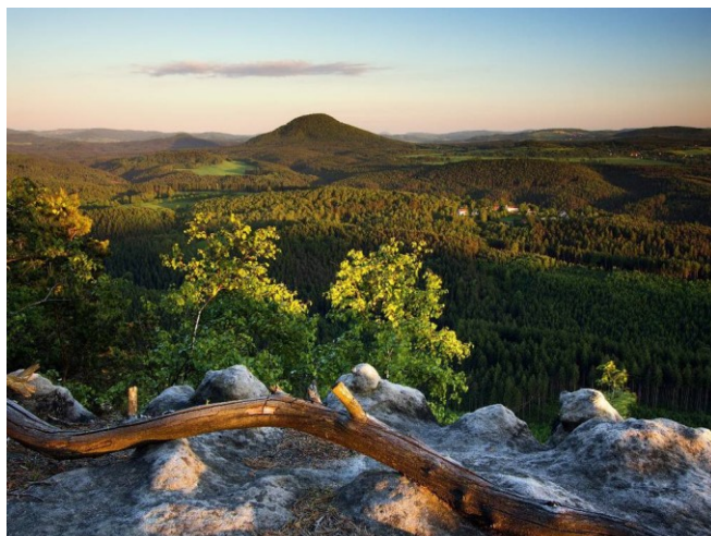
19. České Švýcarsko, Růžovský vrch