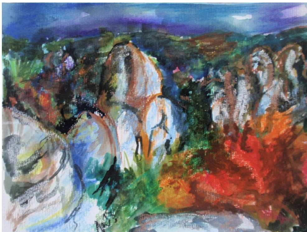
1. Za sedmero horami, akvarel, pastel, papír A4