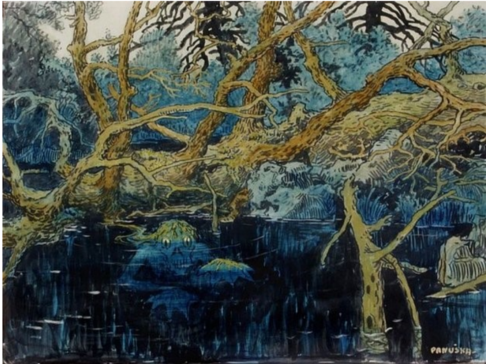
9. Jaroslav Panuška, Vodník, 1902, Oblastní galerie Vysočiny v Jihlavě