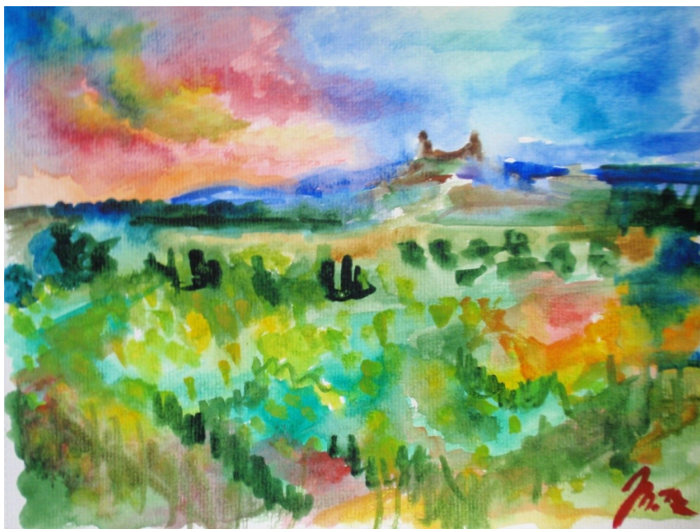
4. Pohádkové Trosky, akvarel, papír A4