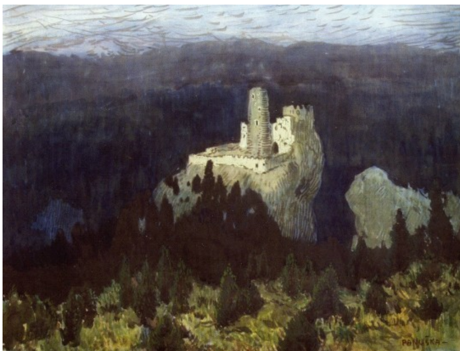
11. Jaroslav Panuška, Tajemný hrad, 1906, Oblastní galerie Vysočiny v Jihlavě