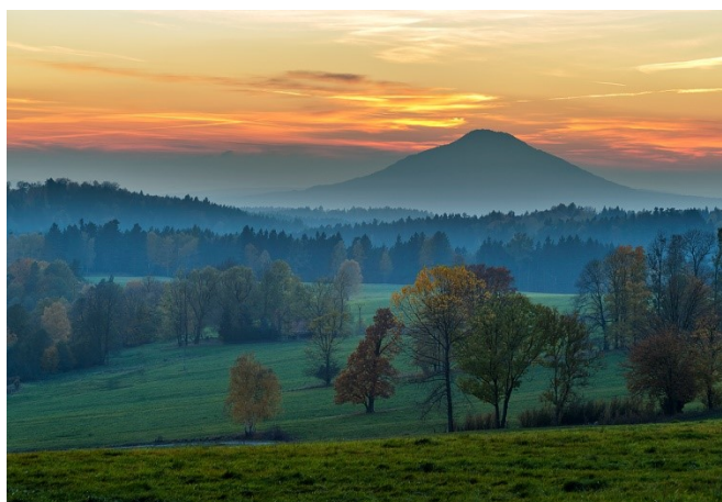
17. Krajina Českého Švýcarska

České Švýcarsko je od roku 2000 vyhlášeno jako národní park. Je to především díky ochraně pískovcových útvarů, kterými je známá i tato krajina. Hojně se zde vyskytují různé skalní brány, bludiště, věže a stěny. Mezi symbol tohoto parku patří Pravčická brána, která je rovněž největší pískovcovou bránou v Evropě. Stejně tak je krajina Českého Švýcarska charakteristická rovněž svými lesními komplexy, které dosahují až 97% území.