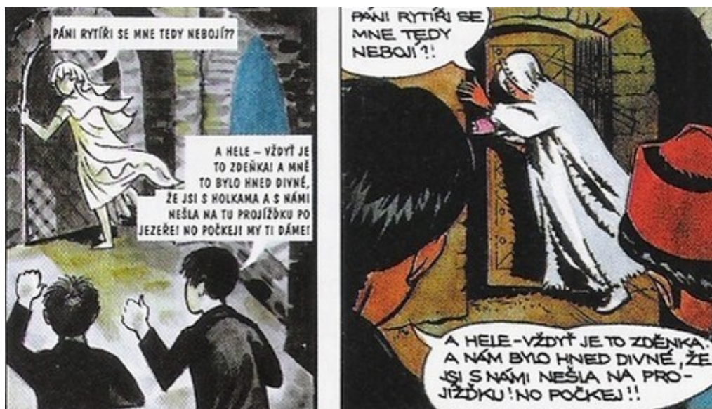
Obrazová příloha č. 4 – Vlevo Kulišáci a bílá paní (1964), vpravo Rychlé šípy běží za hradním strašidlem (1971). Foglar řadu příběhů Kulišáků , které tvořil pro ABC v době, kdy nemohl psát své Rychlé šípy , později použil v Rychlých šípech .

Zdroj: Jedno číslo MATEŘIDOUŠKY – 11. ročník – 1954-55. Staré dětské časopisy [online]. [cit. 2017-04-17]. Dostupné z: https://goo.gl/hWcLPN