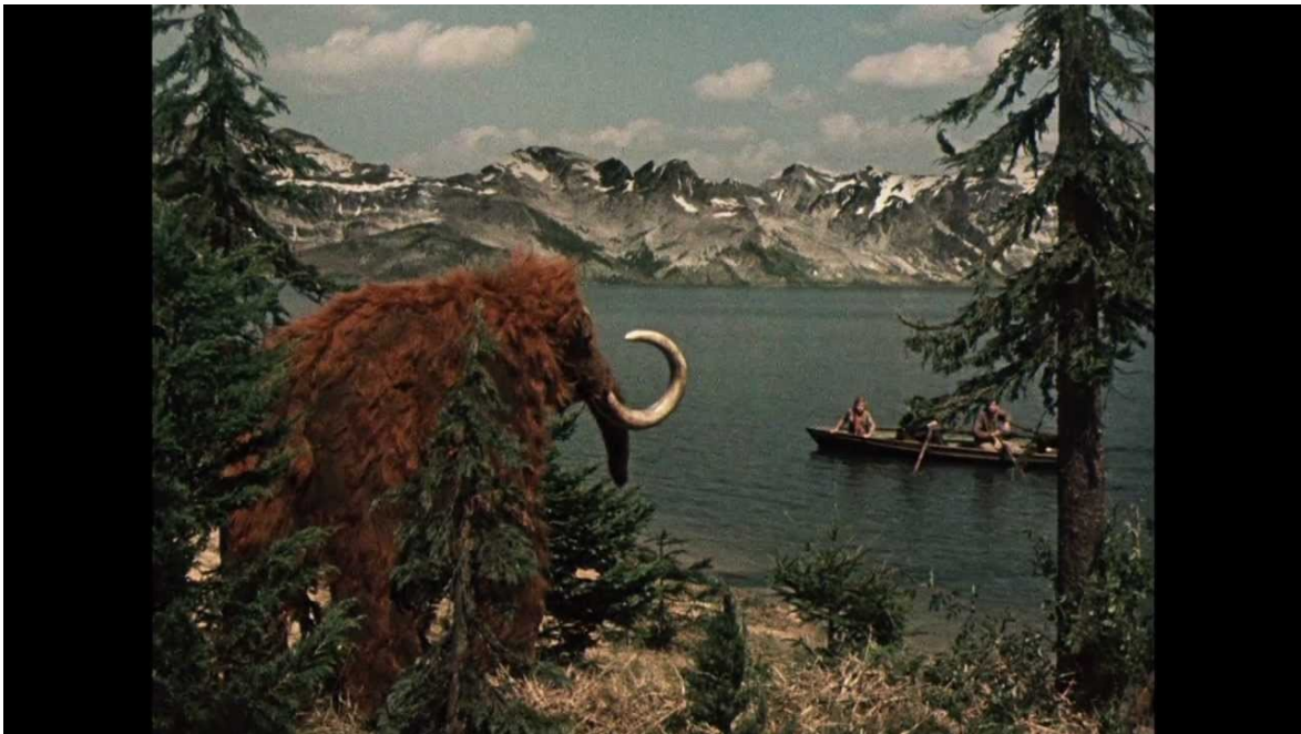
Obrazová příloha č. 7 – Cesta do pravěku (1955)