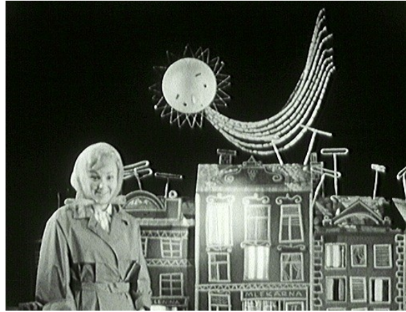
Obrazová příloha č. 6 – Kluk a kometa (1964). První hraný díl Večerníčku .

Zdroj: Ve věku 83 let zemřela Olga Čuříková, moderátorka slavné Vlaštovky! . Frekvence 1 [online]. [cit. 2017-04-17]. Dostupné z: https://goo.gl/RF9DiU