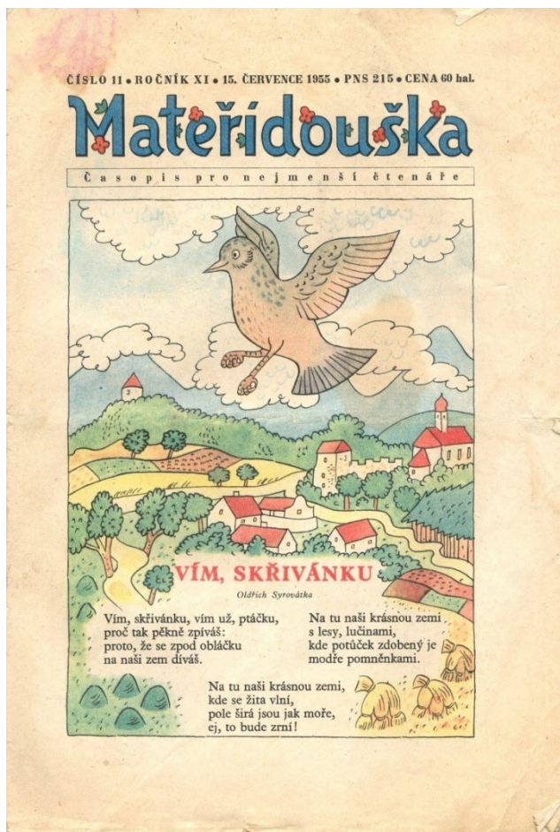
Obrazová příloha č. 3 – Titulní strana časopisu Mateřidouška z roku 1955.