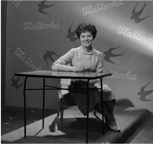
Obrazová příloha č. 5 – Olga Čuříková ve studiu televizního pořadu Vlaštovka