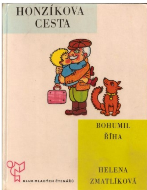
Obrazová příloha č. 2 – Bohumil Říha: Honzíkova cesta , vydání z r. 1964. Obrázek na obálce se dodnes prakticky nezměnil.