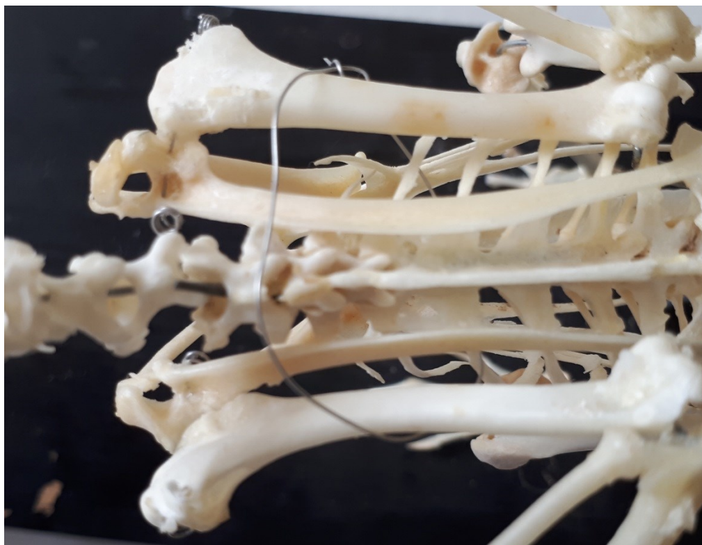
Obrázek 28: krční obratle - notarium