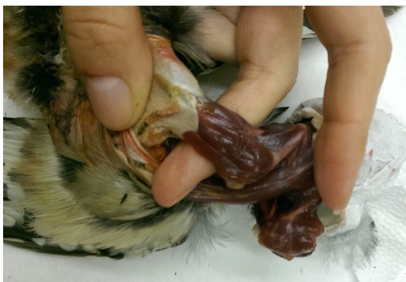
Obrázek 14: místo pro oddělení křídla u strakapouda velkého