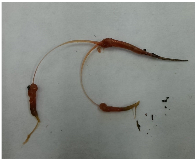
Obrázek 5: jazyk s jazylkou strakapouda velkého