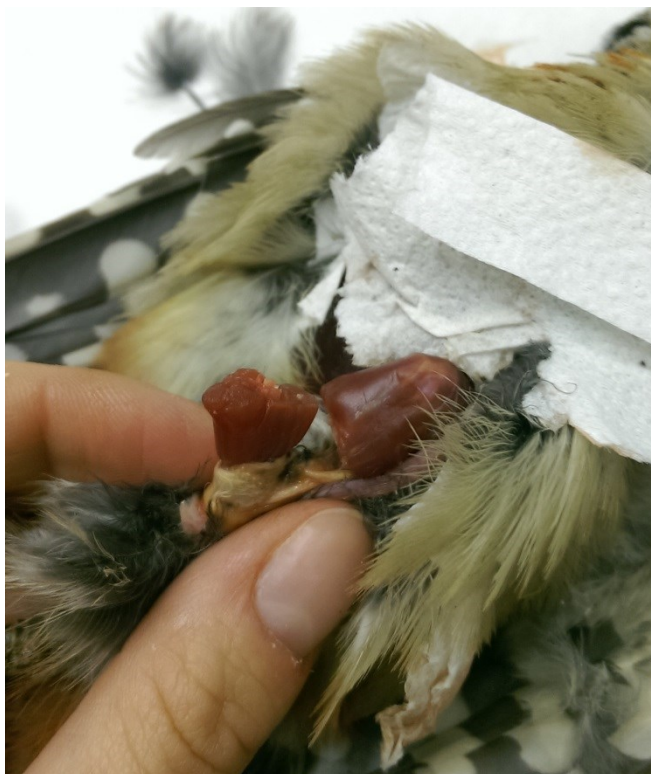
Obrázek 9: místo pro oddělení dolní končetiny u strakapouda velkého