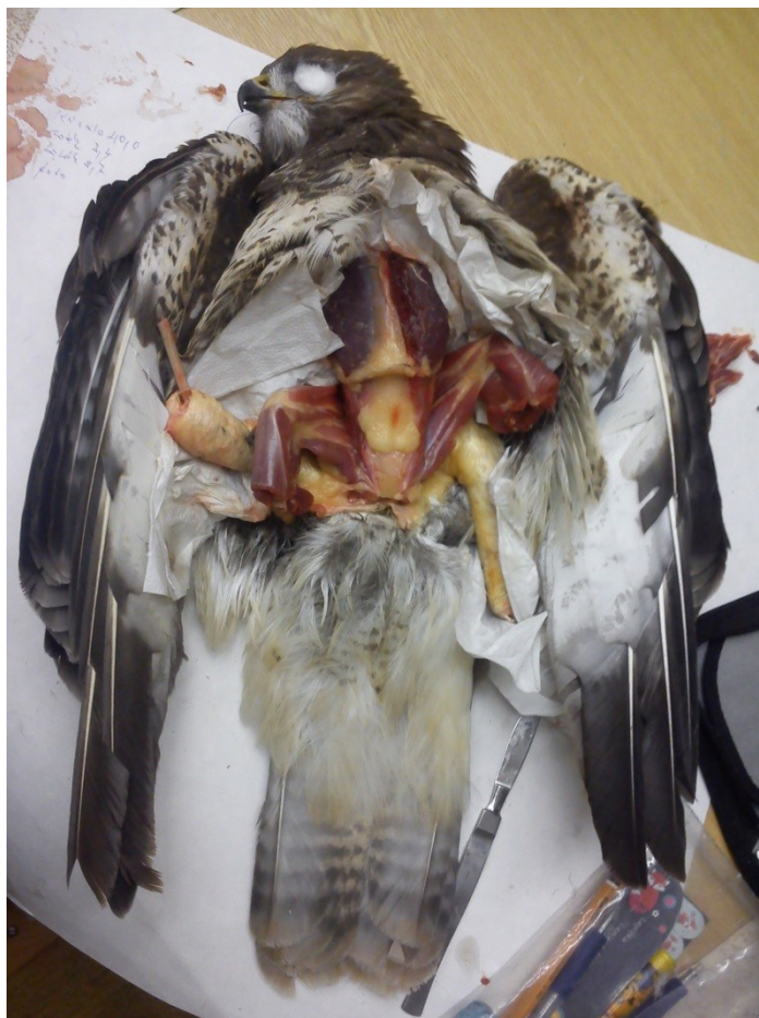
Obrázek 13: průběh stahování u káně lesní