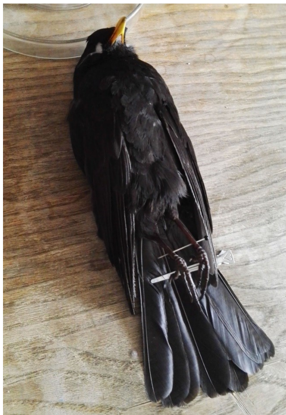
Obrázek 27: zašitý kos černý