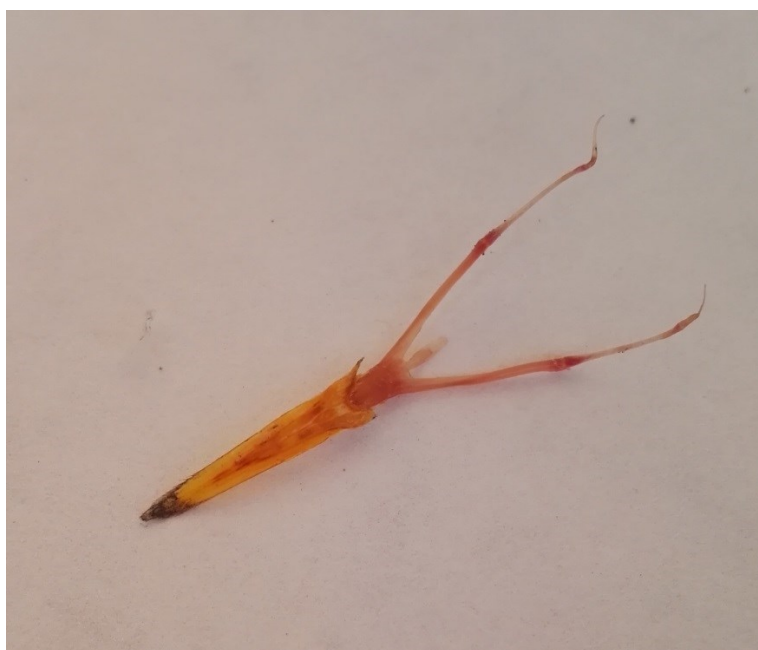
Obrázek 6: jazyk s jazylkou kosa černého