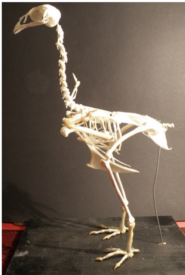
Obrázek 36: orebice rudá