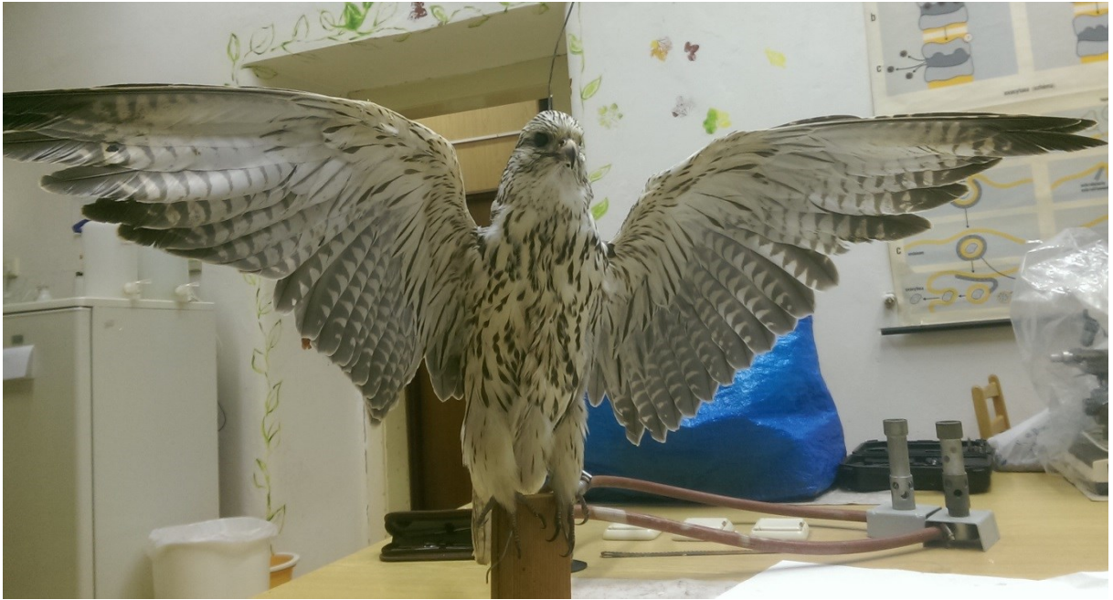
Obrázek 31: raroh velký