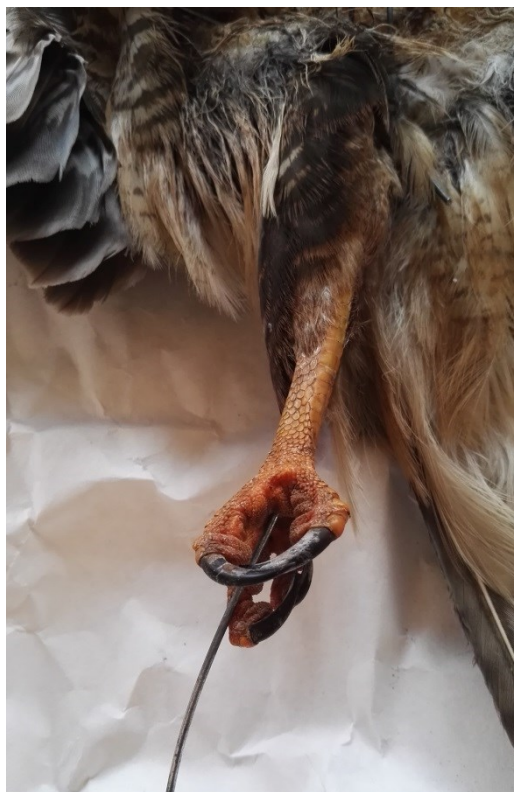
Obrázek 25: drát pro zpevnění dolní končetiny u káně lesní