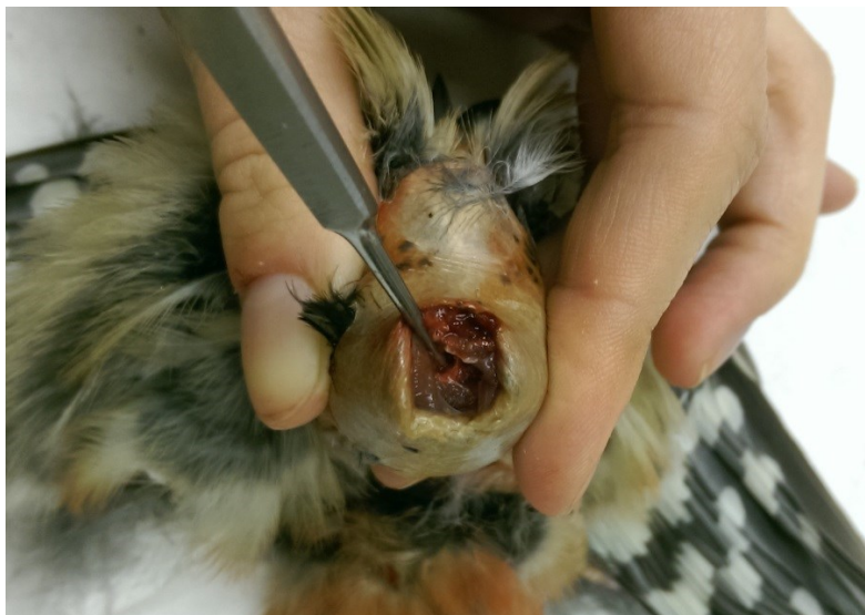
Obrázek 20: otvor pro čištění mozkovny u strakapouda velkého