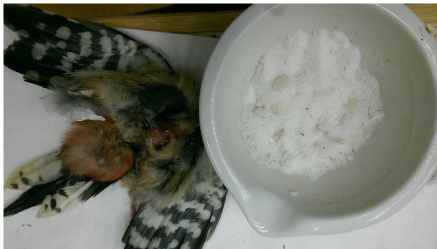
Obrázek 21: vysypání mozkovny kamencem u strakapouda velkého