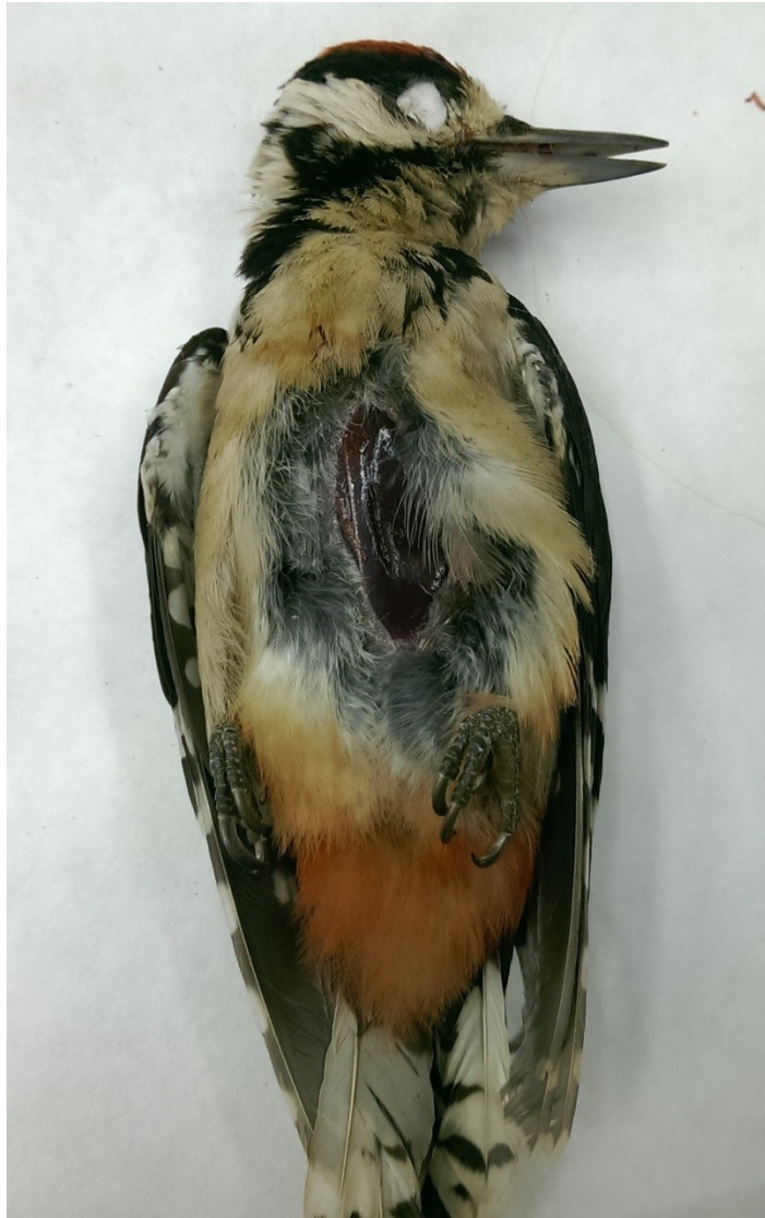
Obrázek 7: počáteční řez u strakapouda velkého