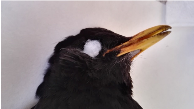
Obrázek 3: očníce vycpaná vatou u kosa černého