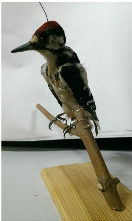
Obrázek 38: strakapoud velký