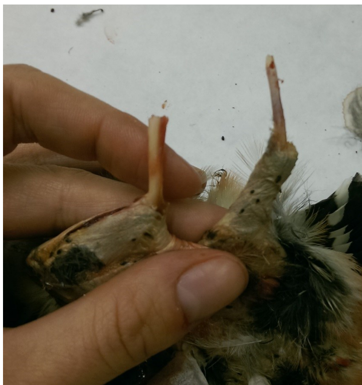
Obrázek 16: očištěná dolní končetina a křídlo u strakapouda velkého