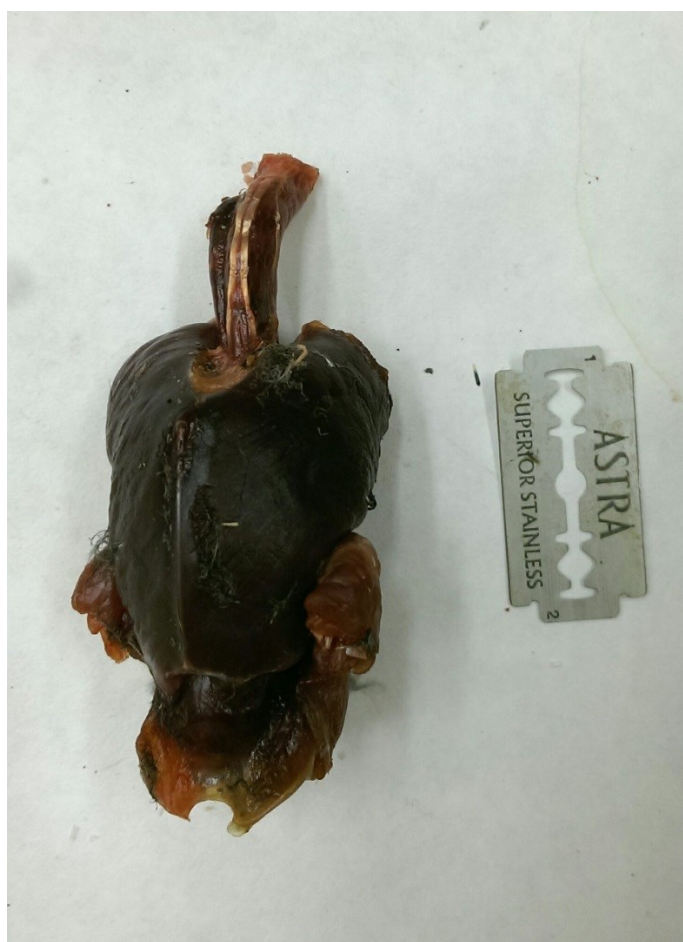
Obrázek 18: vyjmuté tělo strakapouda velkého