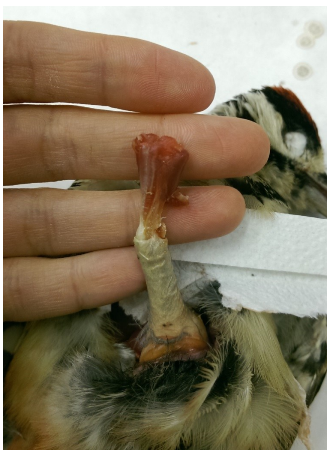
Obrázek 10: zbývající svalovina k odstranění u strakapouda velkého