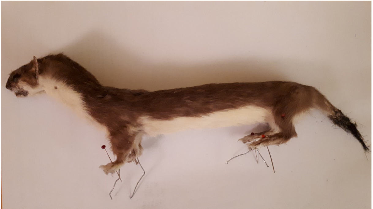
Obrázek 39: lasice hranostaj