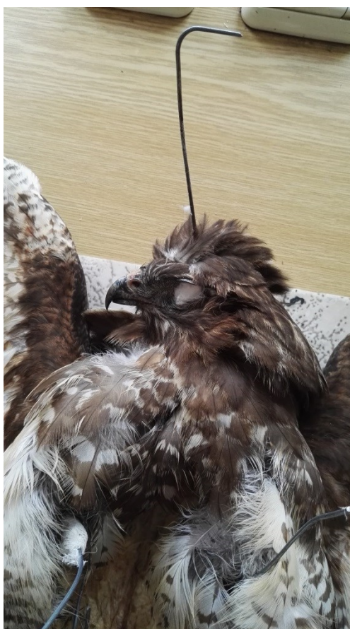
Obrázek 24: drát pro zpevnění hlavy u káně lesní