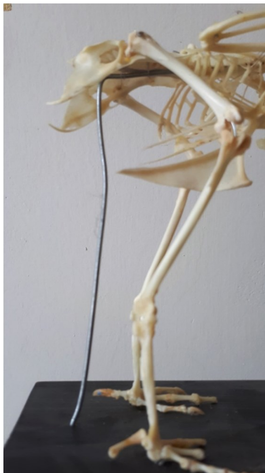
Obrázek 30: podepření pánve drátem