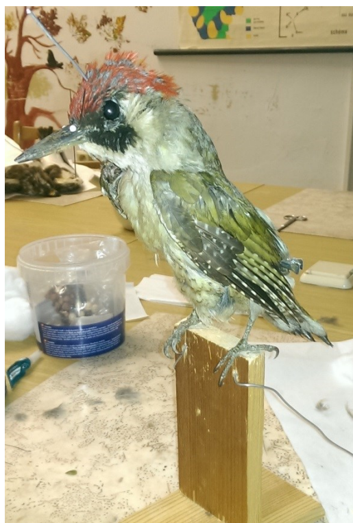
Obrázek 37: žluna zelená