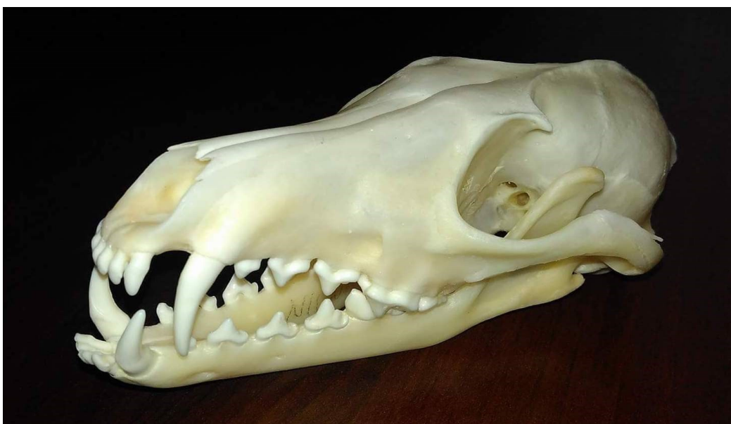
Obrázek 42: liška obecná