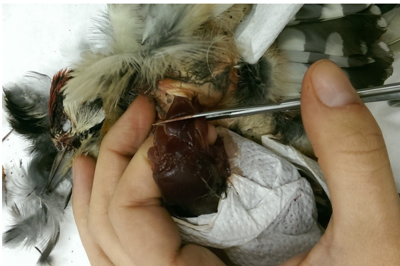
Obrázek 15: přestřížení křídla u strakapouda velkého