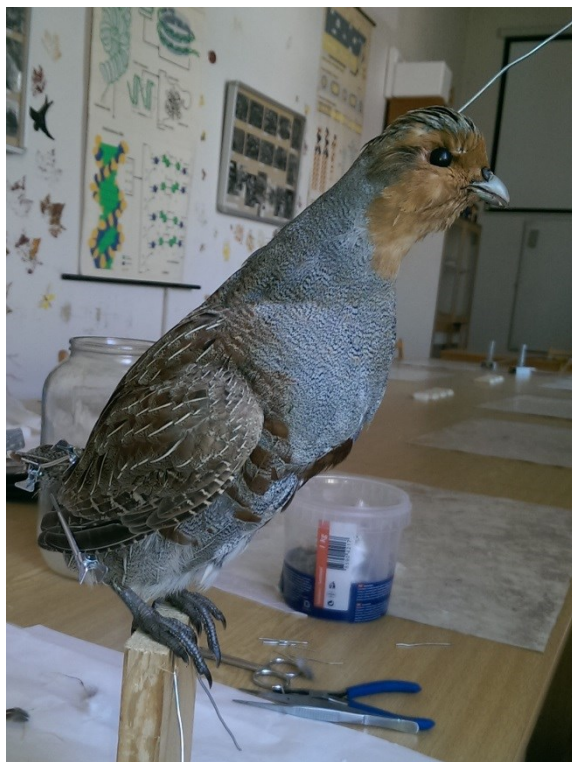
Obrázek 33: koroptev polní