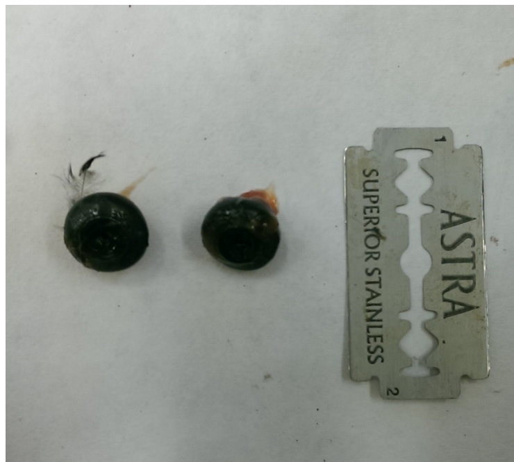
Obrázek 1: oči strakapouda velkého