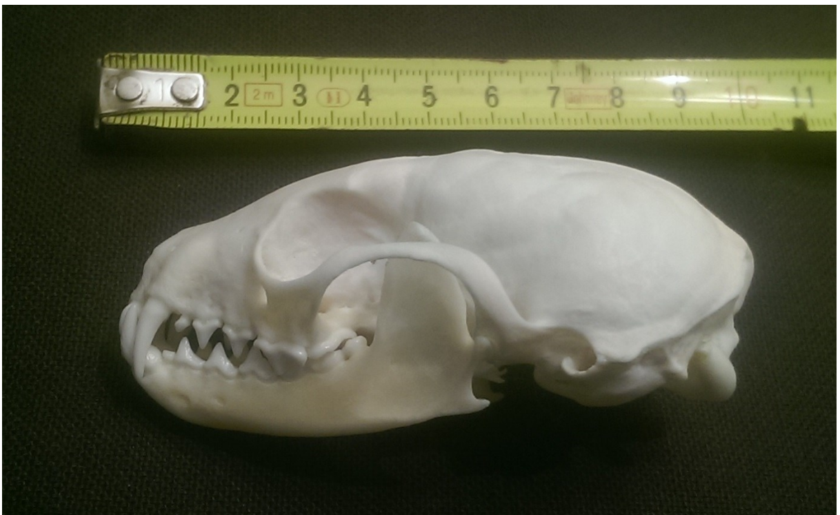
Obrázek 40: kuna lesní