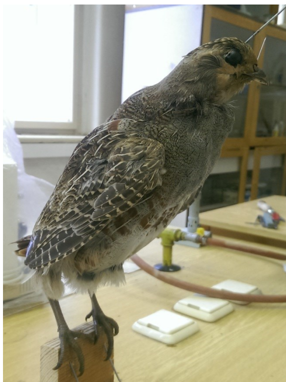
Obrázek 34: koroptev polní