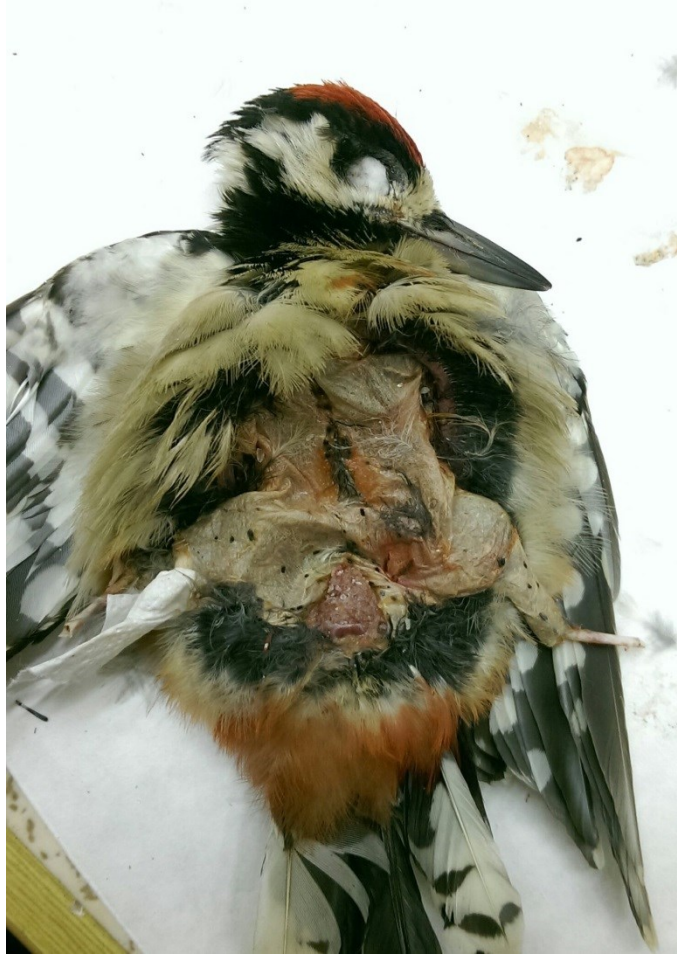
Obrázek 19: stažená kůže se zbytky kostí u strakapouda velkého