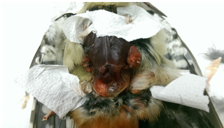
Obrázek 11: místo pro oddělení ocasu u strakapouda velkého