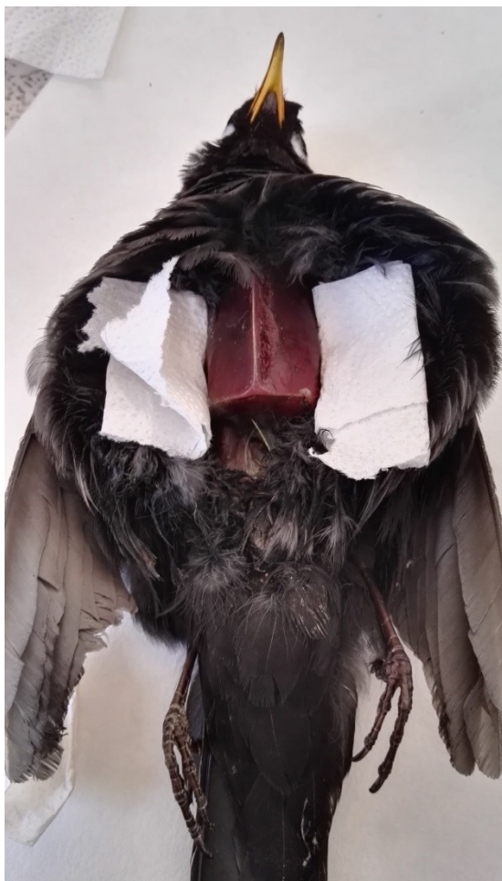
Obrázek 8: pokročilý řez u kosa černého