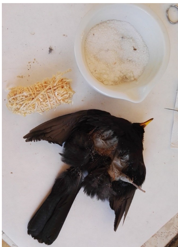
Obrázek 22: příprava těla z dřevité vaty u kosa černého