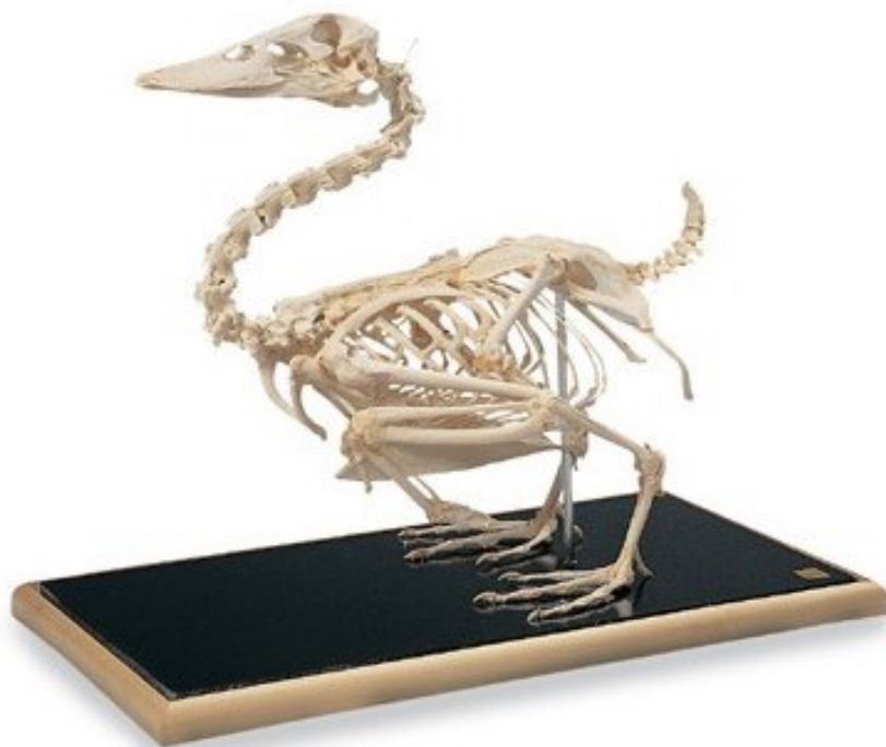
Obrázek 35: kachna divoká