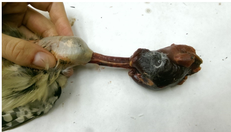
Obrázek 17: stahování kůže v oblasti krku u strakapouda velkého