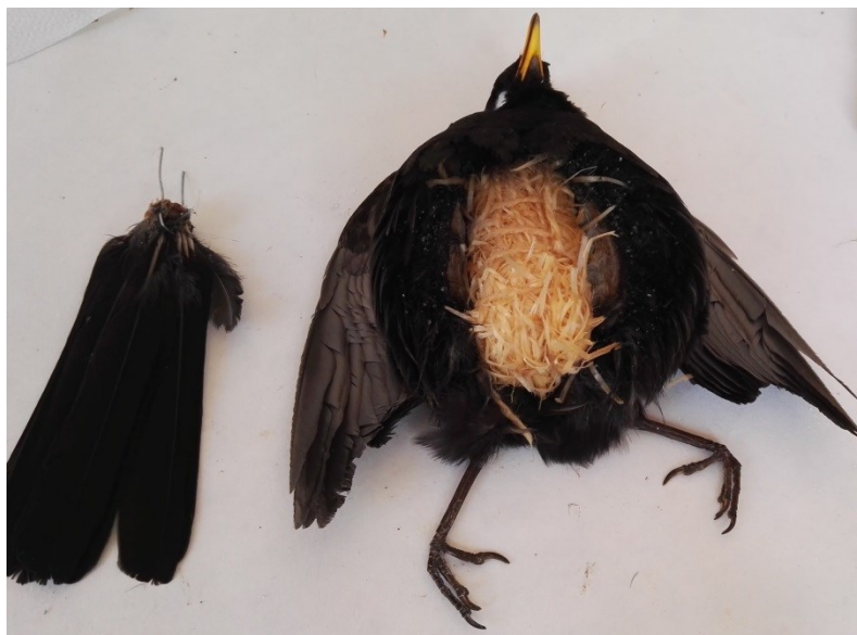
Obrázek 23: vyměření správné velikosti těla z dřevité vaty u kosa černého