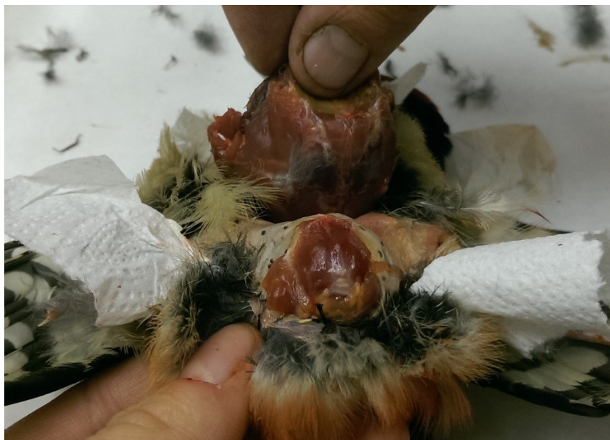
Obrázek 12: oddělení ocasu od těla u strakapouda velkého