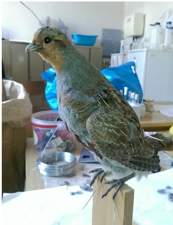
Obrázek 32: koroptev polní