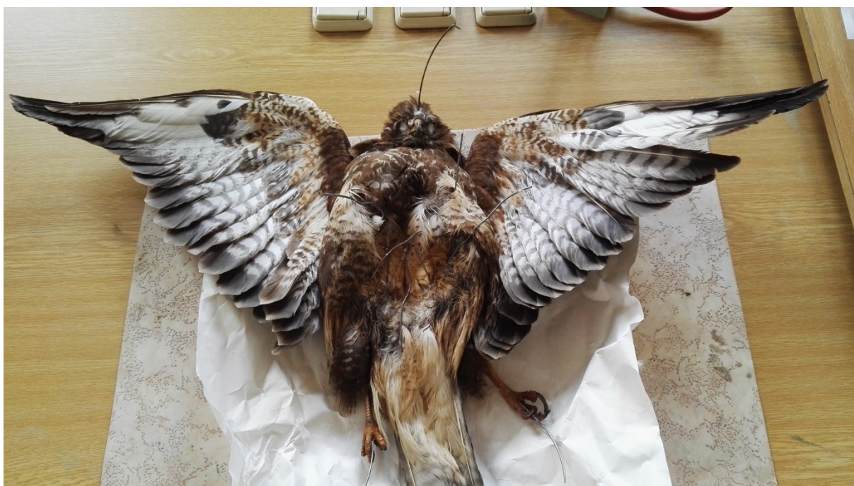
Obrázek 26: všechny dráty protaženy u káně lesní