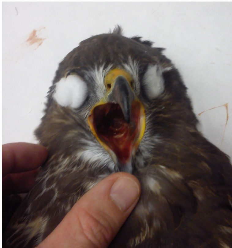
Obrázek 4: rozevření dutiny ústní u káně lesní