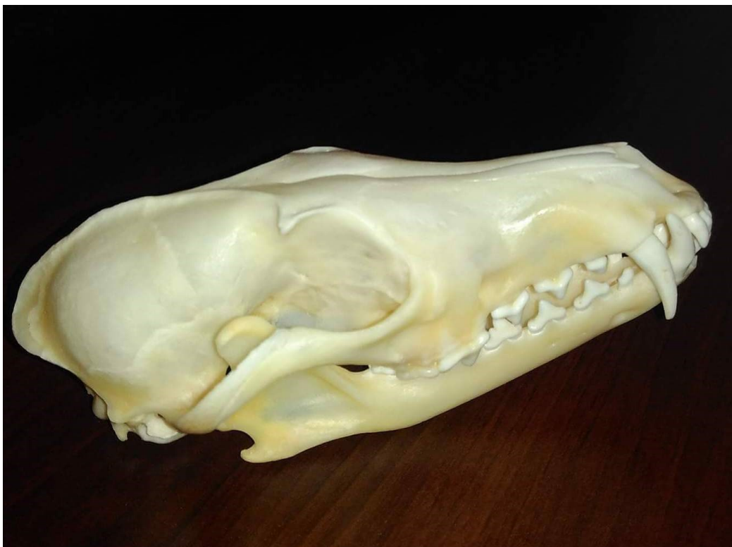
Obrázek 41: liška obecná