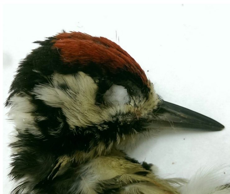
Obrázek 2: očnice vycpaná vatou u strakapouda velkého