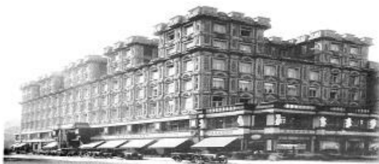
Historický snímek paláce Adria, kde ÚLK do roku 1996 působil